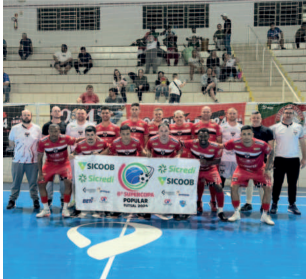
Os Guri da 24 - Finalista Força Livre Série Ouro