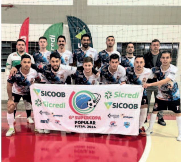
NA Limitados - Finalista Força Livre Série Ouro