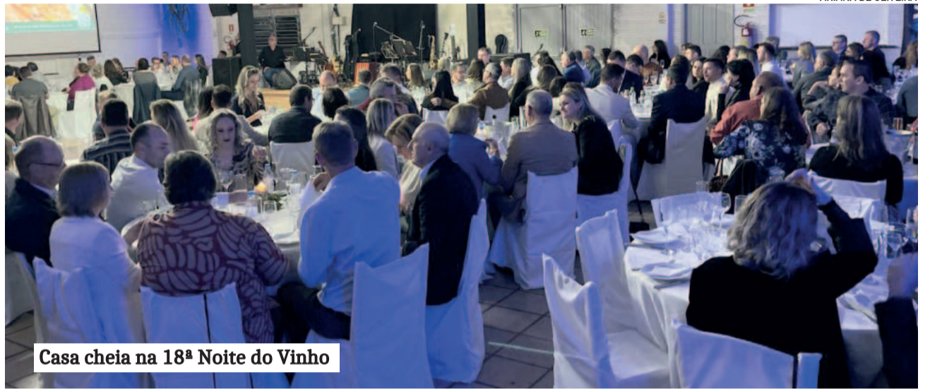
Casa cheia na 18ª Noite do Vinho