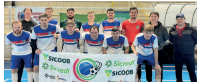
Poço das Antas - Finalista Força Livre Série Prata