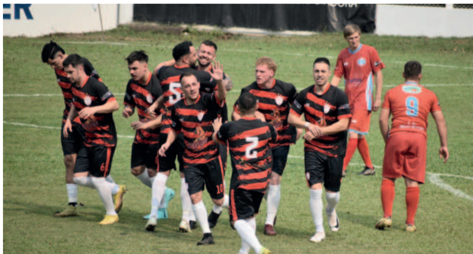
Estudiantes comemorou a vitória nos Aspirantes