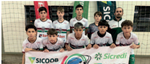
Juventus - Finalista Sub-13

Ainda, no dia 6 de setembro, o campeão Força Livre Série Ouro volta à quadra do Gigante Azul para enfrentar a seleção multicampeã de Barão pela Copa dos Campeões do Futsal 2024.