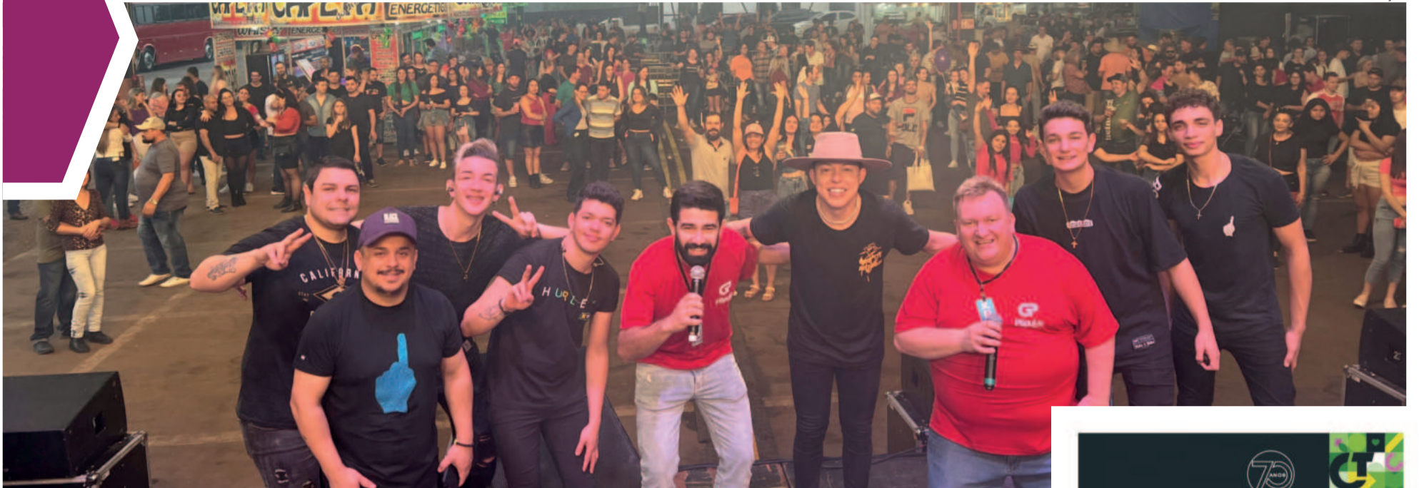
Show da Família também celebrou os 35 anos do Grupo Popular