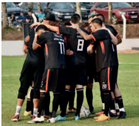
Mesmo com um jogador a menos, atual campeão seguiu a vitória diante de seu torcedor