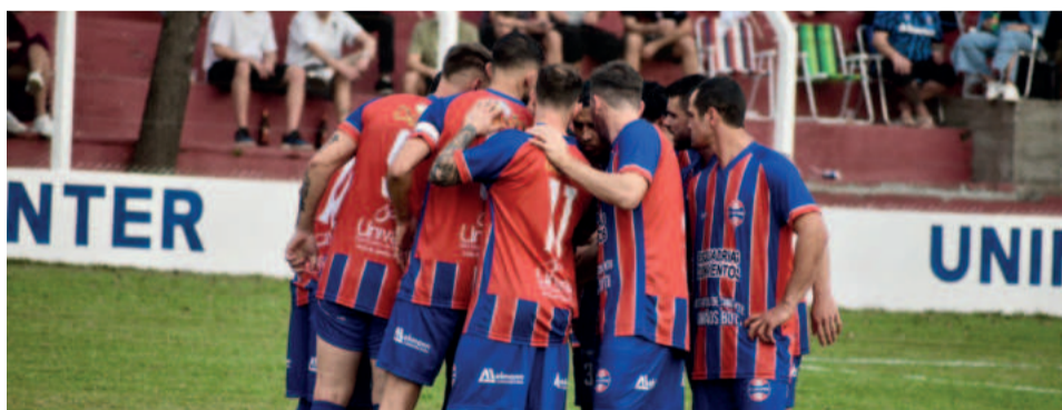
Nova Berlim perdeu na estreia