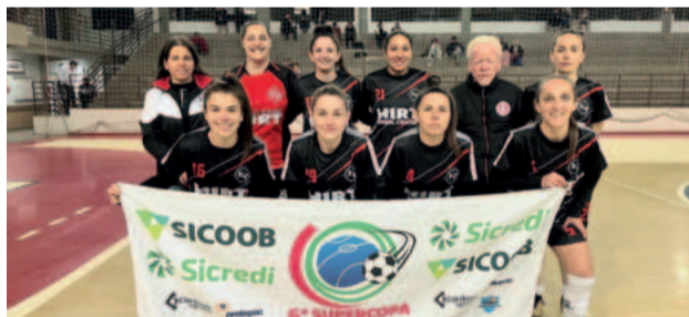
Kipoder - Finalista Feminino