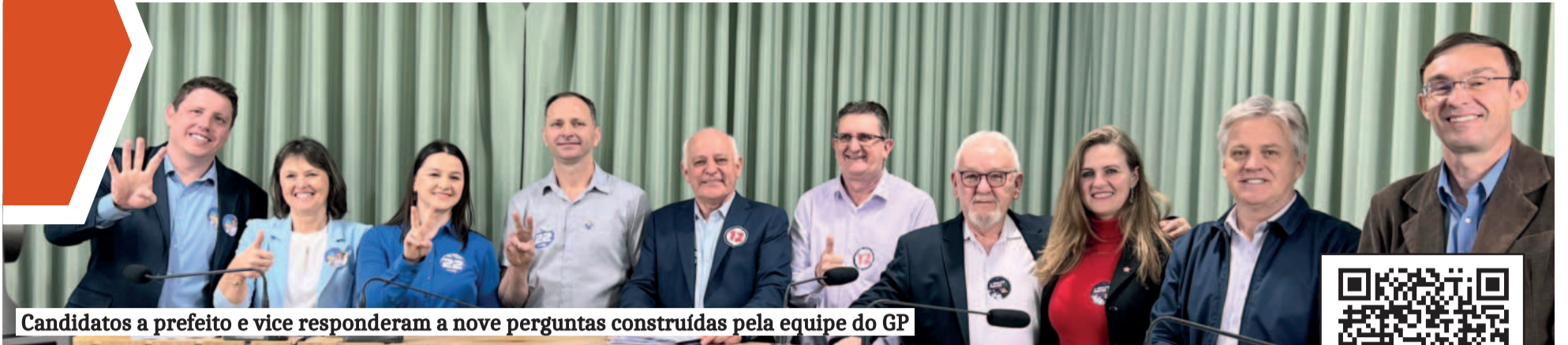
Candidatos a prefeito e vice responderam a nove perguntas construídas pela equipe do GP