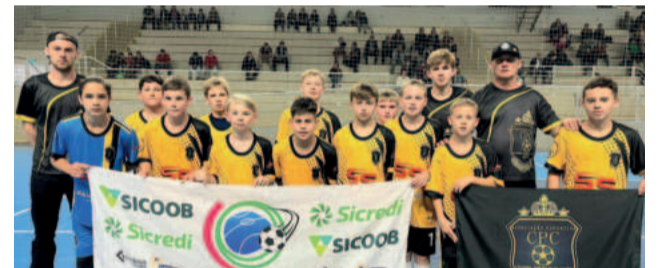
Assoc. Esport. CPC - Finalista Sub-13