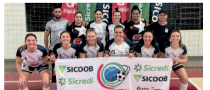
Malaguetas - Finalista Feminino