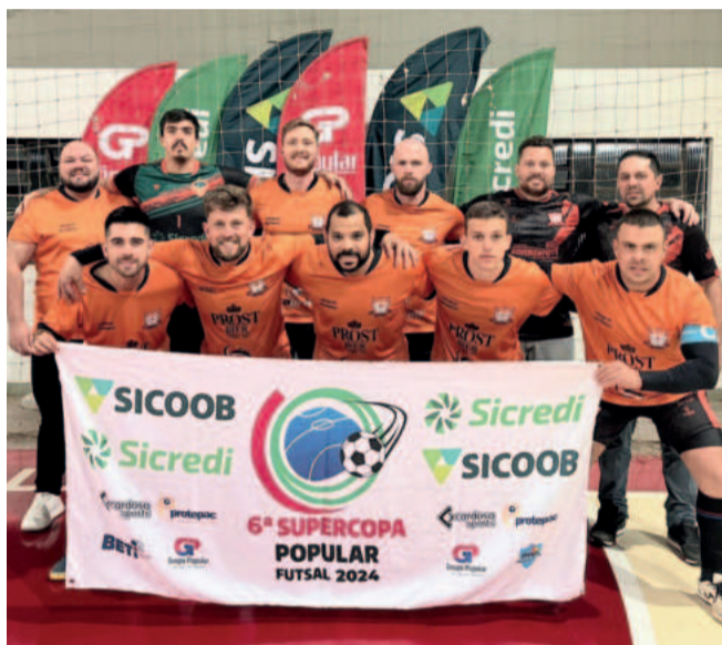
Laranja Mecânica - Classificado para a semifinal Série Ouro