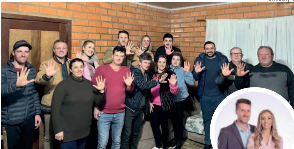
Convenções do PSD e PSDB foram realizadas em 21 de julho