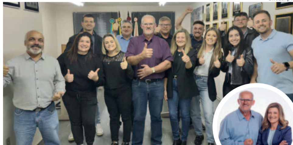
Convenções do MDB e PP foram realizadas no sábado passado (27/7)