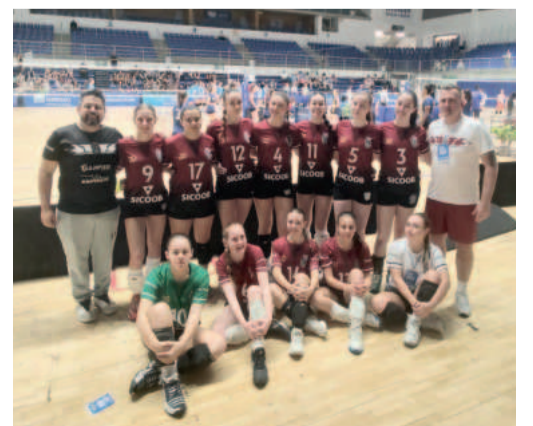
Elenco estreou uniforme novo ontem

Ontem (2/8), a Juventus enfrentou Flamengo, Olympico e Minas "A" pela primeira fase da competição. Hoje, a fórmula de disputa prevê a reclassificação para novas duas chaves com quatro equipes cada. As finais acontecem amanhã (4/8).