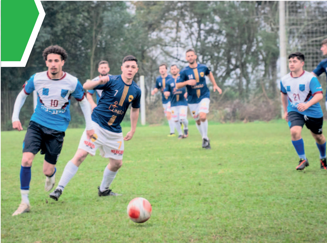
Estrela inicia fase de quartas de final com jogos na Toca do Leão