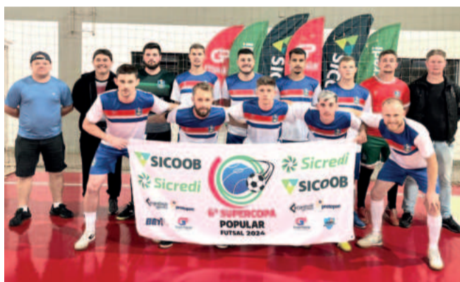
Poço das Antas - Classificado para a semifinal da Série Prata