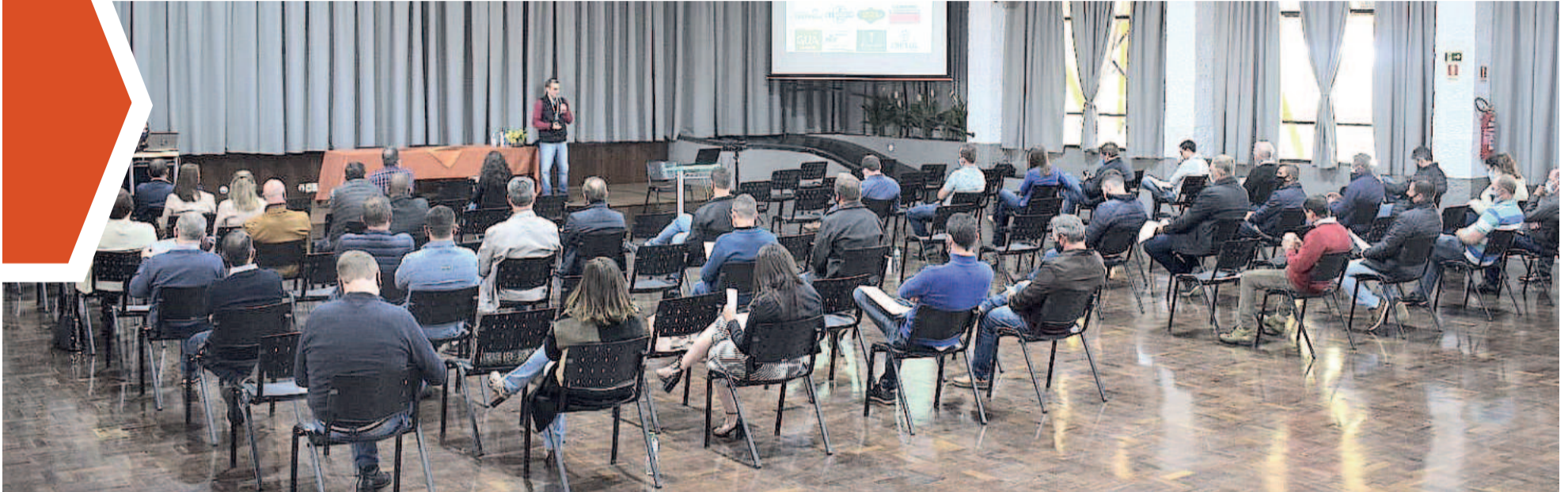
Em 2020, a reunião técnica foi no auditório do CT, com as regras sanitárias da época de pandemia