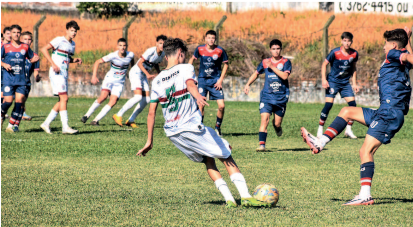
Equipe venceu o Gramadense pelo placar de 3 a 0 na quarta-feira (31/7)