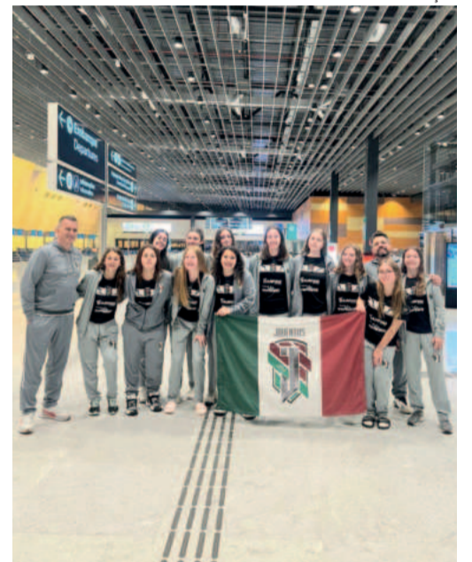
Delegação embarcou na quinta-feira (1º/8) em Florianópolis