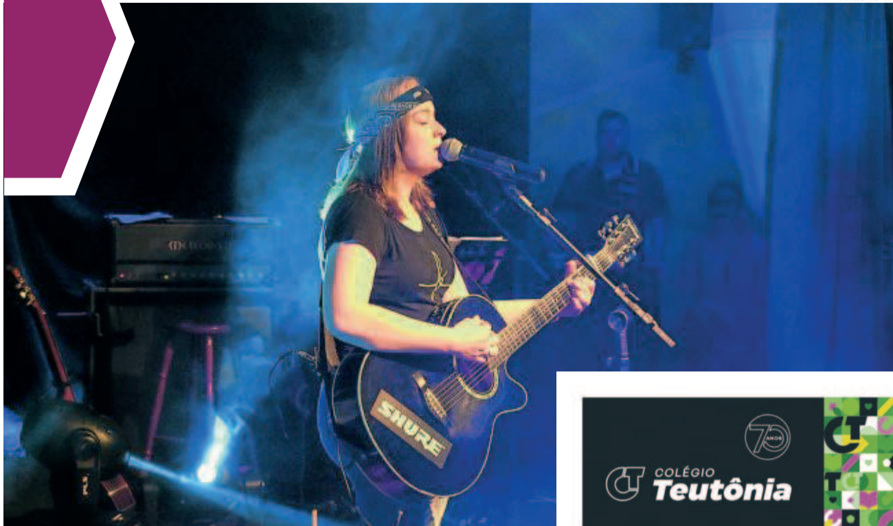
Categorias Juvenil e Livre continuam os ensaios nesta semana e projetam os próximos no palco