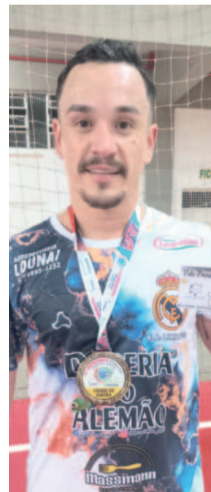
Tales, do N.A. Limitados