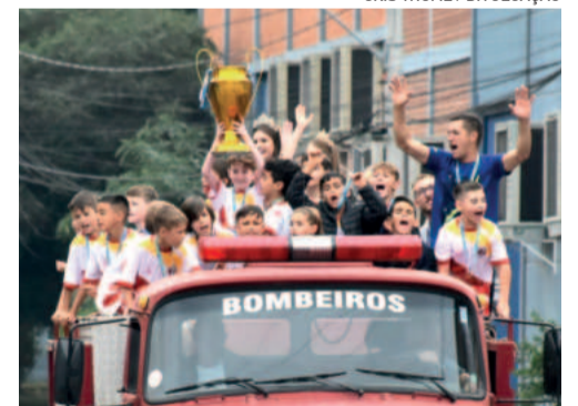
Escolinha de Imigrante ficou campeã do torneio no ano passado