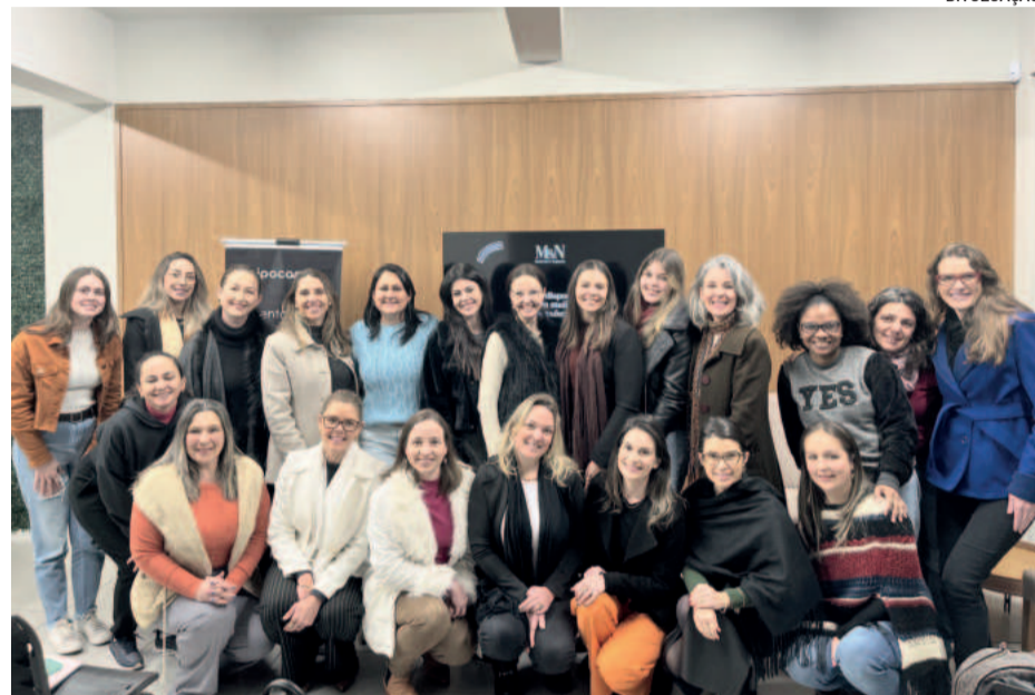
Apoiadoras, talkers , expositoras e facilitadoras estiveram reunidas em julho para planejar o evento

SOMOS A MELHOR GRADUAÇÃO DO BRASIL #SOMOSUNIVATES