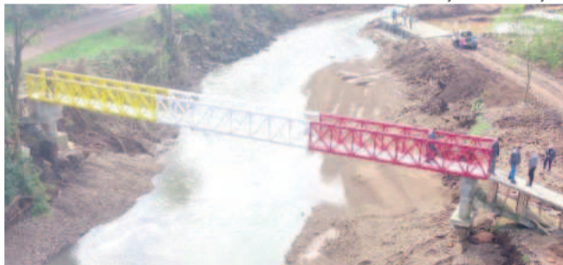
Passadeira fica a poucos metros da nova passarela, inaugurada dia 30