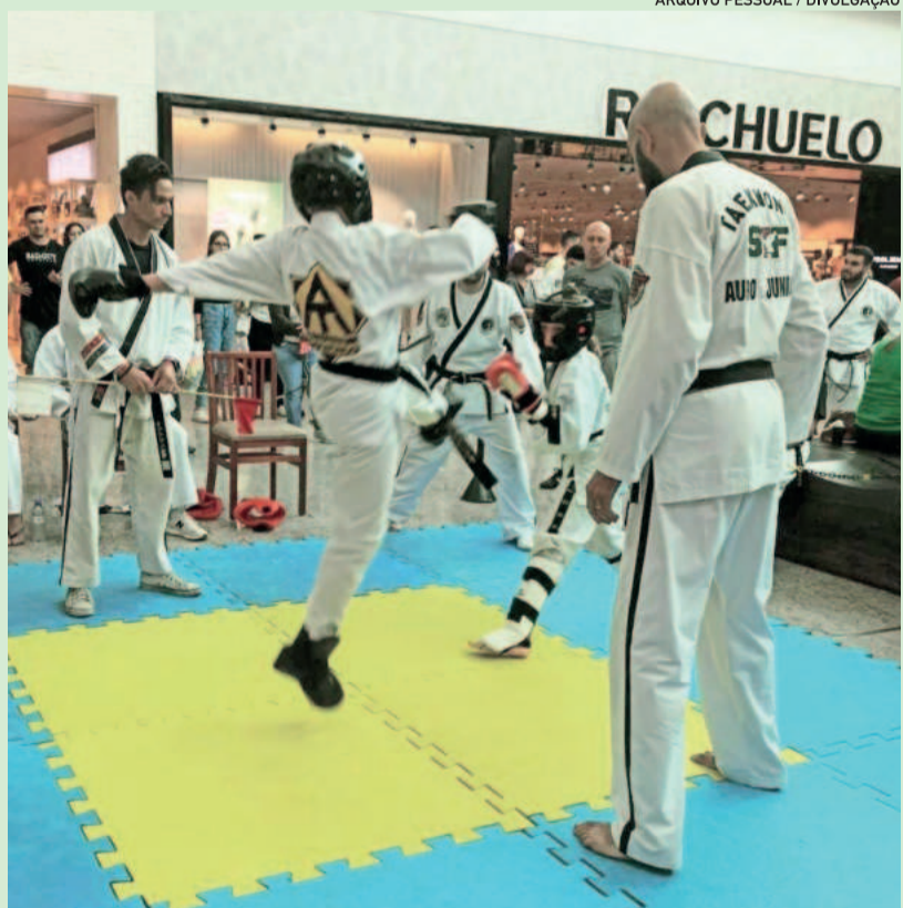
Alunos da Atitude Taekwondo participam de campeonatos em diversas partes do Sul do Brasil

Para participar das aulas, é necessário conversar com os professores. São oferecidas duas semanas experimentais e, após, firmado contrato, dependendo da escolha do aluno em ter vínculo ou não com a escola.