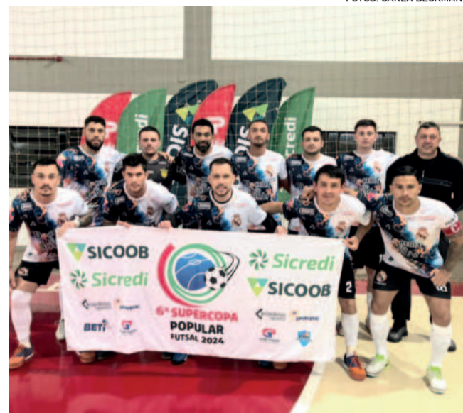
N.A. Limitados - Classificado para a semifinal Série Ouro