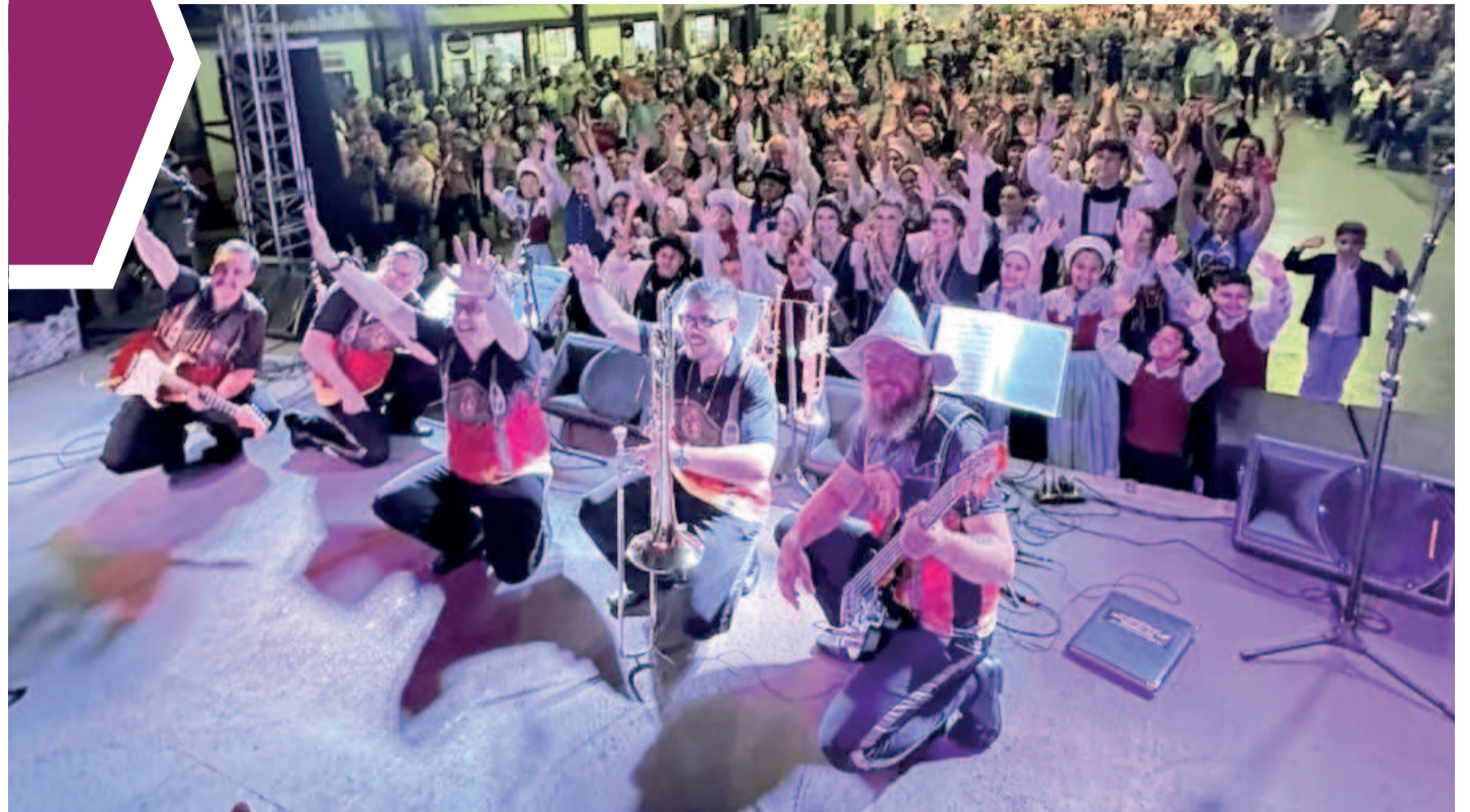
Super Banda Hopus é um dos cerca de 200 conjuntos que celebram a cultura germânica e embalam multidões