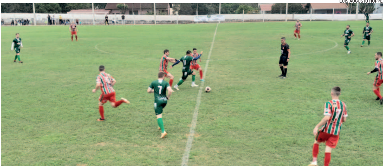
O Canabarense venceu o Minuano com grande atuação por 2 a 0