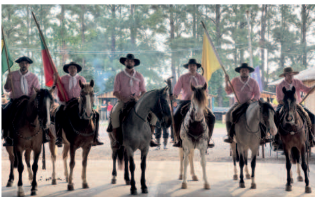
Grupo percorreu 578 quilômetros de Alegrete até Teutônia

Neste ano cavalgada foi mais especial, devido à incerteza de se haveria ou não a distribuição da chama, tendo em vista o desastre climático de maio. Percorrer grande parte do Rio Grande do Sul e ver de perto o impacto das cheias foi uma experiência intensa e de grande troca com os demais representantes de outras regiões. Estar com os amigos conquistados ao longo dos anos de cavalgada, compartilhar o sentimento de amor pela terra riograndense é o que move Dahmer.