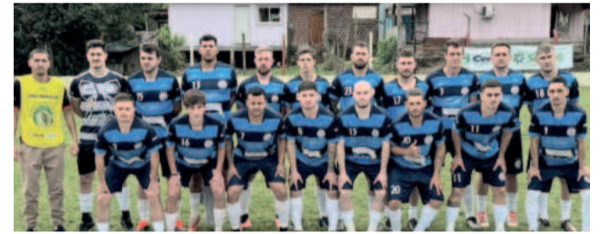
Juventude assumiu a liderança com a vitória no clássico contra o Atlético pelos Titulares