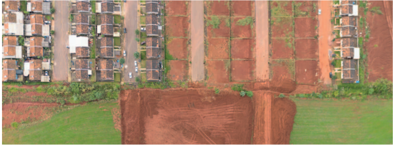
As novas casas serão construídas em área do Bairro Nova Morada