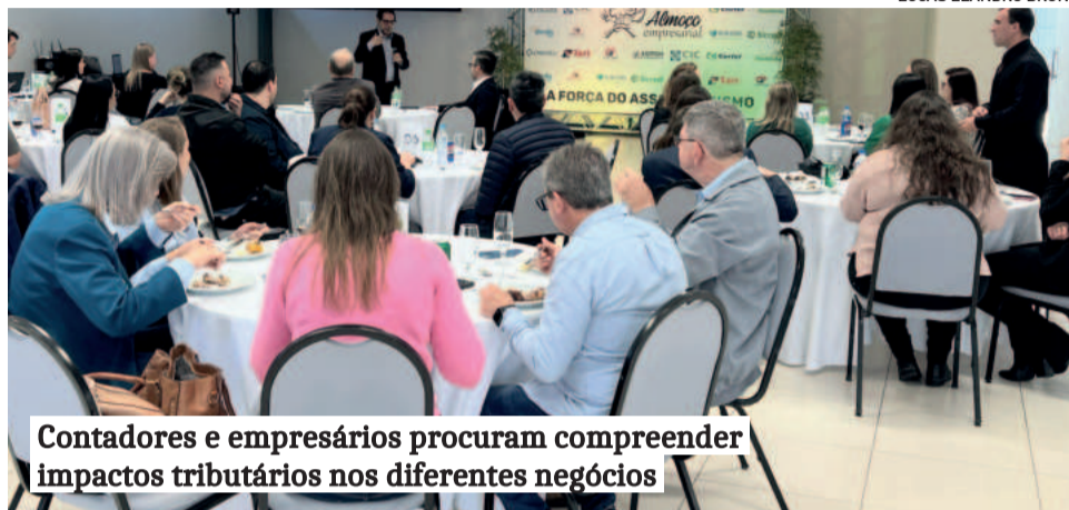
Contadores e empresários procuram compreender impactos tributários nos diferentes negócios