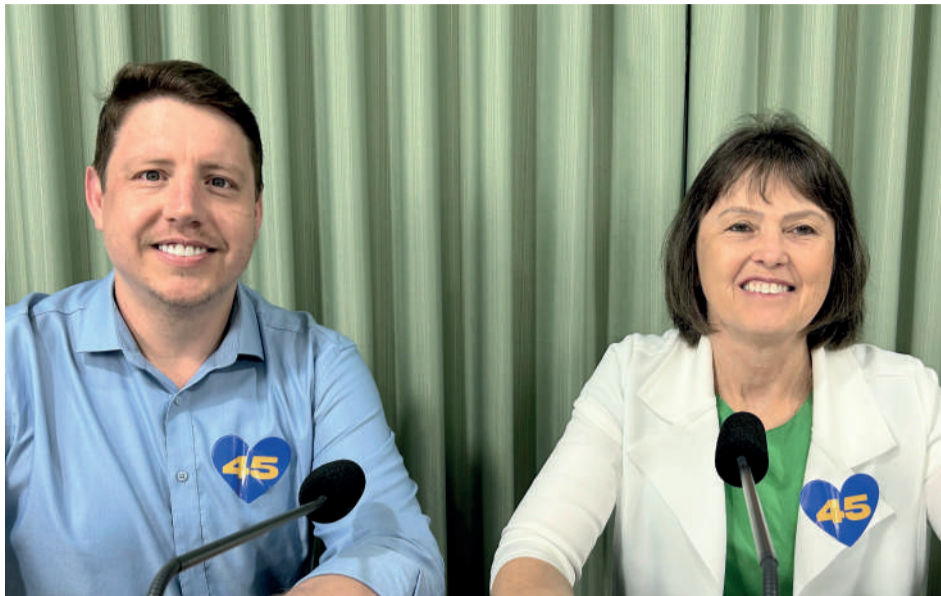
“As alianças precisam se complementar”, garante a dupla sobre gestão