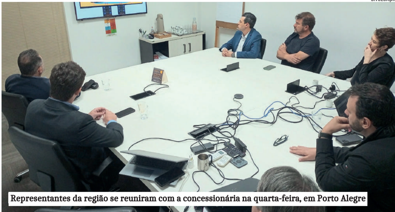
Representantes da região se reuniram com a concessionária na quarta-feira, em Porto Alegre