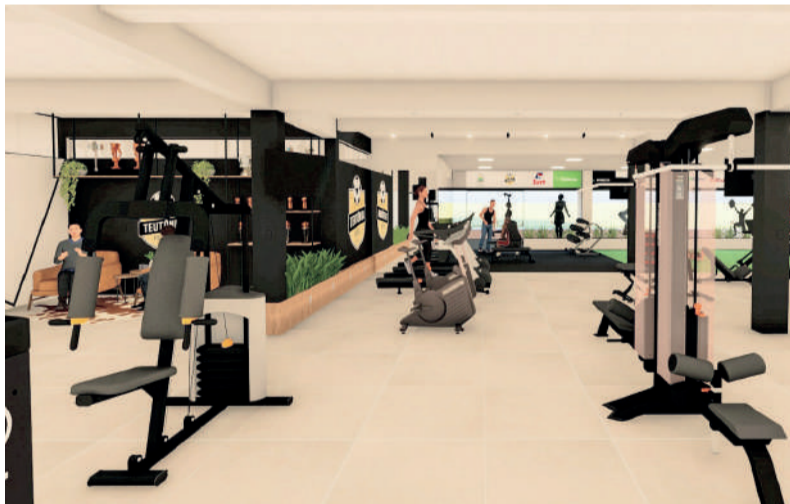
Associados da APDL, Teutônia Futsal e parceiros terão descontos

Além disso, o aluno da academia terá ingresso gratuito nos jogos da Teutônia Futsal. No Espaço Saúde também estará disponível o material desportivo da entidade, como camisas de jogo e passeio para serem adquiridas pelos torcedores.