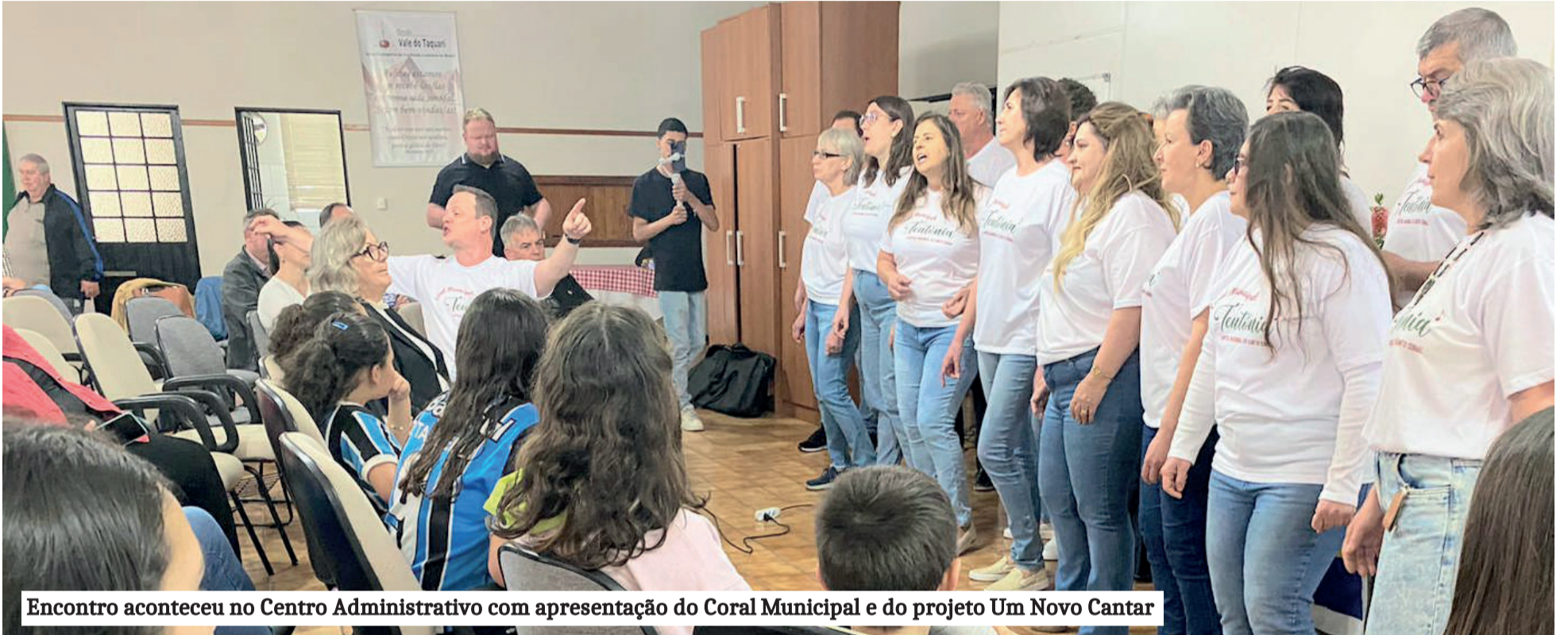
Encontro aconteceu no Centro Administrativo com apresentação do Coral Municipal e do projeto Um Novo Cantar