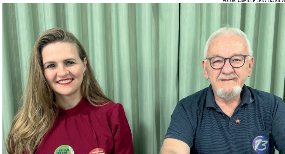
Mesmo assim, se eleitos, estarão abertos à participação de outros partidos