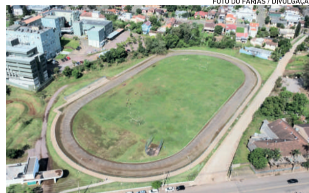
Parcão recebe jogos do Centauros pela primeira vez após a cheia de maio