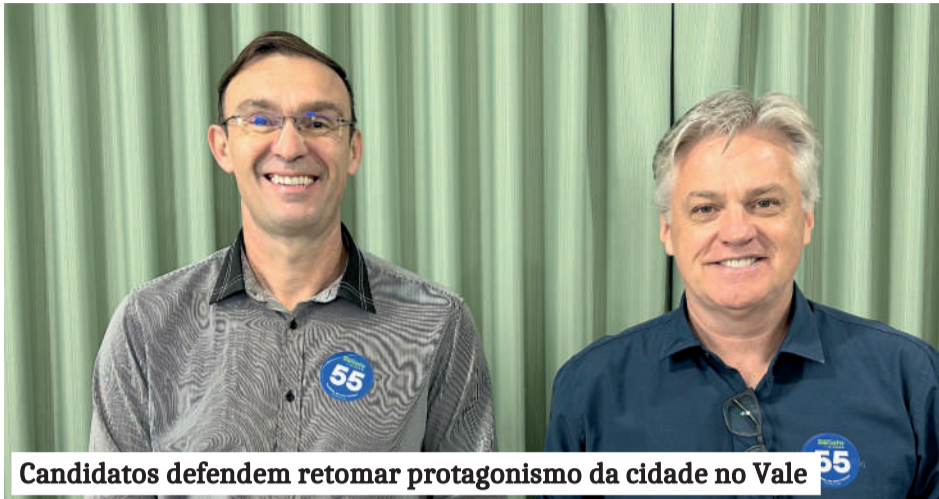
Candidatos defendem retomar protagonismo da cidade no Vale