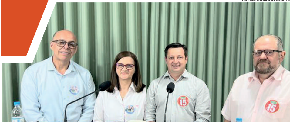
Segundo debate foi realizado no auditório do GP na terça-feira