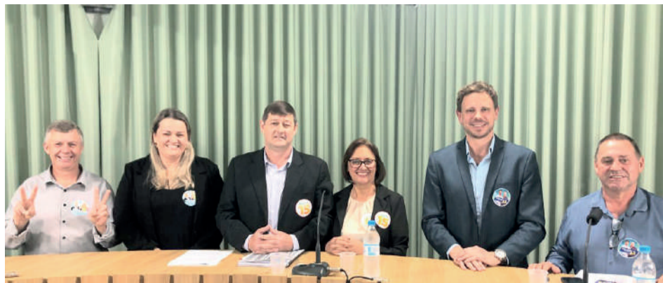
Encontro entre os candidatos ocorreu na quinta-feira (26/9)