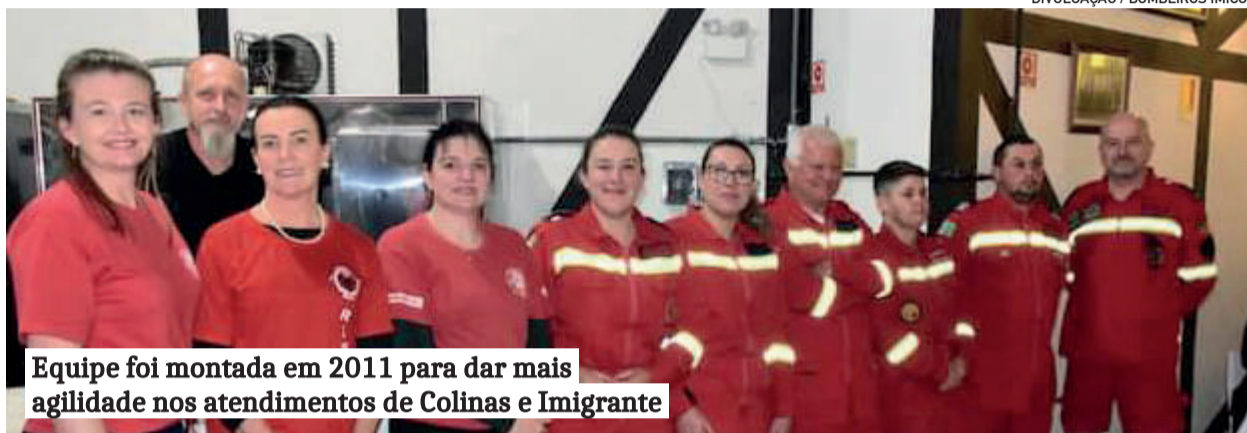
Equipe foi montada em 2011 para dar mais agilidade nos atendimentos de Colinas e Imigrante