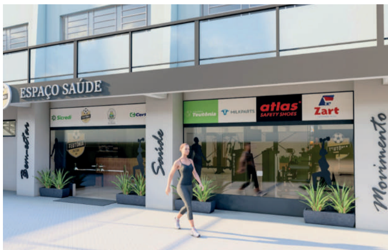
Espaço será implantado junto à Associação da Água