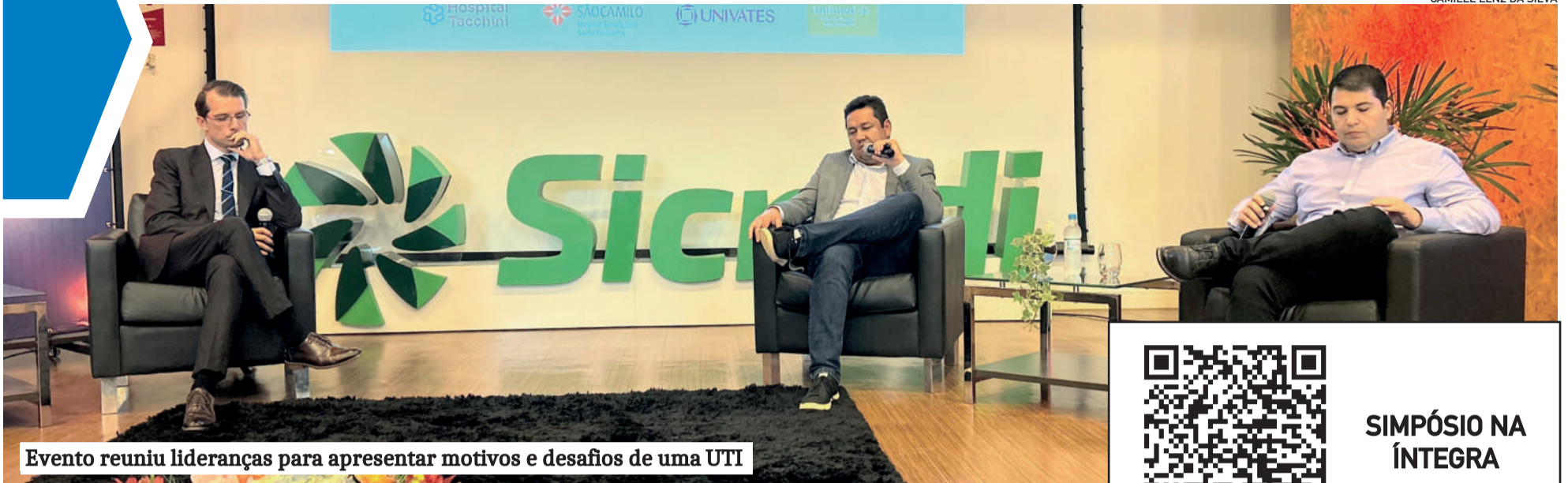
Evento reuniu lideranças para apresentar motivos e desafios de uma UTI