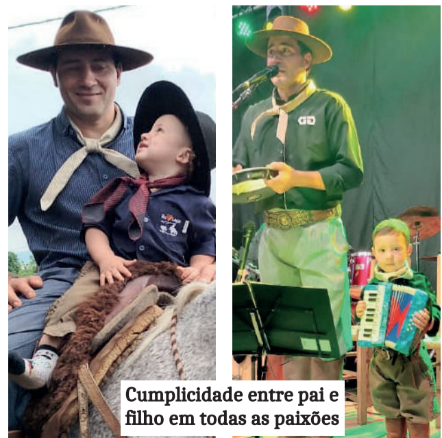
Cumplicidade entre pai e filho em todas as paixões

“É uma cultura bacana, saudável e os comentários sempre são bons”, comemora o pai, filho e neto de uma família que carrega o orgulho de ser gaúcho por todas as gerações.