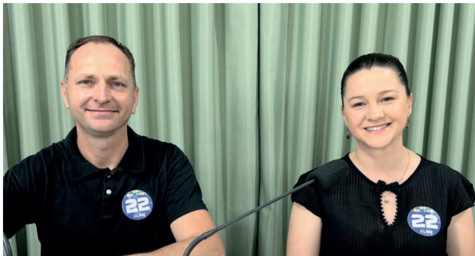
Dupla busca Executivo resolutivo e que entregue resultados