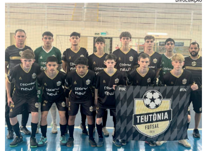
Voltado para a formação de novos atletas, clube tem feito boas participações nos campeonatos