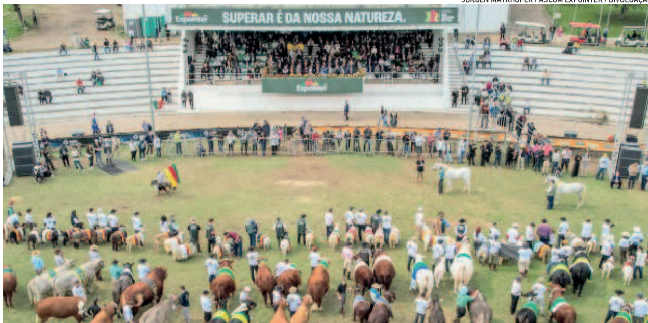
Cerimônia apresentou tradicionais desfiles dos campeões