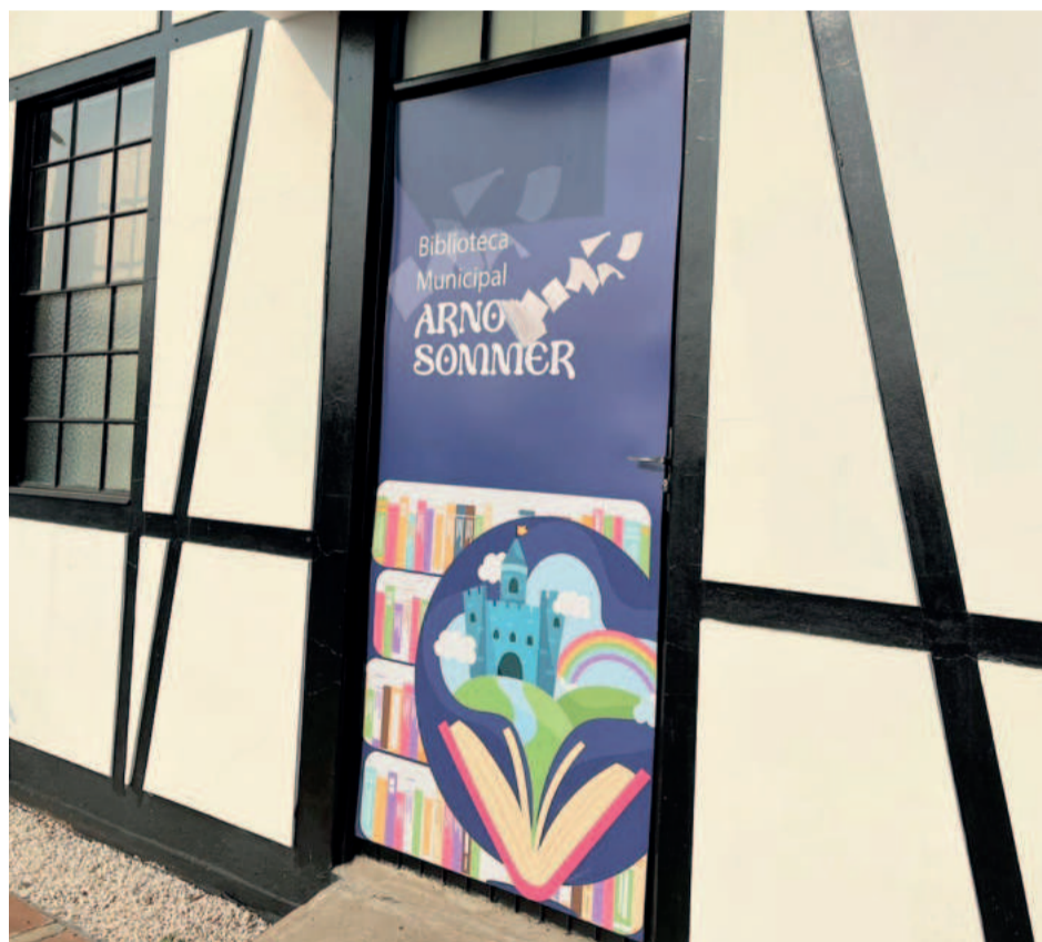
O espaço atende das 7h30 às 11h30 e das 13h às 17h, de segunda a sexta-feira

Os munícipes podem permanecer com as obras pelo prazo de 14 dias. Após, devem devolver ou renovar o empréstimo. No momento, é possível contactar a biblioteca pelo telefone fixo da prefeitura, 3762-7700, pelo e-mail biblioteca@teutonia.rs.gov.br ou presencialmente. O horário de funcionamento é das 7h30 às 11h30 e das 13h às 17h, de segunda a sexta-feira.