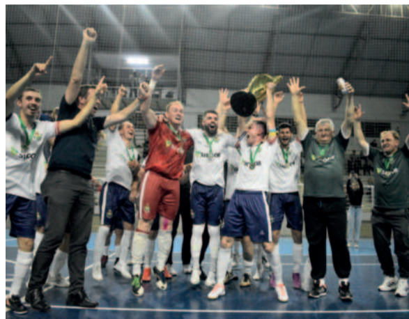
Barão campeão Supertaça dos Campeões