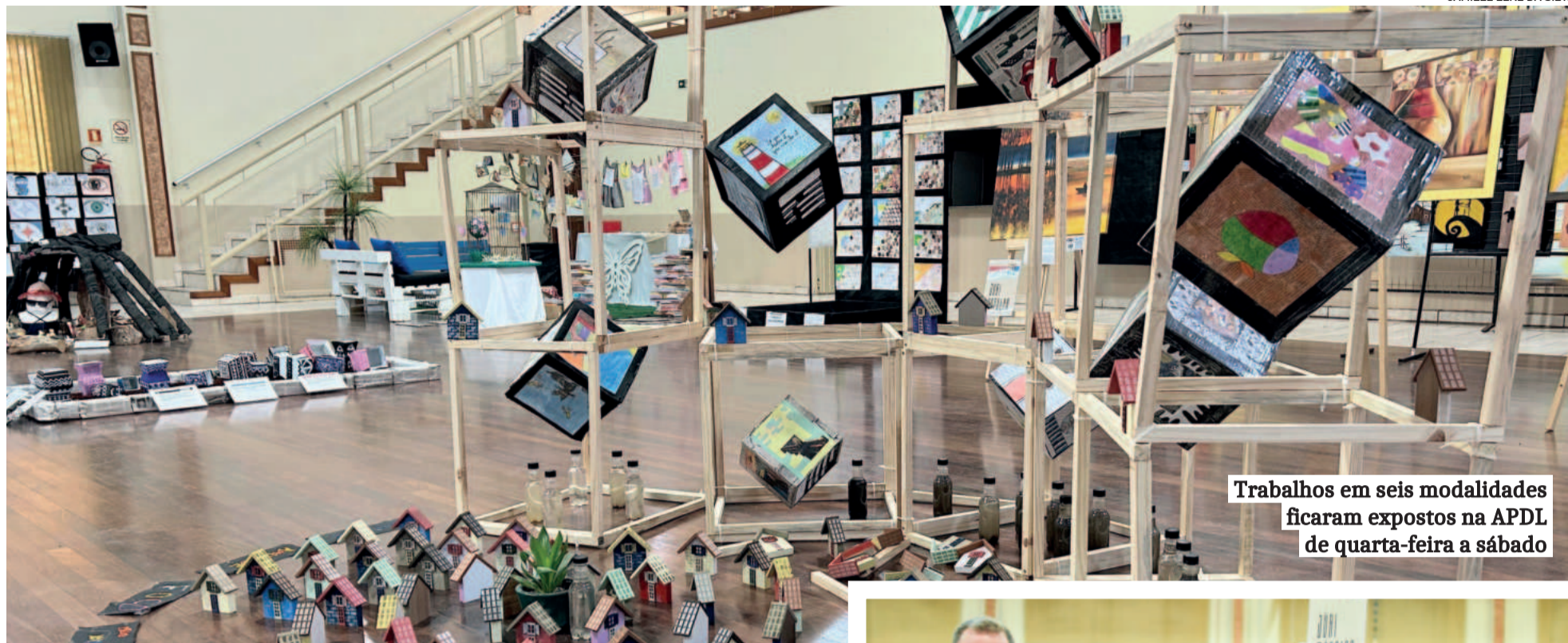
Trabalhos em seis modalidades ficaram expostos na APDL de quarta-feira a sábado