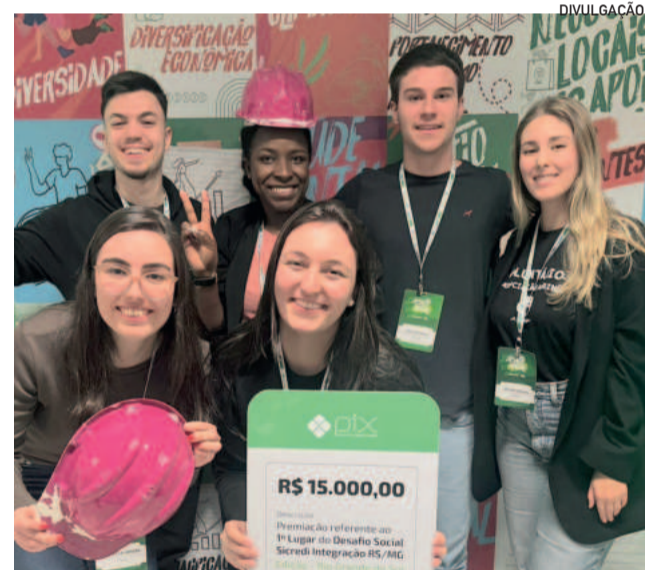
Com projeto sobre diversidade e qualificação profissional, cooperativa Construnidas venceu o desafio

Já o terceiro lugar, Caminhos da Esperança, trouxe a necessidade de trabalhar o acolhimento de pessoas vulneráveis por meio de intervenções artísticas em locais públicos de grande circulação, gerando otimismo e esperança para quem as vê através de mensagens positivas e da ideia de que não estão sós. A iniciativa recebeu o prêmio de R$ 5 mil.