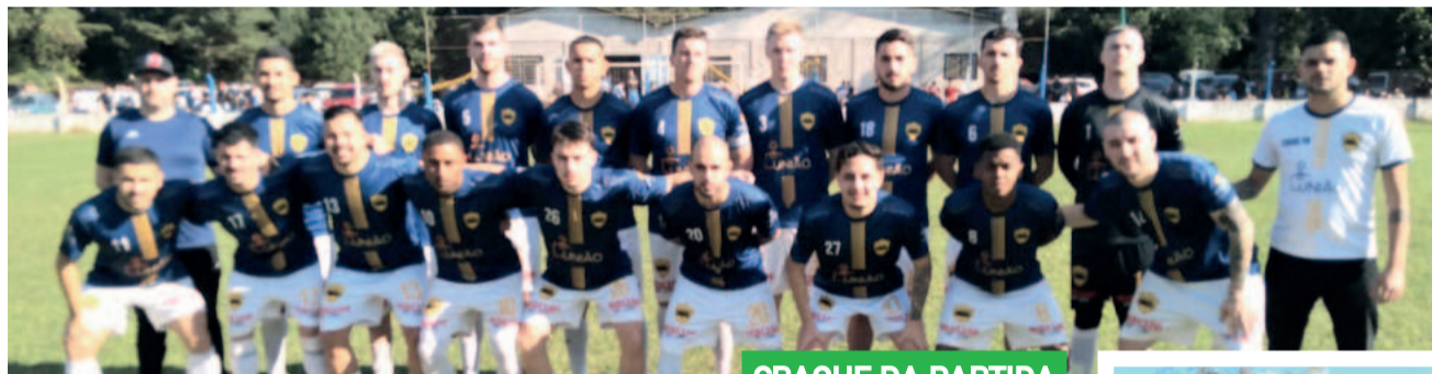
União venceu o atual campeão e se garantiu na decisão 2024