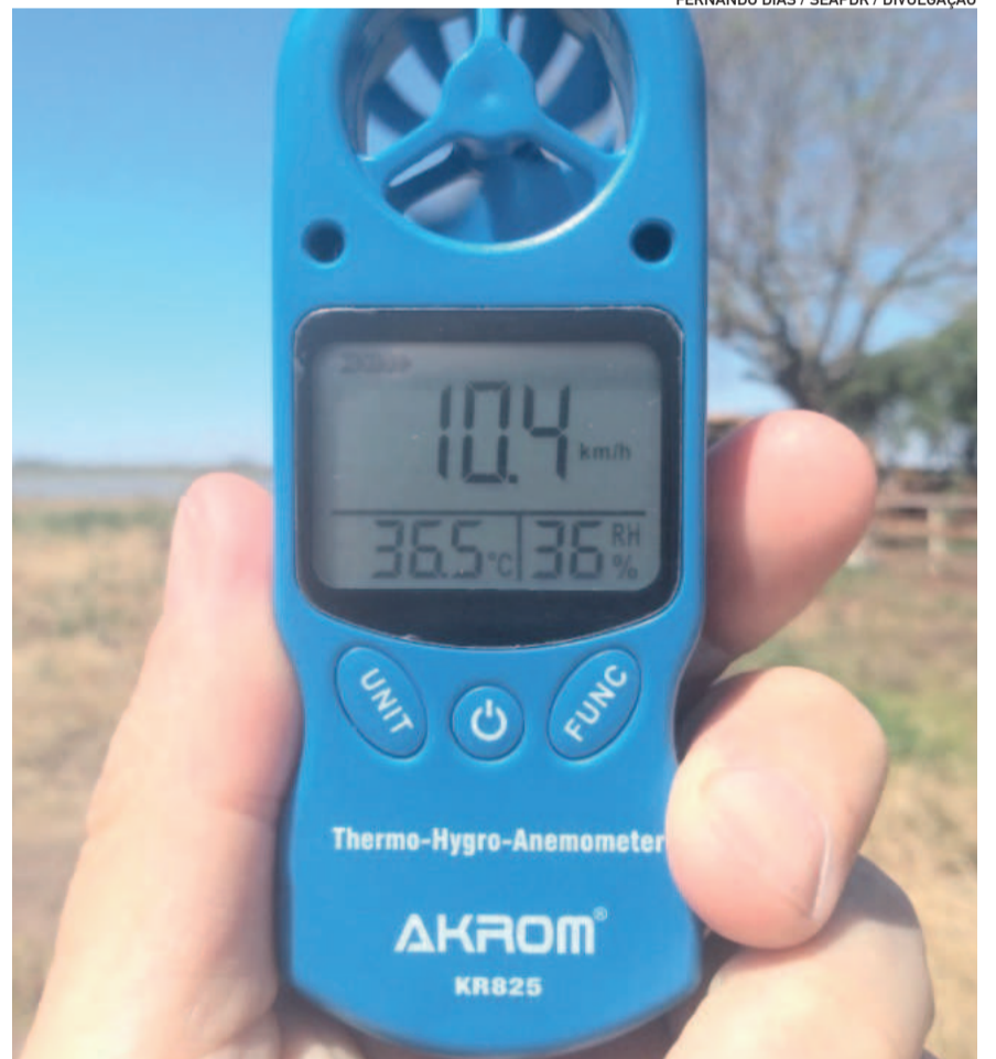
Sistema de Monitoramento e Alertas Agroclimáticos (Simagro) está disponível para os produtores gratuitamente