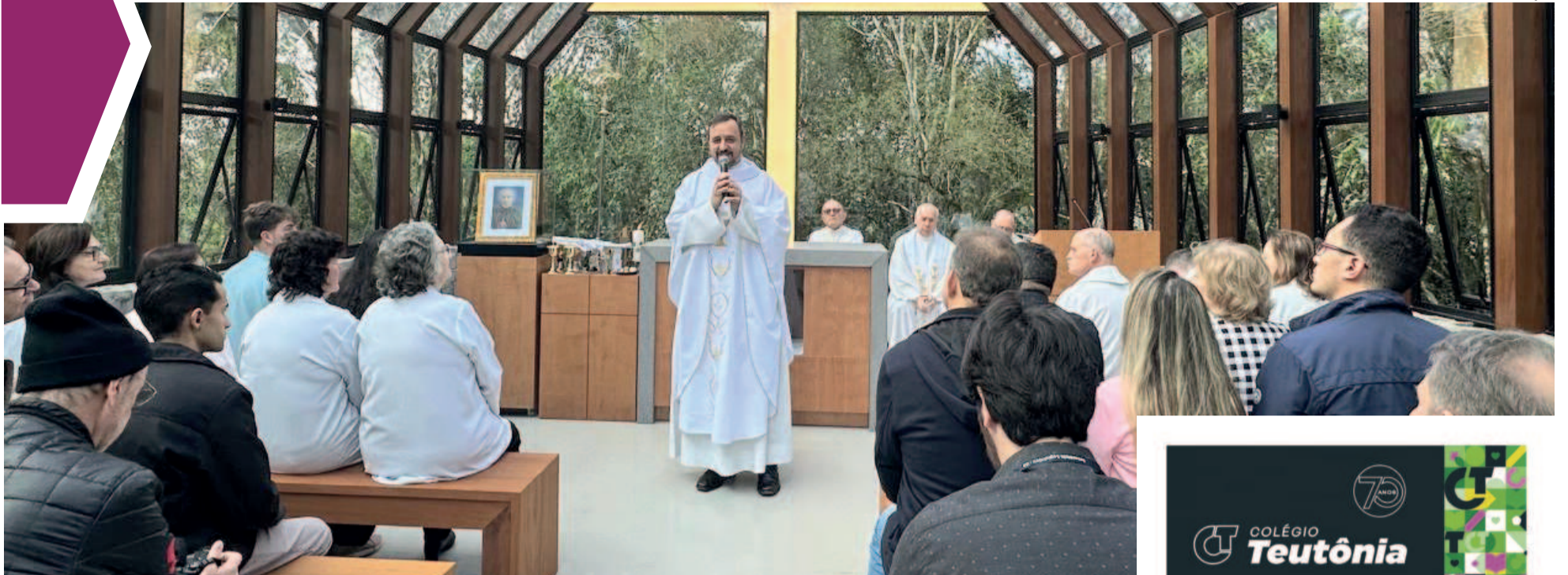
O momento foi marcado por celebração, devoção e homenagens de centenas de fiéis