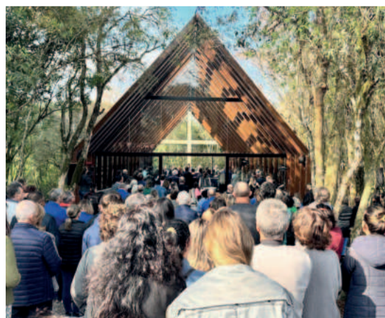
Novo espaço é ponto de encontro de peregrinadores

O mês de setembro marca o aniversário de 120 anos da passagem de São João Batista Scalabrini por Encantado, ocorrida em 14 de setembro de 1904.