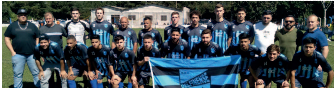
Delfinense foi o primeiro finalista