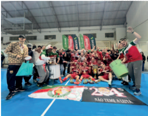
Os Guri da 24 campeão Série Ouro Supercopa