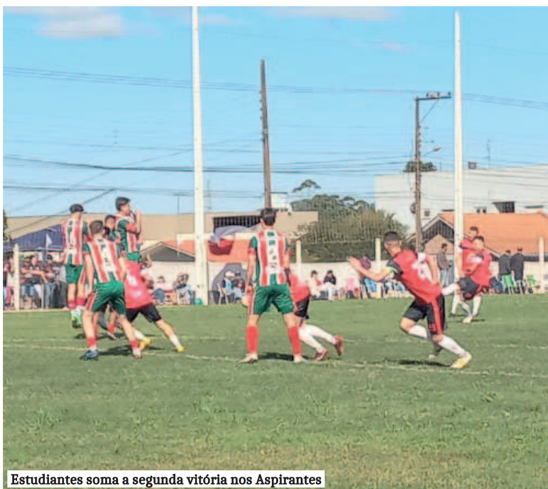
Estudiantes soma a segunda vitória nos Aspirantes