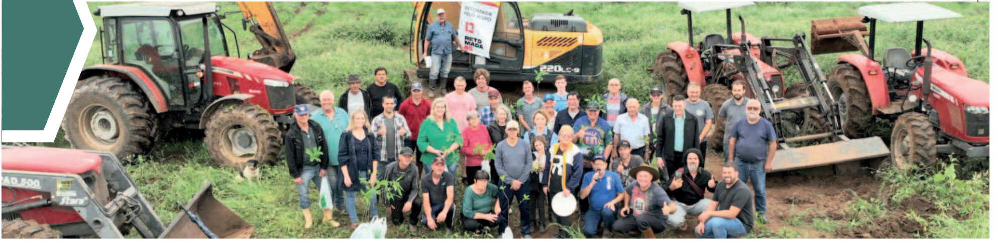
Grupo de voluntários trabalha pela retomada da agricultura em Estrela