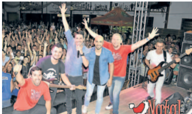
Em 2015, o público prestigiou 10 horas de show