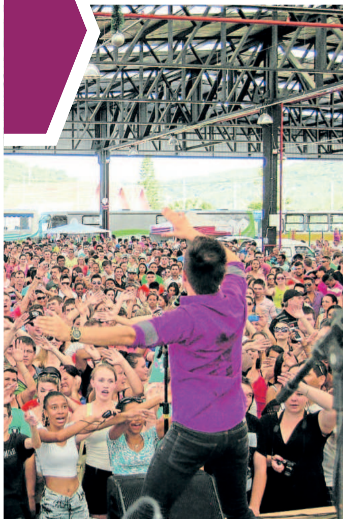
Registro da última edição do Natal do Povo, em 2016