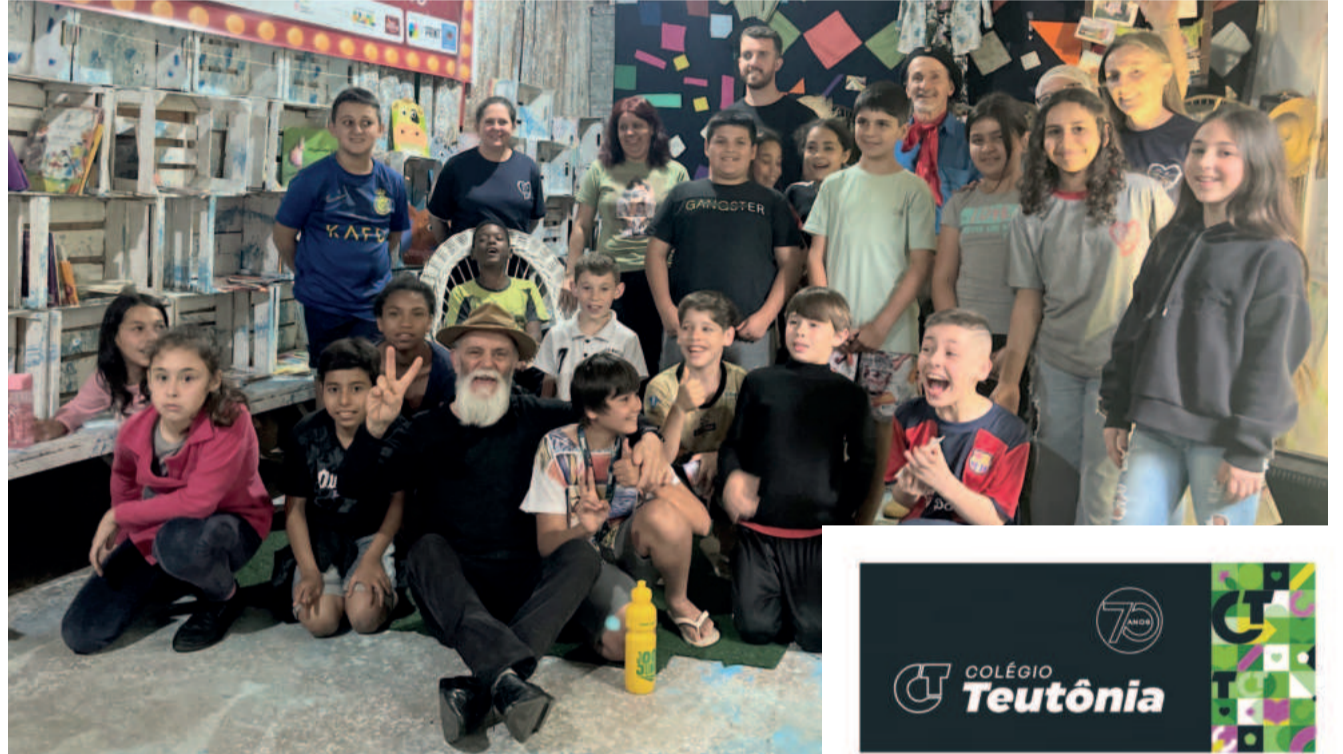
Estudantes da Escola 24 de Maio tiveram um momento de muita diversão e cultura