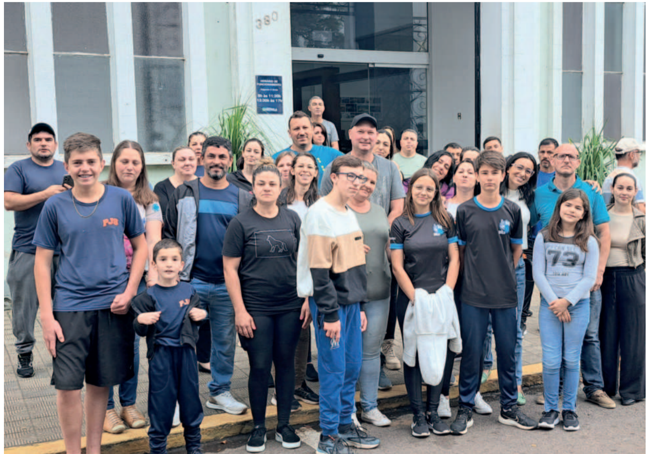
Cerca de 40 manifestantes estiveram presentes na frente da prefeitura nesta sexta-feira