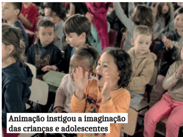
Animação instigou a imaginação das crianças e adolescentes

O projeto teve o apoio das empresas Grupo Maison e Emalart Multi Loja.