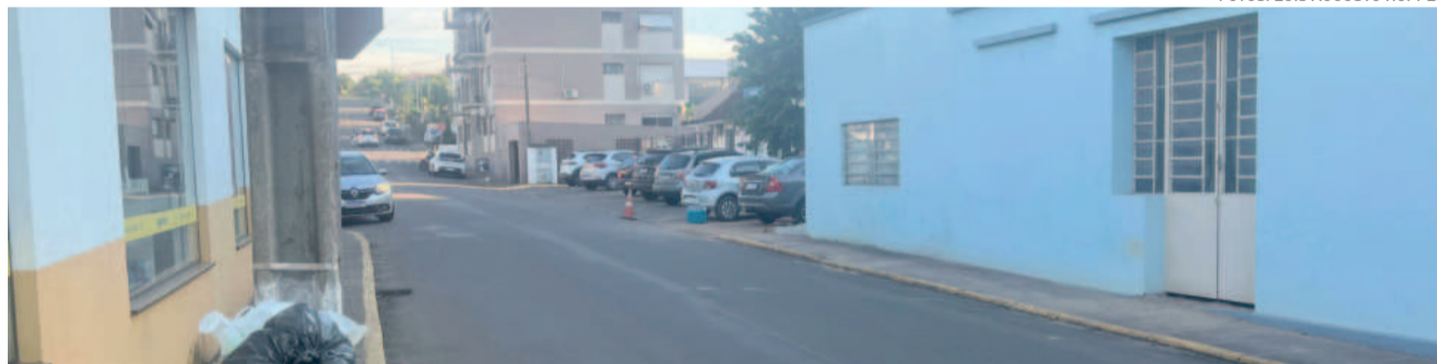
Rua Pedro Schneider terá mão única ampliada no trecho entre a Major Bandeira e a Fernando Ferrari