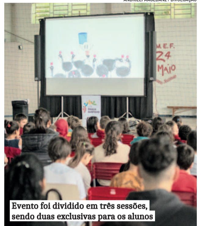
Evento foi dividido em três sessões, sendo duas exclusivas para os alunos