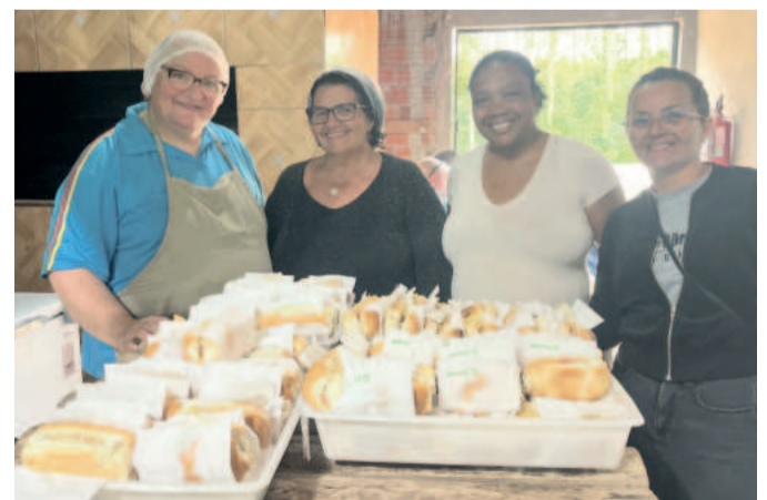
O cachorro-quente servido para os participantes da tarde é resultado de trabalho voluntário

“ Quem muito lê, muito sabe, muito vê, já dizia Dom Quixote ”