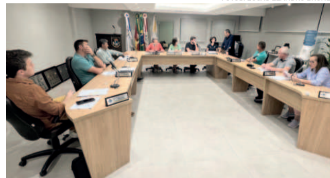
Audiência pública registrou a apresentação da LDO