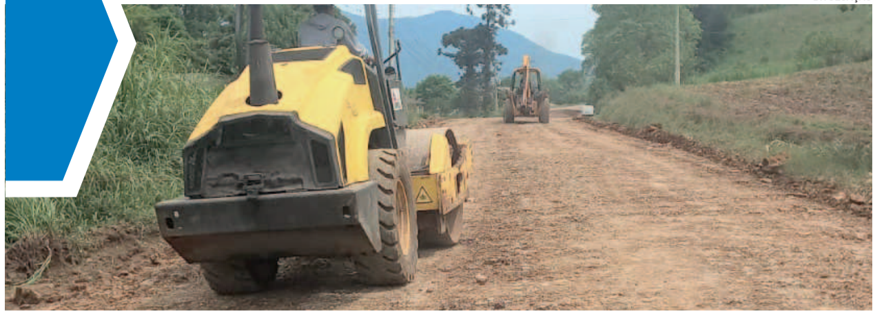
Buracos na estrada de chão dificultam a trafegabilidade dos veículos

E, cuidado para não cair na armadilha dos enroladores – falam muito e entregam pouco ou nada.