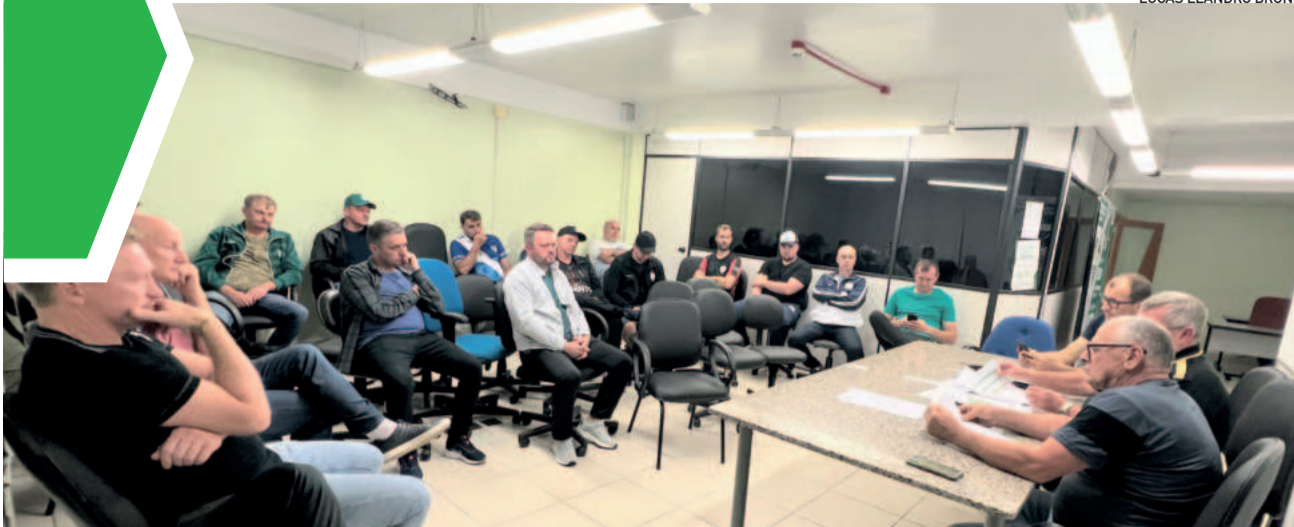
Clubes classificados reuniram-se na noite de terça-feira na sede da Aslivata, em Lajeado