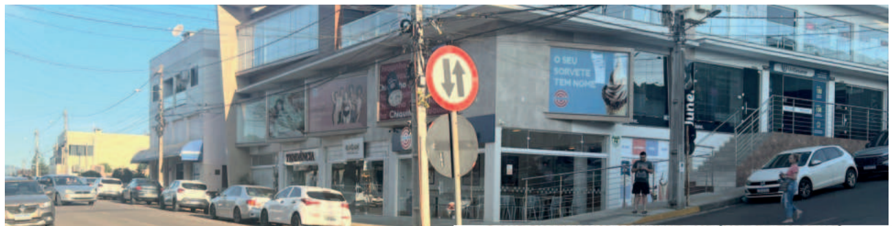
Rua Major Bandeira terá ampliação até o entroncamento com a RS-419