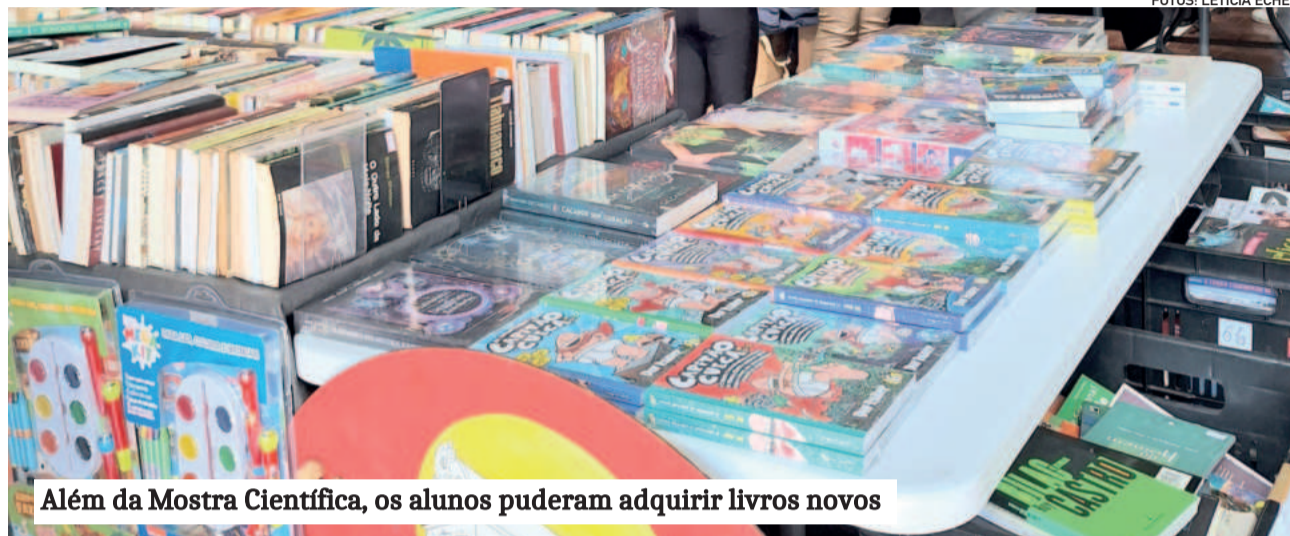
Além da Mostra Científica, os alunos puderam adquirir livros novos