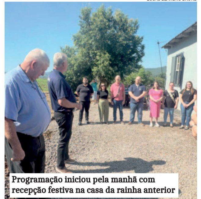
Programação iniciou pela manhã com recepção festiva na casa da rainha anterior