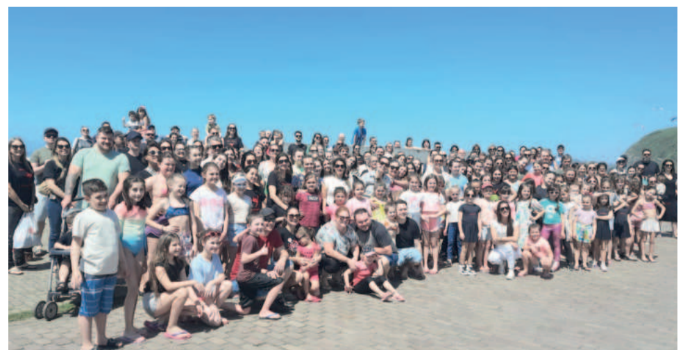
Após o ensaio de palco na sexta-feira, famílias da Movimentu's curtiram a praia no sábado pela manhã