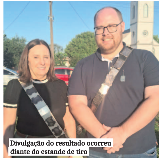
Divulgação do resultado ocorreu diante do estande de tiro