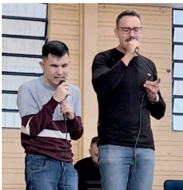
Evento também apresentou viés cultural e artístico