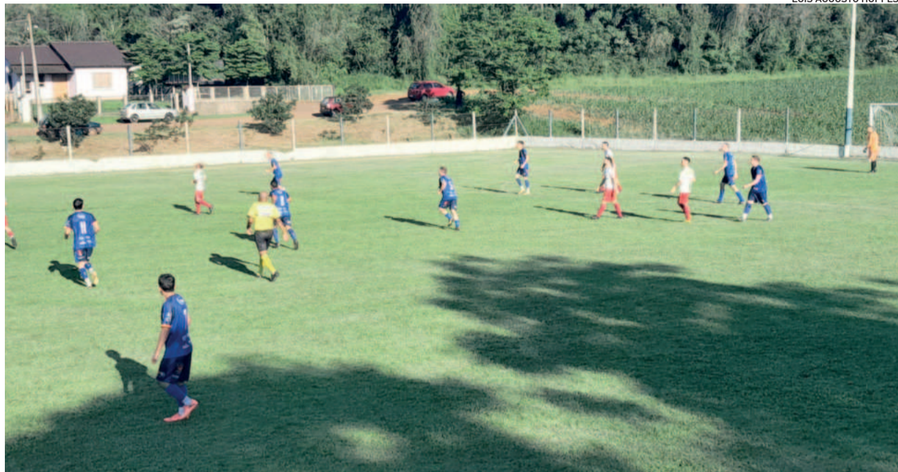
A equipe de Brochier venceu o duelo em Teutônia e garantiu a liderança do campeonato