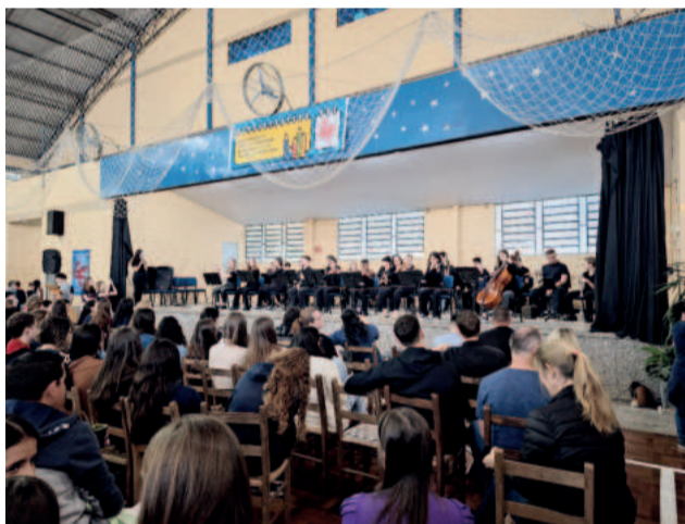
Orquestra Henrique Üebel encantou o público

A equipe também apresentou um vídeo de uma moradia em tamanho real feita com impressão 3D. No Brasil, há um exemplar desse projeto no Rio Grande do Norte. Também podem ser feitos outros objetos com a ferramenta, como porta caneta, copo ou até uma caneta decorativa.