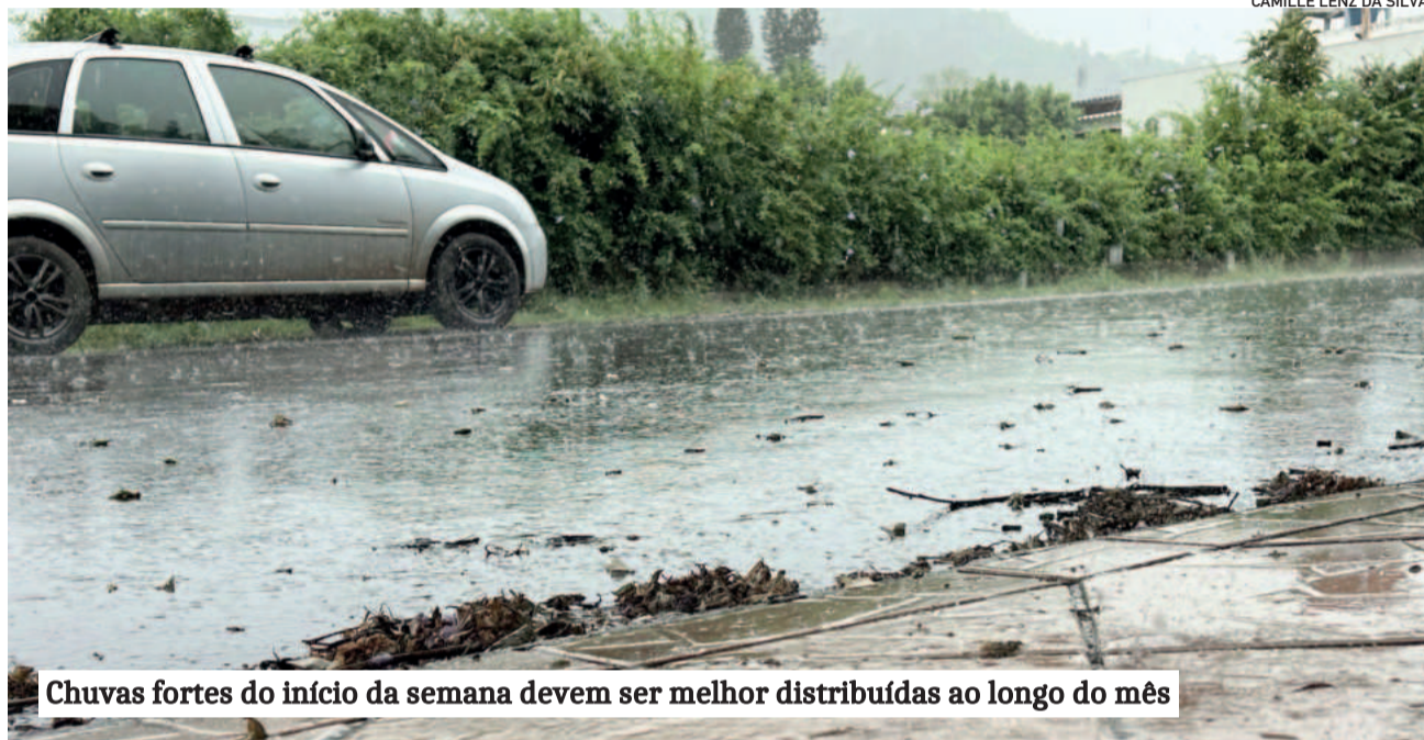
Chuvas fortes do início da semana devem ser melhor distribuídas ao longo do mês