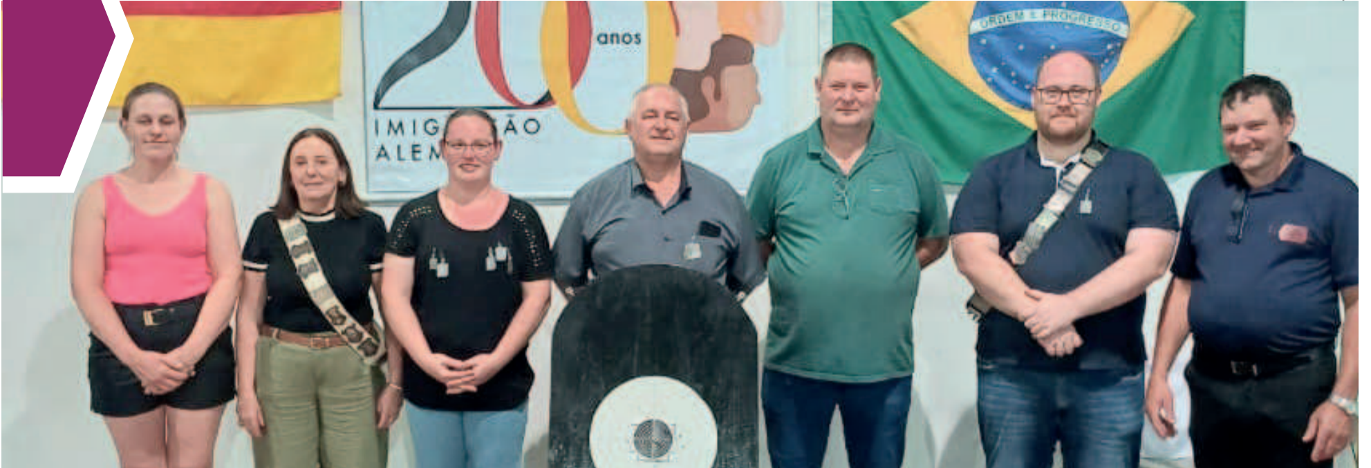
Corte do Tiro Rei foi apresentada na sociedade após encerramento do torneio