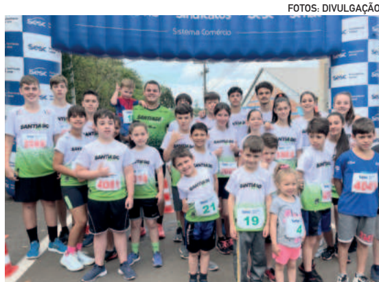
Crianças de Fazenda Vilanova participaram na categoria Corrida Escolar