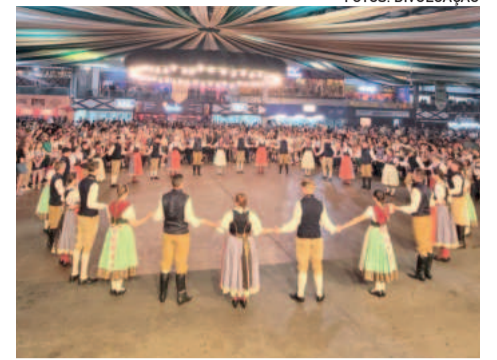
Imigrantenses do Sonnenlicht realizaram sonho antigo em Blumenau