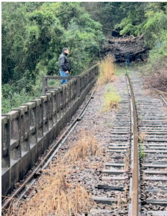
Duramente atingido pela enchente, especialmente no trecho entre Vespasiano Correa e Dois Lajeados, o trajeto representa uma perda milionária para região