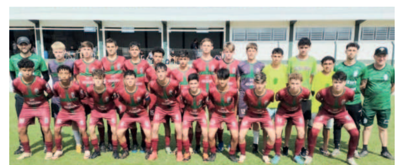
Sub-15 da Juventus goleou e segue líder na Liga Serrana