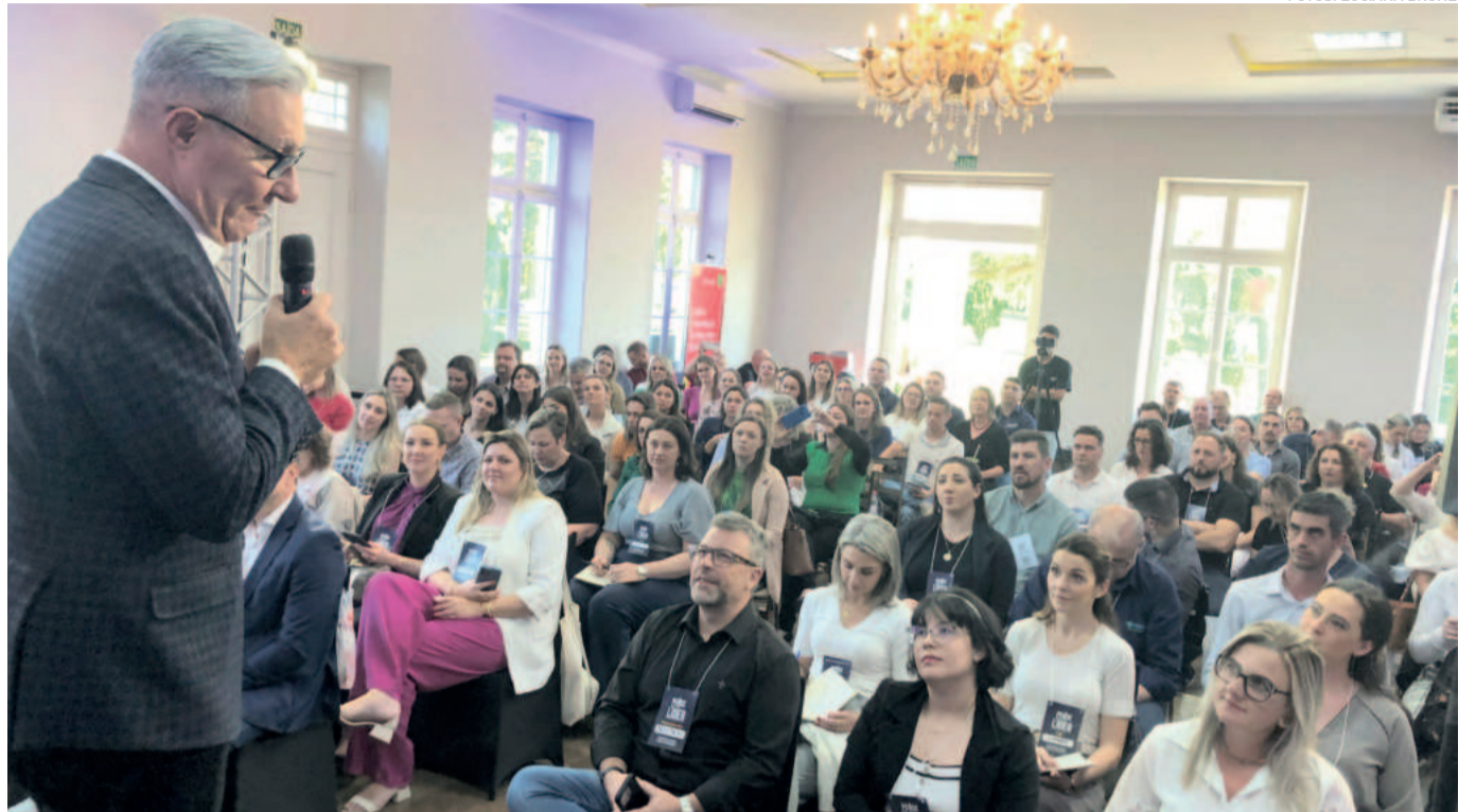
Evento lotou espaço do Casarão 1894