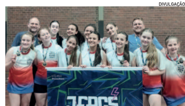
Equipe Sub-14 conquistou o segundo lugar no infantil feminino