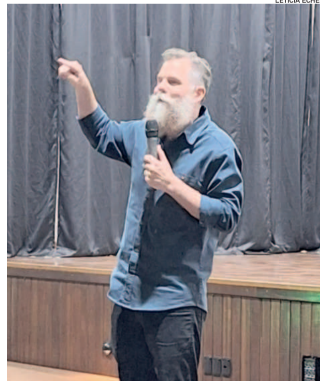
Palestrante abordou temas relevantes para a criação saudável dos filhos