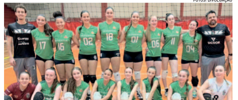
Categoria Infantil venceu seus jogos no sábado

Até o momento, a Juventus venceu 10 partidas, empatou três, perdeu apenas uma, marcou 39 gols e sofreu 14, com 79% de aproveitamento no campeonato. A vice-líder, Ale, disputou 31 partidas, venceu 10, empatou uma e perdeu duas, com 29 gols marcados e apenas seis gols sofridos, também com 79% de aproveitamento.