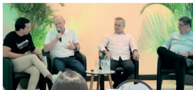
Três empresas da região apresentaram exemplos

O usadia – Fé em você. Não enxerga o chão, mas sabe que vai dar certo. Medo é do tamanho que você dá. Ação cura medo. Faça agora. Amanhã é nunca.