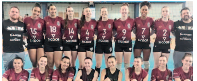
Categoria Infante venceu os duelos na sexta-feira