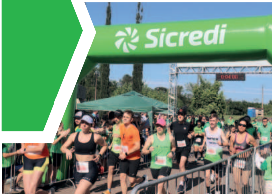
Rústica de Poço das Antas reuniu mais de 470 corredores no domingo