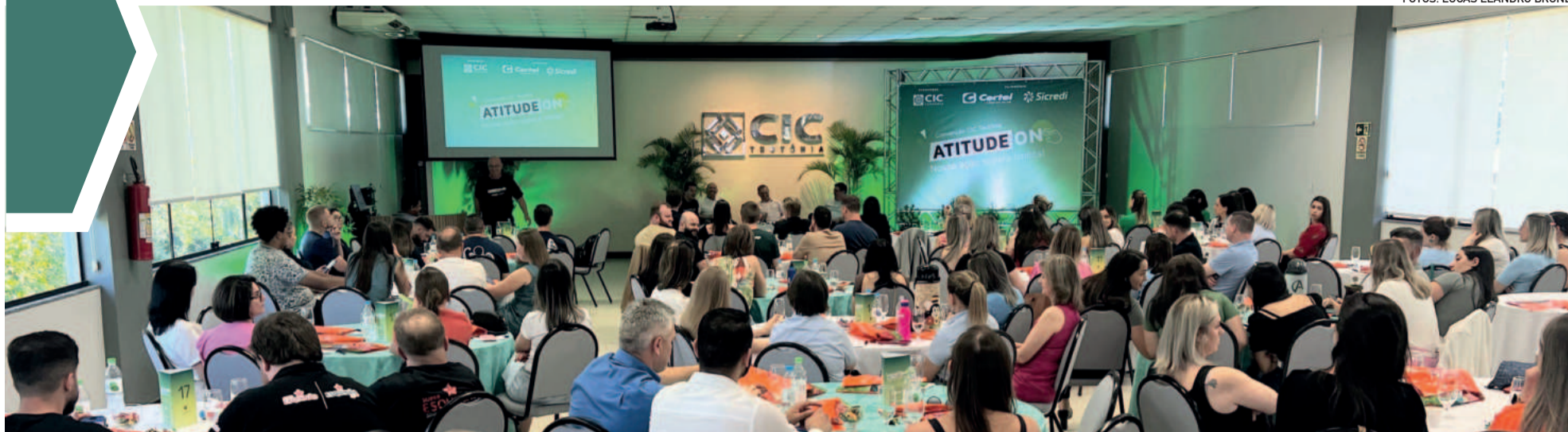
Convenção CIC Teutônia lotou auditório 3 da entidade