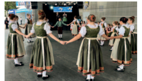
Alunos do Teutônia Cultural se apresentaram fora do município