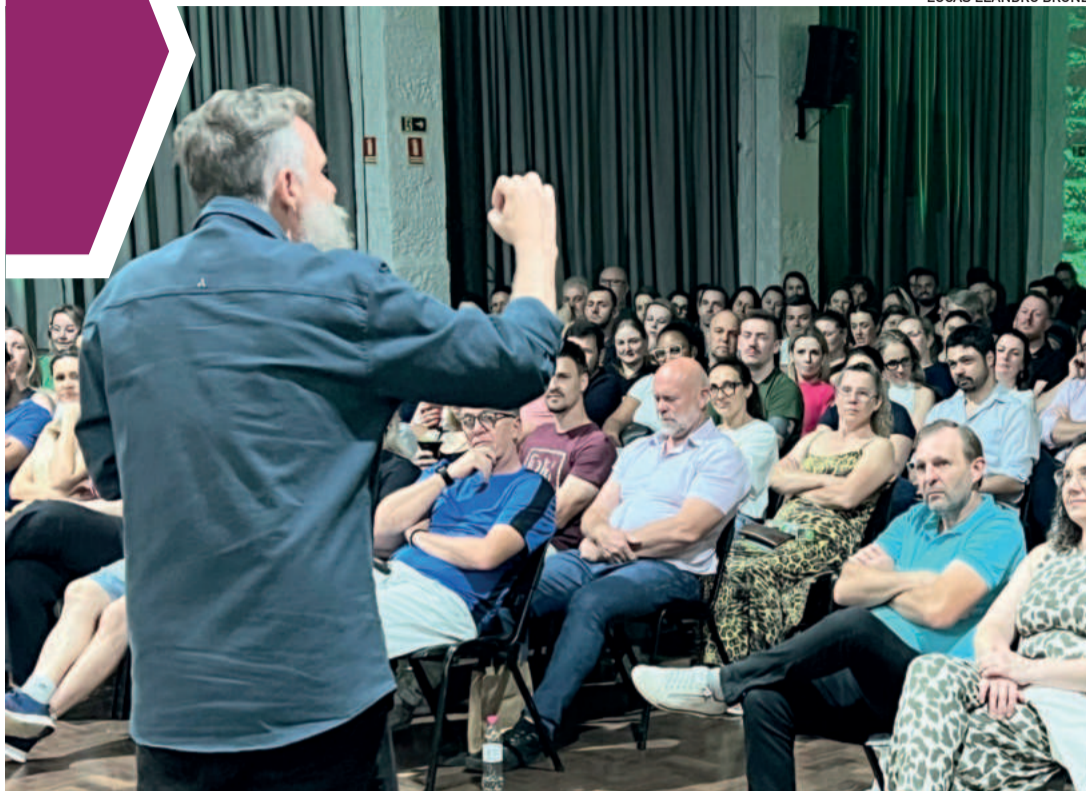
Pais e professores lotaram o auditório do CT para prestigiar o comunicador