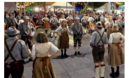
Grupo de Estrela irá novamente a Santa Cruz do Sul no sábado