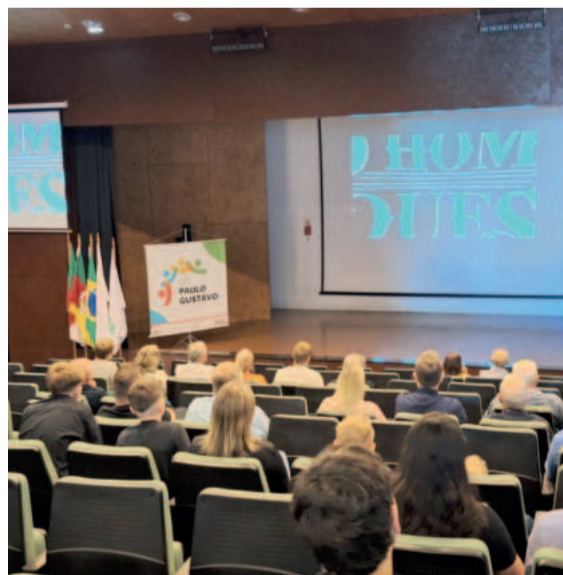
Documentário foi prestigiado pela população de forma gratuita