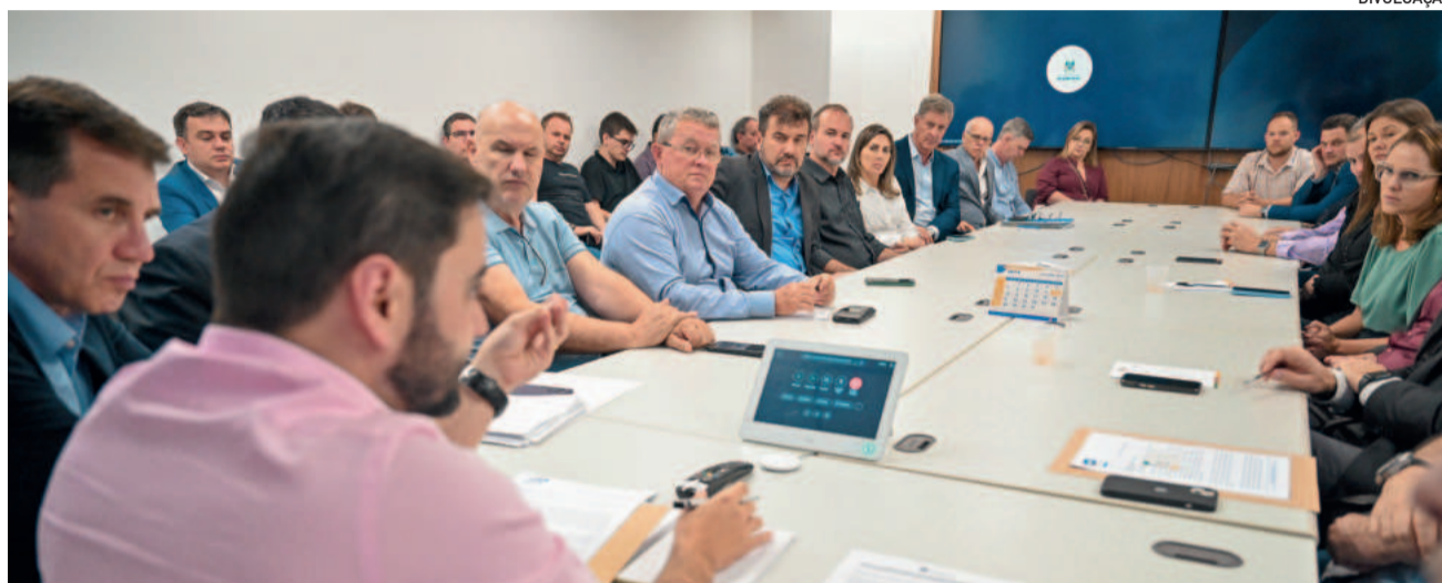
Reunião ocorreu em Porto Alegre e reuniu autoridades locais e do Estado