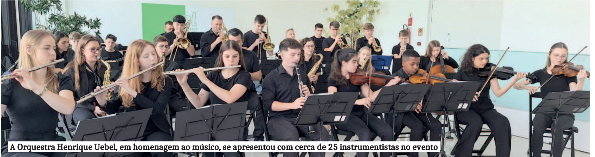
A Orquestra Henrique Uebel, em homenagem ao músico, se apresentou com cerca de 25 instrumentistas no evento