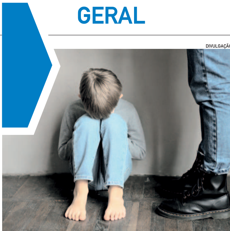
A família e a escola têm papel importante na proteção de crianças e adolescentes

O papel das lideranças está no pensar soluções, construir projetos e exigir os recursos necessários para o Estado e a União executarem. Afinal, como dito no palanque de maio: “não faltarão recursos para reconstruir o Rio Grande do Sul”. Ficar parado esperando por tudo será ineficiente.