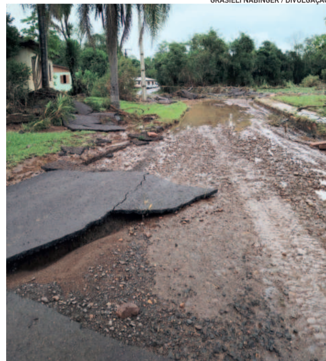
Asfalto em Pontes Filho