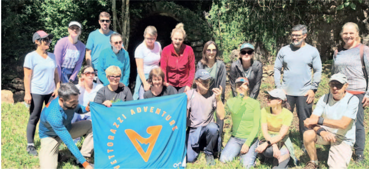
Grupo visitou o Sítio da Fé