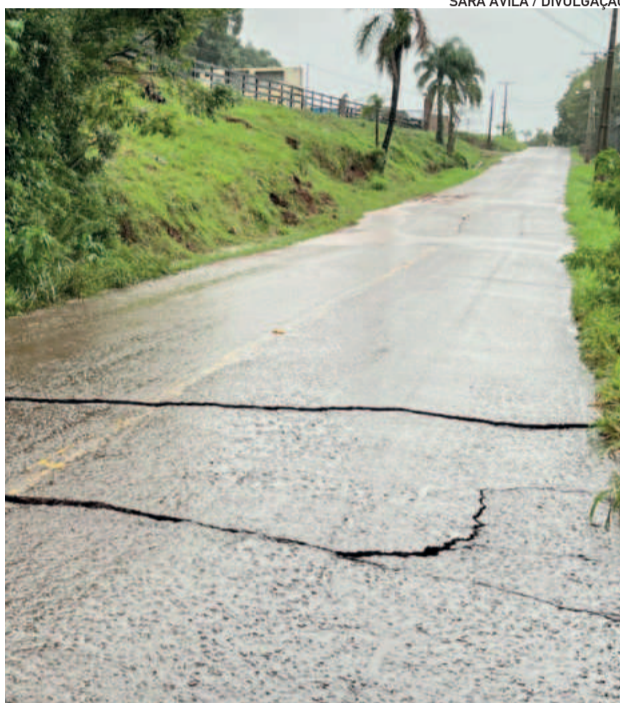
Asfalto em Linha Harmonia