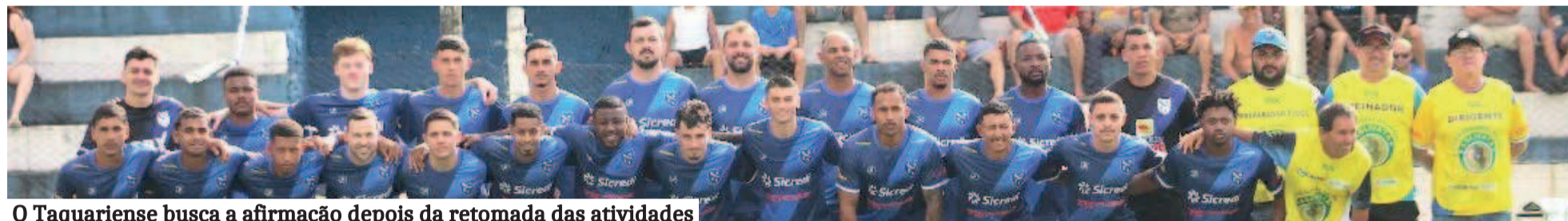
O Taquariense busca a afirmação depois da retomada das atividades