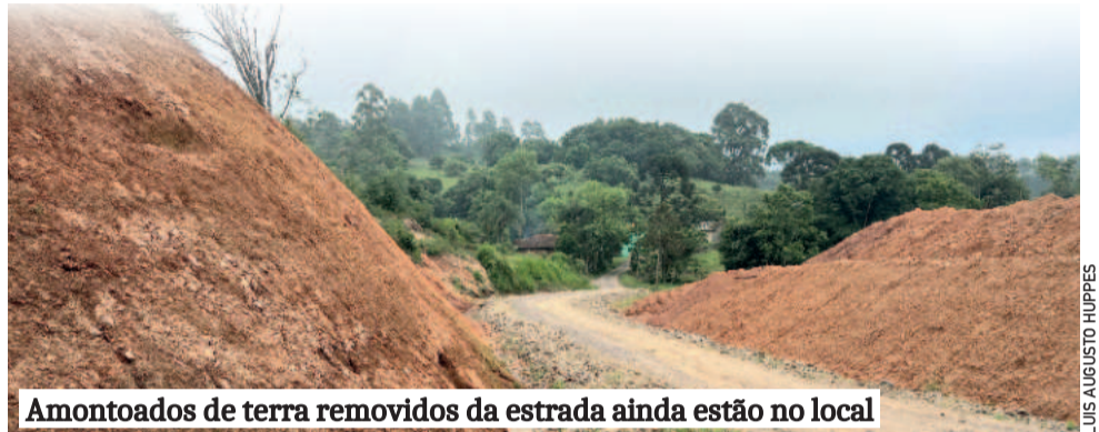
Amontoados de terra removidos da estrada ainda estão no local