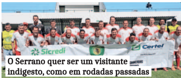
O Serrano quer ser um visitante indigesto, como em rodadas passadas