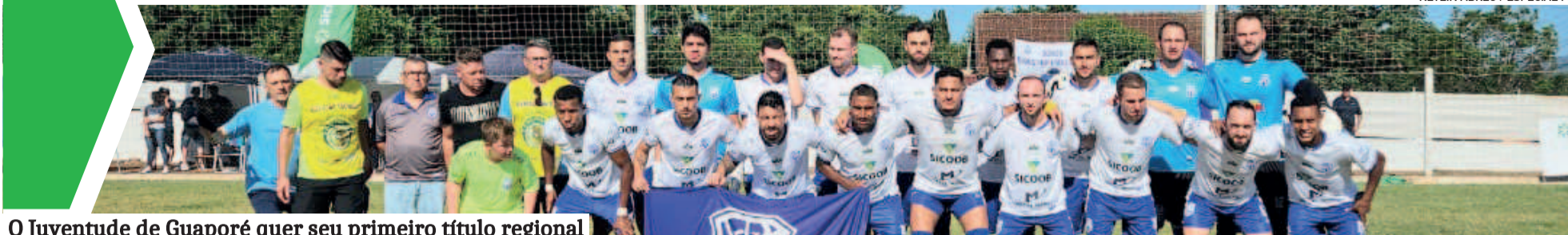
O Juventude de Guaporé quer seu primeiro título regional