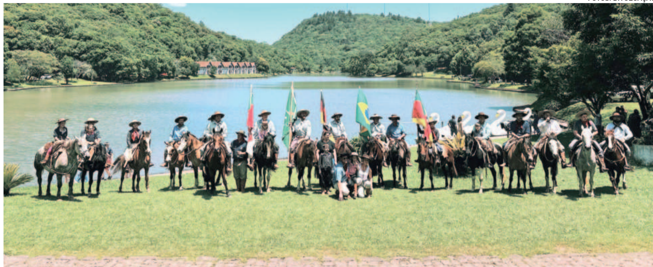
Cavalgada passou por vários locais, como a Lagoa da Harmonia em Teutônia