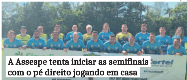
A Assespe tenta iniciar as semifinais com o pé direito jogando em casa