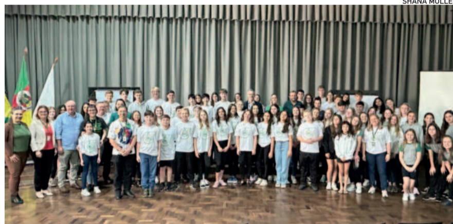
Diretoria, associados e lideranças participantes do evento