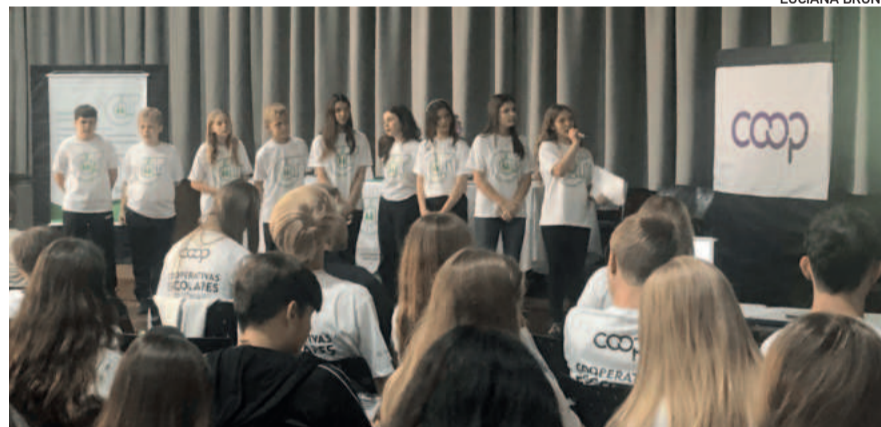
Assembleia ocorreu no auditório do CT