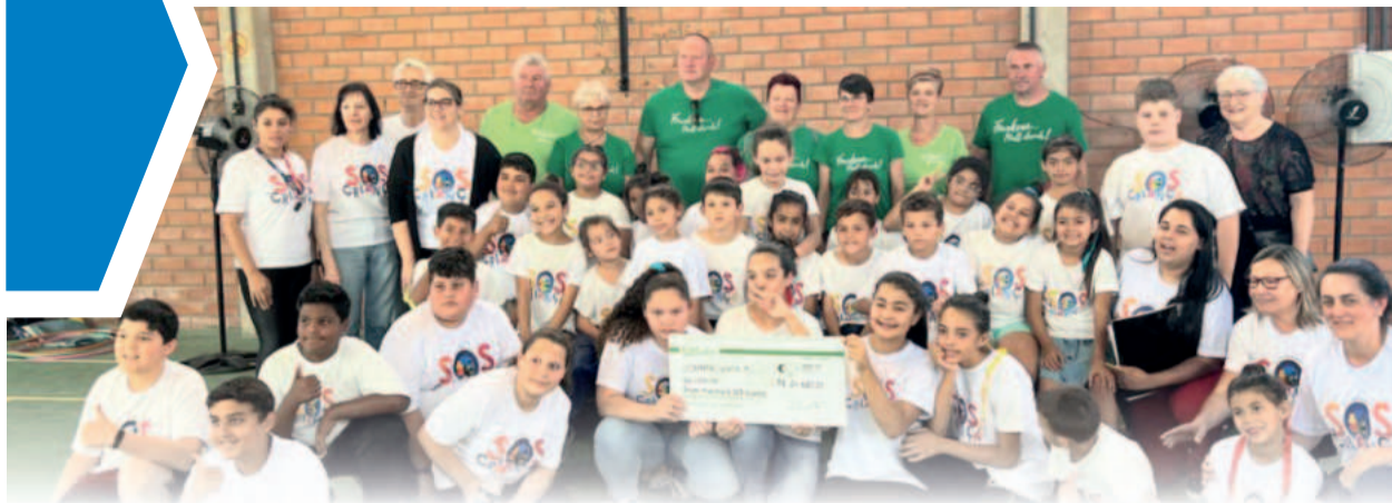
Em São Leopoldo, projeto SOS Criança foi contemplado