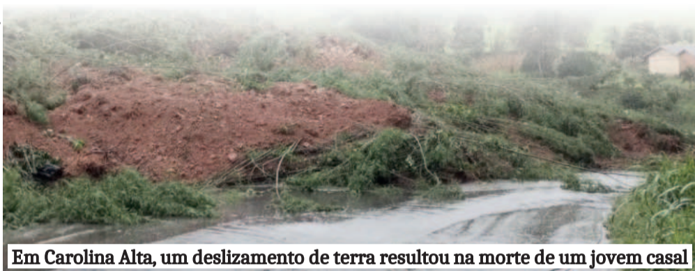
Em Carolina Alta, um deslizamento de terra resultou na morte de um jovem casal