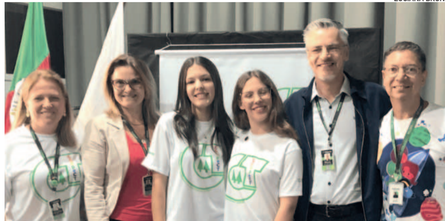
Presidente e vice com diretor, coordenação e professores