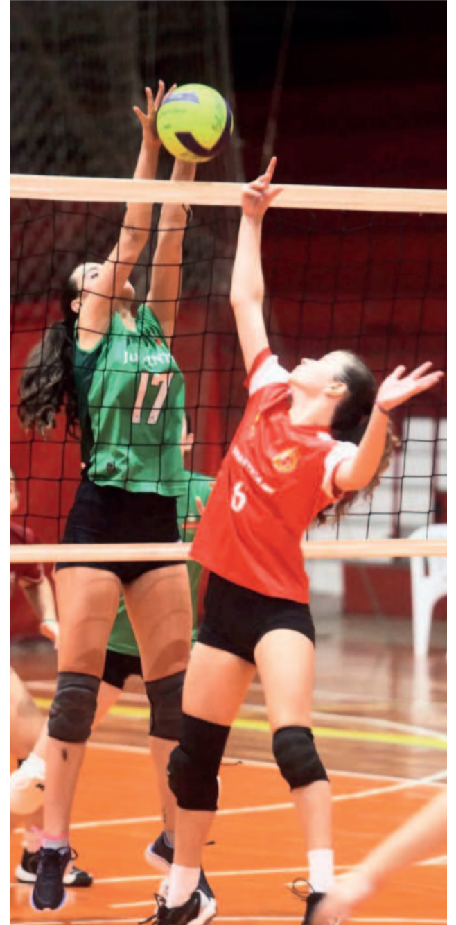
Jovens ganham a oportunidade de participar dos elencos da Juventus