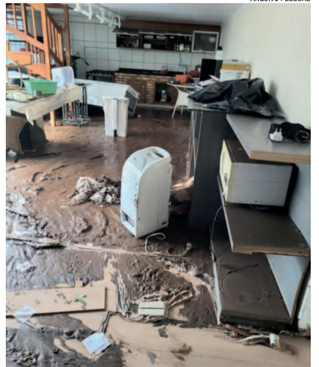
Somente em móveis, Nina calcula prejuízo de R$ 80 mil

Apesar dos desafios, a comunidade de Boa Vista do Sul segue unida na reconstrução e no aprendizado após a tragédia. O impacto emocional e estrutural das enchentes ainda é evidente, reforçando, assim, a necessidade de investimentos em prevenção e infraestrutura.