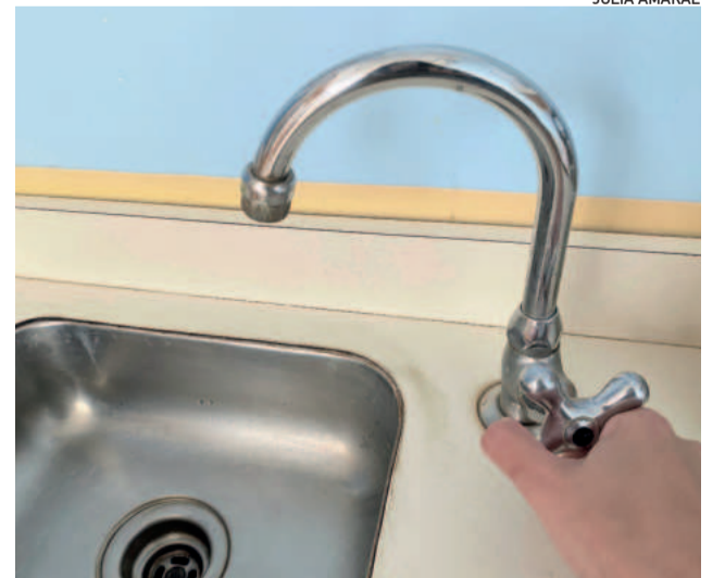
População local vive com a insegurança do abastecimento