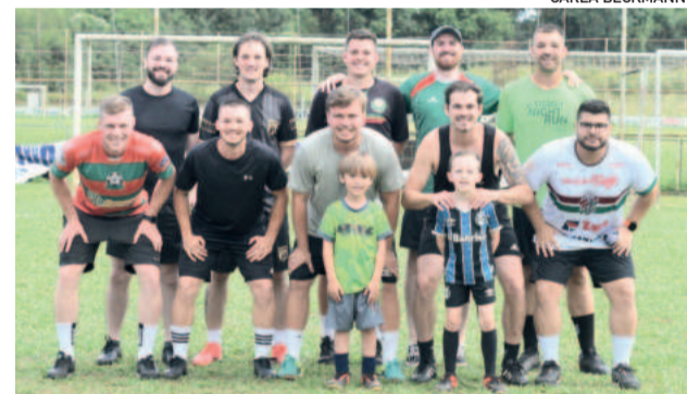
A campeã da taça Juventus foi a equipe composta por alunos nascidos nos anos de 1994, 1995, 1996, 1997 e 1998