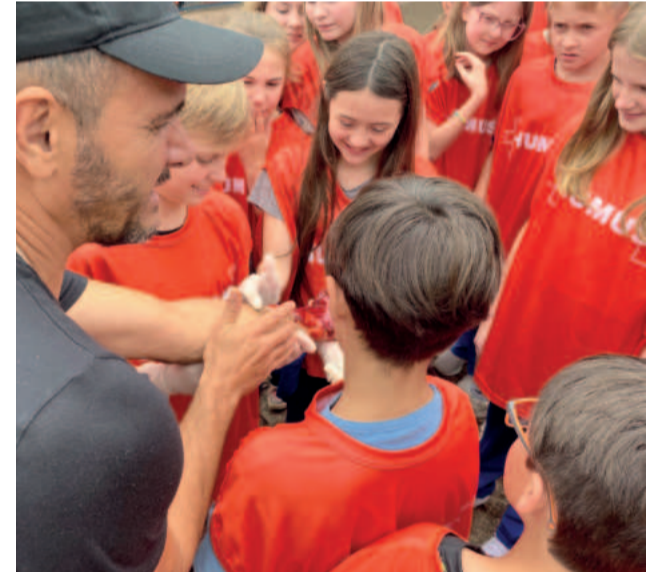
Atividade “Heróis do Futuro” foi desenvolvida com crianças de escolas de Colinas e Imigrante