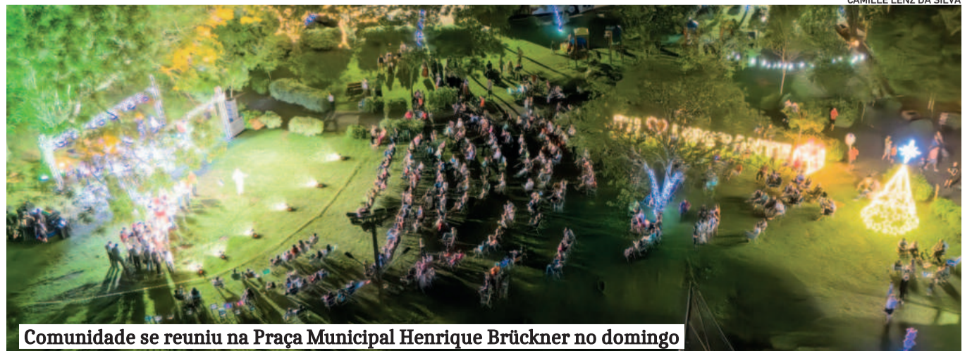
Comunidade se reuniu na Praça Municipal Henrique Brückner no domingo