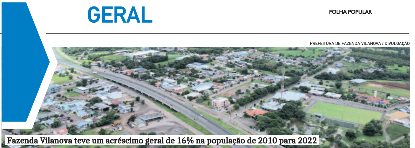
Fazenda Vilanova teve um acréscimo geral de 16% na população de 2010 para 2022

Então, se você ainda não experimentou alguma ferramenta de Inteligência Artificial, é momento de fazê-lo! A IA deverá ocupar lugar importante nos seus aparelhos. E o poder público? Bem, quem for mais rápido beberá água limpa!