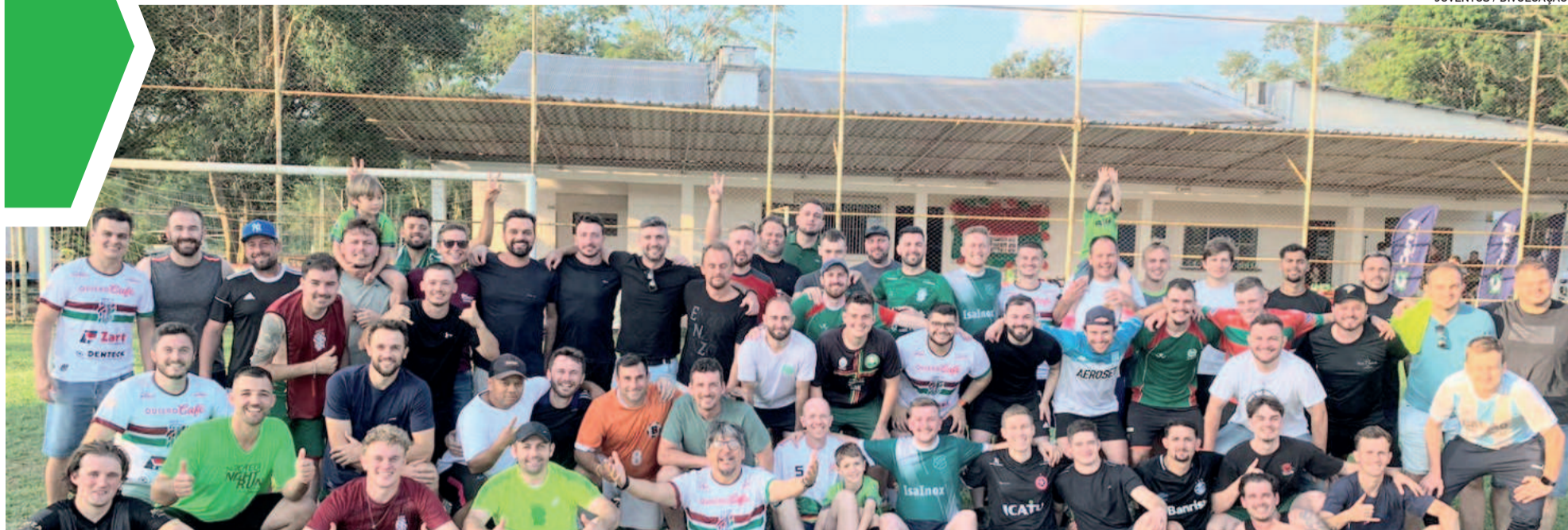
Dezenas de ex-alunos e gerações marcaram presença na Confraria Juventus