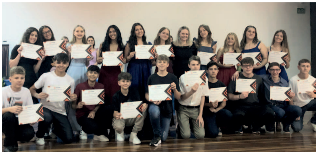
Formandos de Colinas