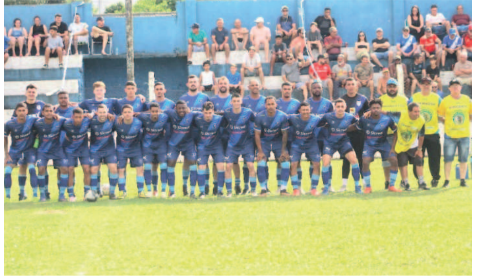
Para apresentar sua torcida, o Taquariense só pensa em ser campeão no domingo