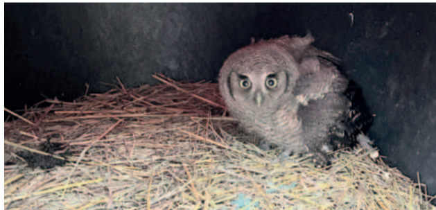
Presidente e bióloga indicam o que fazer em casos de resgate de animais silvestres