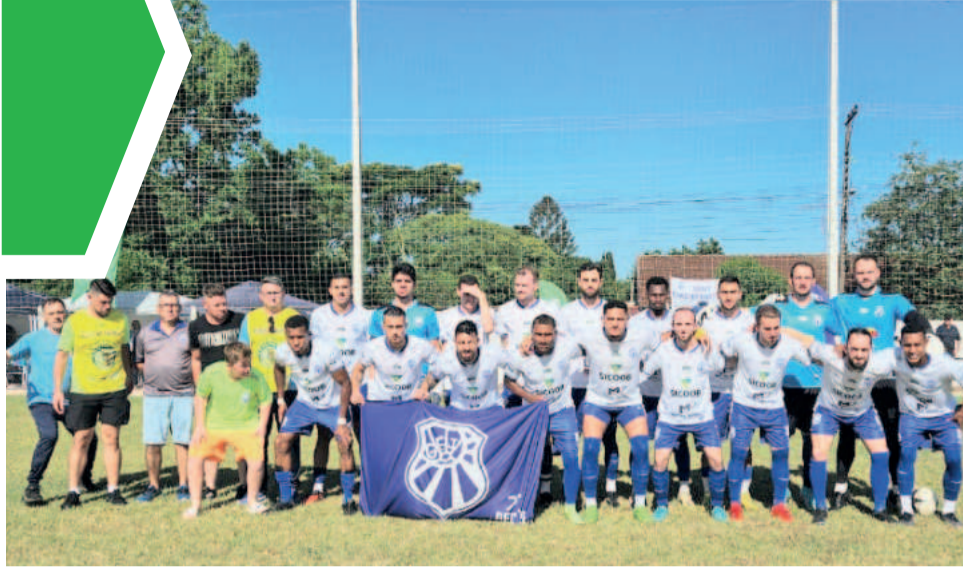
Apoiado por sua torcida, o Juventude quer ser campeão regional pela primeira vez