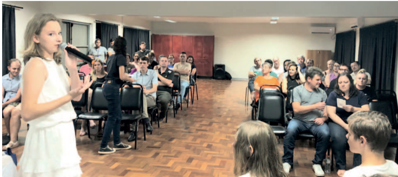
Formatura de Imigrante foi a primeira deste ciclo