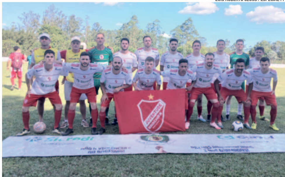
Para repetir o feito da primeira fase, o Juventude de Brochier quer vencer novamente fora de casa e jogar mais tranquilo no segundo jogo