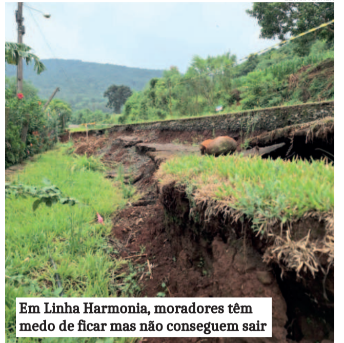
Em Linha Harmonia, moradores têm medo de ficar mas não conseguem sair