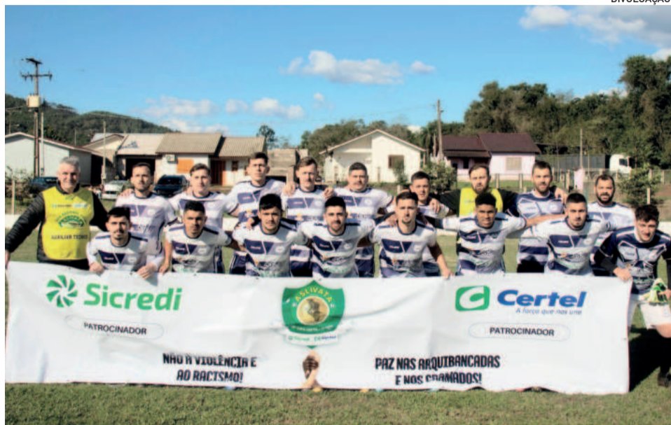
O Juventude teutoniense precisa vencer seu primeiro confronto contra os brochienses no ano para iniciar a decisão em vantagem