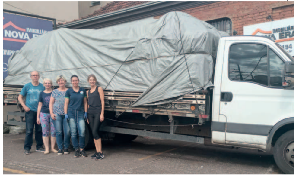
Arrecadação de tampinhas, lacres metálicos e aerossóis ultrapassou duas toneladas