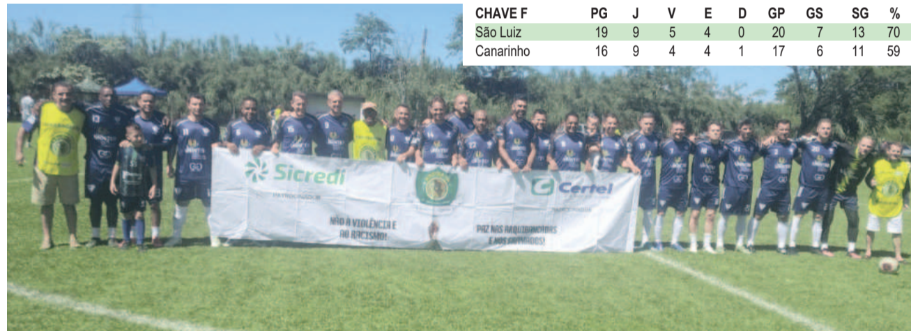
Com o empate em casa, o Canarinho busca resultado positivo na volta para se classificar