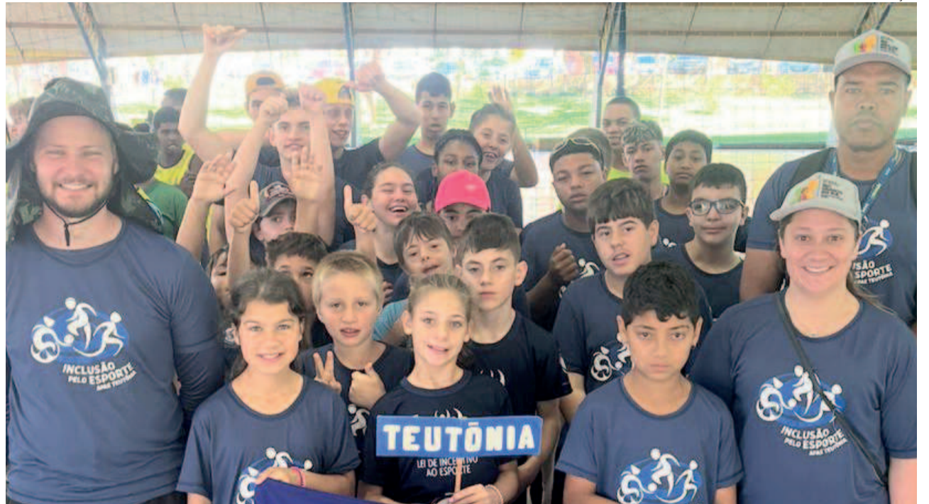
Apae de Teutônia classificou alunos e esteve presente em Lajeado