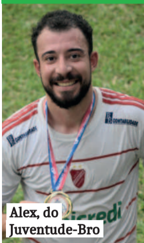
Alex, do Juventude-Bro