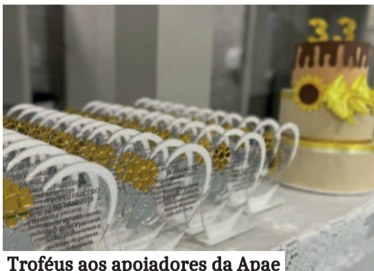
Troféus aos apoiadores da Apae

“ Acolhimento, é amor, é companheirismo, é como é que eu posso expressar de uma forma diferente, gratidão acima de tudo, né, mas acho que a palavra principal é amor. Para você trabalhar numa instituição como essa, você precisa ser muito além de profissional, você tem que ter também um grande coração ”