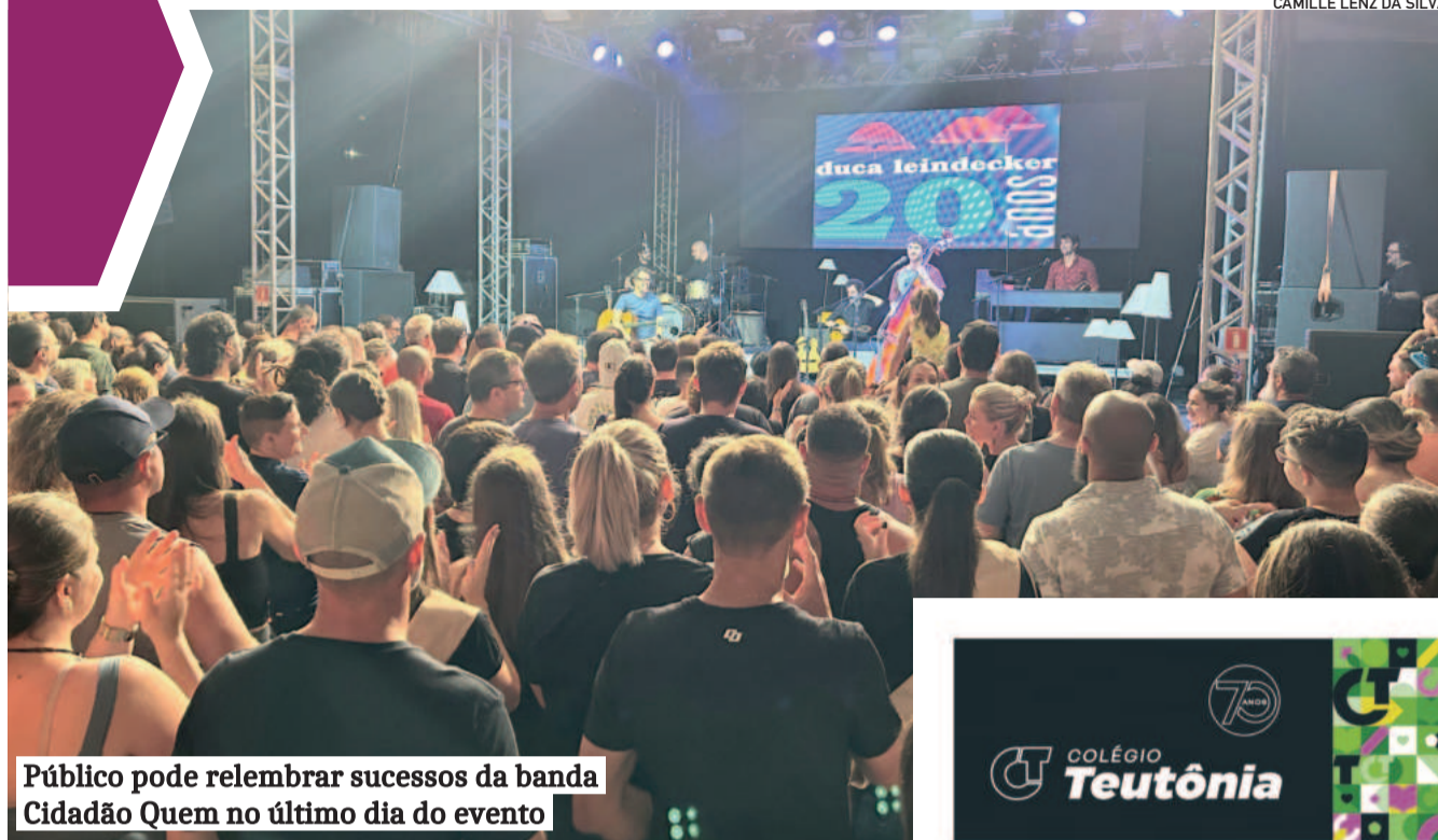
Público pode lembrar sucessos da banda Cidadão Quem no último dia do evento