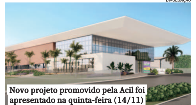
Novo projeto promovido pela Acil foi apresentado na quinta-feira (14/11)