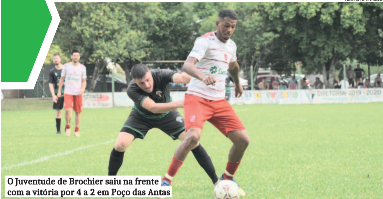
O Juventude de Brochier saiu na frente com a vitória por 4 a 2 em Poço das Antas