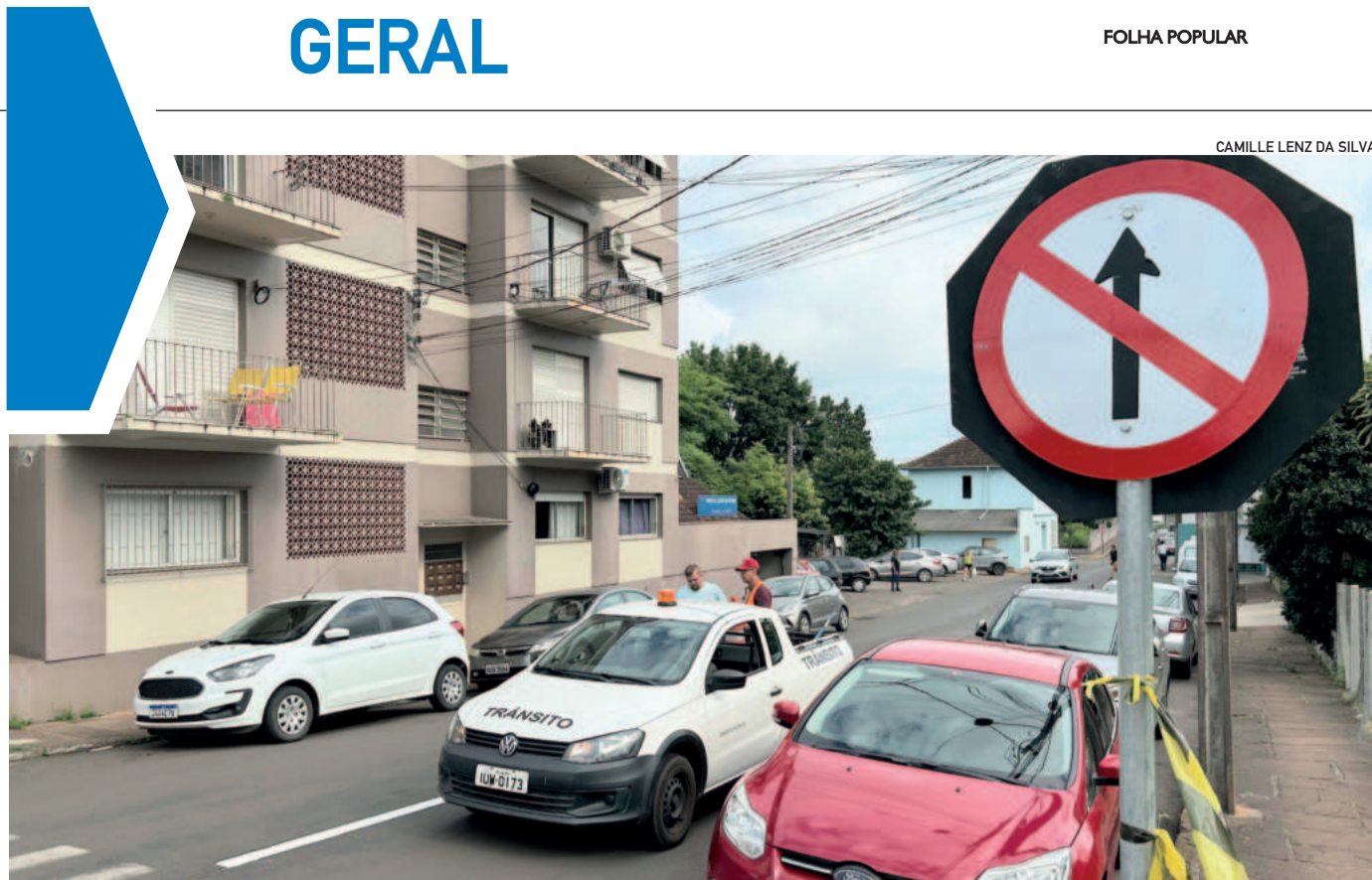
Alterações em três trechos no Bairro Languiru, antes de mão dupla, passaram a valer na segunda-feira