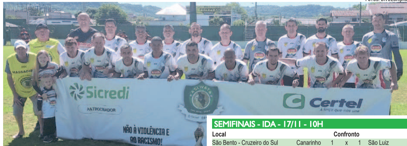
São Luiz ainda não venceu na fase de mata-mata da competição