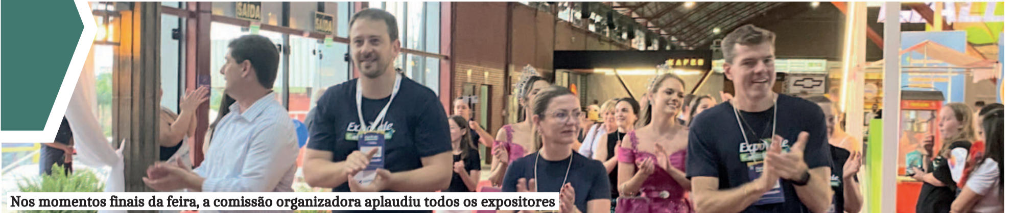
Nos momentos finais da feira, a comissão organizadora aplaudiu todos os expositores