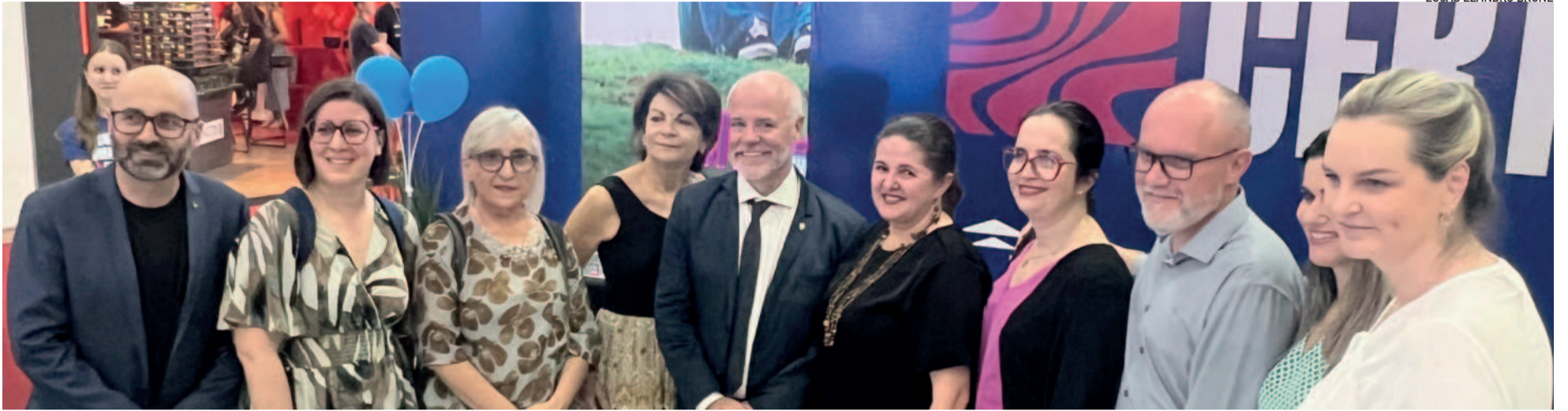
Comitiva do Vêneto e Univates celebraram parceria durante a Expovale + Construmóbil