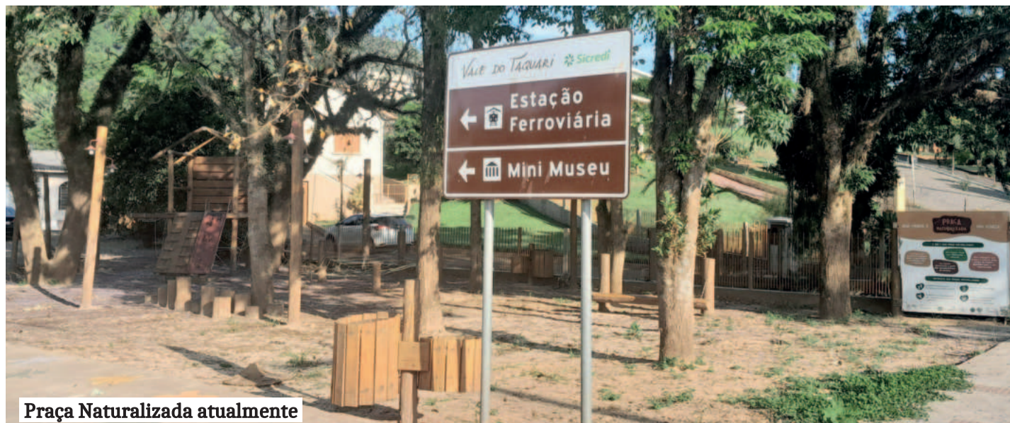
Praça Naturalizada atualmente

Protegendo seu patrimônio: A importância das coberturas de terceiros em seguros de automóvel