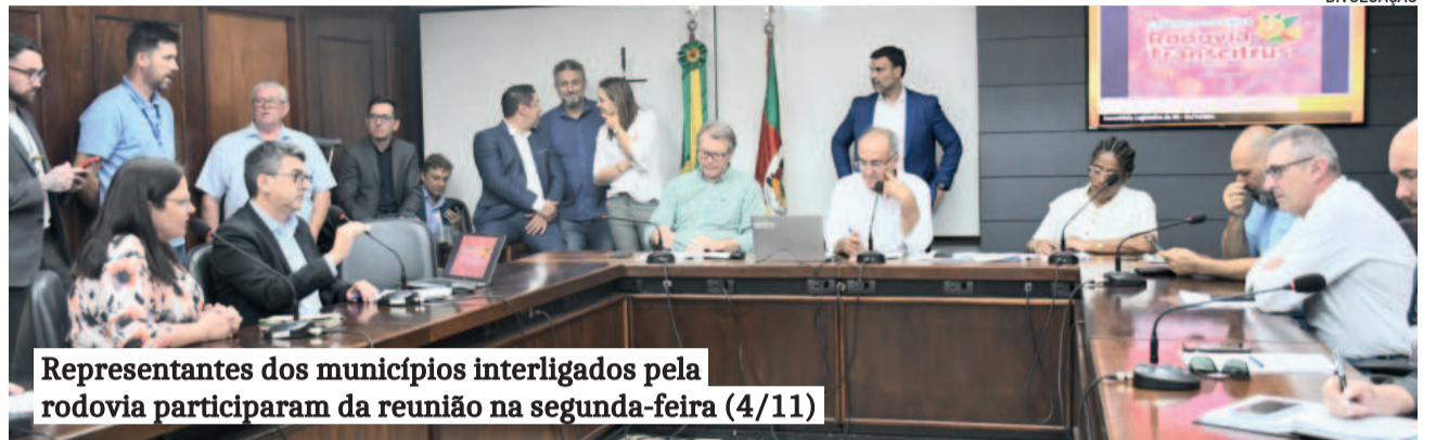
Representantes dos municípios interligados pela rodovia participaram da reunião na segunda-feira (4/11)