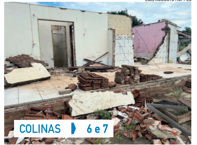
COLINAS ▶ 6 e 7

Seis meses após a tragédia no Vale do Taquari, Colinas ainda enfrenta seus efeitos. Somado à enchente de setembro de 2023, o município aguarda 65 casas, já aprovadas pela União. A reconstrução está em andamento, mas a burocracia dificulta a celeridade das obras. A saúde mental da população também foi impactada, e a prefeitura tem prestado apoio psicológico contínuo. A área rural sofreu grandes perdas, mas serviços de recuperação, como terraplenagem, calçadas e asfaltos estão em execução. A prevenção para futuras cheias inclui melhorias na comunicação e infraestrutura, bem como no desassoreamento do rio e arroios.