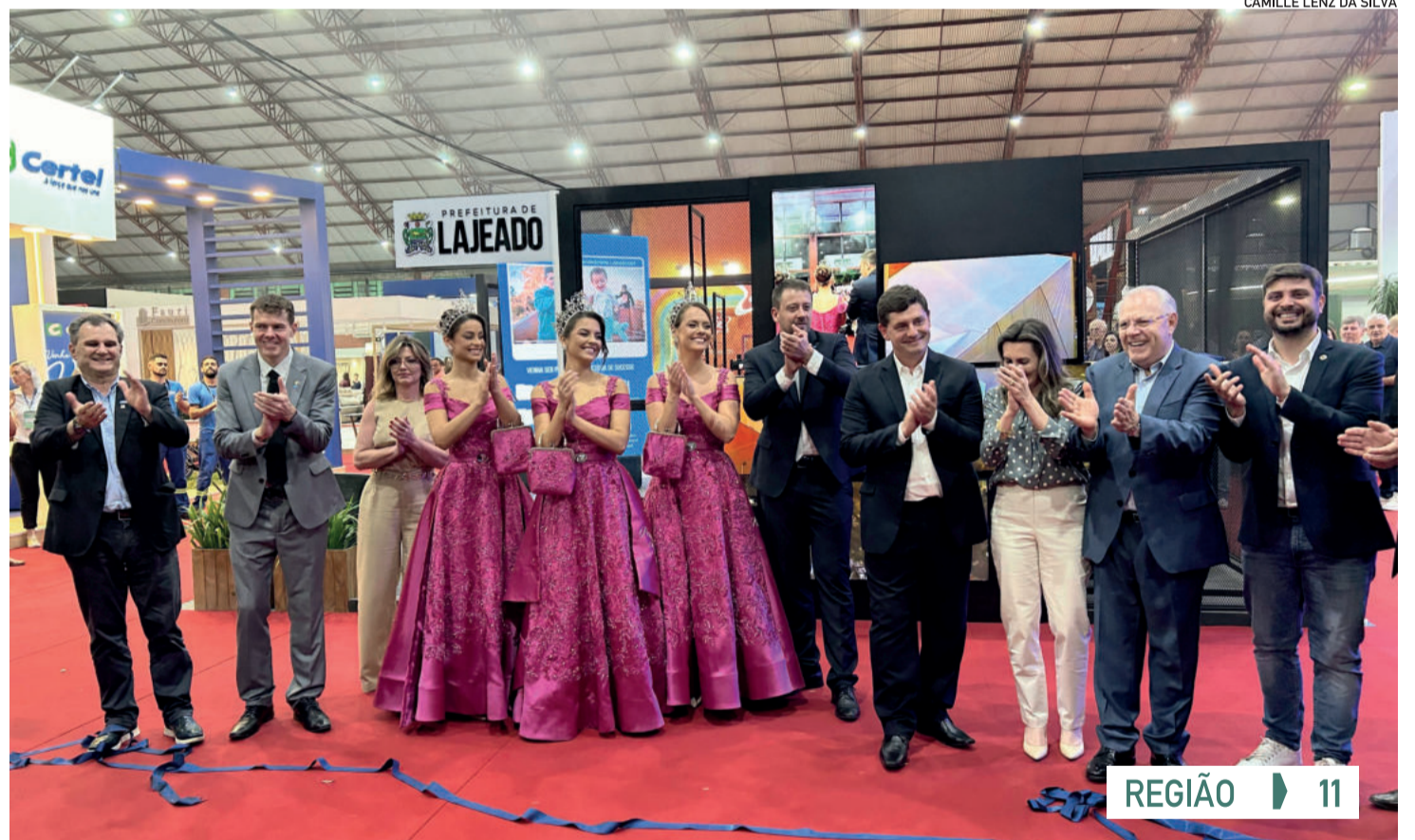
REGIÃO ▶ 11

A feira Expovale + Construmóbil 2024 reforça a resiliência do Vale do Taquari frente às adversidades. Autoridades destacam a importância do trabalho conjunto para impulsionar a economia local e recompor a região após as seguidas catástrofes climáticas. A Feira da Reconstrução, como é chamada, foi aberta na quinta-feira (7/11) e espera ultrapassar a edição anterior, que teve mais de 102 mil visitantes. Durante 9 dias, 400 expositores terão a oportunidade de vender, prospectar parcerias, atrair investimentos e inovar. A grande presença do público no primeiro dia de feira mostra a aceitação do evento e o anseio da comunidade por retomar os velhos costumes. A cultura e o turismo também têm espaços privilegiados para mostrar sua pujança, potencial e relevância crescente no mercado regional. O Grupo Popular apoia esse e outros movimentos de retomada, confiando na capacidade de resiliência da nossa região.