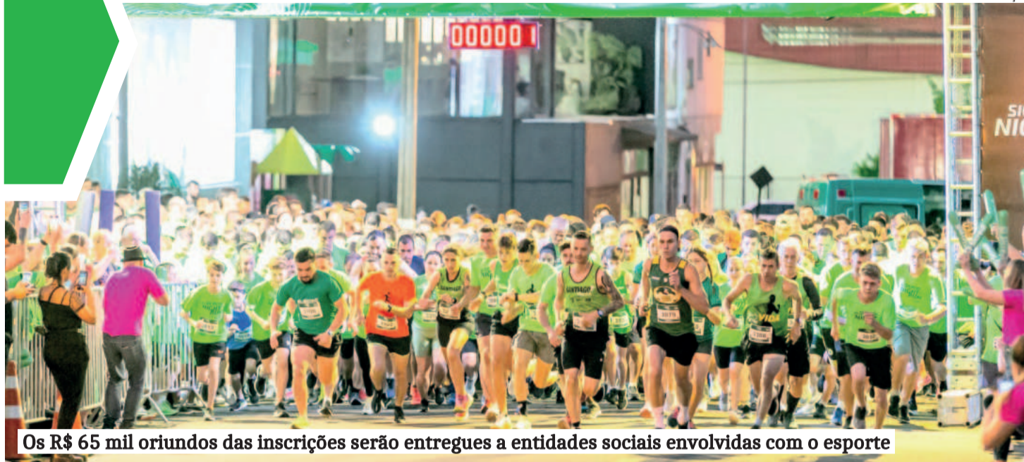
Os R$ 65 mil oriundos das inscrições serão entregues a entidades sociais envolvidas com o esporte