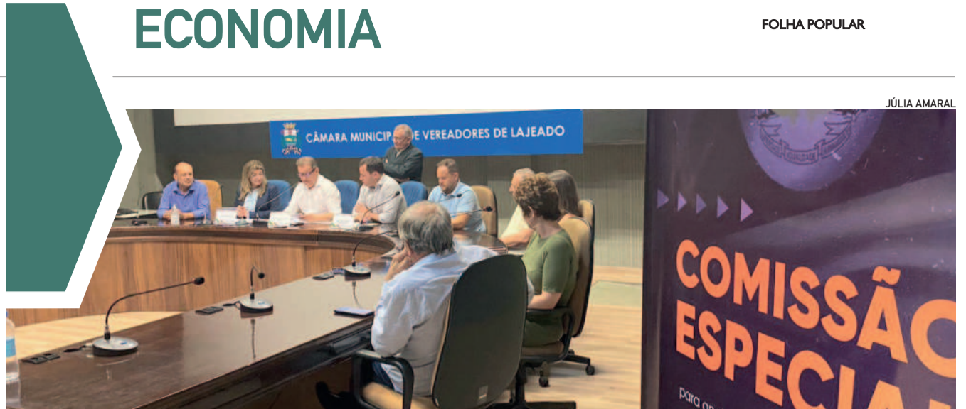
Audiência pública ocorreu na Câmara de Vereadores de Lajeado na noite de quarta-feira (6/11)