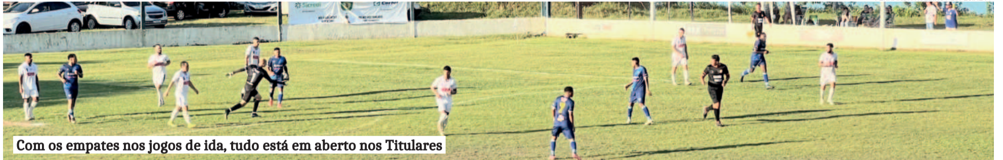
Com os empates nos jogos de ida, tudo está em aberto nos Titulares