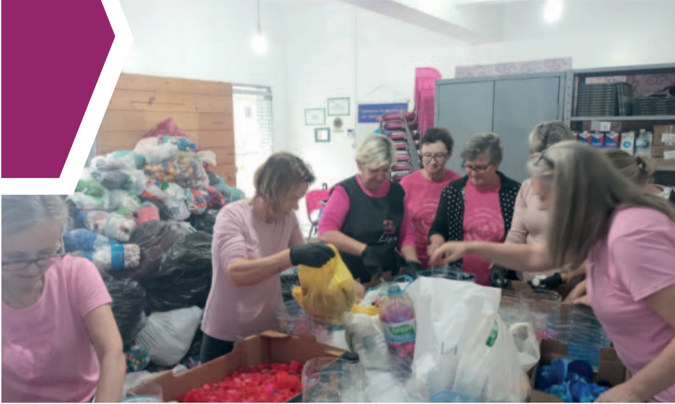
Arrecadação de tampinhas, lacres metálicos e aerossóis ultrapassou duas toneladas