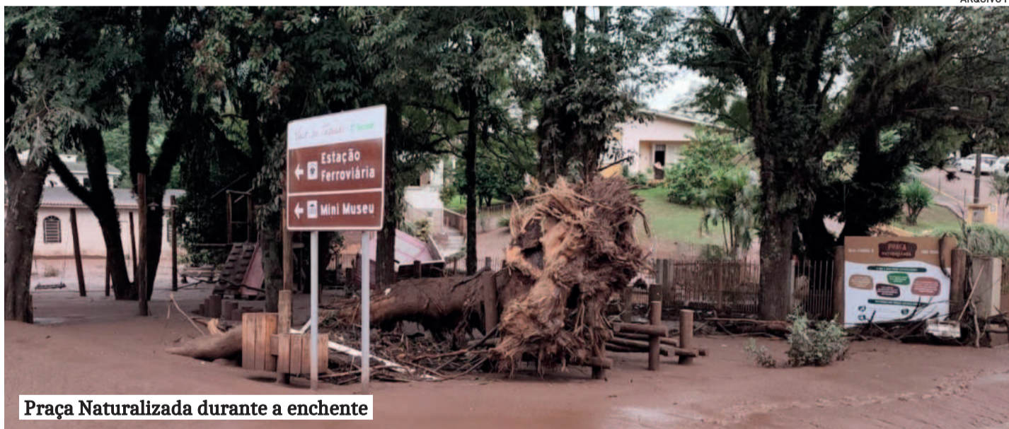
Praça Naturalizada durante a enchente