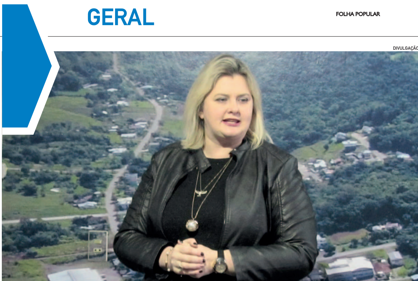
A professora já esteve no cargo entre 2016 e 2019

Antes que nos precipitemos... Deixemos os órgãos competentes trabalharem. Mas, as defesas estão afiadas, com argumentos, mais de 50 testemunhas e de olho em prazo de prescrição.