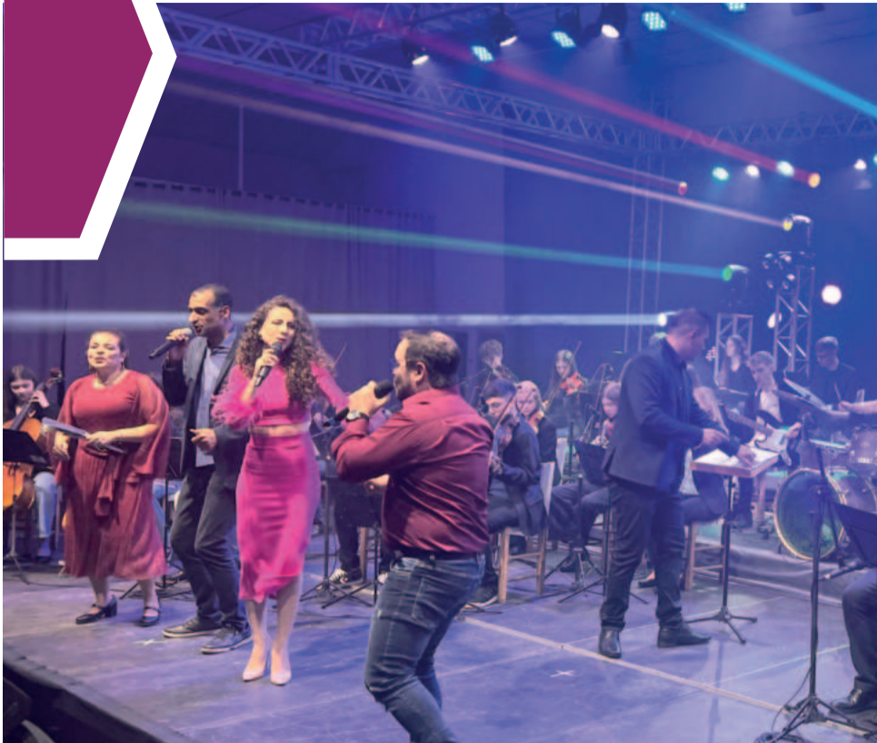
Cantores convidados cantaram sucesso de Roupas Nova com o Conjunto Instrumental do CT