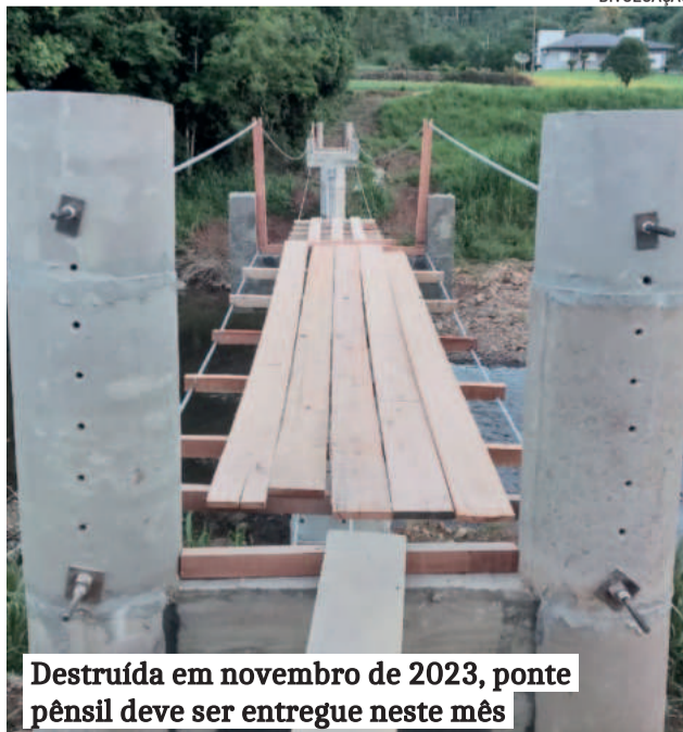
Destruída em novembro de 2023, ponte pênsil deve ser entregue neste mês

Auxílio-Reconstrução encaminhado a 36 famílias