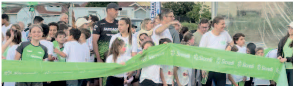
Pais e filhos unidos pela corrida