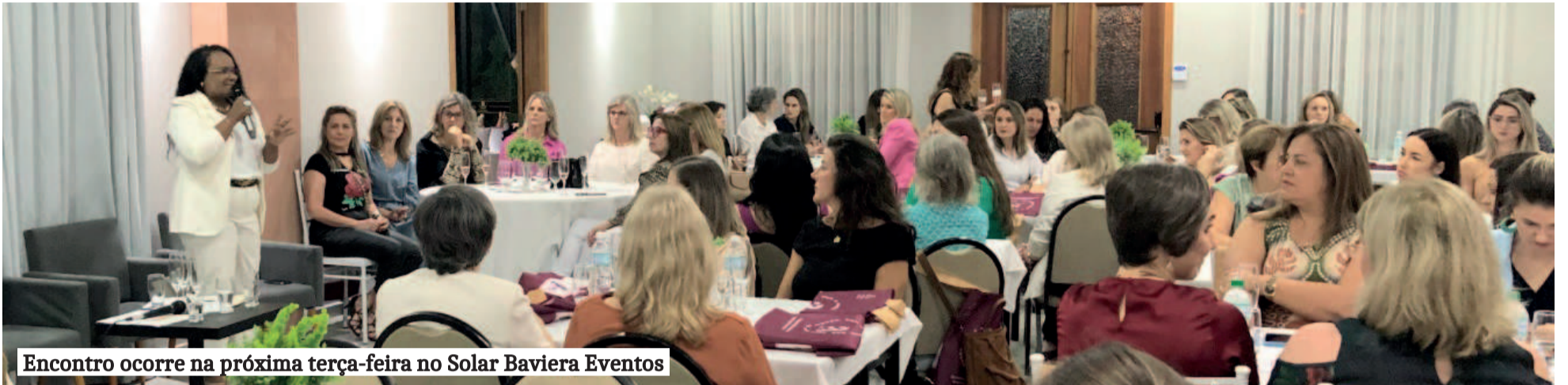
Encontro ocorre na próxima terça-feira no Solar Baviera Eventos