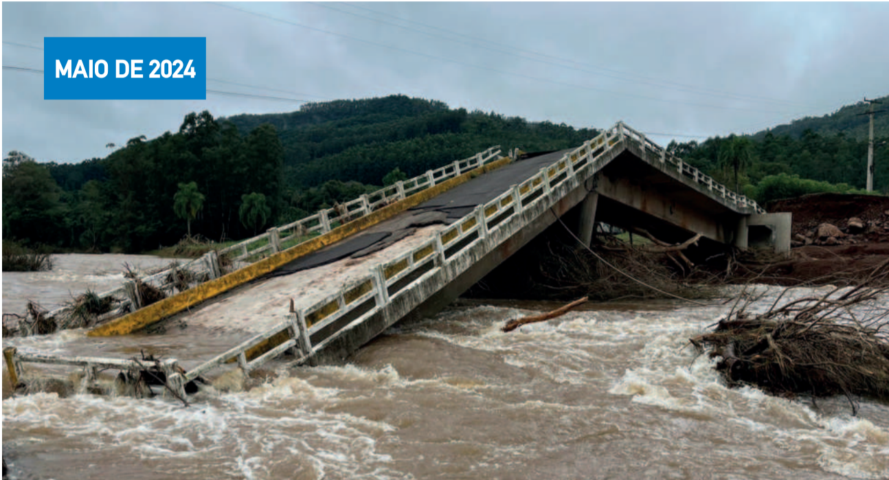
Ponte na Comunidade Mãe de Deus em maio