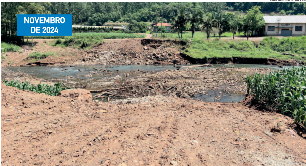
Nova ponte tem empenho de R$ 1,6 milhão pelo Governo Federal