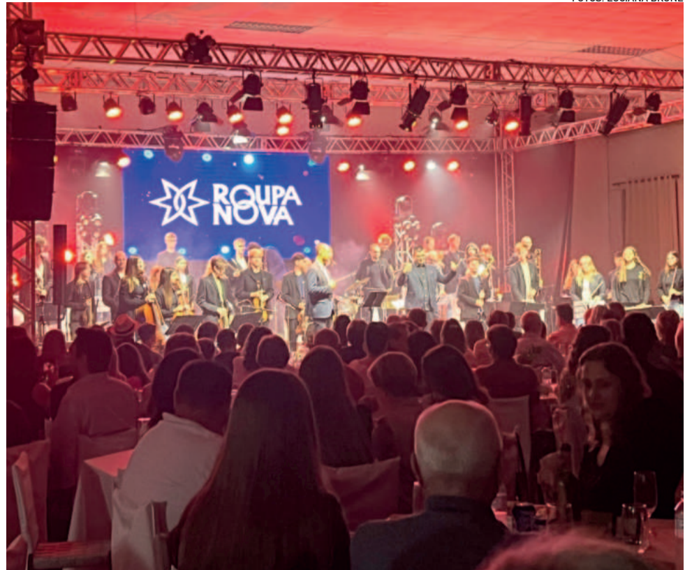
Especial Roupas nova encantou o público em Teutônia

TEUTÔNIA ▶ “VOU GRITAR PRA TODO MUNDO OUVIR”