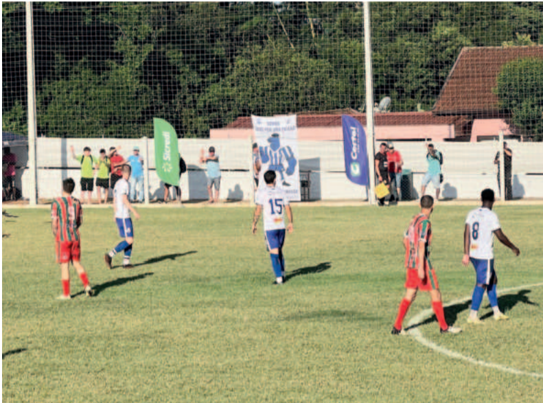
FERNANDA KOLLING / ESPECIAL FP