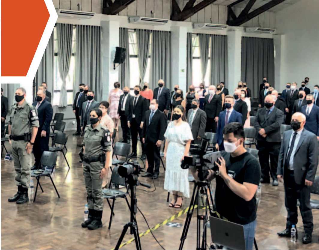
Em 2020, diplomação ocorreu de forma virtual, respeitando regras de distanciamento devido à Covid-19

REGIÃO ▶ 125ª, 21ª E 29ª ZONAS ELEITORAIS