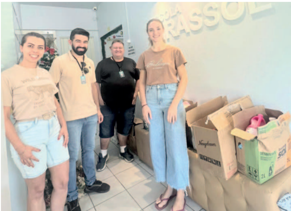
Escola Girassol, de Teutônia, recebeu a equipe do Grupo Popular na tarde de quinta-feira (5/12)