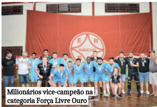
Milionários vice-campeão na categoria Força Livre Ouro

Na decisão da Série Ouro do Força Livre, Os Guri da 24 derrotaram o Milionários por 7 a 3. O Milio-