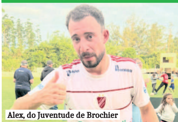
Alex, do Juventude de Brochier