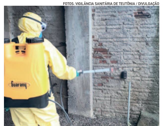
Aplicação de inseticida na cidade é feita três vezes na semana