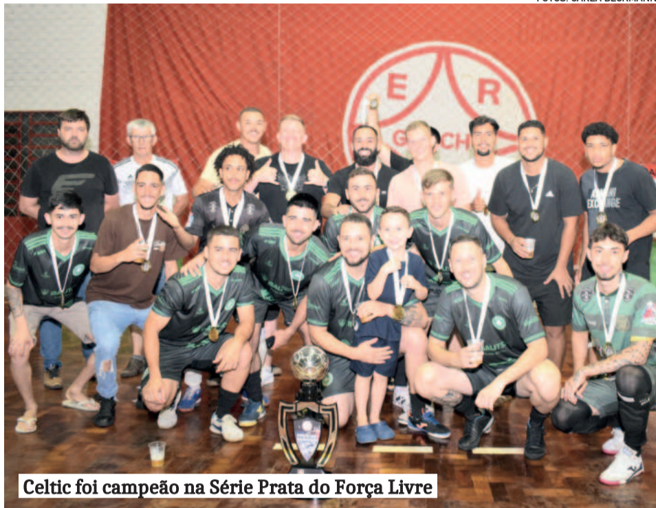
Celtic foi campeão na Série Prata do Força Livre