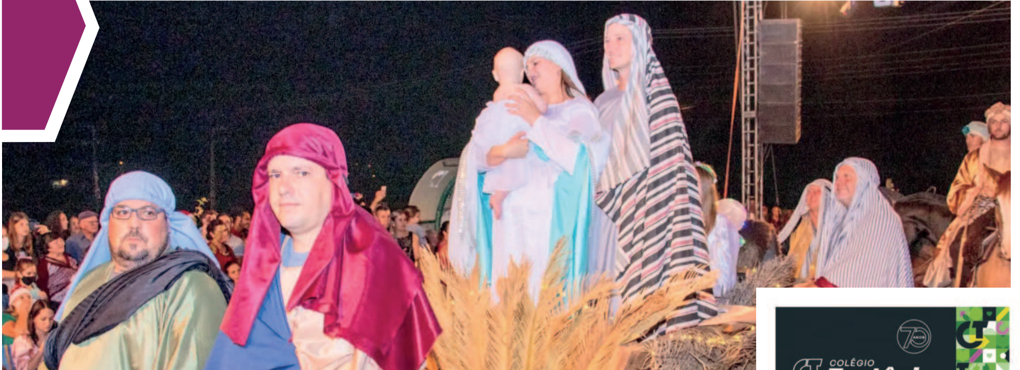
Eventos ocorrerão em Westfália, Colinas, Poço das Antas, Imigrante e Teutônia