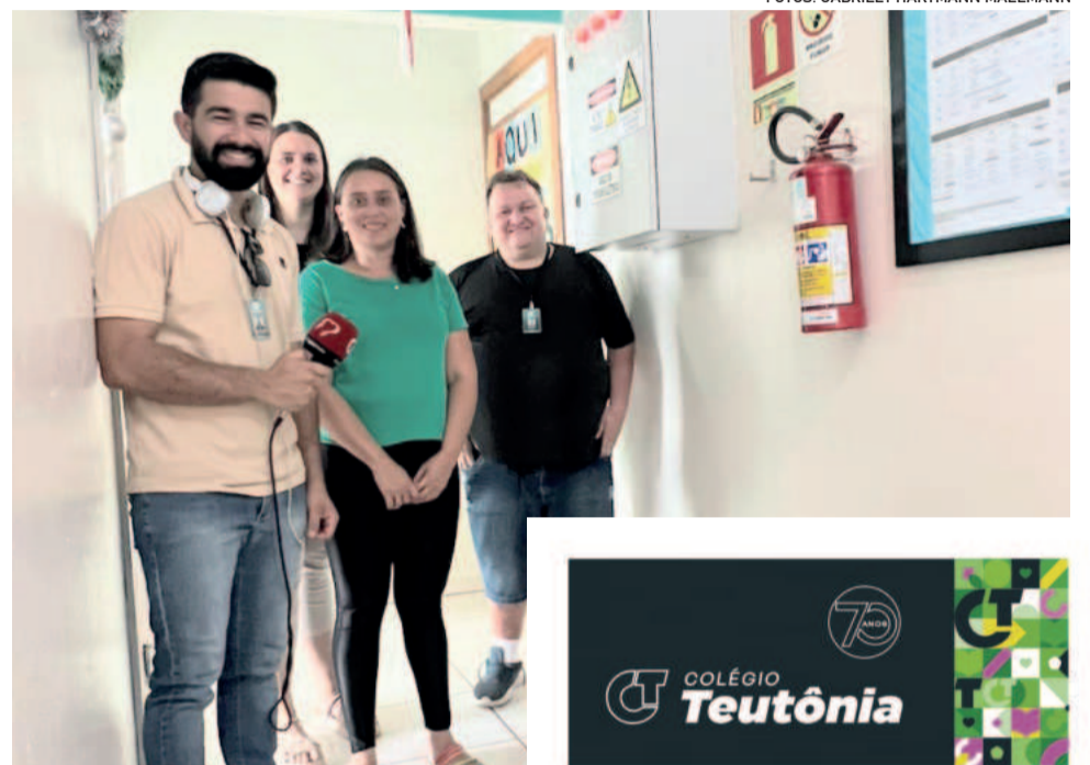
Hospital Roque Gonzales, de Roca Sales, está em reformas, mas em funcionamento. A equipe da Popular foi recebida na quinta-feira (5/12)