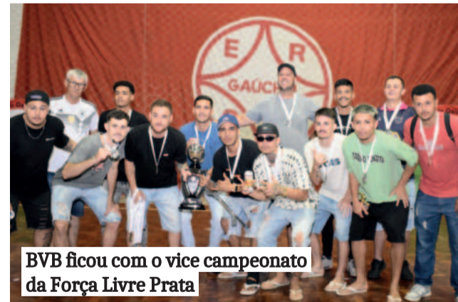
BVB ficou com o vice campeonato da Força Livre Prata