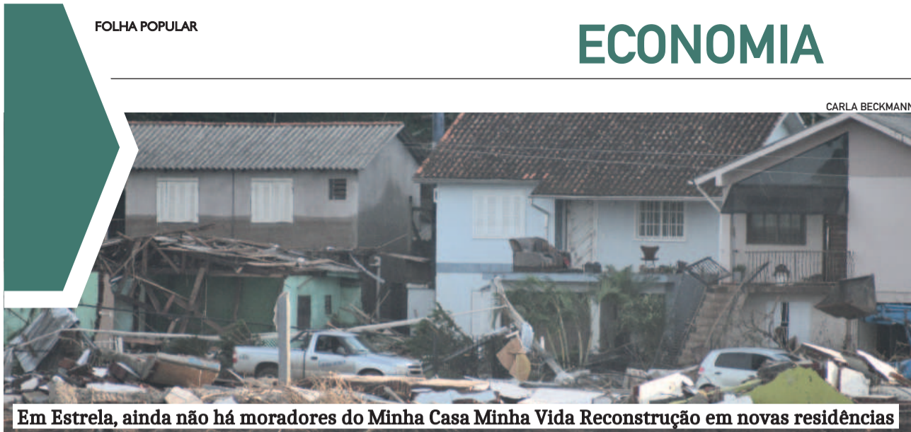
Em Estrela, ainda não há moradores do Minha Casa Minha Vida Reconstrução em novas residências