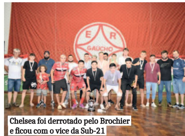
Chelsea foi derrotado pelo Brochier e ficou com o vice da Sub-21

Após o encerramento das partidas, a organização entregou a premiação aos destaques da competição, celebrando o sucesso do campeonato.