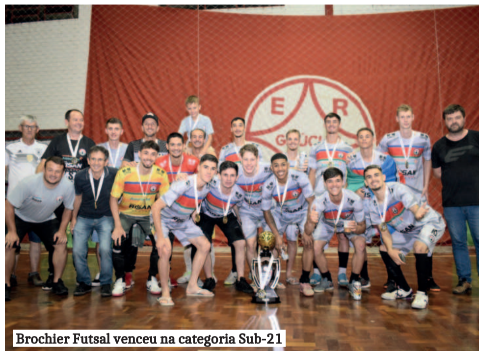
Brochier Futsal venceu na categoria Sub-21