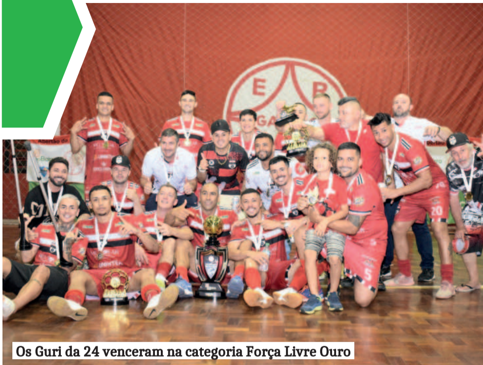
Os Guri da 24 venceram na categoria Força Livre Ouro