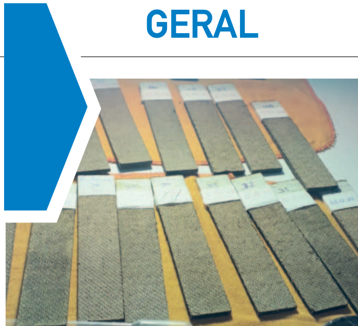
Análise do recolhimento de armadilhas referente a dezembro iniciou nesta terça-feira e segue até hoje

No mundo acelerado em que vivemos, respostas rápidas e claras fazem a diferença. Não procrastine. O retorno demonstra que você valoriza a comunicação e está disposto a colaborar. Afinal, comprometimento não se mede apenas pelo que fazemos, mas pelo respeito que mostramos às demandas dos outros. Que tal revisar suas mensagens agora mesmo e começar a praticar?