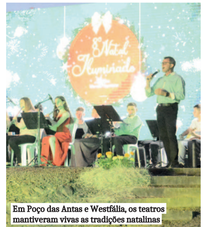
Em Poço das Antas e Westfália, os teatros mantiveram vivas as tradições natalinas

O 8º Natal Iluminado culminou com a chegada do Papai Noel na sua casa móvel, montada sobre um caminhão iluminado, com direito a neve e bolhas de sabão para a alegria da criançada. O evento, já consolidado como uma tradição no município, reforça o espírito de confraternização e mantém viva a magia do Natal em Westfália, sendo também uma oportunidade para que o público prestigie a ornamentação natalina.