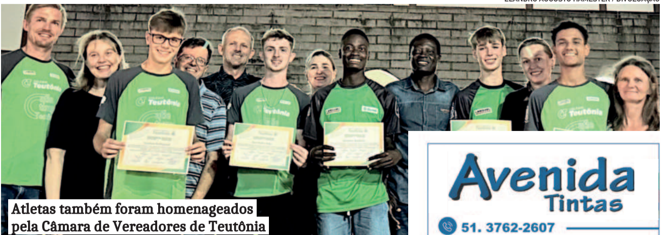
Atletas também foram homenageados pela Câmara de Vereadores de Teutônia