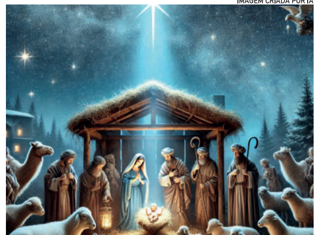
IMAGEM CRIADA POR IA