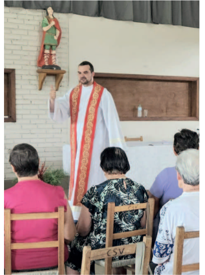
Na igreja católica, a preparação é compartilhada entre a comunidade durante todo o mês

Com significados diversos e manifestações culturais distintas, o Natal transcende barreiras religiosas. Seja em um templo, em uma celebração familiar ou em um momento de introspecção, a data nos lembra da importância de refletir sobre o amor, o perdão e a fraternidade: pilares que unem todos os povos e tradições.