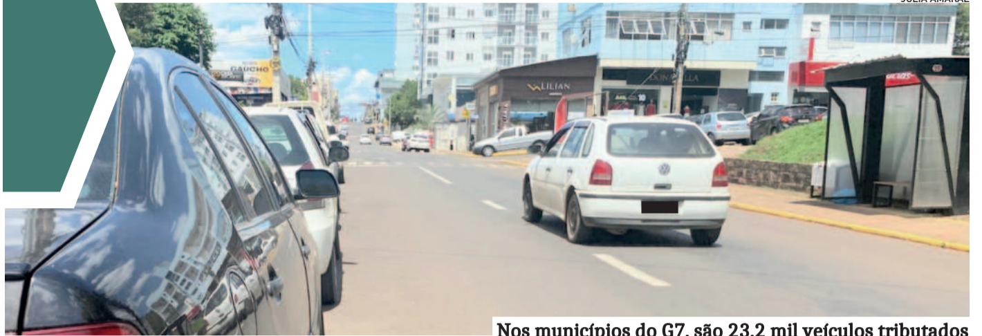
Nos municípios do G7, são 23,2 mil veículos tributados

“Então é Natal, e o que você fez?” Talvez, a frase/pergunta mais adequada para a realidade de muitas pessoas/empresas é: “Então é Natal, e o que você vai fazer?” A cooperação se apresenta como aliada para você alcançar êxito nessa metamorfose comportamental pessoal e/ou empresarial. De qualquer forma, independente do que fez ou ainda vai fazer, desejo a você um Feliz Natal!