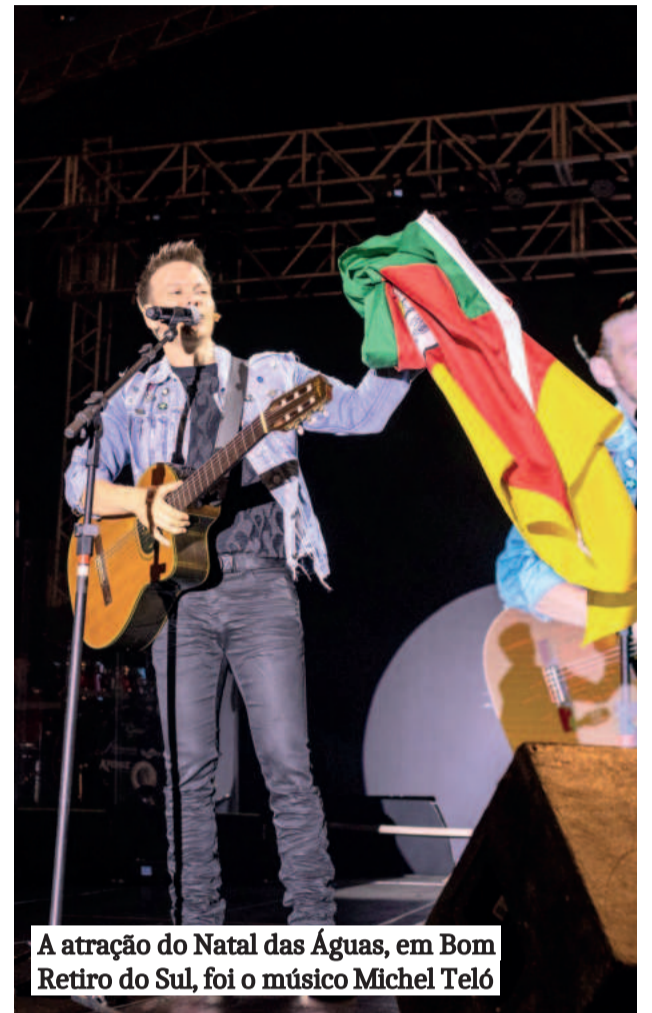
A atração do Natal das Águas, em Bom Retiro do Sul, foi o músico Michel Teló

No fim de novembro, Estrela deu início à programação natalina com a realização do primeiro sorteio da campanha Estrela Premiada. A iniciativa, desenvolvida em parceria com a Cacis e o Sicredi, entregou R$ 42 mil em prêmios, divididos em três sorteios. Durante a abertura do evento, foi feito o acendimento oficial das luzes de Natal. Entre a programação natalina ao longo do mês de dezembro, o Caminhão da Esperança, com a apresentação "Natal da Reconstrução", e a Caravana e Trupe de Natal animaram os bairros.