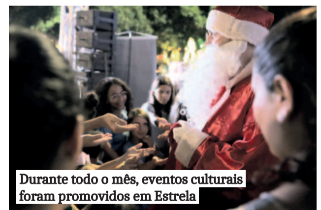
Durante todo o mês, eventos culturais foram promovidos em Estrela

Tradicional na região, a 16ª edição do Natal nas Águas trouxe para Bom Retiro do Sul o cantor Michel Teló na noite de sábado (21/12). A Barragem Eclusa ficou lotada, com público emocionado pela apresentação do músico e, posteriormente, com a queima de fogos. A entrada foi 1 quilo de alimento não perecível, resultando na doação de aproximadamente 3,5 mil quilos às famílias do município atendidas pelo Cras.