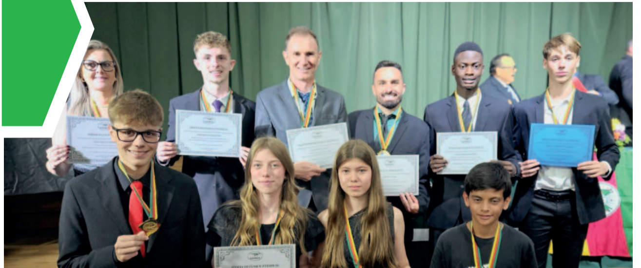
Alunos e professores foram reconhecidos na 22ª edição do Troféu Faergs, realizada em São Leopoldo

Com a desistência quase certa de Pedro Caixinha, com vários nomes sendo especulados, quem será o novo treinador do Grêmio? Eu como torcedor gostaria de ver Cuca novamente na casamata. E você, torcedor, quem gostaria de ver no comando do nosso tricolor?