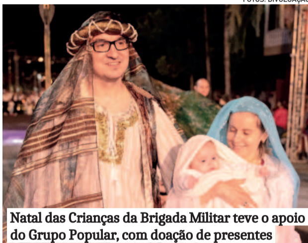
Natal das Crianças da Brigada Militar teve o apoio do Grupo Popular, com doação de presentes