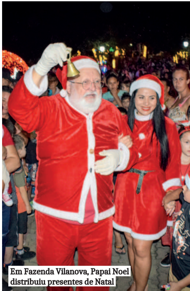
Em Fazenda Vilanova, Papai Noel distribuiu presentes de Natal

Nesta sexta-feira (20/12), chegaram ao fim as celebrações do Natal + Brilhante de Fazenda Vilanova. O encerramento foi no Parque Municipal Encanto da Fazenda, com sorteio da Nota Premiada, distribuição de pacotinhos com Papais Noéis, show de fogos e apresentações musicais com a Banda Márcio Lima e Marca Missioneira, além da Banda Dead Masters . As festividades, organizadas em parceria com escolas, entidades e apoiadores, marcaram o espírito natalino no município. As atividades encerraram com show de fogos.