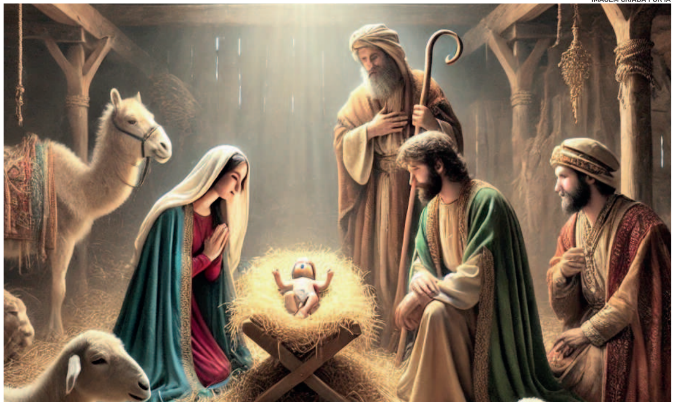
IMAGEM CRIADA POR IA

Se você sente um vazio em seu coração, deixe que Deus o preencha. Se até hoje você viveu a sua vida pensando que ninguém te ama, saiba que Jesus te ama! E o que Ele promete, cumpre! Feliz Natal.