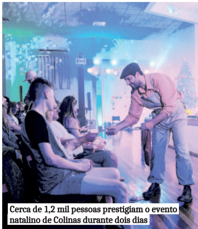
Cerca de 1,2 mil pessoas prestigiam o evento natalino de Colinas durante dois dias