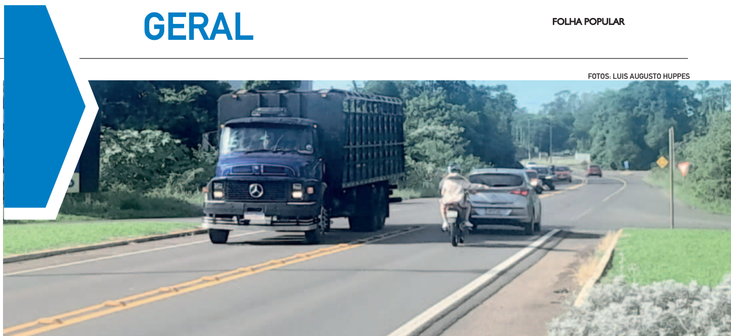
Duplicação chega até o trevo da Lactallis, nos bairros Languiru e Alesgut

No fim, as festas de fim de ano nos lembram que a vida é feita de ciclos. Aproveite este momento para abraçar o que foi bom, perdoar o que precisa ser deixado para trás e renovar suas esperanças para o futuro. Que o amor, a paz e a gratidão sejam os pilares que sustentem não apenas o encerramento deste ano, mas também o início de um novo capítulo cheio de possibilidades.