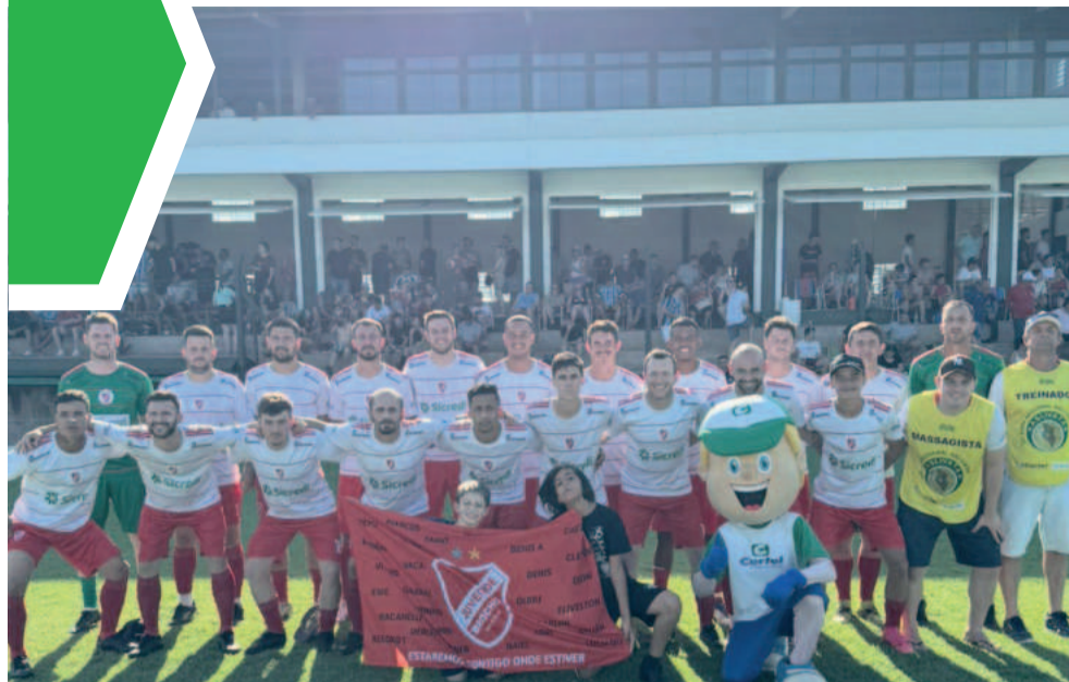
O empate fora de casa não foi de agrado para a comissão brochiense