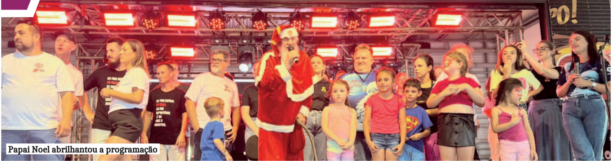
Papai Noel abrilhantou a programação