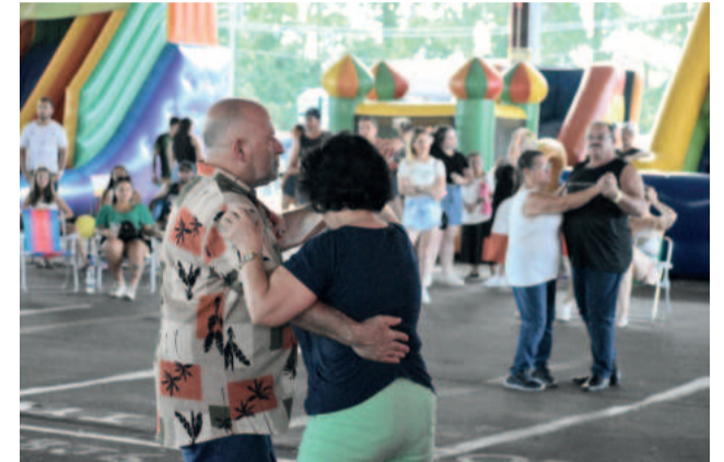
Casais se divertiram dançando diferentes ritmos