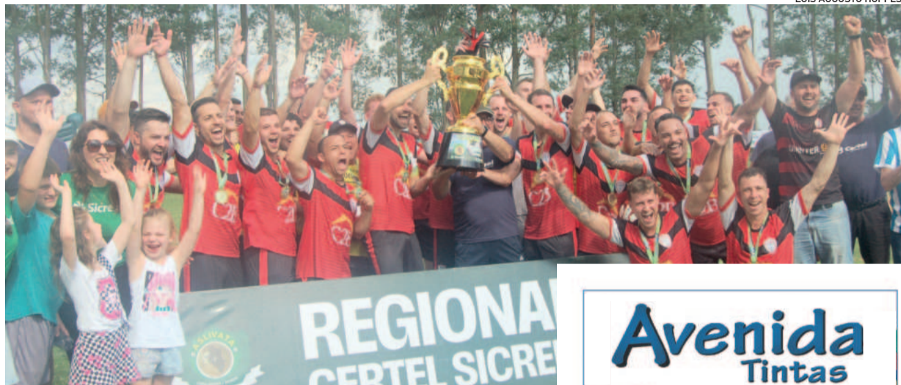
Com campanha invicta, o Estudantes é o grande campeão regional