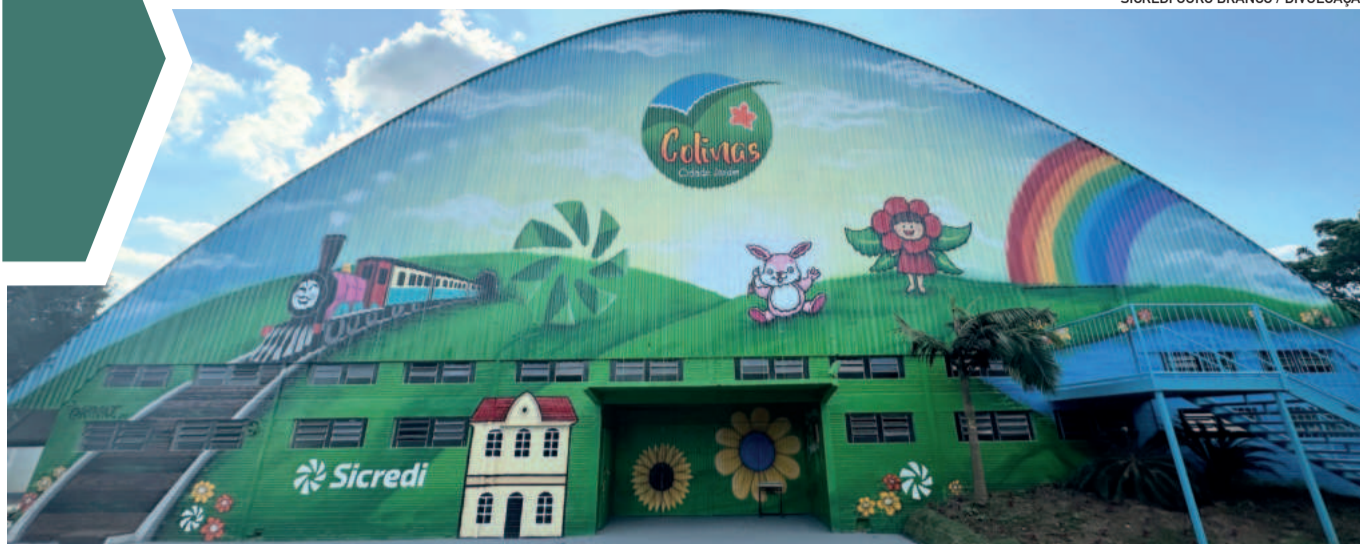
Entre os projetos contemplados esteve o Ginásio Municipal de Colinas