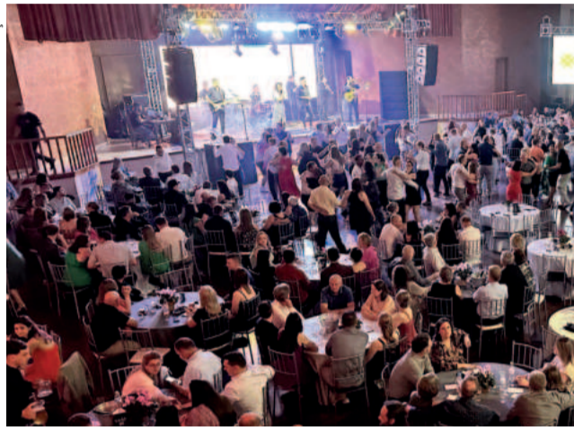
Evento teve animação da Banda Sétimo Sentido