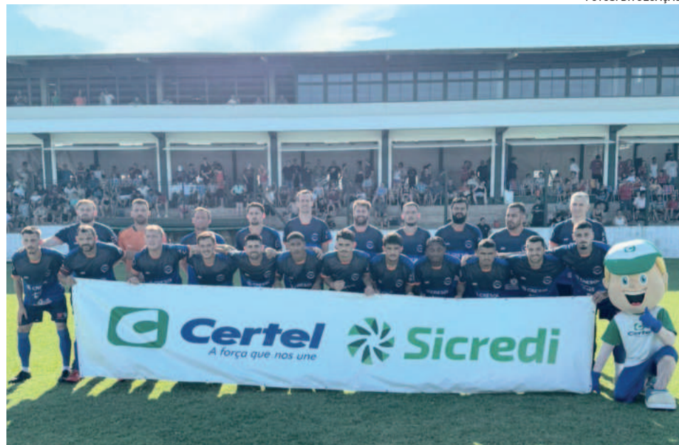
O Juventude de Teutônia perdeu a oportunidade de sair com um resultado positivo jogando junto de seu torcedor