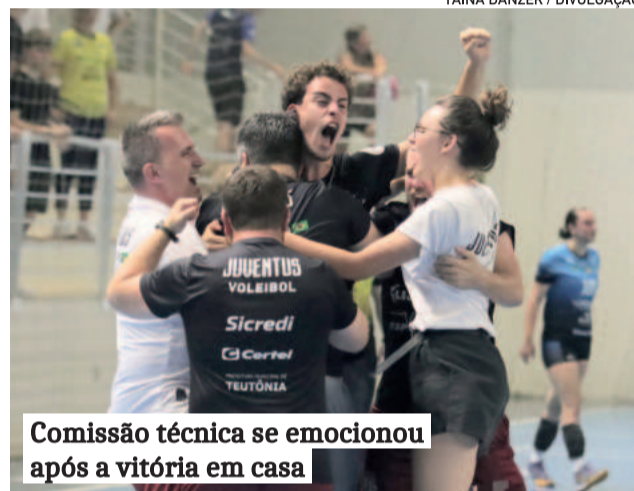
Comissão técnica se emocionou após a vitória em casa

A vitória coroa uma temporada incrível para a Juventus, que já havia conquistado o Torneio Início da Federação Gaúcha Sub-19 e segue acumulando troféus em diversas categorias. Além disso, o clube celebra um ano especial, marcado pelo projeto Adulto, que estreou na Superliga C, e pelos 30 anos de história no esporte. Neste sábado (7/12), a equipe Infantil disputa a etapa final do Estadual Série Ouro. Os jogos serão em Caxias do Sul. A Juventus encara o Recreio da Juventude, de Caxias do Sul, e o Vôlei Nova Petrópolis. E na terça-feira (10/12), a equipe Infantil volta à quadra para disputar o título da Copa Cláudio Braga contra a Apaavôlei. O confronto será na Associação da Água, em Teutônia, a partir das 19 horas.