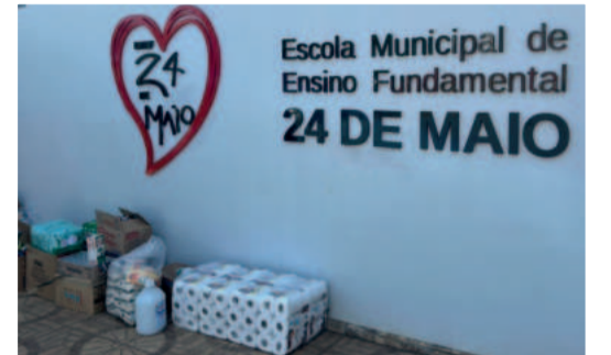
Famílias da Escola 24 de Maio receberão doações do Natal do Povo