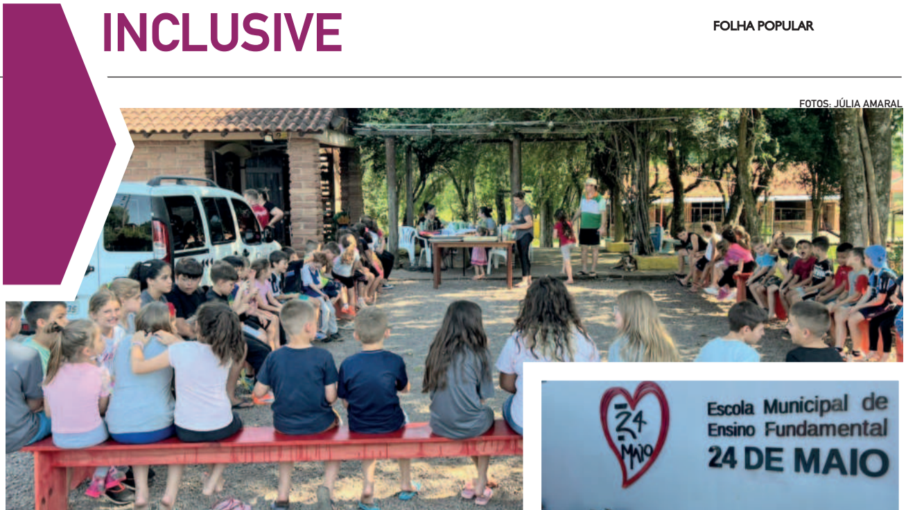
Cerca de 70 crianças da ONG Fazer Moradas serão beneficiadas com as doações