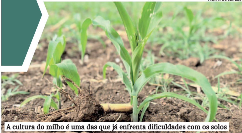
A cultura do milho é uma das que já enfrenta dificuldades com os solos