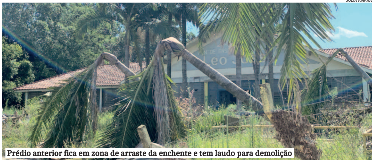
Prédio anterior fica em zona de arraste da enchente e tem laudo para demolição