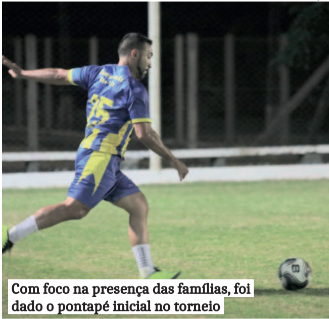
TAINÁ DANZER / DIVULGAÇÃO