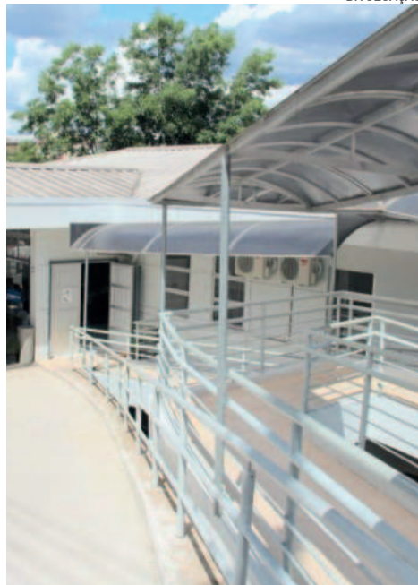
Reformas na saúde de Estrela fazem parte do plano da nova gestão