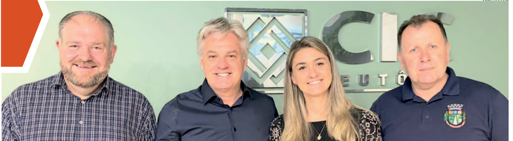
Os líderes de Imigrante, Teutônia, Paverama e Fazenda Vilanova estão na gestão do grupo em 2025