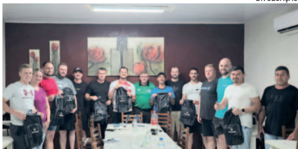
Momento realizado na quarta-feira (15/1) e definiu os detalhes do campeonato