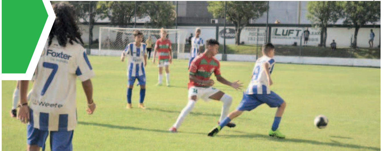
Abertura da Copa Teutônia será às 15h, com transmissão do Grupo Popular

“Deixa eles”, é o que nós torcedores devemos dizer. Aplaudir um guri que venha da copinha para compor o time, e do banco entre e resolva o jogo. Daí sairá nossa esperança mais uma vez. E eles podem ter os milhões, mas nós temos a imortalidade. E, no fim, o futebol não é só sobre ganhar; é sobre resistir é sobre ser Grêmio.