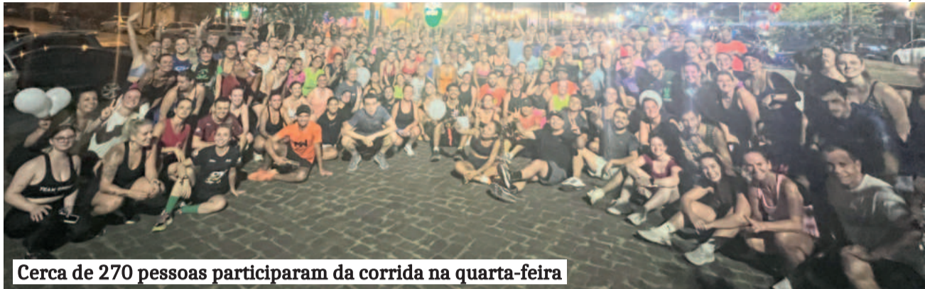
Cerca de 270 pessoas participaram da corrida na quarta-feira