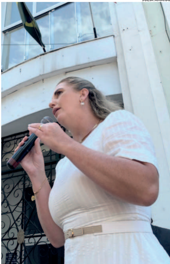
Proposta de reforma administrativa é uma das primeiras ações do governo de Carine Schwingel