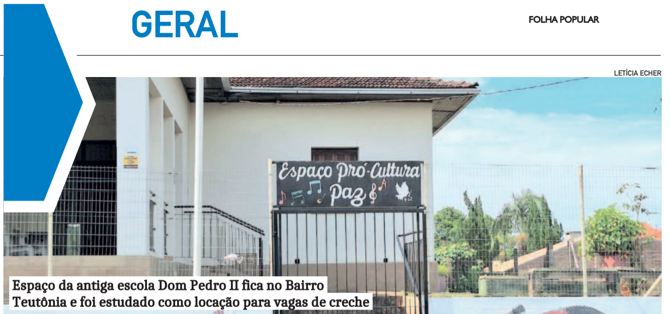
Espaço da antiga escola Dom Pedro II fica no Bairro Teutônia e foi estudado como locação para vagas de creche

Os produtores rurais da região vivem entre a ansiedade e a expectativa, principalmente pelo histórico recente de seca: 2021, 2022 e 2023.