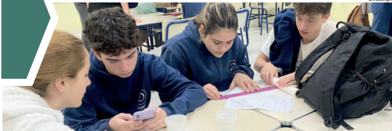
Atividades de Miniempresa já foi realizada em 2024, em Porto Alegre