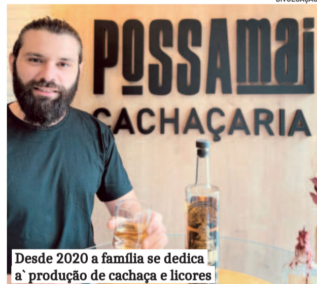
Desde 2020 a família se dedica à produção de cachaça e licores