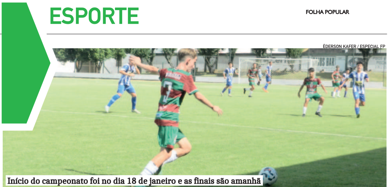
Início do campeonato foi no dia 18 de janeiro e as finais são amanhã

Vamos em busca de uma seria inédita, o Octa. Nós torcedores, é claro, acompanhamos tudo com o mesmo fervor. Ora sonha com os meninos da Copinha levantando troféus no profissional, ora cobra desempenho imediato dos veteranos no Gauchão. Mas, acima de tudo, vibra. Porque ser gremista é isso, acreditar em todas as gerações, em todas as competições, sabendo que, nas vitórias ou nas derrotas, o amor pelo clube é sempre o mesmo.