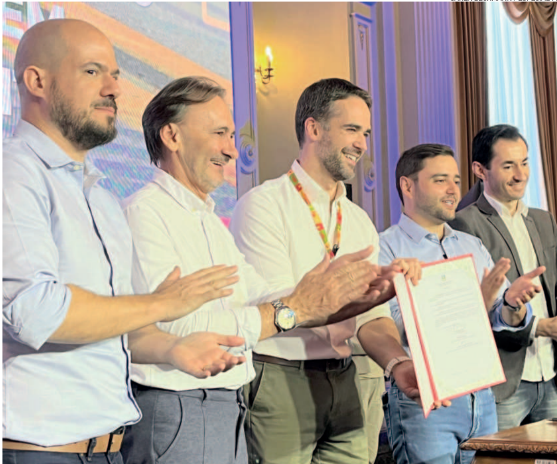
Anúncios foram feitos na segunda-feira (20/1) no Palácio Piratini