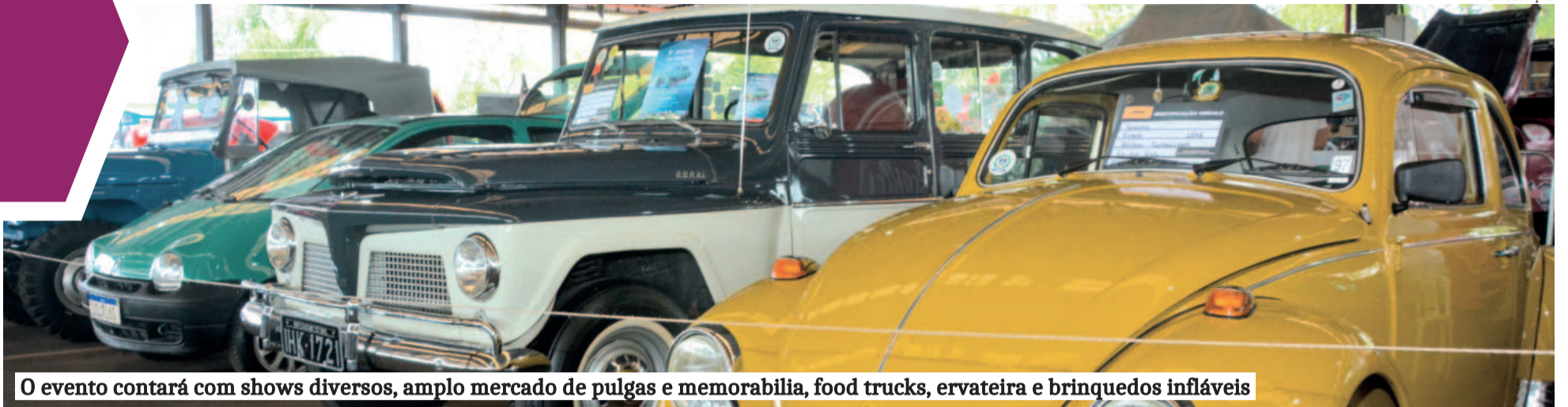
O evento contará com shows diversos, amplo mercado de pulgas e memorabilia, food trucks, ervateira e brinquedos infláveis