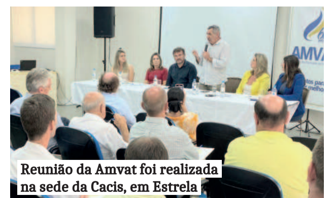
Reunião da Amvat foi realizada na sede da Cacis, em Estrela