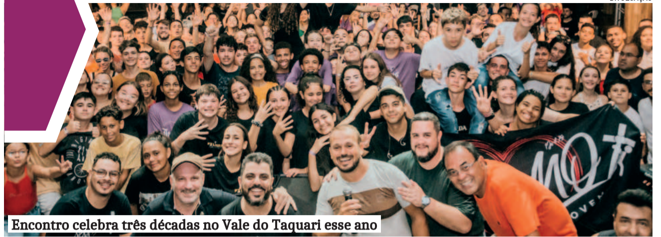
Encontro celebra três décadas no Vale do Taquari esse ano

Hoje, aviões de carreira utilizam sistema “fly-by-wire” – controle por computador – na maior parte dos voos. HAL, como previu Clarke, assumirá o comando.