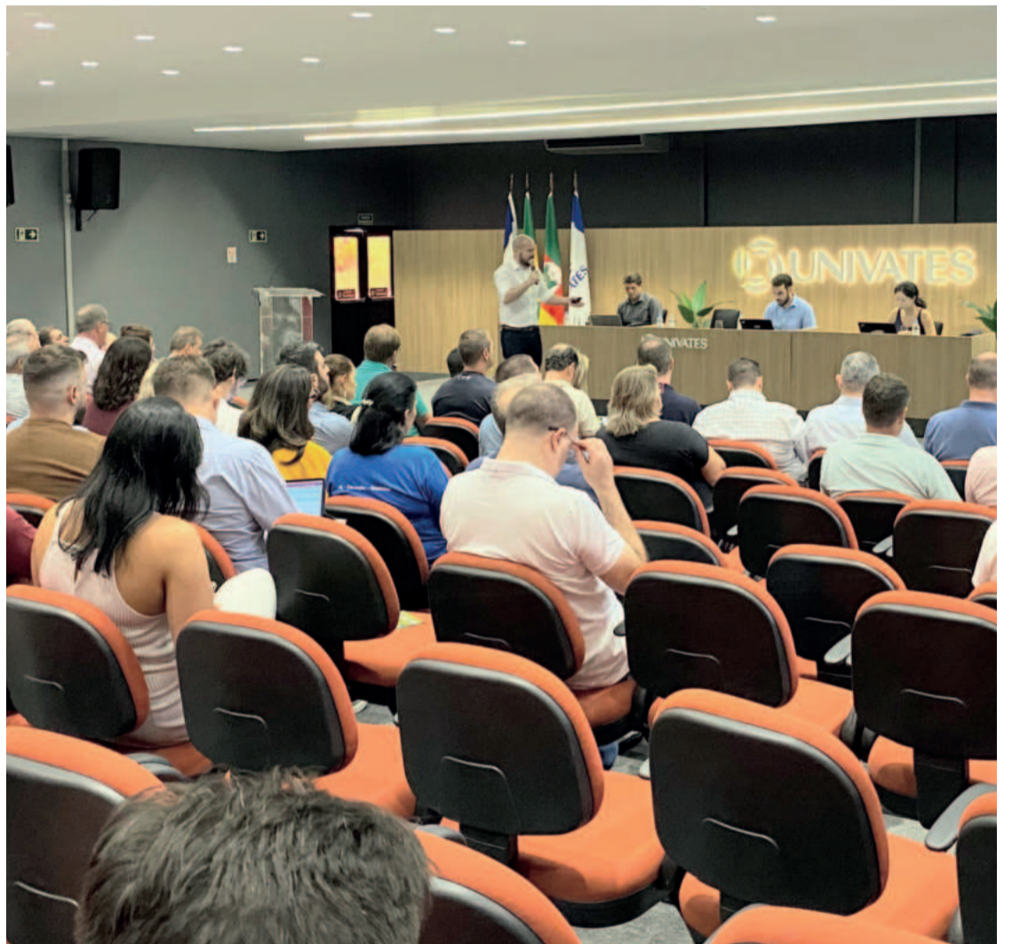
Audiência Pública ocorreu no Auditório do Prédio 7 da Univates