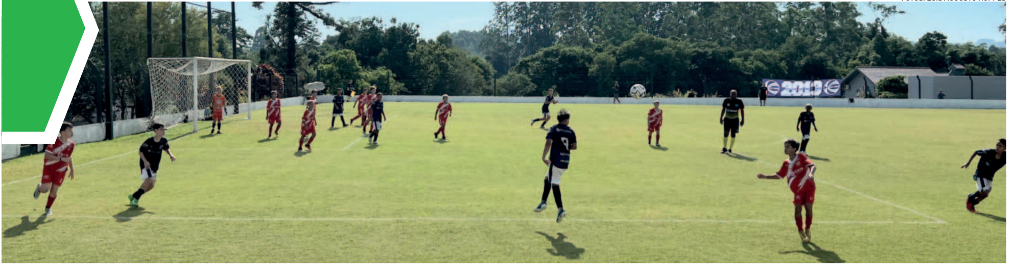
Finais foram realizadas no campo do Esperança, no Bairro Languiru