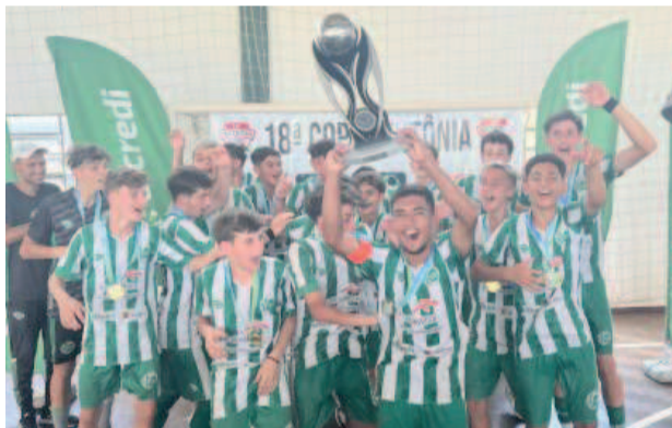
Mesmo com dois jogadores a menos, time Sub-14 do Juventude venceu o Progresso e saiu campeão

Mesmo com dois jogadores a menos, o Juventude conseguiu segurar o resultado e, nos minutos finais, marcou mais um, fechando o placar em 3 a 1 para garantir o título de campeão.