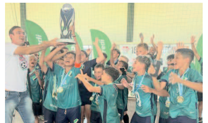
Elenco Sub-13 da UJC venceu o Juventude e garantiu a taça

O gol definiu o título e colaborou para mais um triunfo de uma das melhores equipes da competição. Que também teve o artilheiro e os melhores goleiros do campeonato.