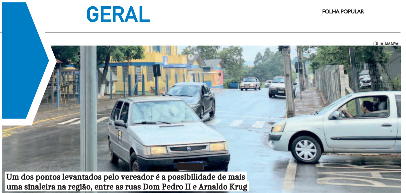
Um dos pontos levantados pelo vereador é a possibilidade de mais uma sinaleira na região, entre as ruas Dom Pedro II e Arnaldo Krug

Empresas, escolas, governos e instituições precisam unir forças para criar programas que atendam tanto às necessidades do mercado quanto às aspirações dos trabalhadores por melhor renda. A qualificação não é uma responsabilidade isolada, mas um compromisso coletivo que beneficia a todos. Quanto mais pessoas estiverem preparadas para ocupar os postos de trabalho disponíveis, maior será o impacto positivo na economia e na qualidade de vida da nossa comunidade. O momento de agir é agora.