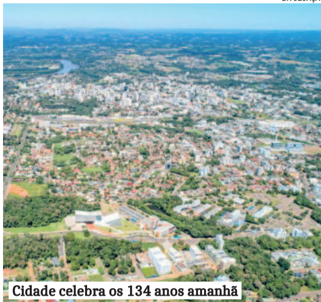
Cidade celebra os 134 anos amanhã