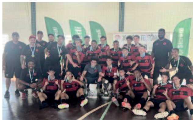
Em jogo de sete gols, Progresso marcou no último lance do jogo e conquistou o título da Sub-15

Com o apito final de Douglas Fensterseifer, a comemoração foi imensa entre jogadores, dirigentes e torcedores da equipe pelotense.