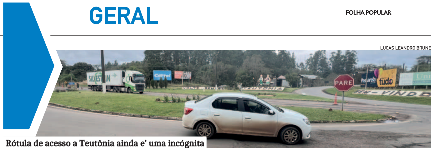
Rótula de acesso a Teutônia ainda e' uma incógnita

A resolução deste impasse não apenas preservará o patrimônio público, mas também demonstrará o compromisso dos atuais vereadores com a eficiência administrativa. Gostando ou não, o prédio está lá e precisa ser conservado. A cada semana que passa, as perdas só aumentam. É imperativo que a Câmara de Teutônia atue com celeridade e responsabilidade para superar este desafio.