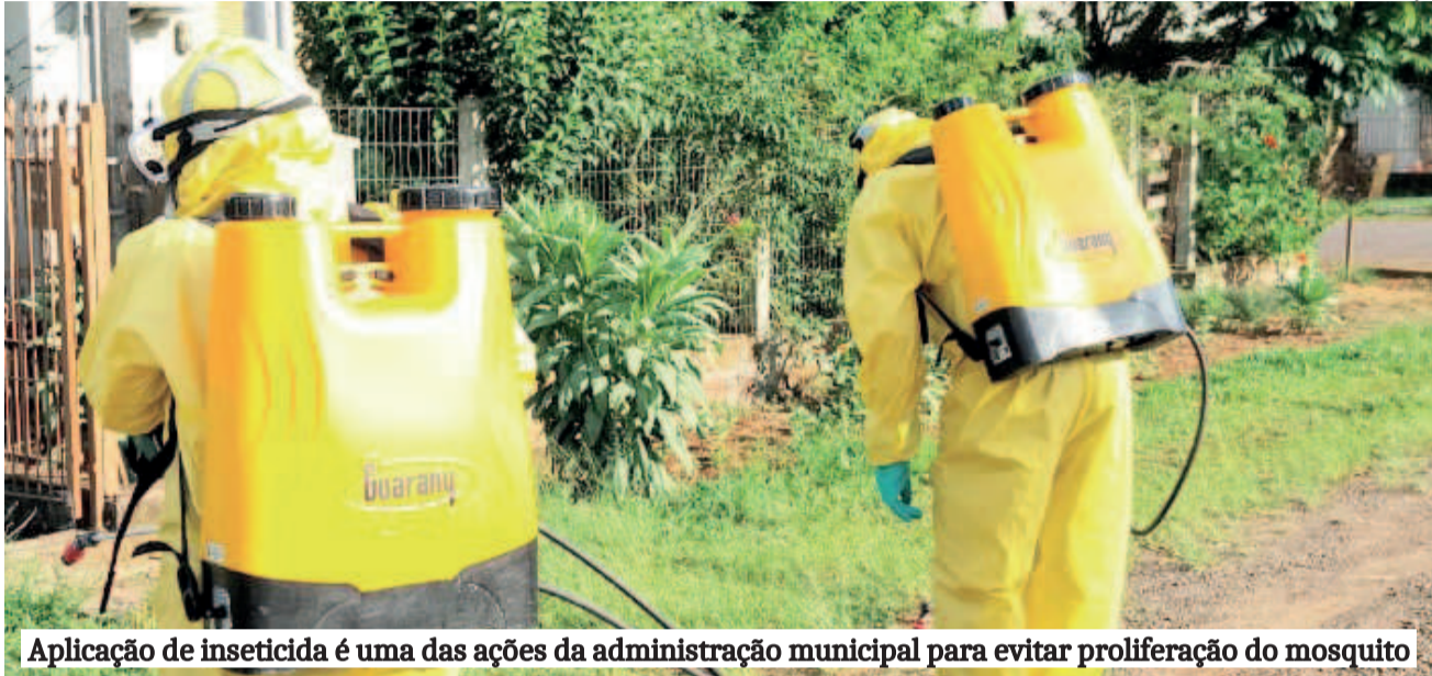
Aplicação de inseticida é uma das ações da administração municipal para evitar proliferação do mosquito