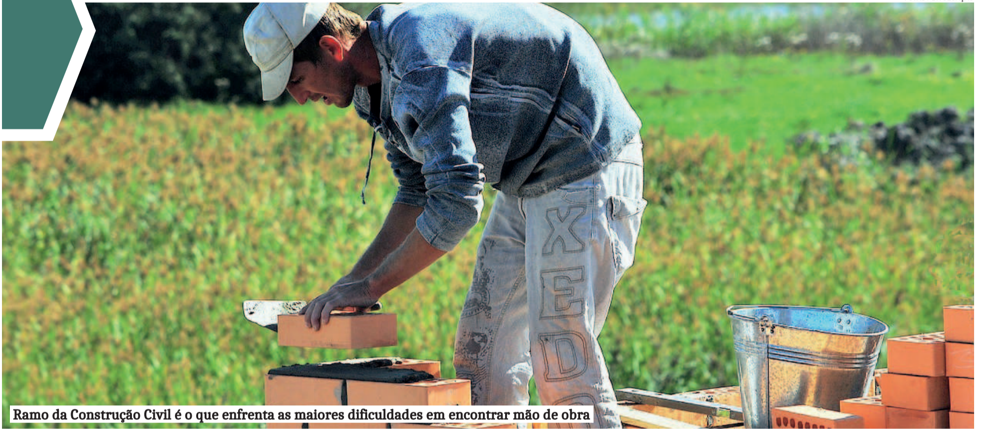
Ramo da Construção Civil é o que enfrenta as maiores dificuldades em encontrar mão de obra