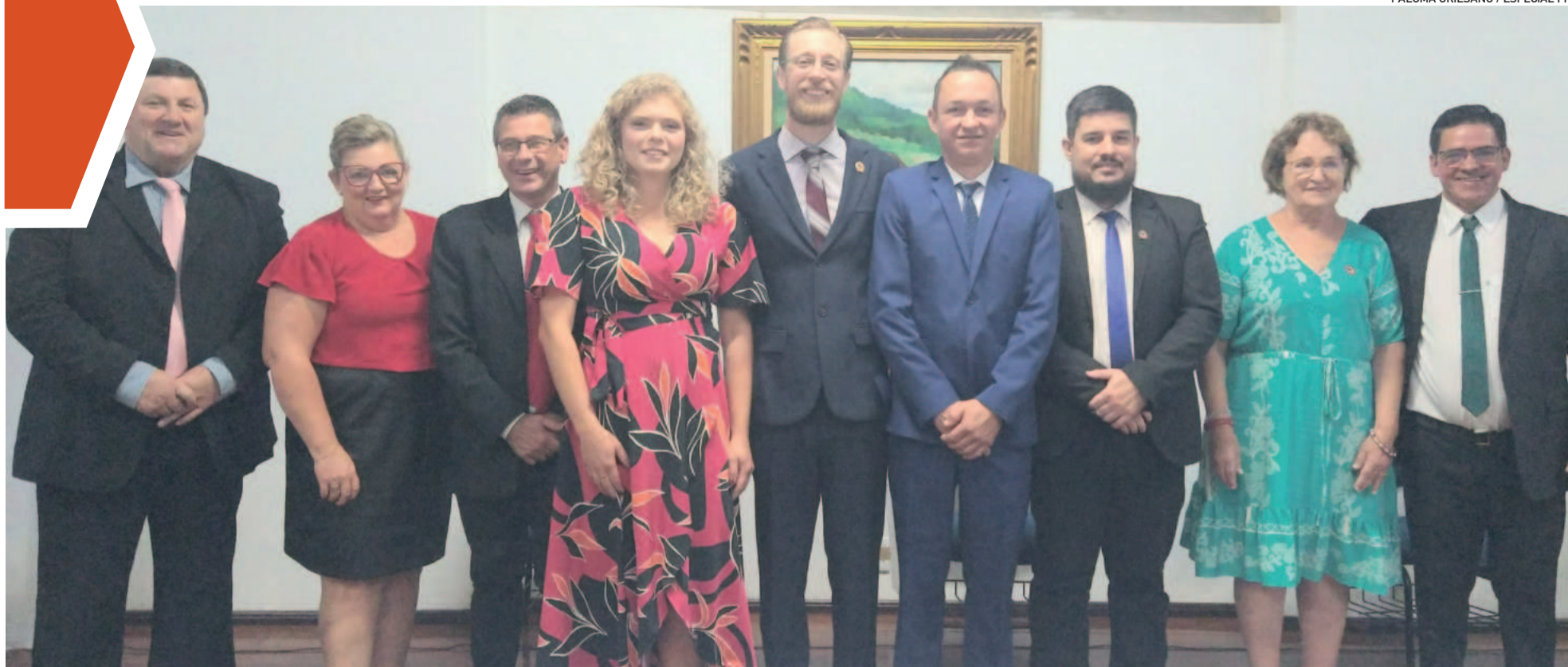
Veredores compõem a 10ª Legislatura

POÇO DAS ANTAS ▶ PRIMEIRA SESSÃO DE 2025