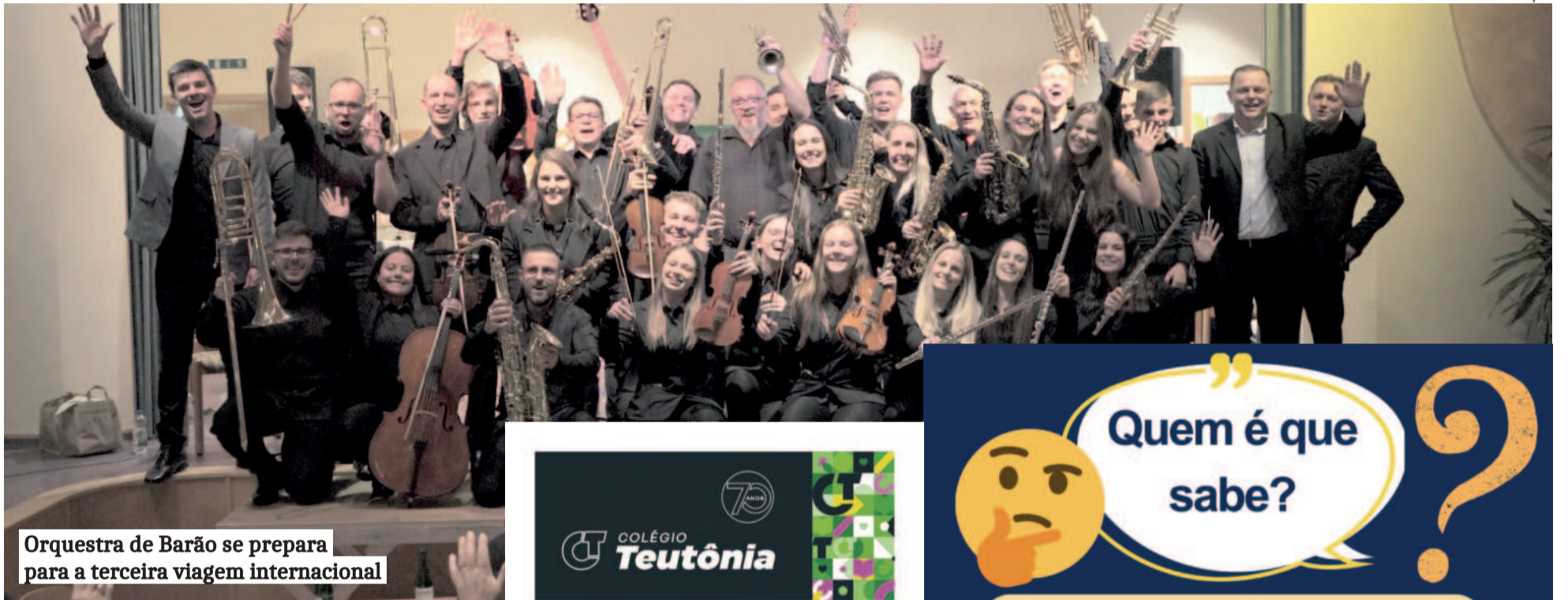
Orquestra de Barão se prepara para a terceira viagem internacional