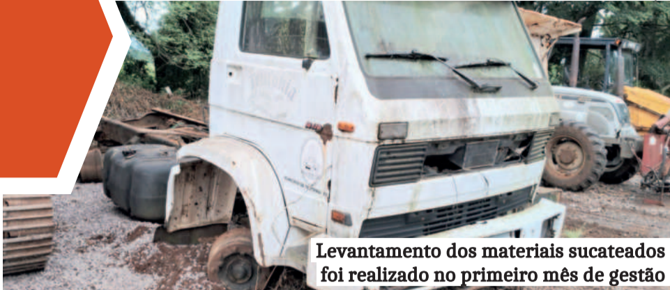
Levantamento dos materiais sucateados foi realizado no primeiro mês de gestão