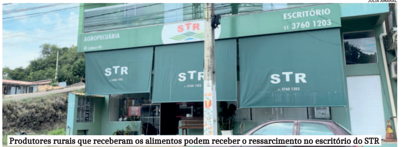
Produtores rurais que receberam os alimentos podem receber o ressarcimento no escritório do STR