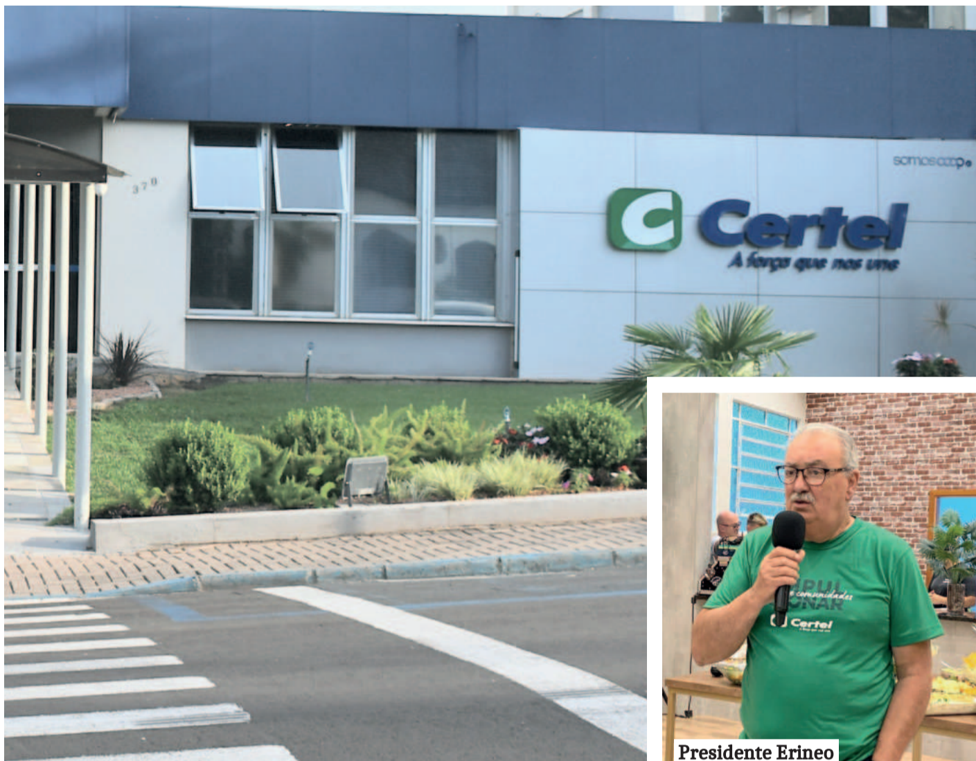
Cooperativa Certel celebra 69 anos de história e pujança neste dia 19 de fevereiro