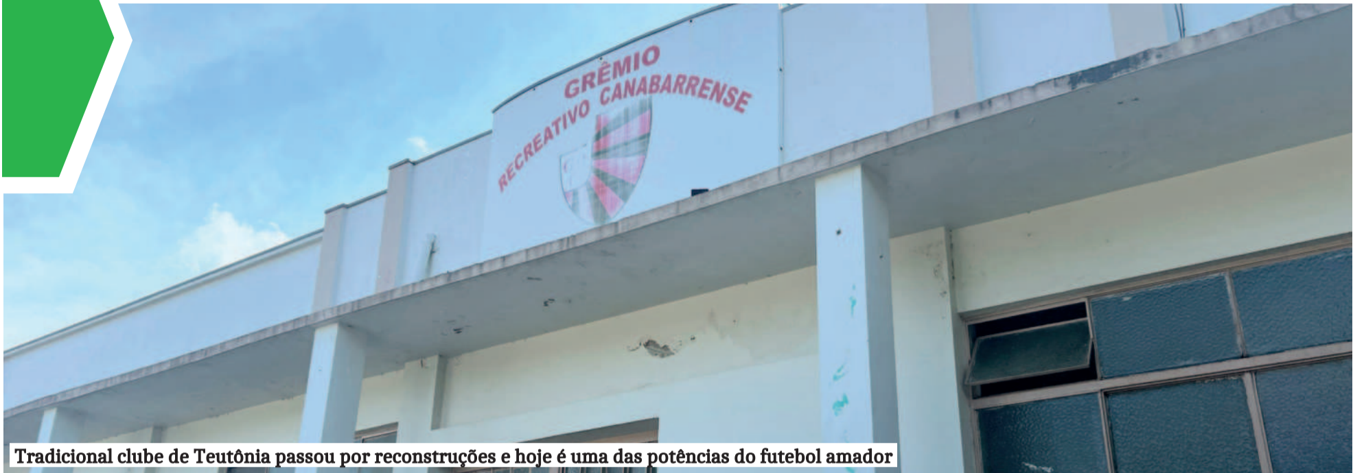
Tradicional clube de Teutônia passou por reconstruções e hoje é uma das potências do futebol amador