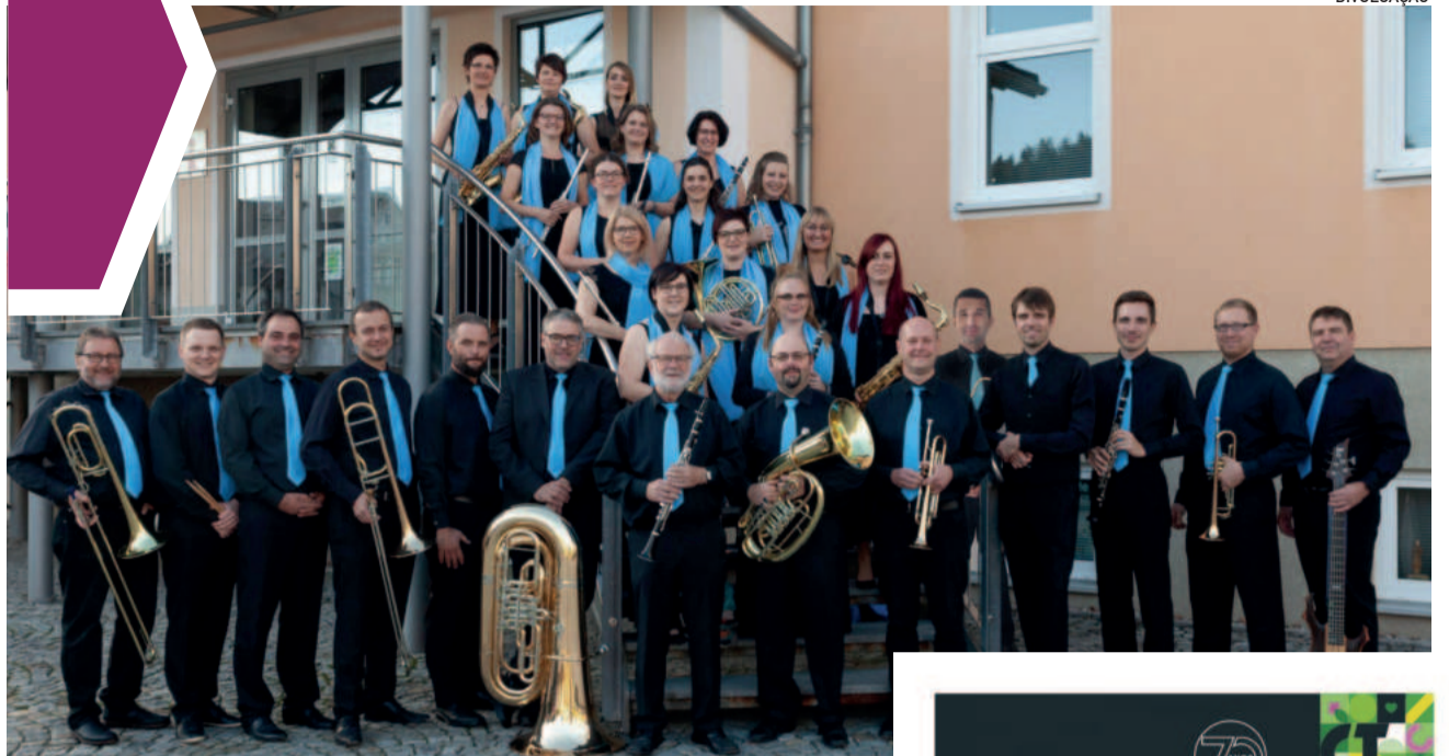
A Banda Brass 94 tem 30 anos de história e é original de uma pequena cidade alemã