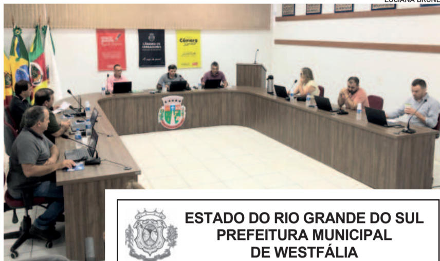
Sessão realizada na segunda-feira

Também foi aprovado o projeto de lei nº 027/2025, que altera o art. 50 da Lei Municipal nº 2.281/2023, aumentando para 18 URM por hectare o Programa de Auxílio a agricultores que não disponham de máquinas e equipamento, por meio do auxílio financeiro nos serviços terceirizados com máquinas agrícolas. O limite é de 6h máquinas e/ou equipamentos para cada inscrição de talão de produtor por ano.