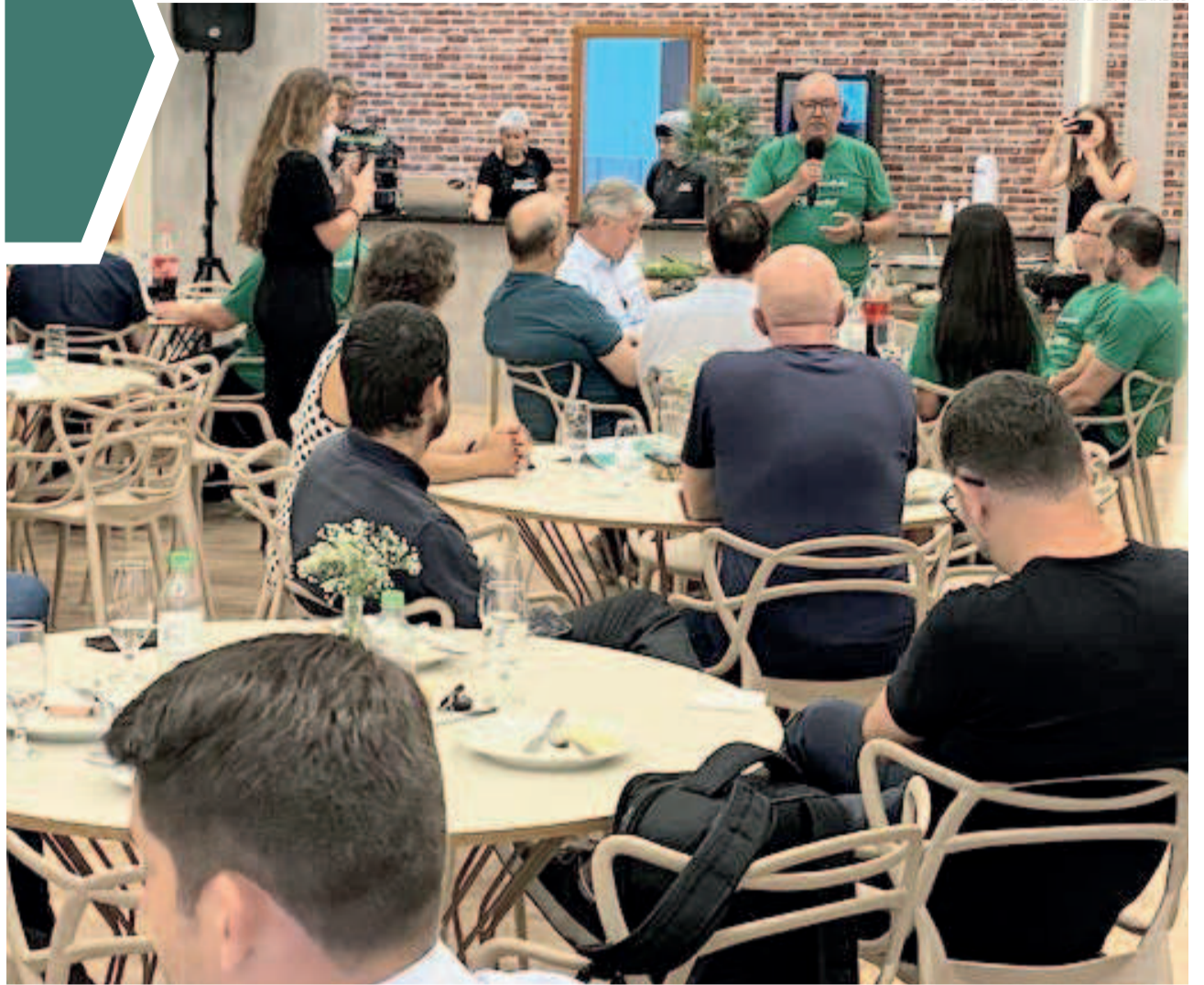
Almoço festivo foi realizado ao meio-dia de segunda-feira, dia 17

Nesse contexto, o Hospital Ouro Branco está empenhado na federalização de 10 leitos do Sistema Único de Saúde (SUS) para a área de Saúde Mental da instituição, que é referência para o Estado nesta especialidade. Atualmente, sete são mantidos com recursos estaduais e dois com investimentos federais.