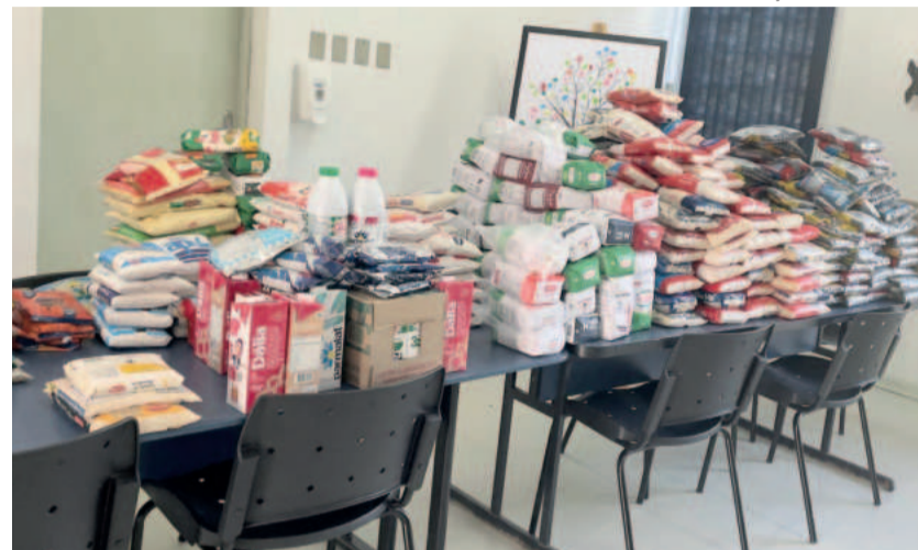
Os donativos arrecadados serão doados às famílias com cadastro do Cras