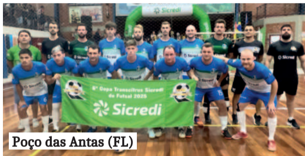
Poço das Antas