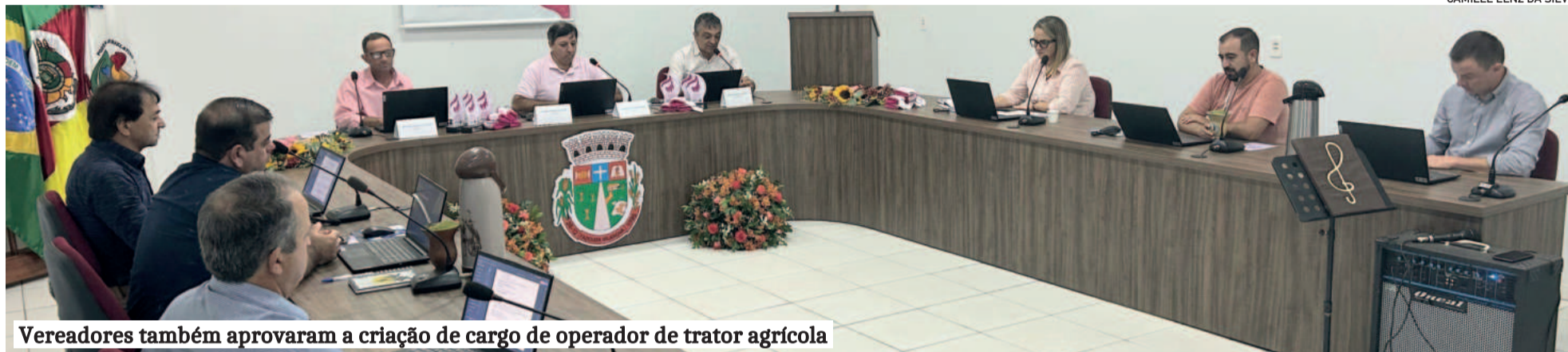
Vereadores também aprovaram a criação de cargo de operador de trator agrícola