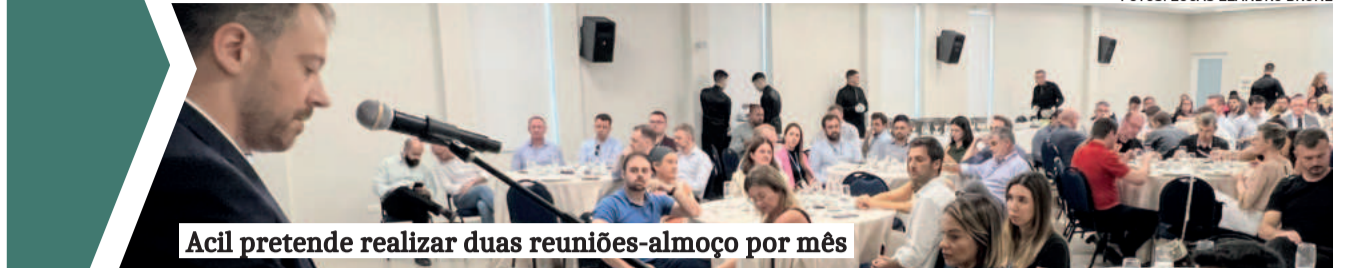
Acil pretende realizar duas reuniões-almoço por mês