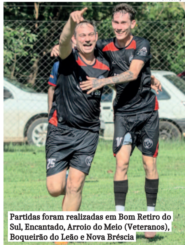
Partidas foram realizadas em Bom Retiro do Sul, Encantado, Arroio do Meio (Veteranos), Boqueirão do Leão e Nova Bréscia