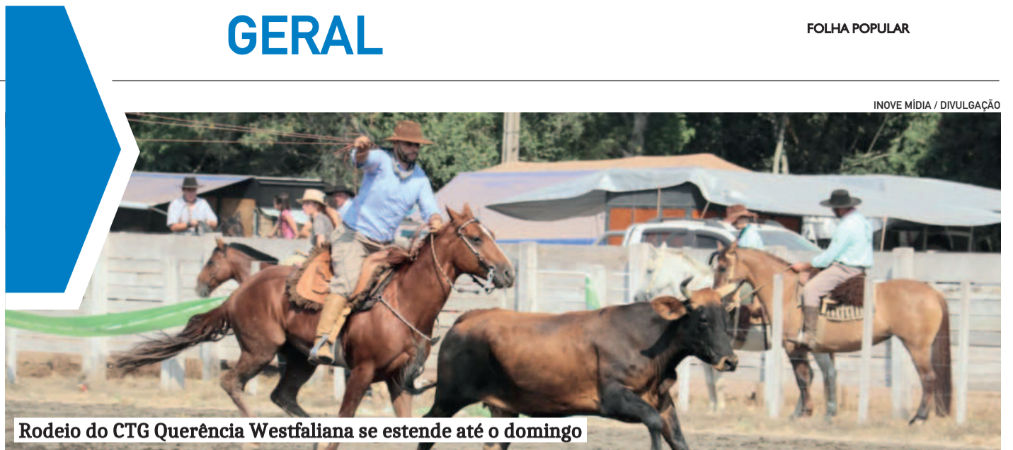
Rodeio do CTG Querência Westfaliana se estende até o domingo

Agora, cinco anos depois, cabe a cada um de nós manter viva a memória do que vivemos. Valorizar os profissionais da saúde, cuidar da saúde mental e continuar investindo em pesquisa são formas de honrar aqueles que não estão mais aqui. Que as lições da pandemia nos guiem para construir um futuro mais preparado, humano e solidário, com equilíbrio entre os diferentes segmentos.