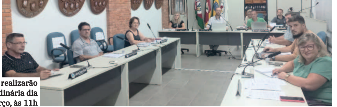
Vereadores realizarão sessão extraordinária dia 19 de março, às 11h