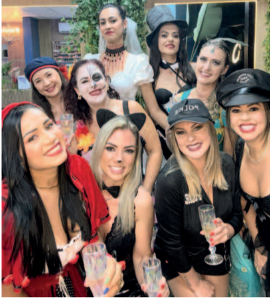
As amigas se prepararam com muita atenção a cada detalhe das fantasias