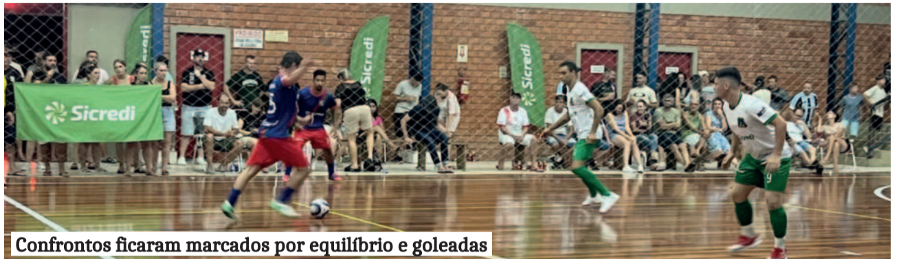
Confrontos ficaram marcados por equilíbrio e goleadas