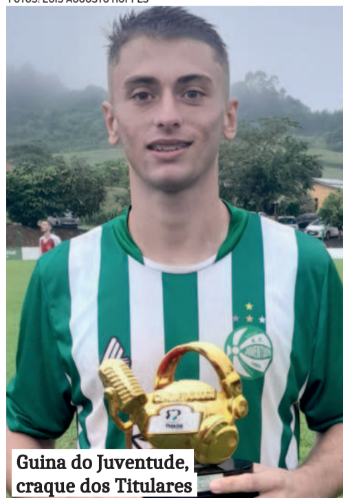
Guina do Juventude, craque dos Titulares