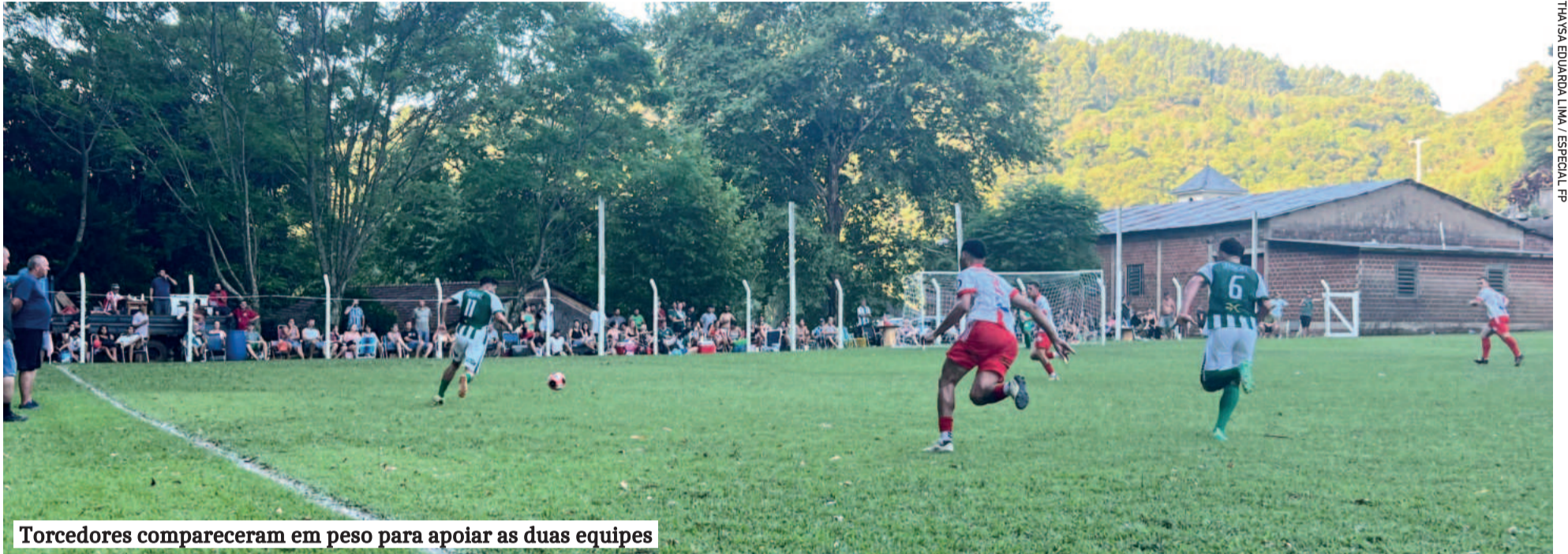
Torcedores compareceram em peso para apoiar as duas equipes