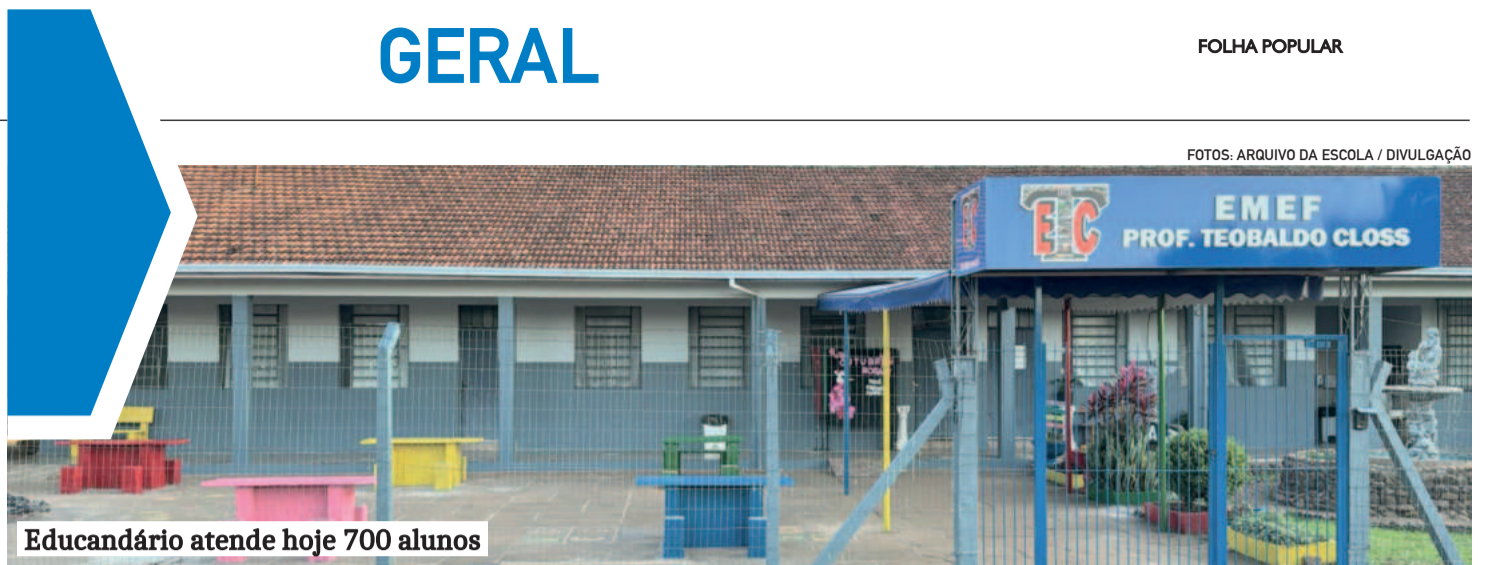
Educandário atende hoje 700 alunos

A proposta de cada município encaminhar suas contribuições formais, aliada à ampliação do prazo de análise, dá fôlego para ajustes necessários. Mais do que nunca, é hora de persistir. O Vale do Taquari já mostrou sua força na reconstrução após a enchente de 2024. Agora, é momento de unir vozes para garantir rodovias mais seguras, ágeis e compatíveis com o potencial da região.