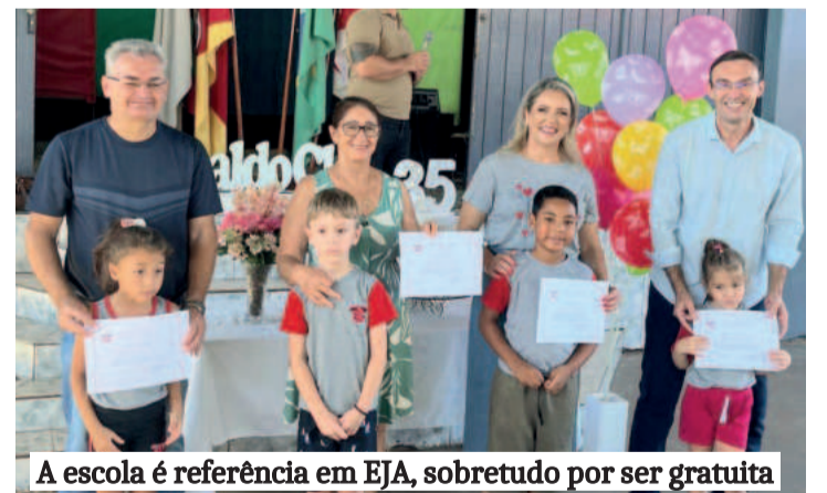
A escola é referência em EJA, sobretudo por ser gratuita