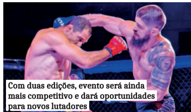
Com duas edições, evento será ainda mais competitivo e dará oportunidades para novos lutadores