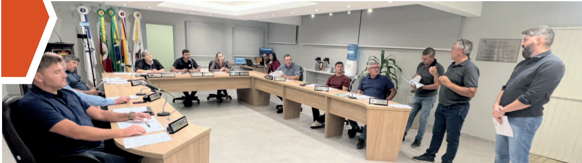
Equipe do Executivo explicou detalhes do projeto nº 38 para ajustar serviços de máquinas e equipamentos