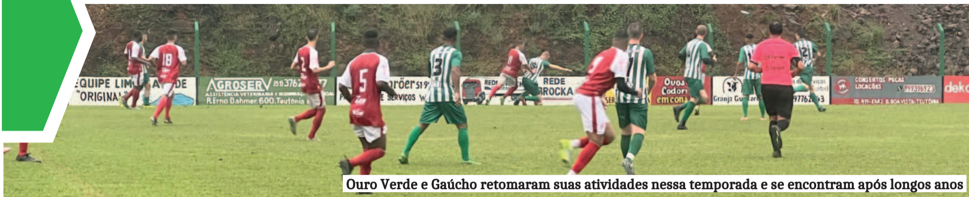
Ouro Verde e Gaúcho retomaram suas atividades nessa temporada e se encontram após longos anos