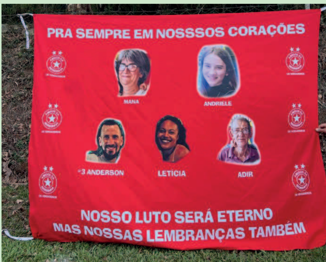
Vítimas dos deslizamentos são lembradas com uma bandeira estendida