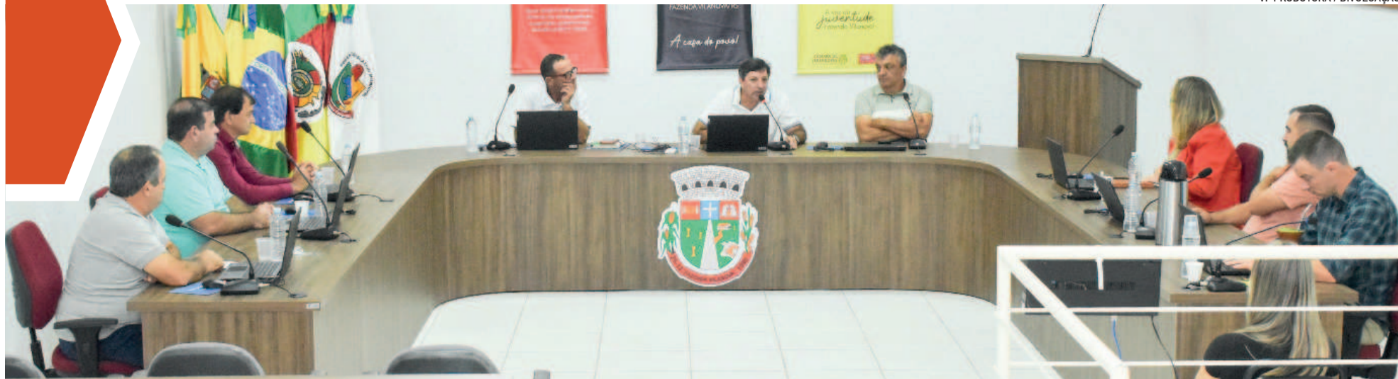
Dois projetos foram votados na sessão