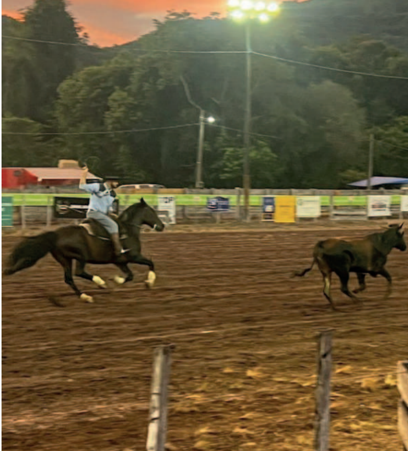
As provas campeiras emocionaram o público e destacaram a tradição gaúcha do laço