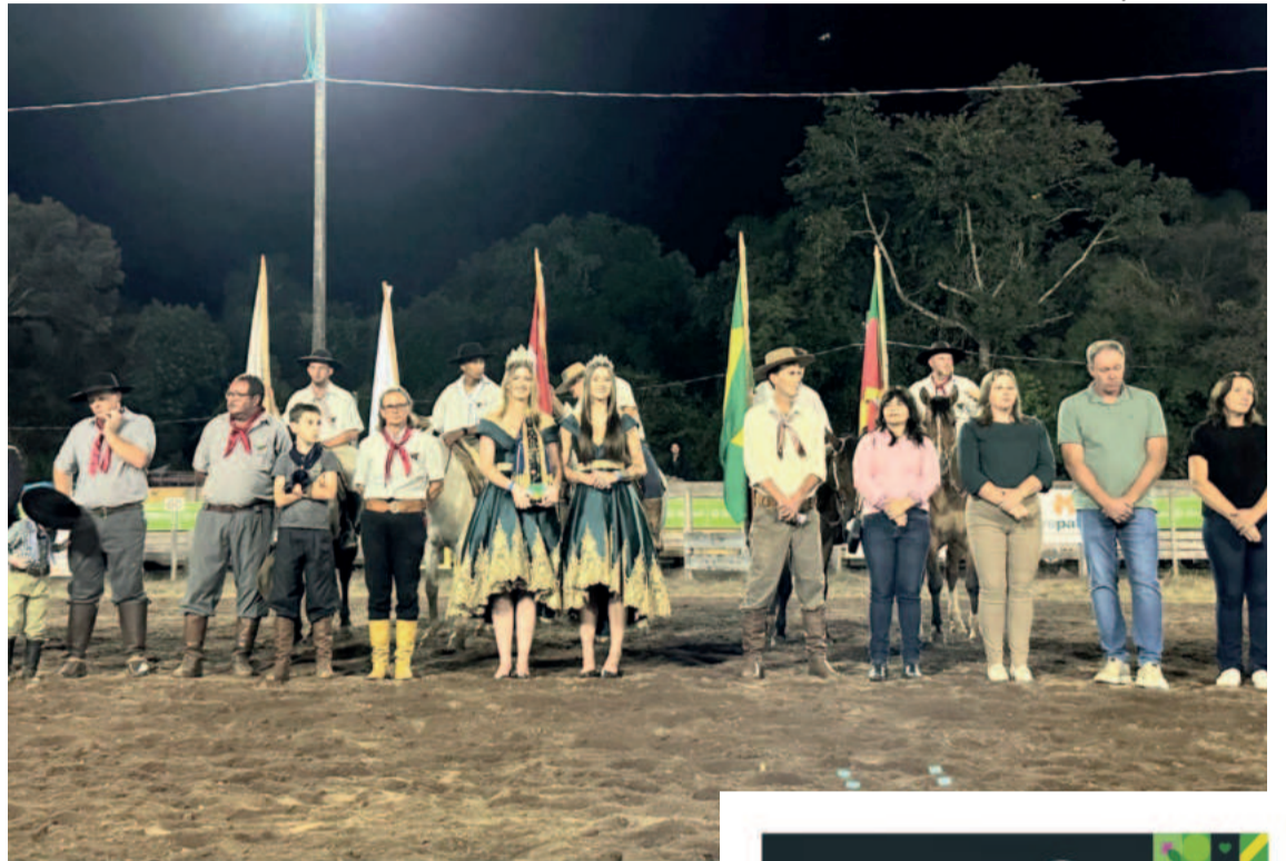
O evento reuniu pessoas de todo o estado para celebrar a cultura gaúcha