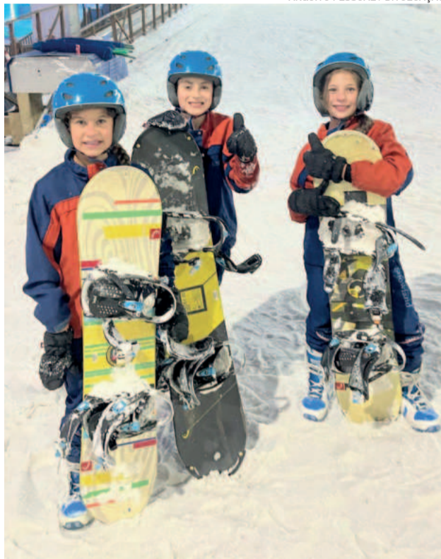
A Apae de Teutônia é considerada referência no paradesporto gaúcho