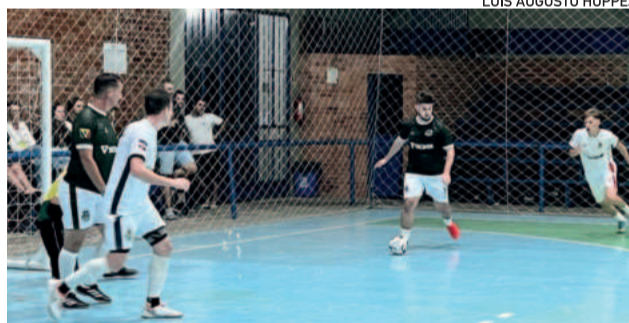
Partidas ocorrem na quinta e sexta-feira (20 e 21/3)