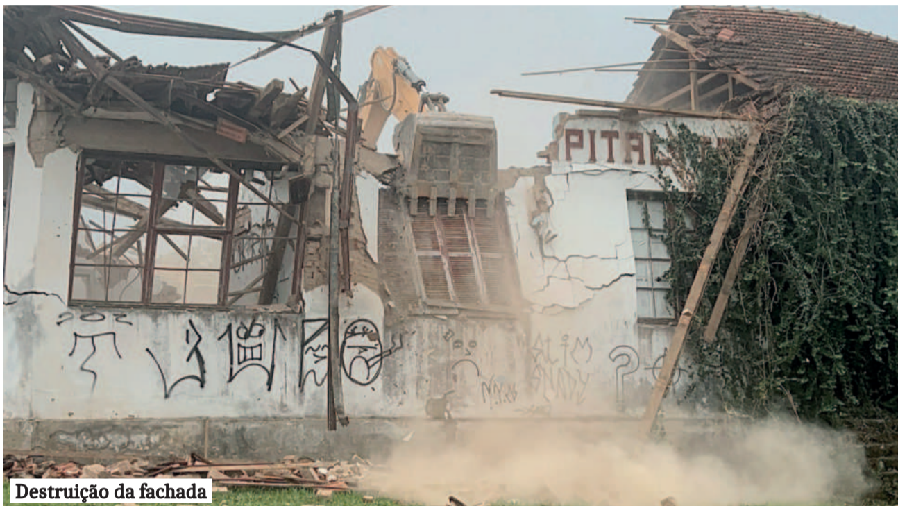
Destruição da fachada