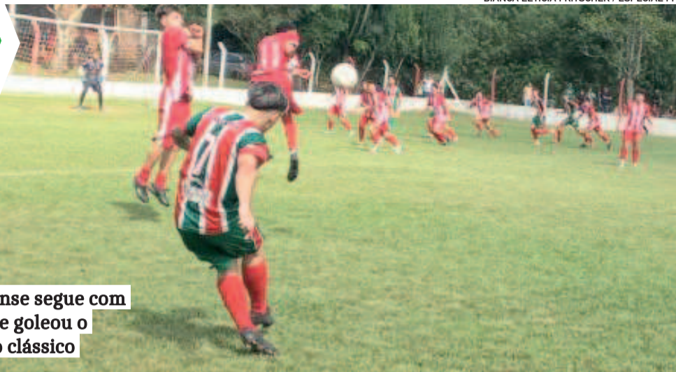
Canabarense segue com a boa fase e goleou o Atlético no clássico