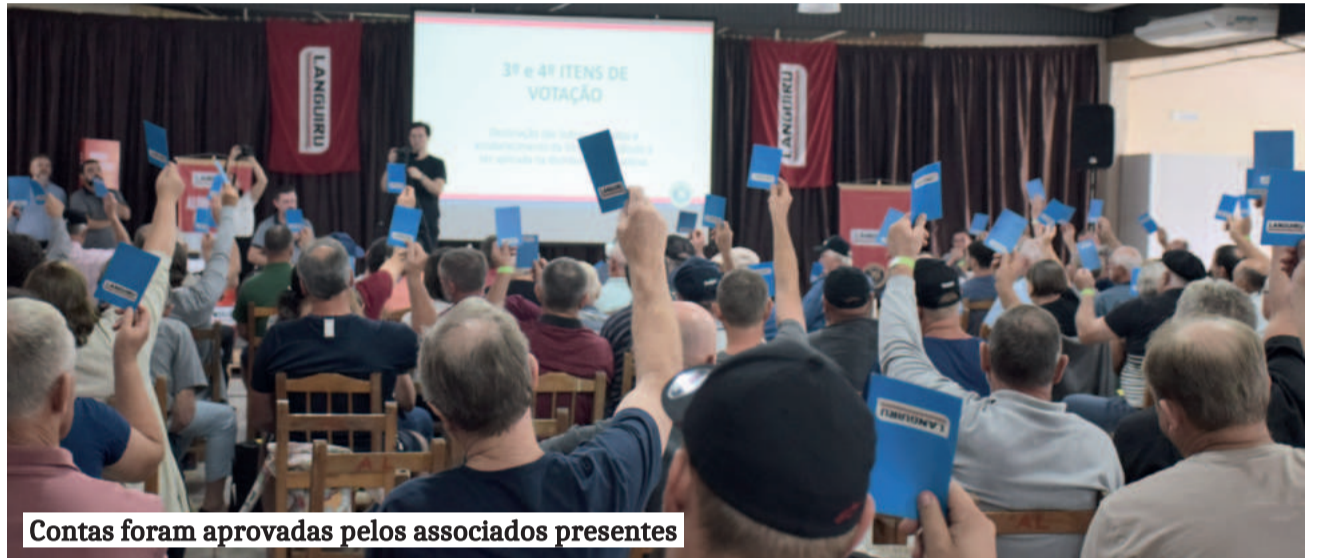
Contas foram aprovadas pelos associados presentes