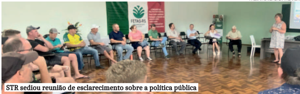
STR sediou reunião de esclarecimento sobre a política pública