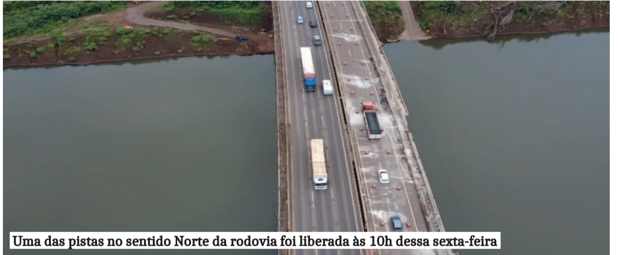
Uma das pistas no sentido Norte da rodovia foi liberada às 10h dessa sexta-feira