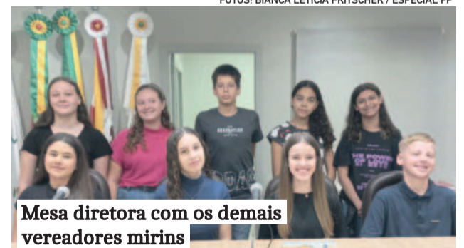
Mesa diretora com os demais vereadores mirins