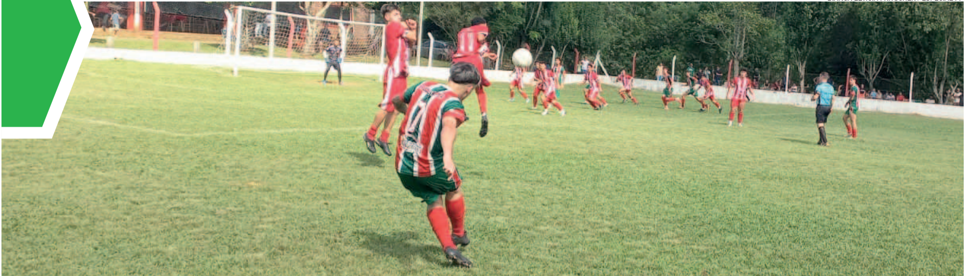
O Canabarrense recebe o Atlético Gaúcho em clássico do Bairro Canabarro, com transmissão da Rádio Popular