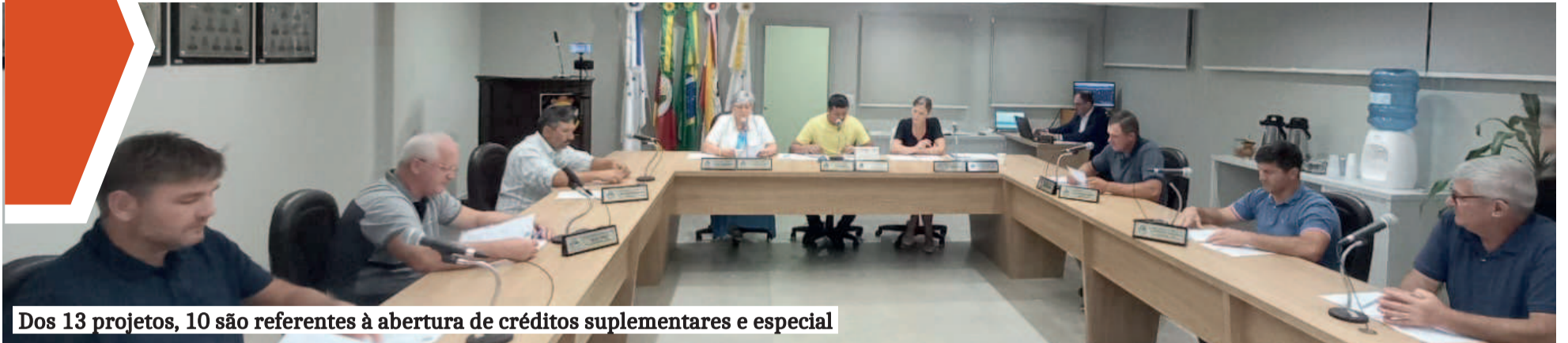
Dos 13 projetos, 10 são referentes à abertura de créditos suplementares e especial