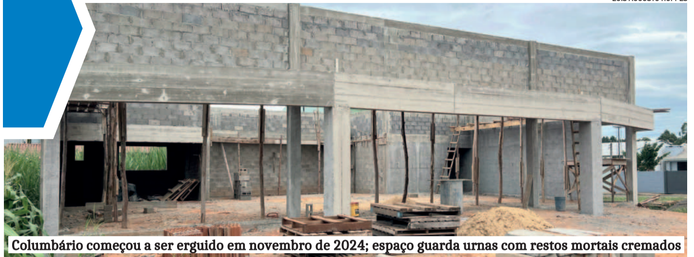
Columbário começou a ser erguido em novembro de 2024; espaço guarda urnas com restos mortais cremados

Se o Vale do Taquari soube se reinventar em momentos de crise e reconstrução, precisa fazer o mesmo para reforçar e preservar seu modelo associativista. O futuro das entidades depende da disposição da comunidade em manter viva essa tradição. O desafio está posto: renovar para avançar.