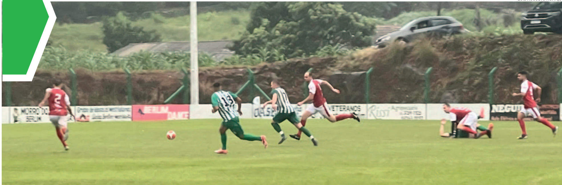
Gaúcho e Juventude disputam a última vaga da Chave B, com jogos em Teutônia