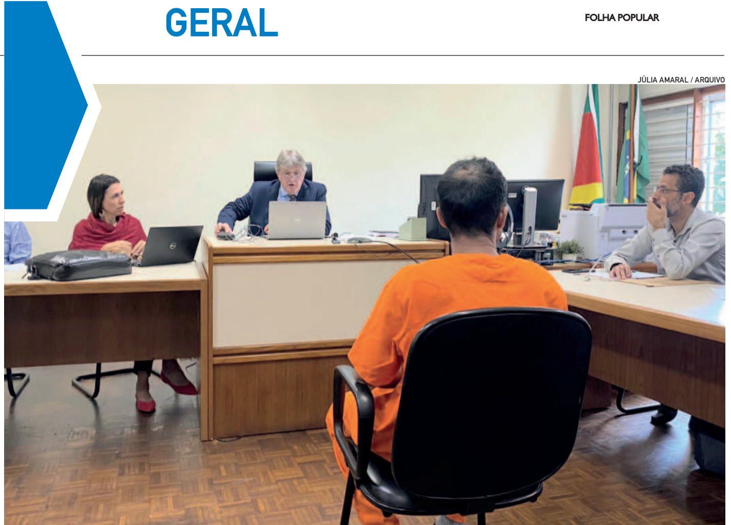
Réus foram ouvidos em 23 de setembro e 4 de outubro de 2024

É natural querer respostas imediatas, mas é essencial exercitar a empatia e o senso crítico. Antes de apontar o dedo, é necessário refletir sobre nossos próprios valores e princípios. Todos somos vulneráveis ao erro e ao impulso de julgar. A verdadeira justiça exige mais do que punição. Exige humanidade, equilíbrio e discernimento.