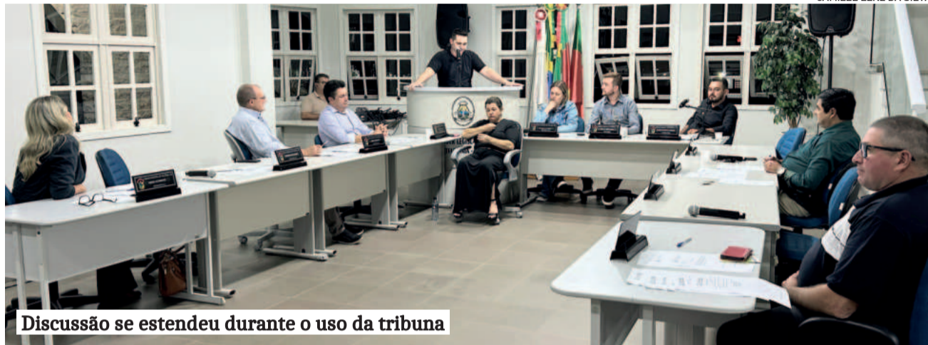
Discussão se estendeu durante o uso da tribuna