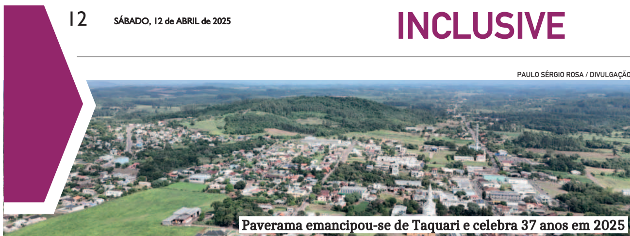
Paverama emancipou-se de Taquari e celebra 37 anos em 2025