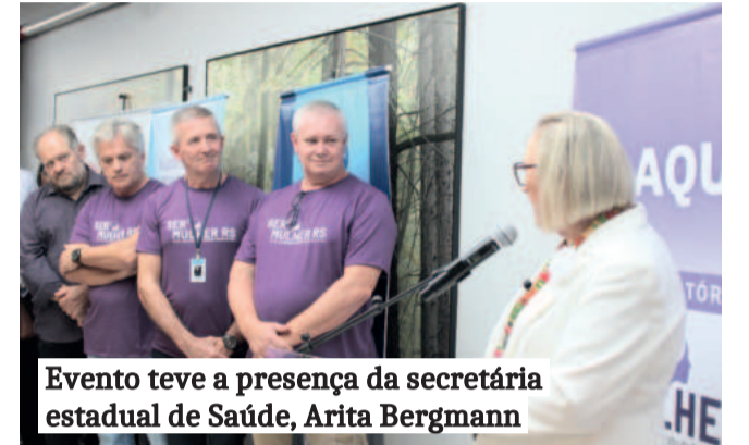
Evento teve a presença da secretária estadual de Saúde, Arita Bergmann