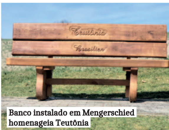
Banco instalado em Mengerschied homenageia Teutônia