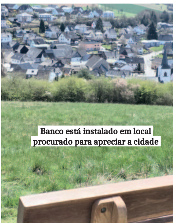
Banco está instalado em local procurado para apreciar a cidade