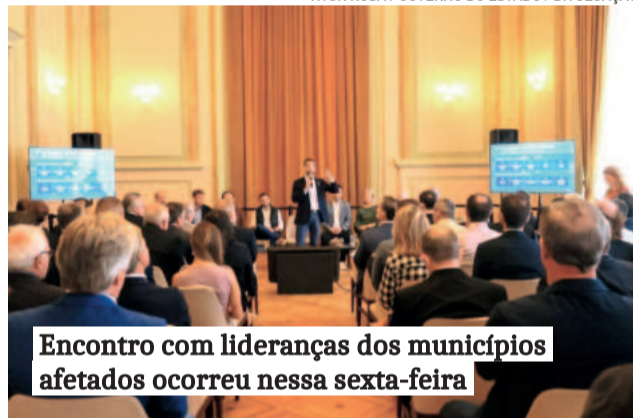
Encontro com lideranças dos municípios afetados ocorreu nessa sexta-feira