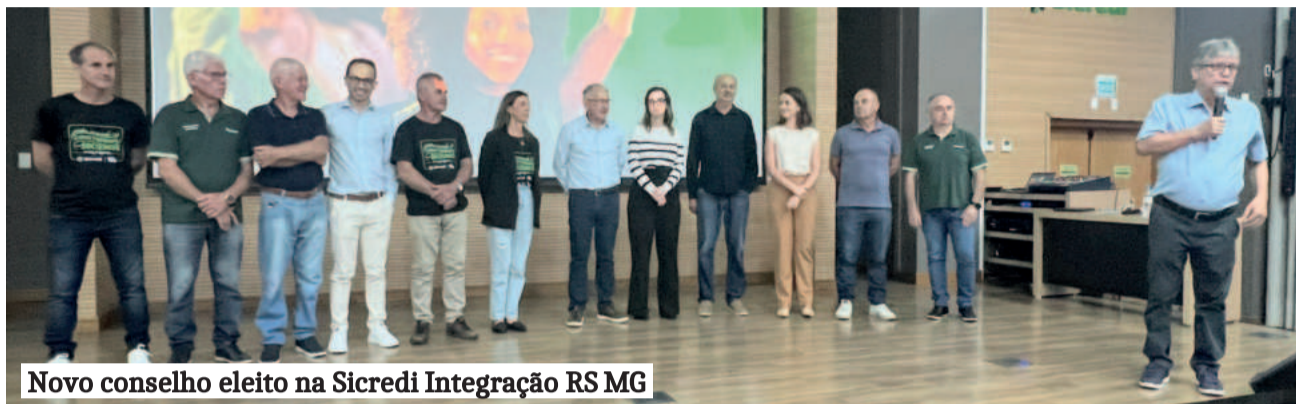
Novo conselho eleito na Sicredi Integração RS MG