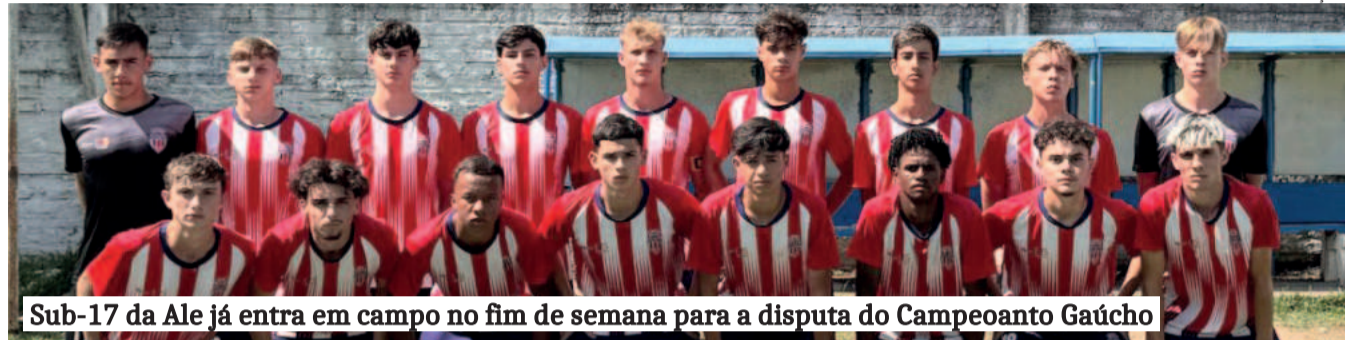
Sub-17 da Ale já entra em campo no fim de semana para a disputa do Campeonato Gaúcho