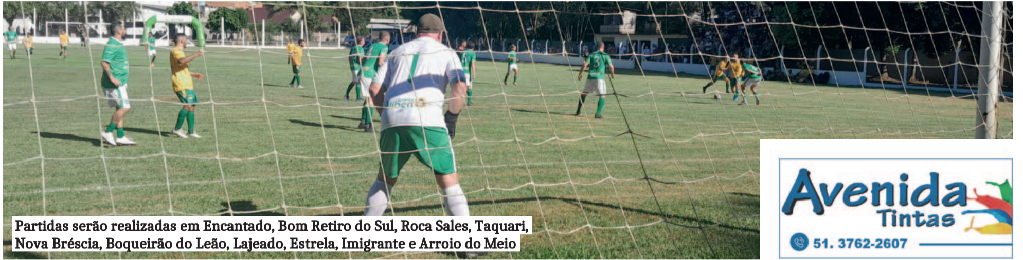
Partidas serão realizadas em Encantado, Bom Retiro do Sul, Roca Sales, Taquari, Nova Bréscia, Boqueirão do Leão, Lajeado, Estrela, Imigrante e Arroio do Meio