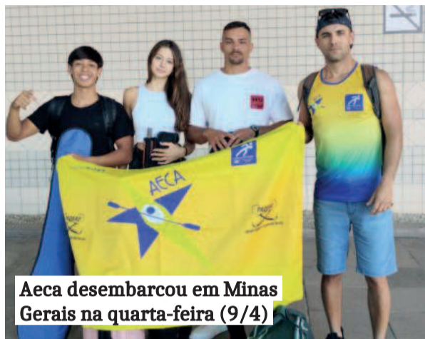
Aeca desembarcou em Minas Gerais na quarta-feira (9/4)