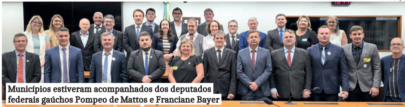
Municípios estiveram acompanhados dos deputados federais gaúchos Pompeo de Mattos e Franciane Bayer