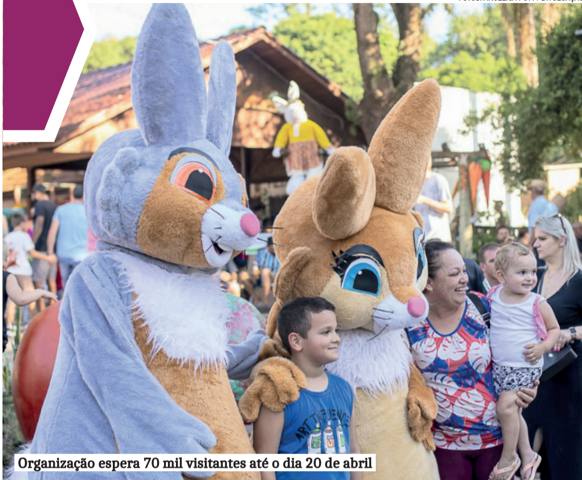
Organização espera 70 mil visitantes até o dia 20 de abril