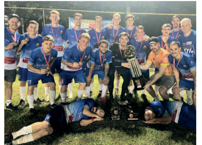
Barcajunior venceu na Sub-21

As finais ficaram marcadas por boa presença de público, que deu um show com sinalizadores, bandas e muita festa. A Rádio Popular transmitiu tudo ao vivo e de forma exclusiva pela FM 96,9.