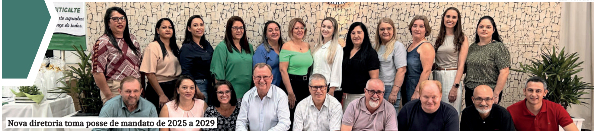
Nova diretoria toma posse de mandato de 2025 a 2029