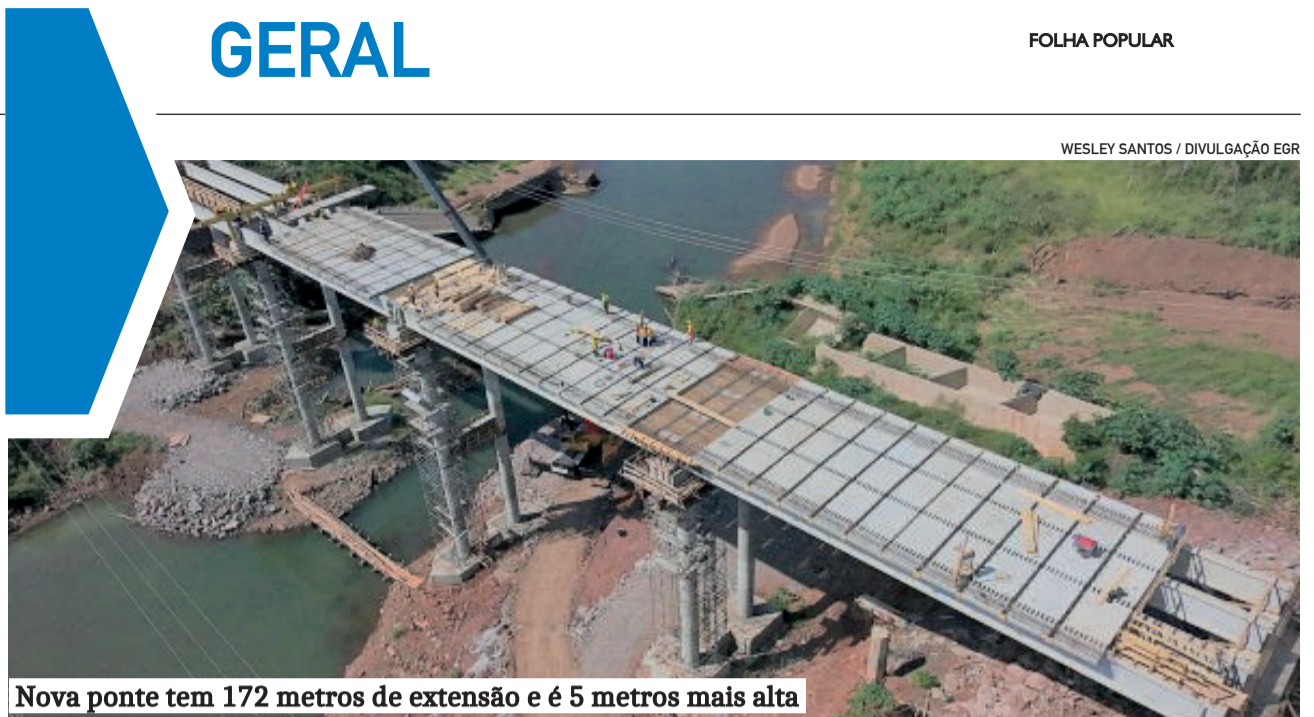
Nova ponte tem 172 metros de extensão e é 5 metros mais alta

A Sicredi Integração RS/MG é maior do que qualquer disputa eleitoral. A trajetória de crescimento da instituição é fruto da dedicação de seus associados, colaboradores e dirigentes ao longo das décadas. Agora, cabe a todos os envolvidos deixar de lado eventuais ressentimentos e trabalhar por uma cooperativa ainda mais forte, inovadora e preparada para o futuro.