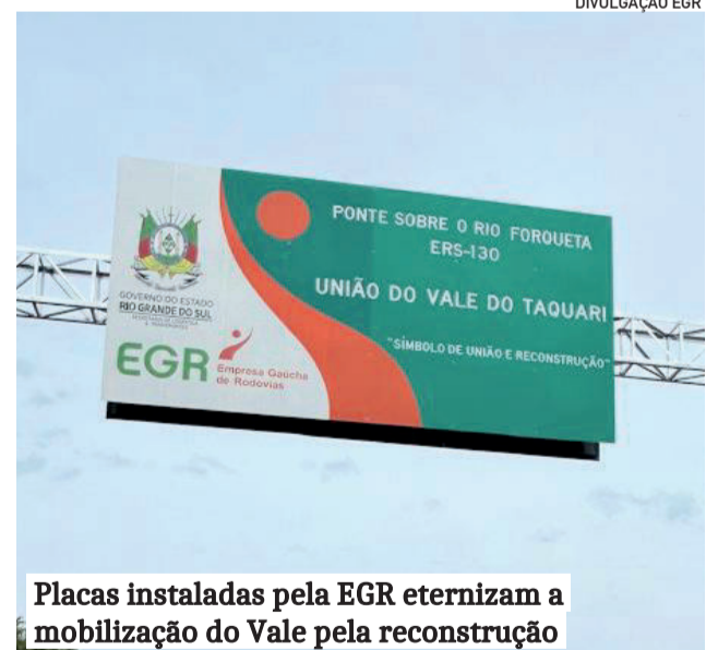
Placas instaladas pela EGR eternizam a mobilização do Vale pela reconstrução