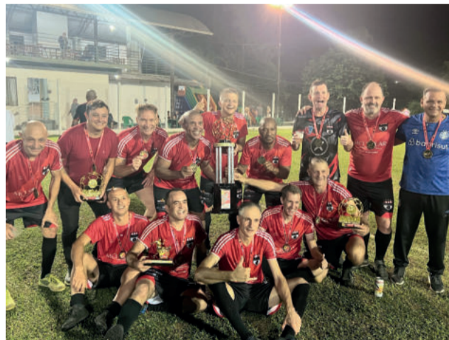
Os Veio da 24 venceram no Master