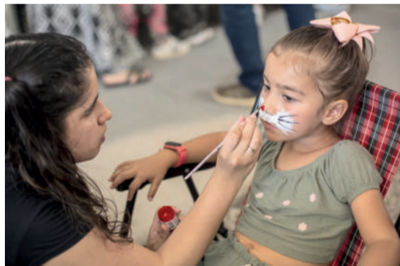
Pintura facial artística é um dos atrativos da Páscoa de Colinas

A comissão organizadora estima que o evento reúna em torno de 70 mil pessoas até 20 de abril, quando a programação encerra. A “Páscoa Encantada - A Reconstrução” segue com atrativos nos próximos fins de semana e tem acesso gratuito.