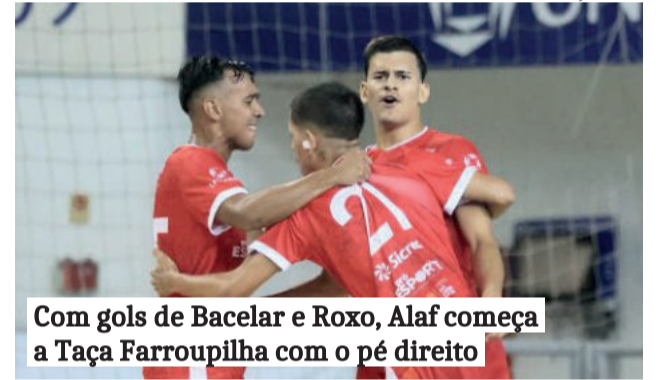
Com gols de Bacelar e Roxo, Alaf começa a Taça Farroupilha com o pé direito