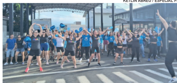
Público atingiu a expectativa da ONG Floco Azul