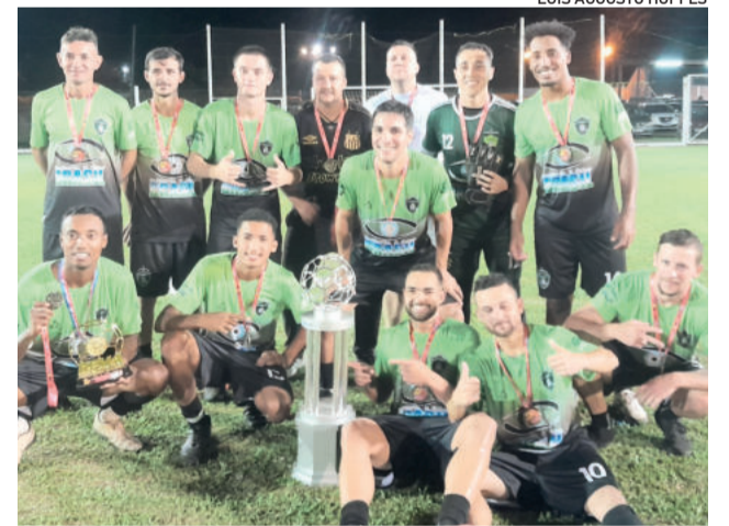
Projeto Guarani conquistou a Série Prata (Força Livre)