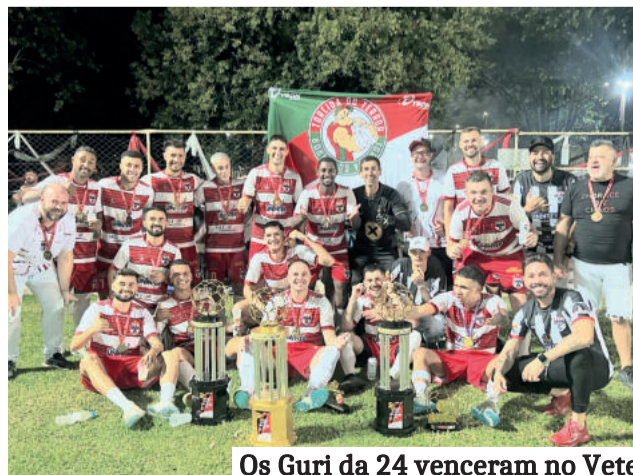
Os Guri da 24 venceram no Veterano e na Série Ouro do Força Livre