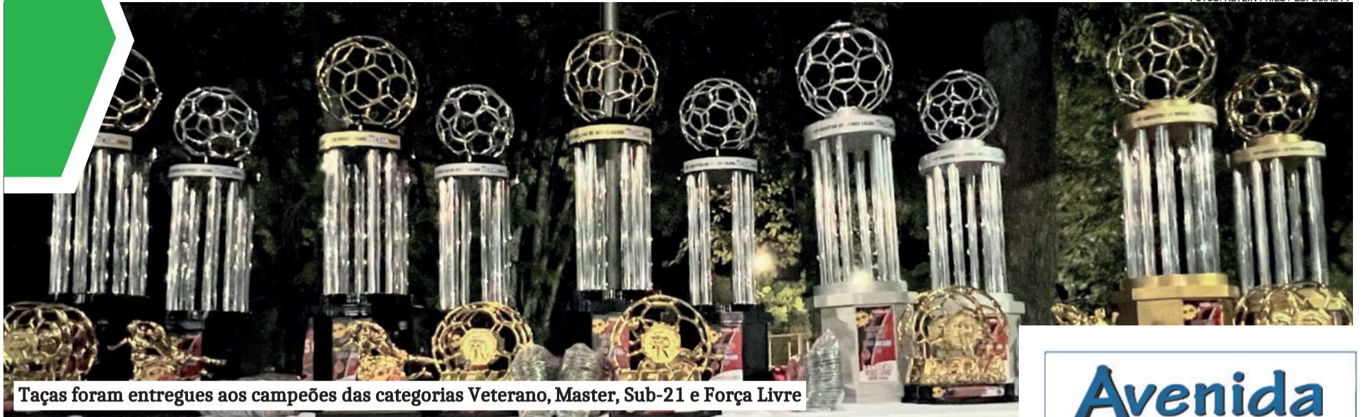
Taças foram entregues aos campeões das categorias Veterano, Master, Sub-21 e Força Livre