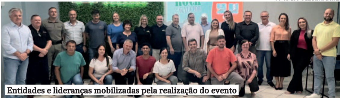
Entidades e lideranças mobilizadas pela realização do evento