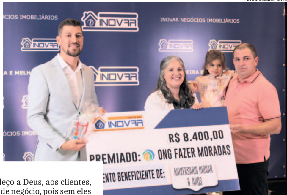
Evento celebrou aniversário com parceiros e clientes