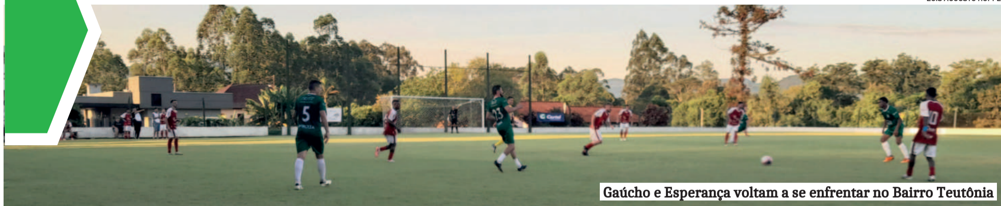
Gaúcho e Esperança voltam a se enfrentar no Bairro Teutônia