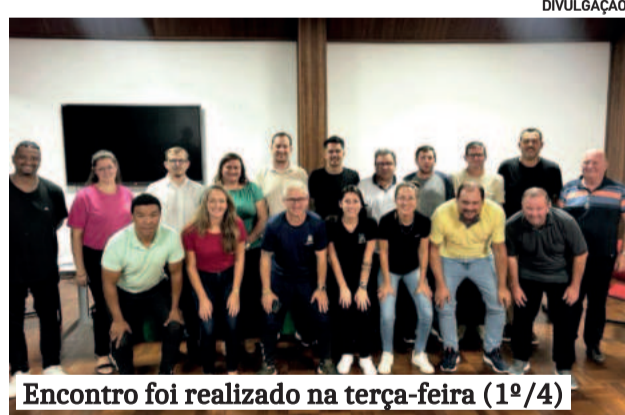
Encontro foi realizado na terça-feira (1º/4)

A previsão é de que o campeonato ocorra no segundo semestre, com datas ainda a definir. A iniciativa também prestará homenagem aos 110 anos de Encan-