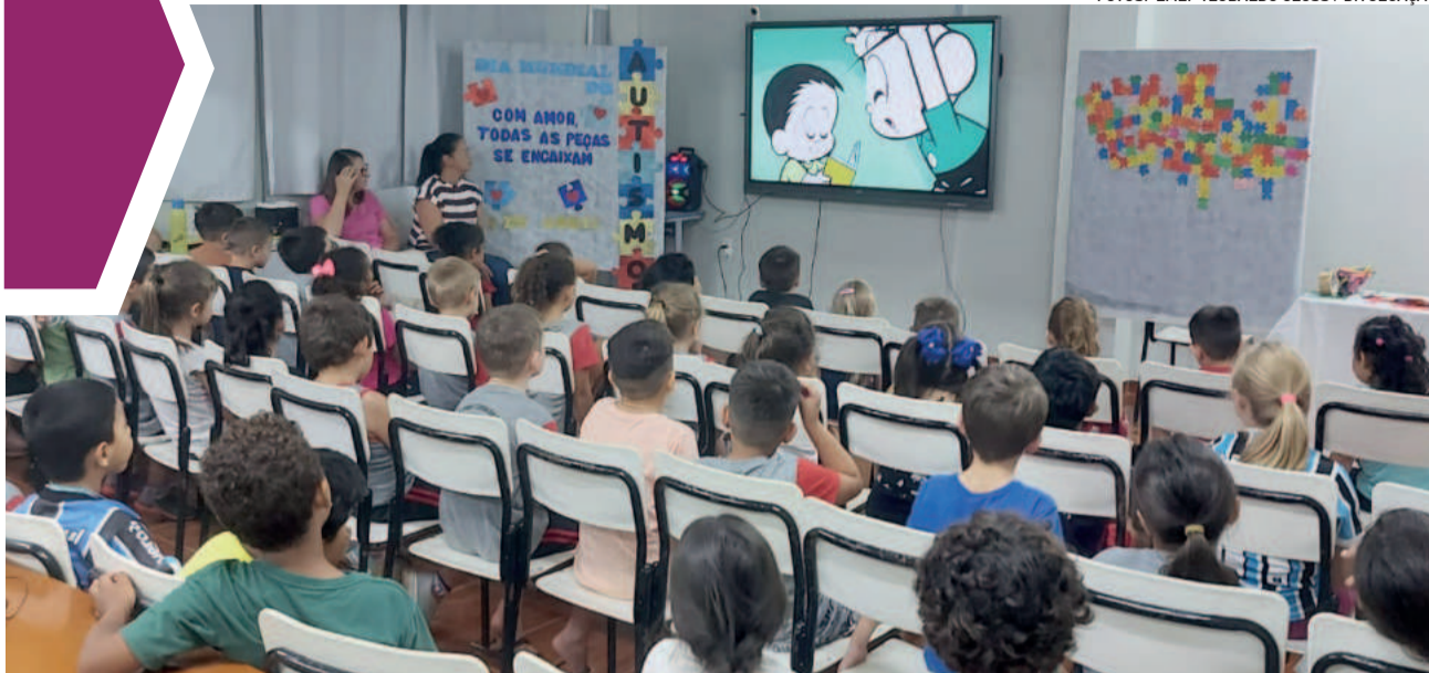
Alunos da Educação Infantil assistiram animação sobre o assunto