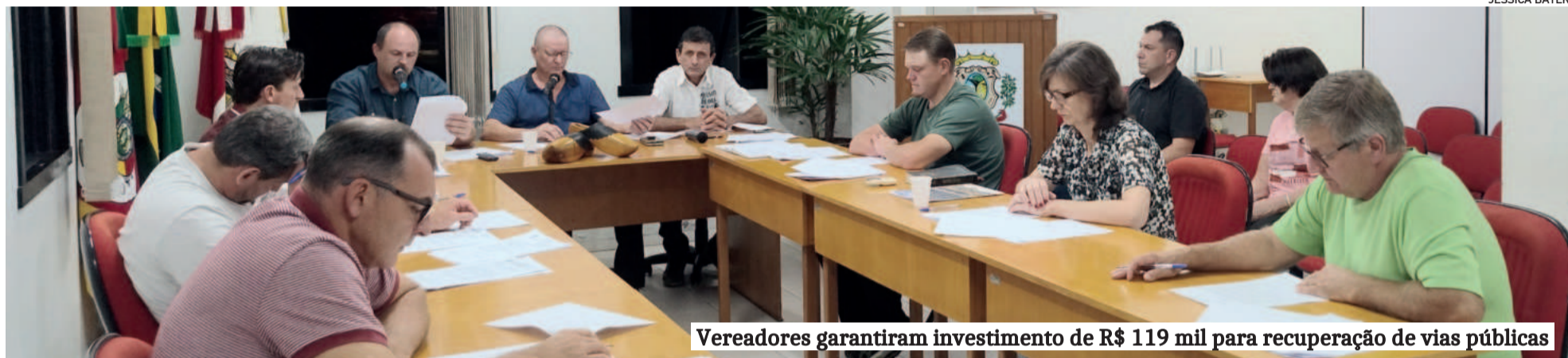
Vereadores garantiram investimento de R$ 119 mil para recuperação de vias públicas