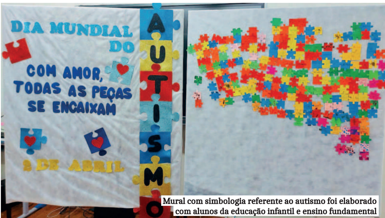
Mural com simbologia referente ao autismo foi elaborado com alunos da educação infantil e ensino fundamental

Eles apontam que foi um dia de aprendizado profundo, troca de experiências e, acima de tudo, de celebração da diversidade.