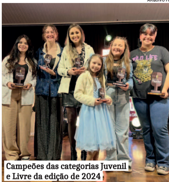
Campeãs das categorias Juvenil e Livre da edição de 2024