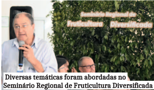
Diversas temáticas foram abordadas no Seminário Regional de Fruticultura Diversificada