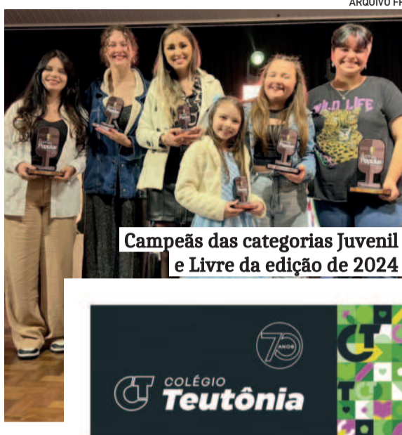
Campeãs das categorias Juvenil e Livre da edição de 2024