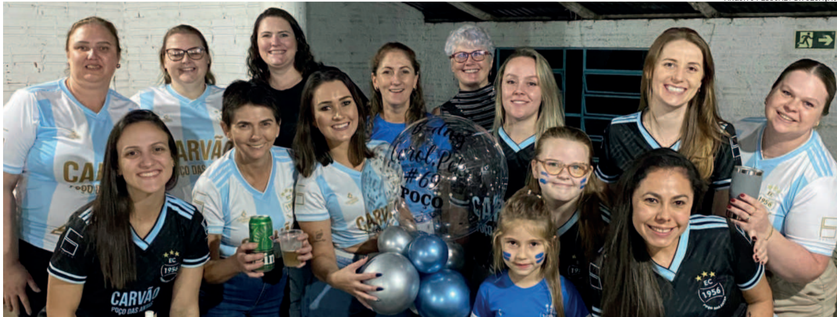
Torcedoras do Poço das Antas buscam espaço e representatividade por meio do esporte