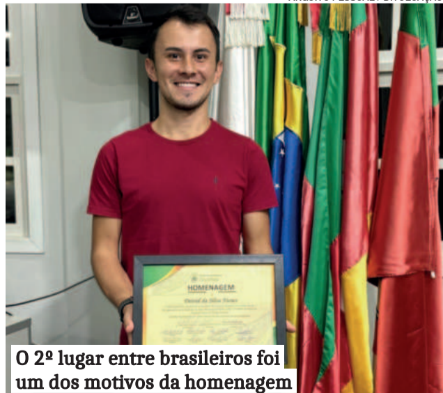
O 2º lugar entre brasileiros foi um dos motivos da homenagem