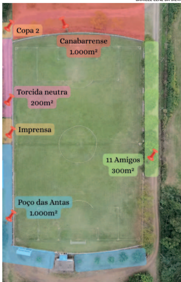
De maneira conjunta, a divisão de espaços ficou definida para o jogo em Poço das Antas