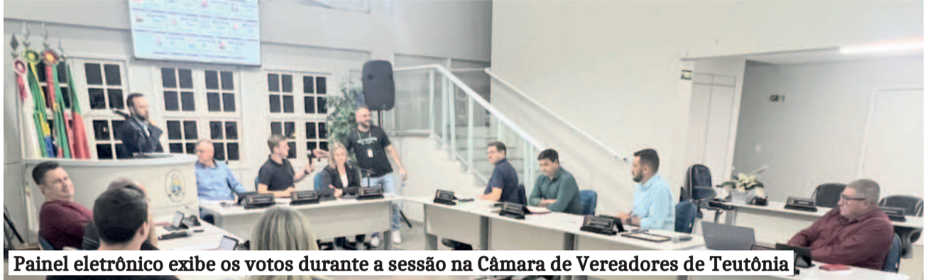
Painel eletrônico exibe os votos durante a sessão na Câmara de Vereadores de Teutônia

O novo sistema permite que cada vereador registre sua presença e seu voto por meio de um tablet, e os resultados