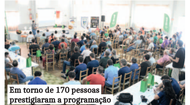
Em torno de 170 pessoas prestigiaram a programação

Em Poço das Antas, as principais atividades são silvicultura, produção de leite, integração de aves e suínos. "Nossas terras aqui são todas montanhosas. O jovem não quer mais esse trabalho de penosidade. Temos que trazer alternativas para ele. No leite, como te-