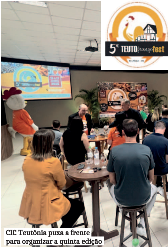
CIC Teutônia puxa a frente para organizar a quinta edição