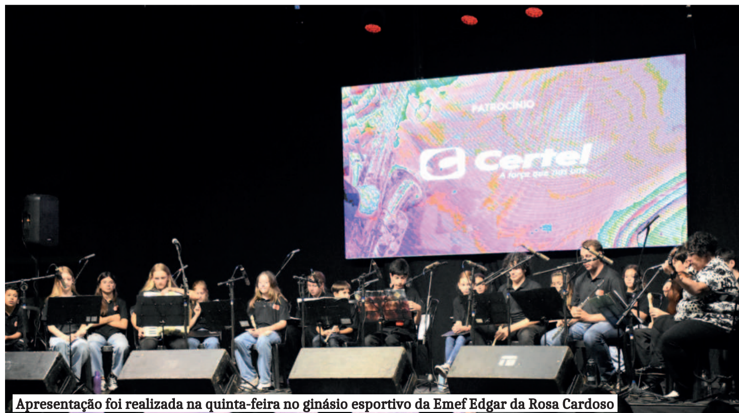
Apresentação foi realizada na quinta-feira no ginásio esportivo da Emef Edgar da Rosa Cardoso

A Orquestra Jovem Paz em Concerto nasceu com o objetivo de valorizar e incentivar a música orquestral, especialmente entre os jovens, garantindo sua continuidade e expansão entre as novas gerações. É um movimento de formação, inclusão e transformação social por meio da arte.