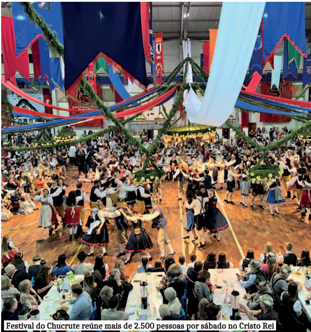
Festival do Chucrute reúne mais de 2.500 pessoas por sábado no Cristo Rei

No segundo fim de semana, dia 24, à noite, tem o segundo baile do Festival do Chucrute - um dos eventos mais emblemáticos do calendário cultural do Rio Grande do Sul, promovendo a herança germânica, a música, a dança e a gastronomia típicas da região. No café colonial do dia 25, o Grupo de Danças lançará o espetáculo que será levado para a Turnê Europa, de 30 de maio a 25 de junho.