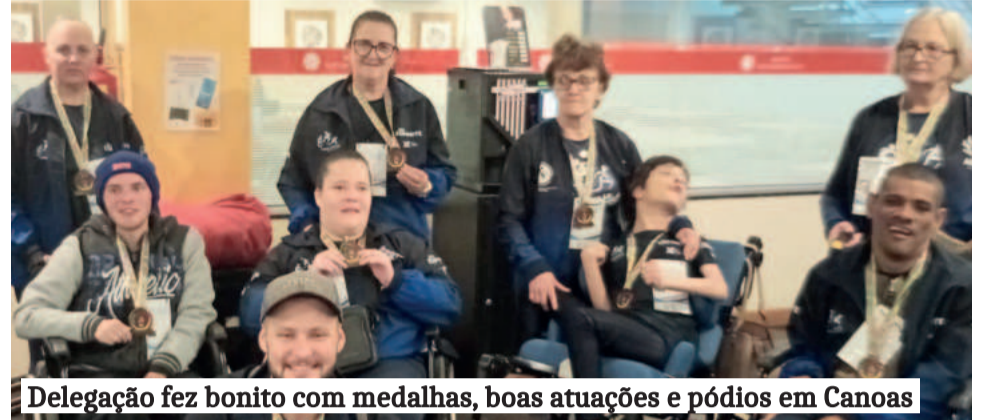
Delegação fez bonito com medalhas, boas atuações e pódios em Canoas

Ela também ressalta todo o trabalho e dedicação imposto pela comis-