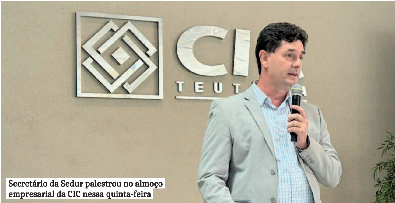
Secretário da Sedur palestrou no almoço empresarial da CIC nessa quinta-feira