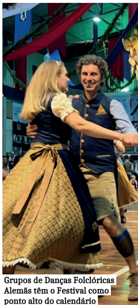
Grupos de Danças Folclóricas Alemãs têm o Festival como ponto alto do calendário