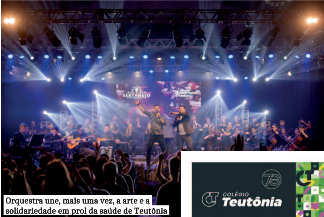
Orquestra une, mais uma vez, a arte e a solidariedade em prol da saúde de Teutônia

Os ingressos são limitados e vendidos ao valor