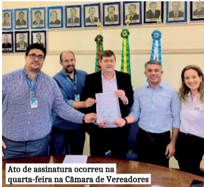
Ato de assinatura ocorreu na quarta-feira na Câmara de Vereadores