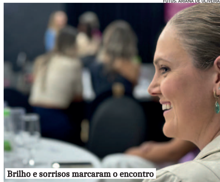
Brilho e sorrisos marcaram o encontro

O evento também foi uma oportunidade para