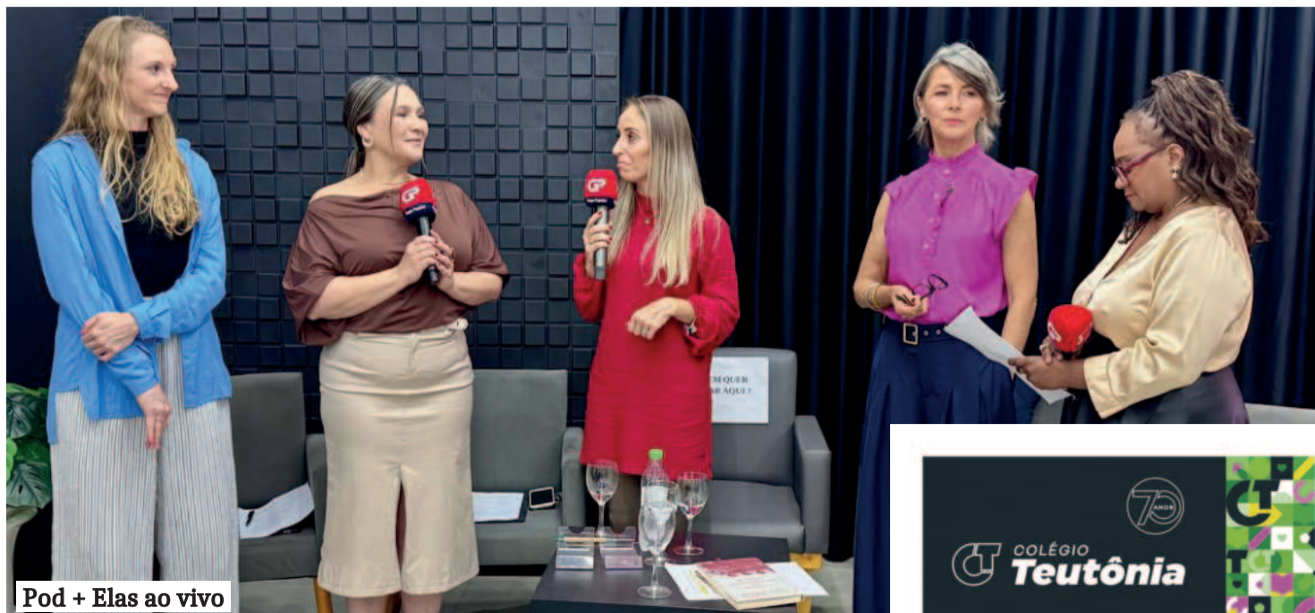
Pod + Elas ao vivo

“Preciso reconhecer a importância de cada mulher que fez e faz parte desta história, seja como protagonista no microfone, como plateia, seguidora ou ouvinte”, completou.