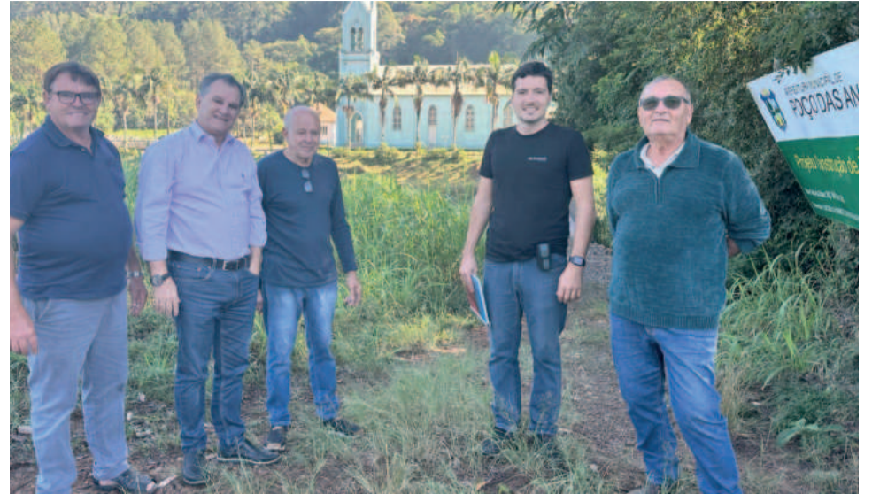
Visitas técnicas buscaram auxiliar municípios como Poço das Antas a montar projetos

O presidente da CIC demonstrou otimismo quanto à aprovação dos projetos e destacou a importância de garantir os recursos necessários para a recuperação da infraestrutura da região afetada pelas chuvas.