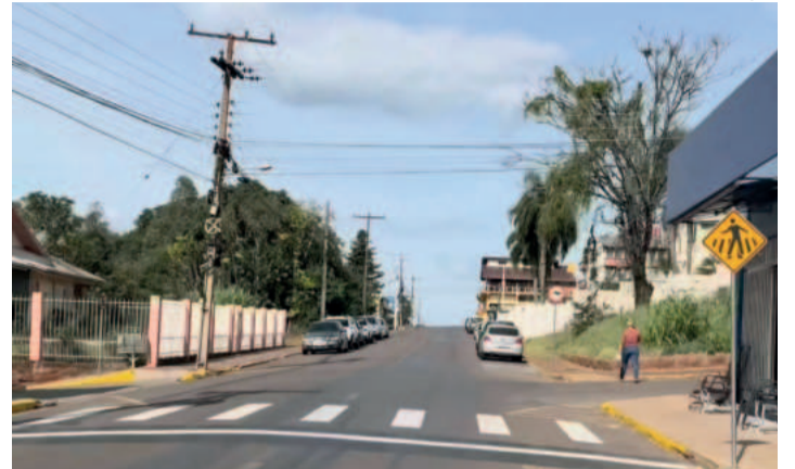
Trecho entre as ruas Capitão Schneider e Tiradentes passa a ser mão única