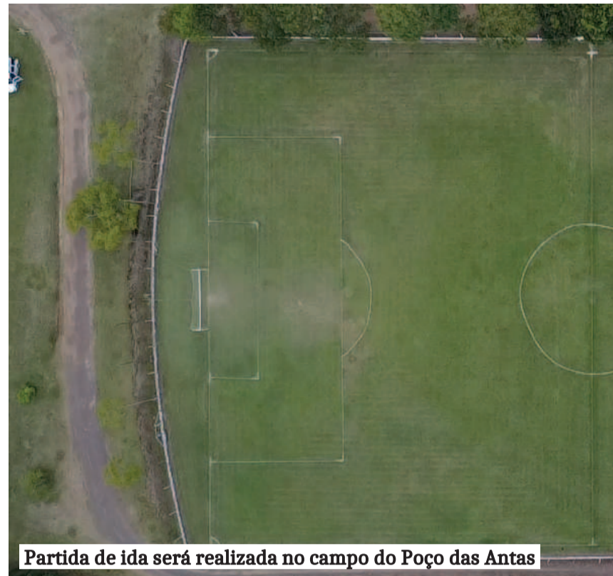
Partida de ida será realizada no campo do Poço das Antas