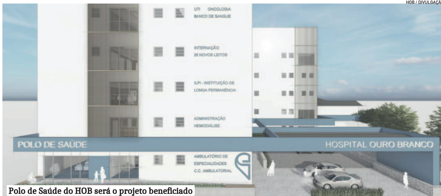
Polo de Saúde do HOB será o projeto beneficiado

A obra será erguida em etapas, utilizando R$ 18 milhões para a construção do esqueleto (estrutura do prédio e fechamento) no 1º ano; R$ 14 milhões para a inauguração da UTI, Oncologia e Banco de Sangue no 2º ano; R$ 12 milhões para novos leitos de internação e ILPI (3º ano); e R$ 8 milhões para o Ambulatório de Especialidades e Centro Cirúrgico Ambulatório (4º ano).