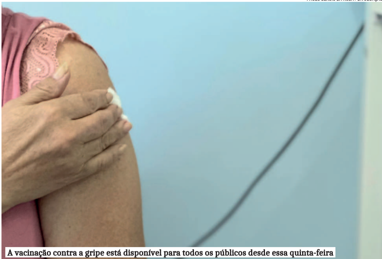
A vacinação contra a gripe está disponível para todos os públicos desde essa quinta-feira