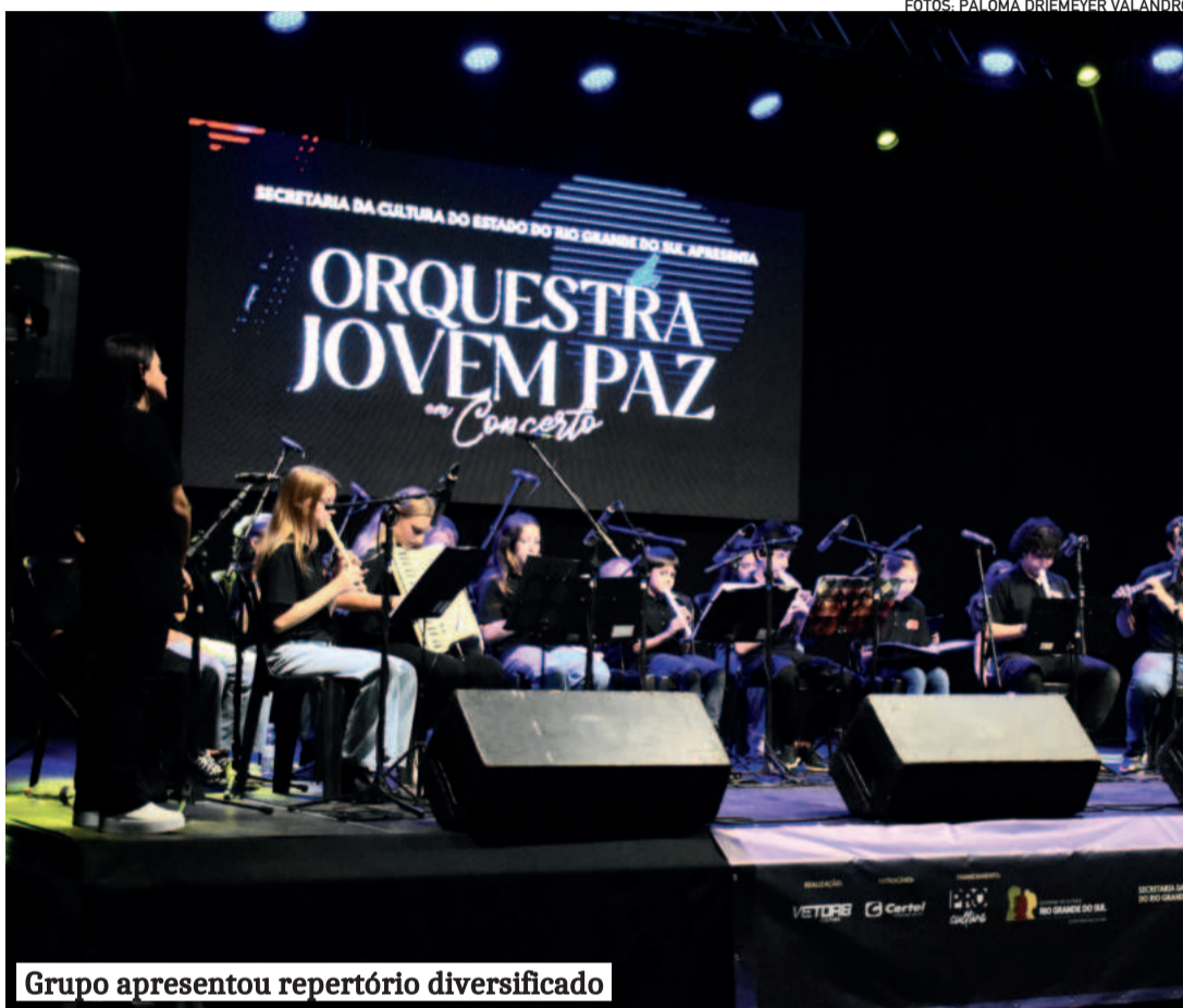
Grupo apresentou repertório diversificado

Às 17h, antecedendo a apresentação, um concerto didático oportunizou que crianças e jovens se aproximassem da arte do canto e da música. “Foi um momento muito rico e valioso para as nossas crianças e jovens. Somos gratos por escolherem Fazenda