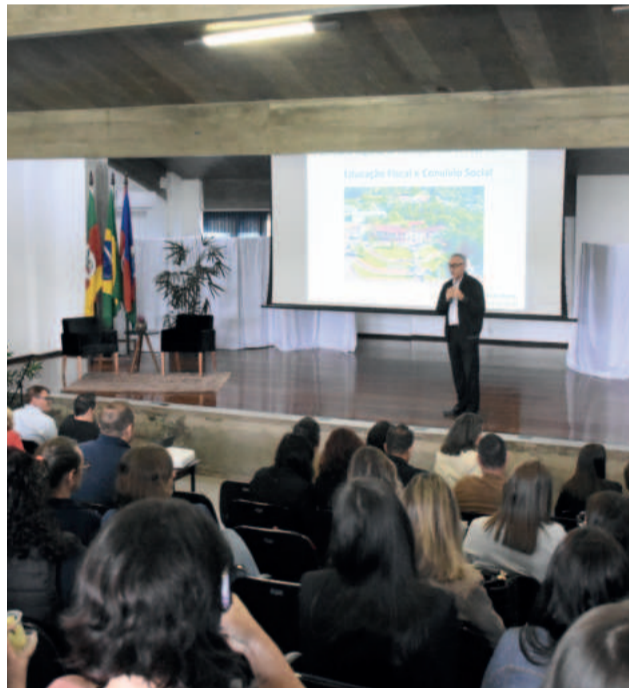
Diversas palestras preencheram a programação