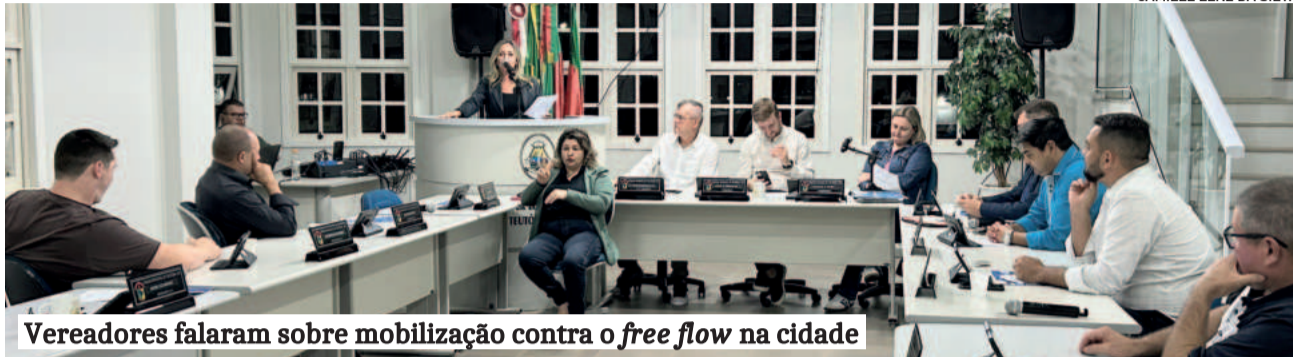
Vereadores falaram sobre mobilização contra o free flow na cidade

ao Executivo quais os valores gastos com o PA+ e os contratos da Univates entre o início de 2024 e o começo de 2025. Reforçou o pedido de travessia elevada nas Posses.