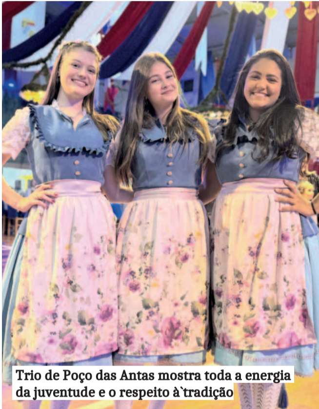
Trio de Poço das Antas mostra toda a energia da juventude e o respeito à tradição