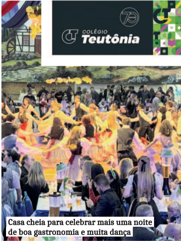
Casa cheia para celebrar mais uma noite de boa gastronomia e muita dança