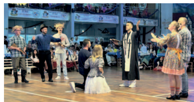
Pode não parecer, mas o forró e a festa de São João têm relação direta com a Europa