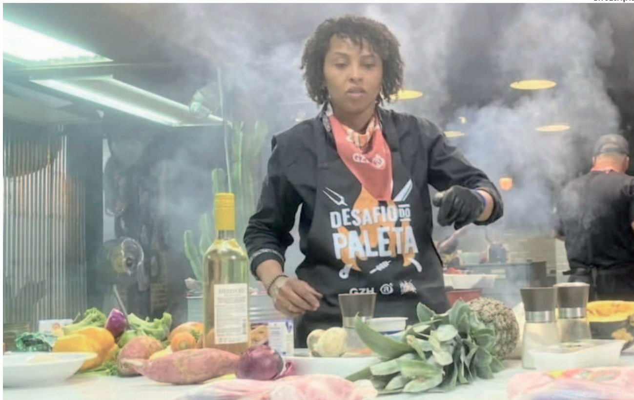
A cada episódio, uma nova receita acompanhava a parilla de cordeiro