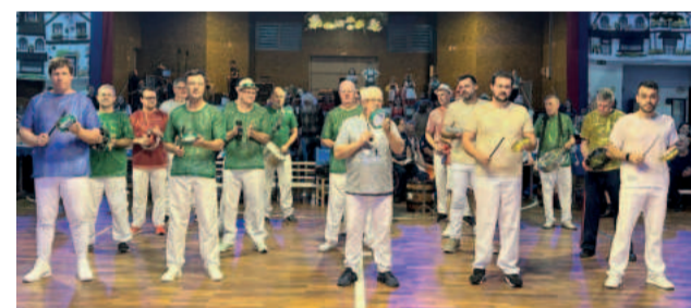
Alemães serão agraciados com ritmo carnavalesco