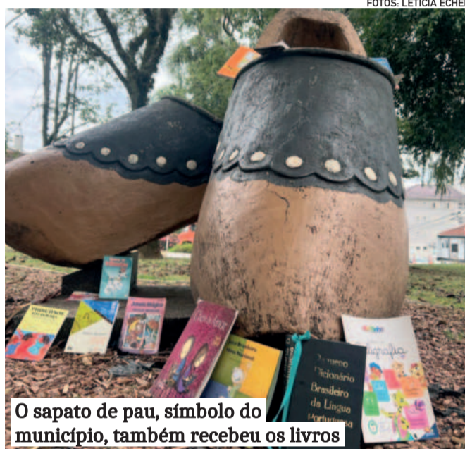
O sapato de pau, símbolo do município, também recebeu os livros