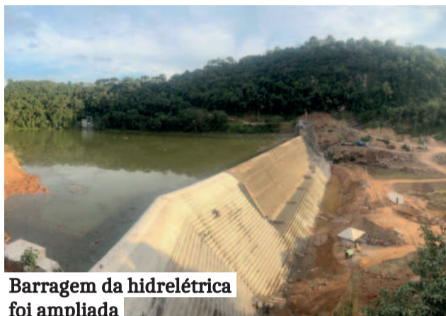
Barragem da hidrelétrica foi ampliada

Investimento de R$ 45 milhões garante geração de energia limpa para 20 mil famílias do Vale do Taquari