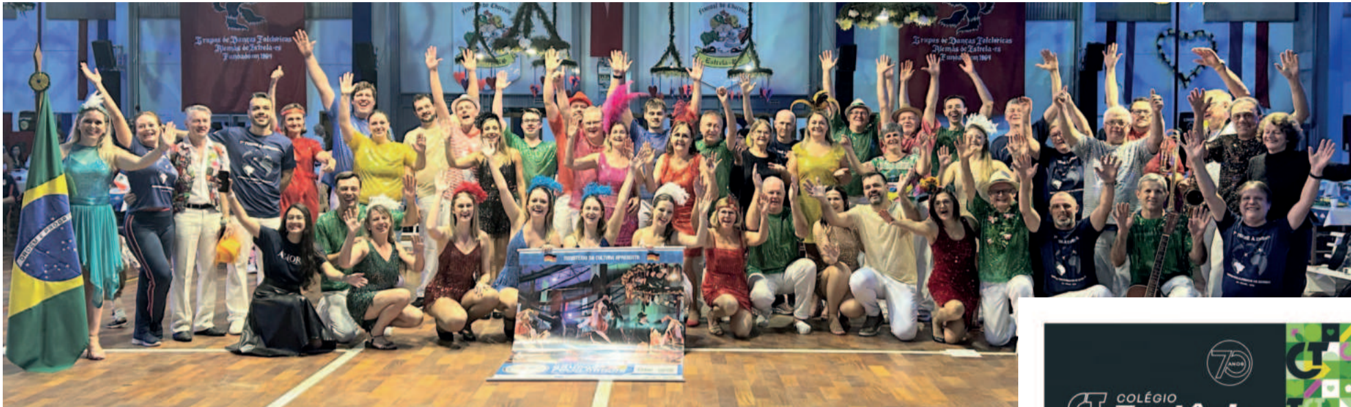
Grupo com 50 integrantes viaja nesta sexta-feira