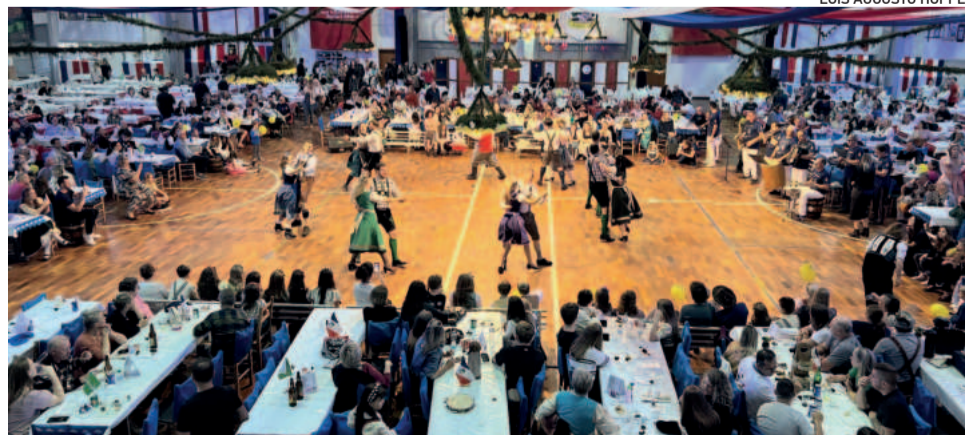
Centenas de pessoas lotaram o Centro Comunitário Cristo Rei no domingo