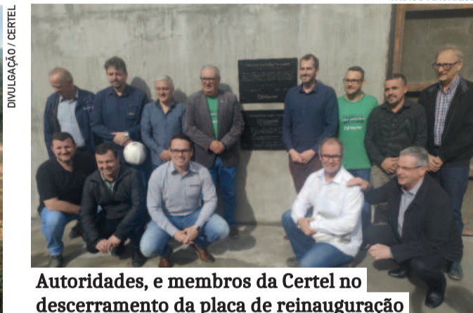
Autoridades, e membros da Certel no descerramento da placa de reinauguração