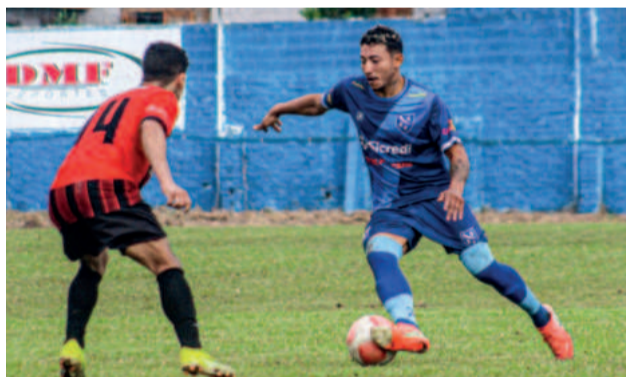
Mesmo com chuva, competições foram realizadas no sábado e no domingo

No sábado, em Progresso, os duelos de volta das semifinais das categorias Veteranos e Titulares definiram os classificados para as fi-