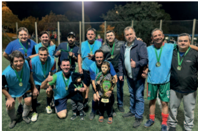
Time do Uruguai foi o vencedor no Veterano