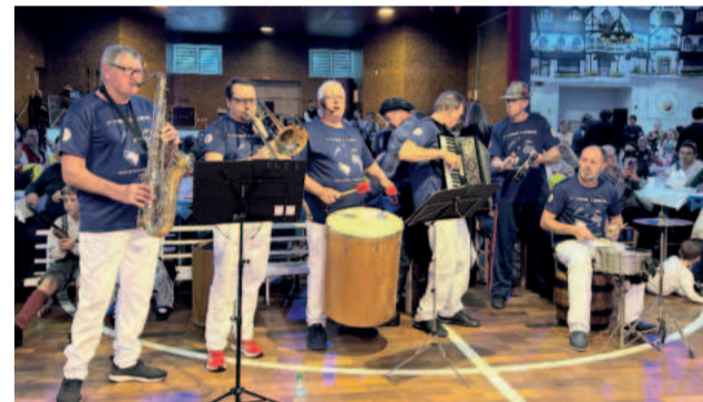
Banda 7 Amigos interpretará as canções ao vivo

Um dos exemplos que fortalece as relações é a visita dos Grupos Folclóricos à sede oficial da Atlas - patrocinadora da turnê à Europa -, em Dortmund, na Alemanha.