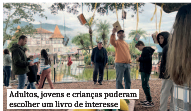
Adultos, jovens e crianças puderam escolher um livro de interesse