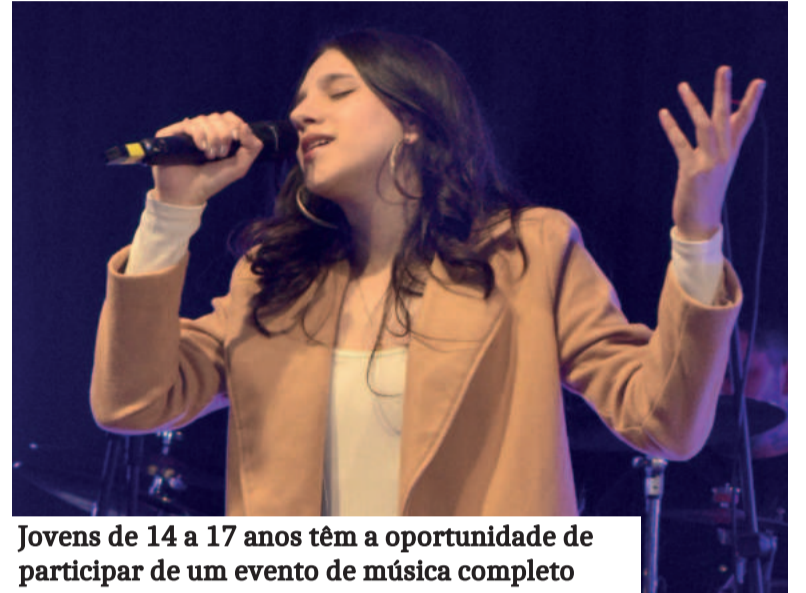
Jovens de 14 a 17 anos têm a oportunidade de participar de um evento de música completo