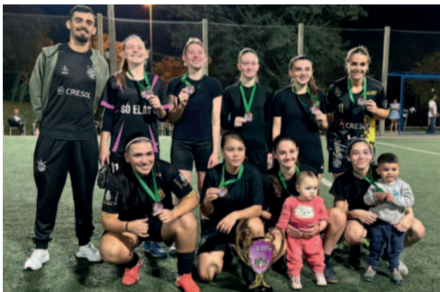
Canadá foi a equipe vencedora no Feminino