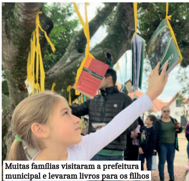
Muitas famílias visitaram a prefeitura municipal e levaram livros para os filhos