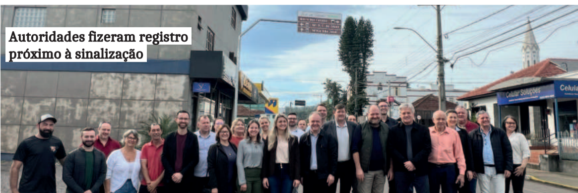
Autoridades fizeram registro próximo à sinalização