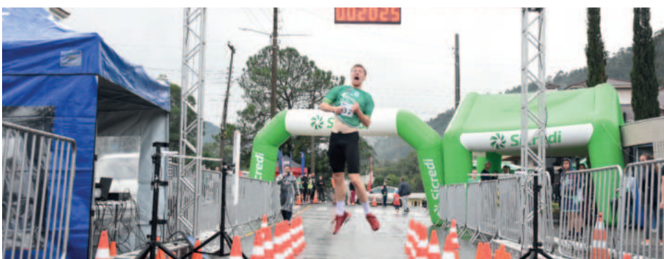
Muita vibração dos participantes nas chegadas