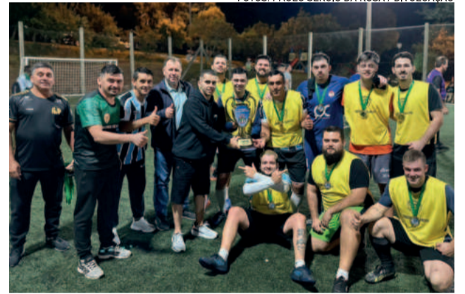
Comemoração no Força Livre pela equipe Irã