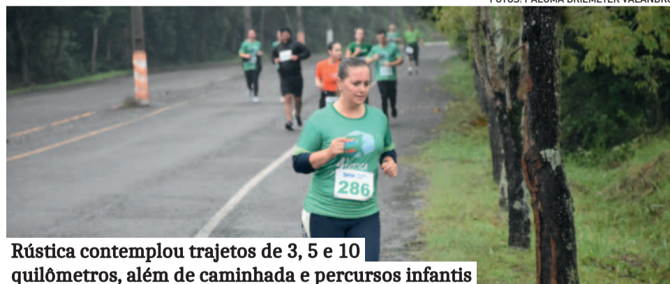
Rústica contemplou trajetos de 3, 5 e 10 quilômetros, além de caminhada e percursos infantis