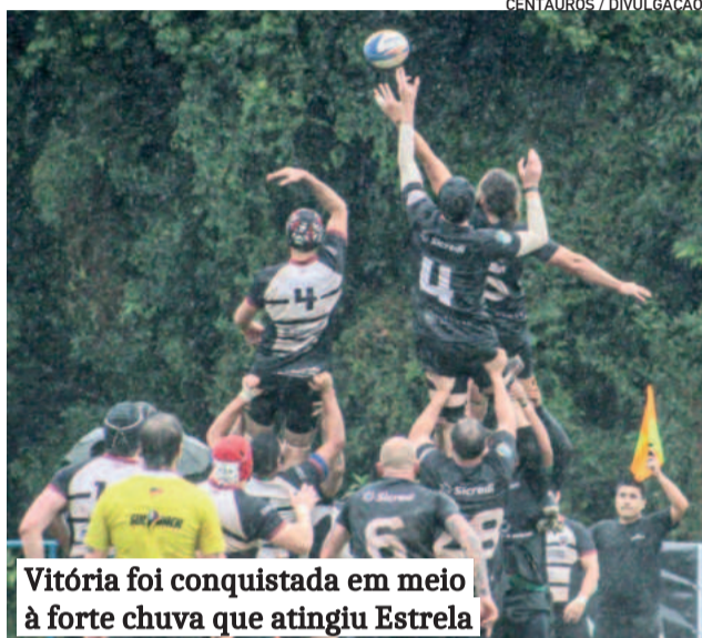
Vitória foi conquistada em meio à forte chuva que atingiu Estrela

Os planos de reativação da equipe feminina também seguem no radar do Centauros. O grupo já foi referência no estado antes do período da pandemia do coronavírus. “Há muitas mulheres interessadas em participar. Estamos na fase de organizar um momento só para elas conhecerem o esporte, com calma, para, em breve, voltarmos com força total na categoria”, considera.