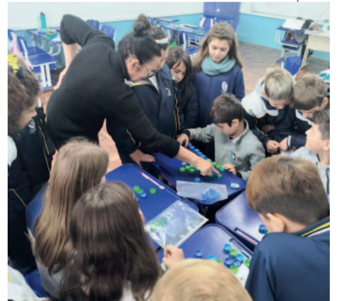
Vinda do planetário também envolve atividades como reforço em Matemática e Raciocínio Lógico