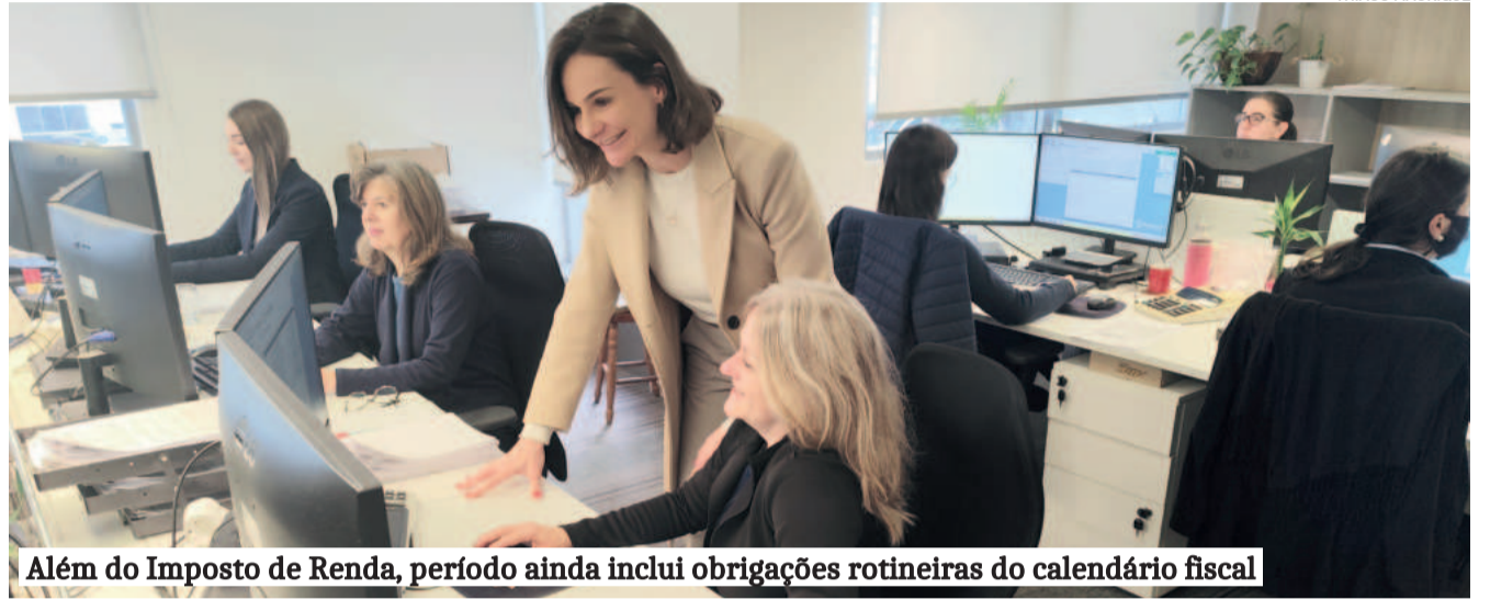
Além do Imposto de Renda, período ainda inclui obrigações rotineiras do calendário fiscal

Com o fim do prazo para entrega das declarações, profissionais da região ressaltam importância da organização antecipada