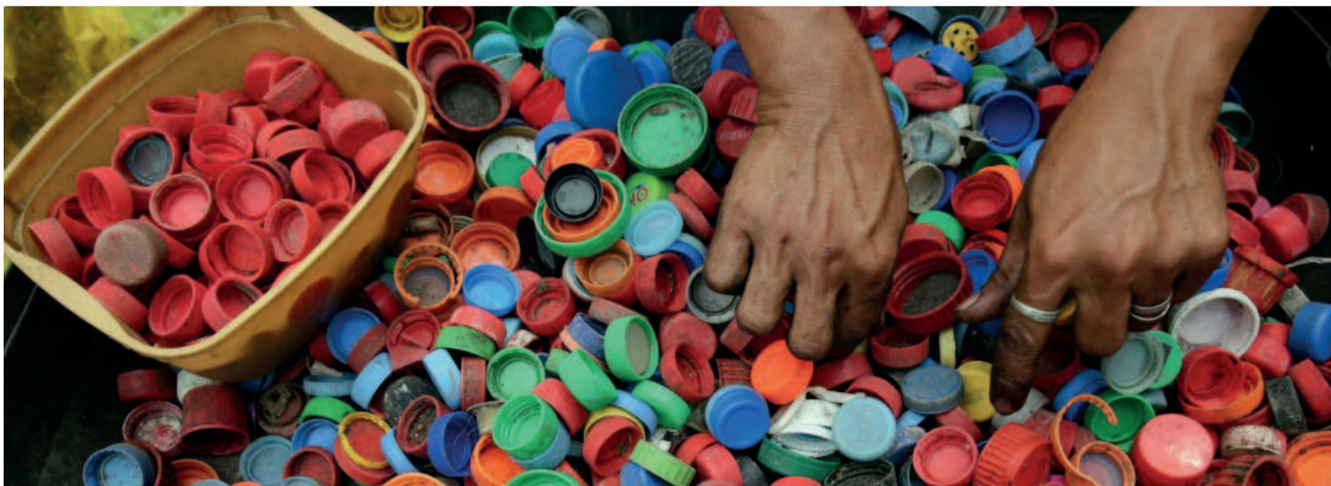
Projeto inclui a arrecadação de outros materiais, como blisters e lacres de alumínio