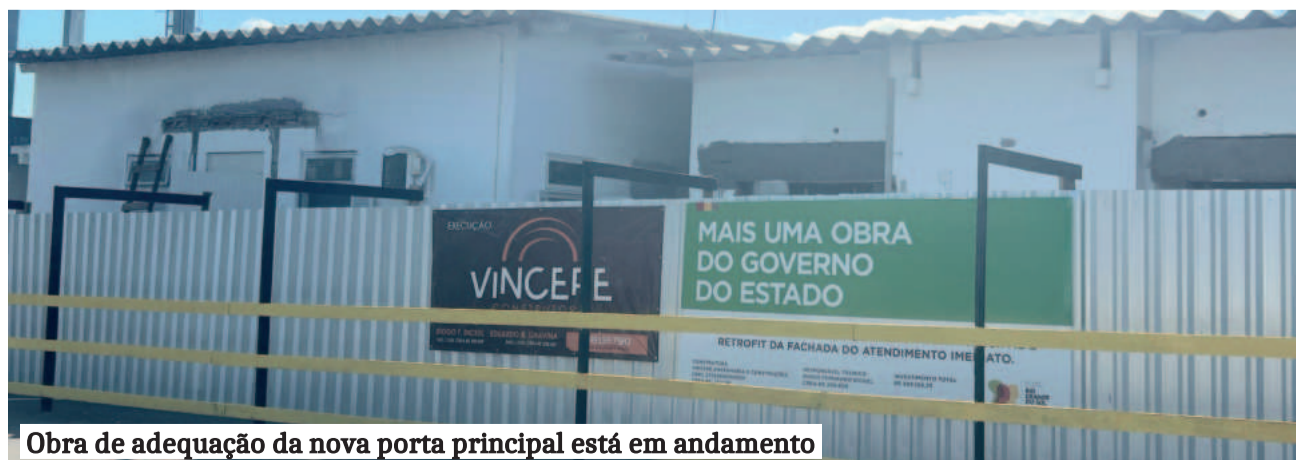
Obra de adequação da nova porta principal está em andamento

Após aprovação no Legislativo, a lei que denomina a Rota da Migração em Fazenda Vilanova foi sancionada na quinta-feira (29/5) pelo prefeito Amárico Luis da Silva.