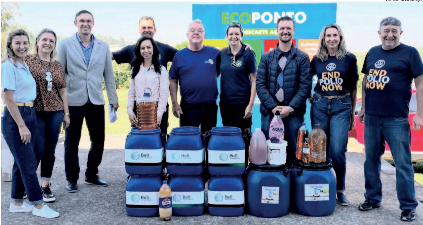
Projeto Olho do Óleo