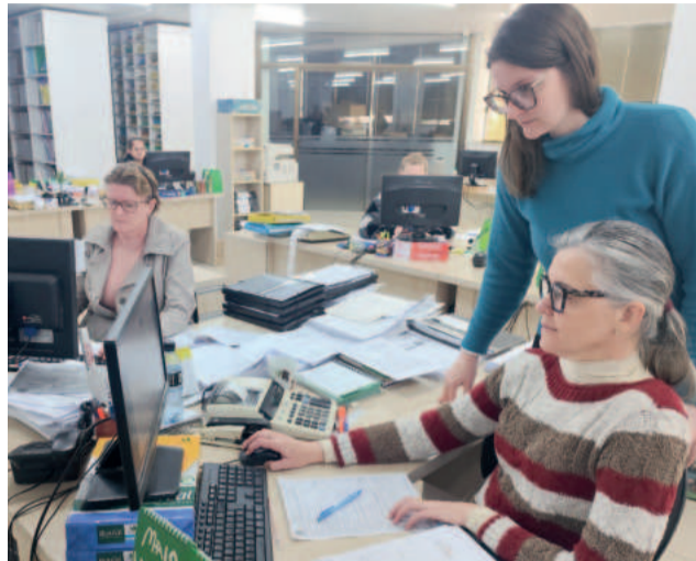
Escritórios estabelecem estratégias para suprir o aumento da demanda provocado pela entrega das declarações

Conforme Mallmann, a multa por atraso da entrega é de, no mínimo, R$ 165,74, ou 1% do imposto devido. Segundo ele, a partir do próximo ano existe grande possibilidade de ampliação na faixa de isenção para rendimento de até R$ 5 mil por