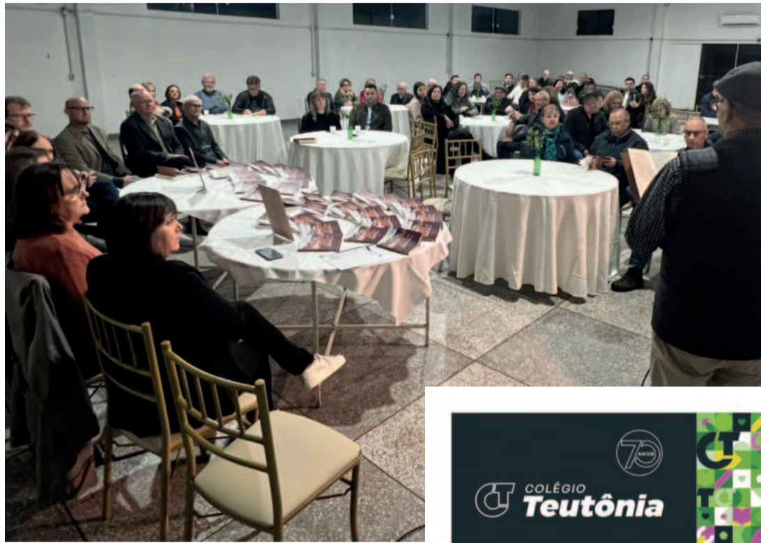
Livro Legado das Águas valoriza relatos reais para deixar na memória