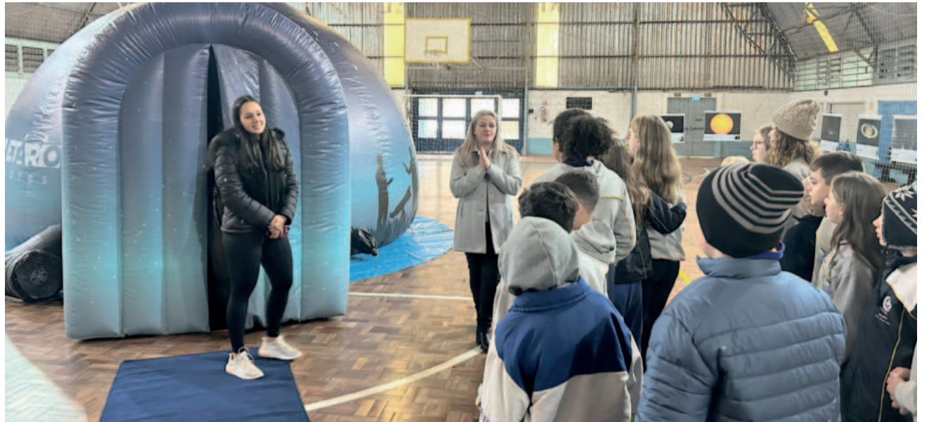
Planetário atendeu alunos da Educação Infantil ao Ensino Médio