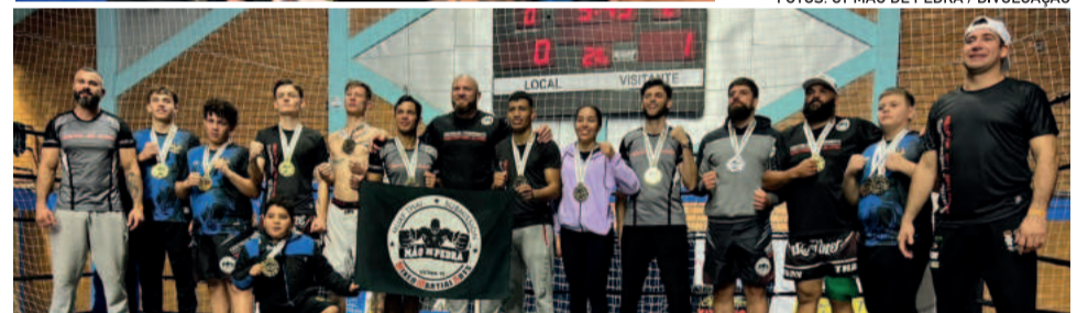
A equipe tem se consolidado como um polo de excelência no país e fora dele