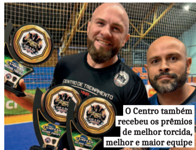
O Centro também recebeu os prêmios de melhor torcida, melhor e maior equipe

dividir as programações. Queremos manter a porta aberta para novos talentos e, ao mesmo tempo, elevar ainda mais o padrão técnico e estrutural da competição”, finaliza Dirlei.