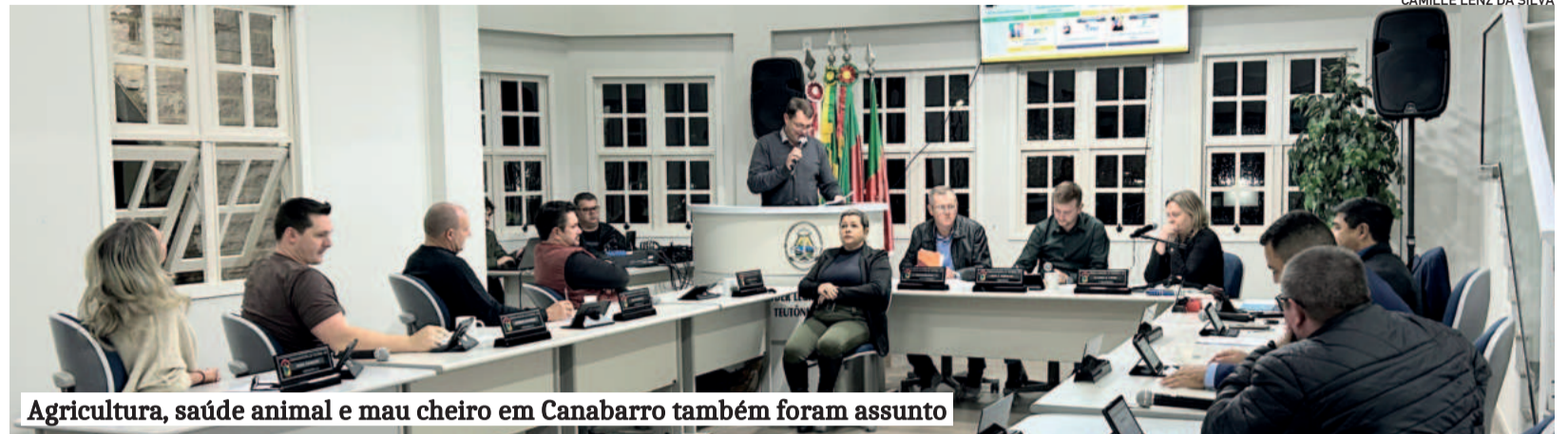
Agricultura, saúde animal e mau cheiro em Canabarro também foram assunto

Considerou “lamentável o descaso” com a referência em