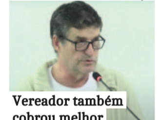
Vereador também cobrou melhor divulgação de ações contra gripe e dengue