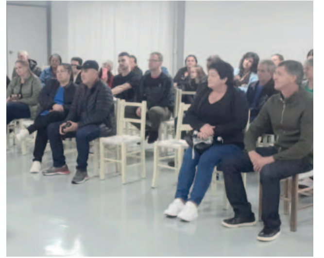
Reunião com ex-funcionários ocorreu na terça-feira (27/5)