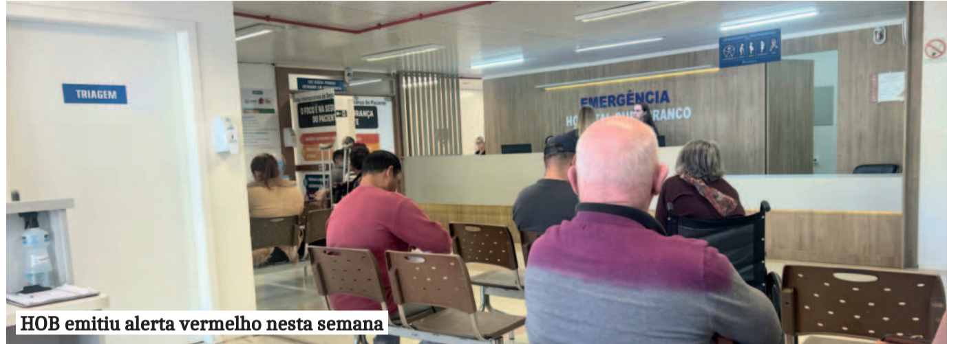
HOB emitiu alerta vermelho nesta semana