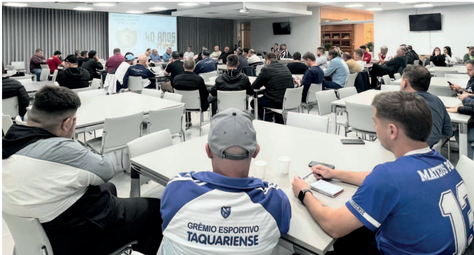
Detalhes foram definidos em reunião na terça-feira (27/5)

Bom Retiro do Sul e Taquari dão início às semifinais amanhã. Em Taquari, o Furacão enfrenta o São José nos Aspirantes e Titulares, enquanto o Juventude joga contra o Taquariense (Titulares) e o Colorado pega o Taquariense (Aspirantes). Em Bom Retiro do Sul, Limitados e Aecosajo entram em campo às 13h30. Mais tarde, o Grêmio pega o Lesionados.