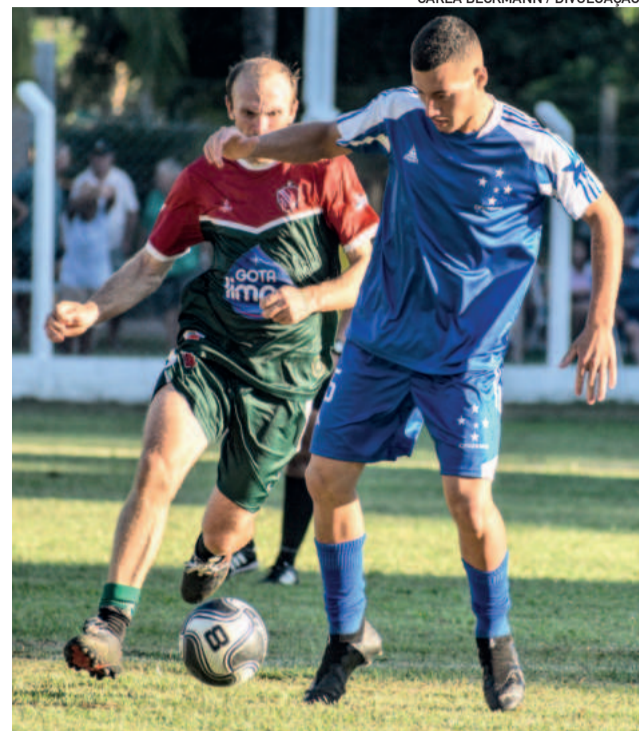
Partidas serão realizadas na sede do Riograndense em Daltro Filho