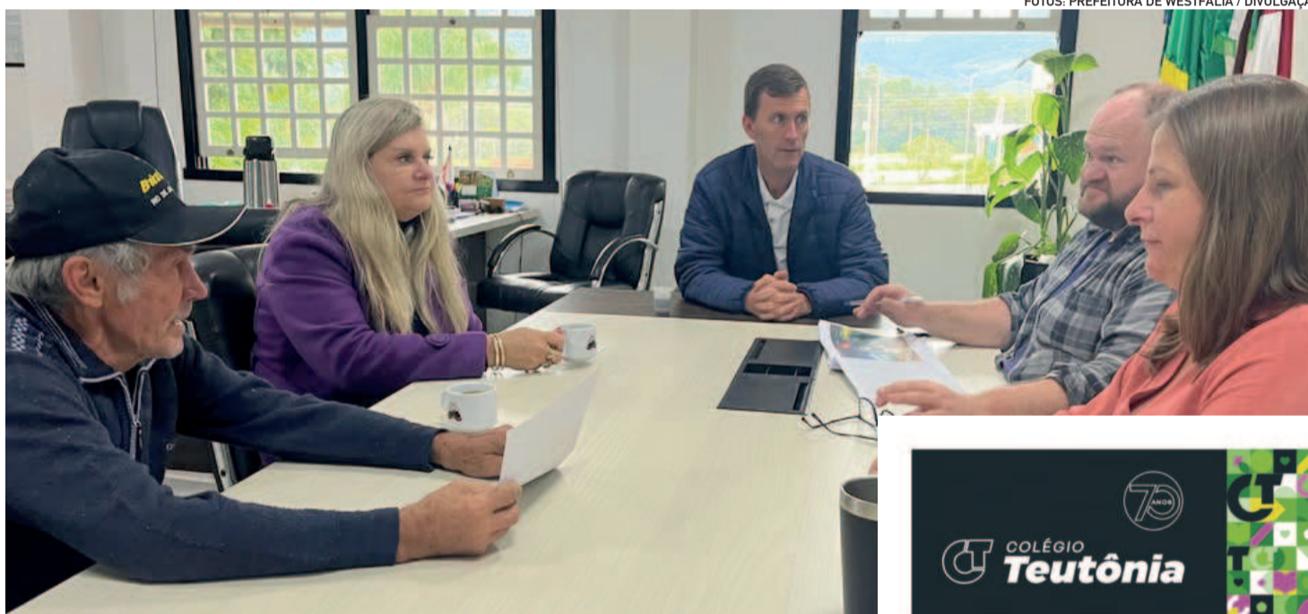
A programação completa do Natal de Westfália será divulgada nas próximas semanas