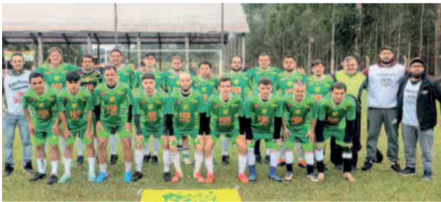
Amigos do Morro Bonito venceu o Brasil por 2 a 0

Os jogos de volta das semifinais serão realizados no domingo (15/6), na Sociedade Esportiva Morro Bonito, sede do Amigos do Morro Bonito, e definirão os clubes finalistas do Campeonato Municipal de Paverama.