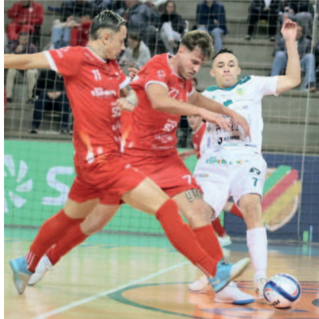
Nem a abertura do placar foi suficiente para a Alaf conquistar os 3 pontos