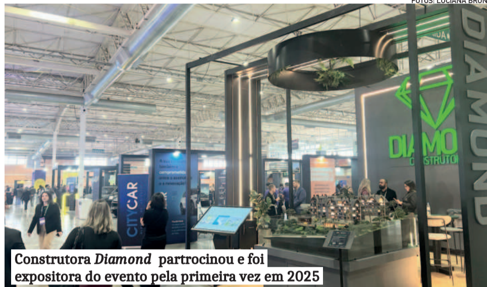
Construtora Diamond patrocinou e foi expositora do evento pela primeira vez em 2025