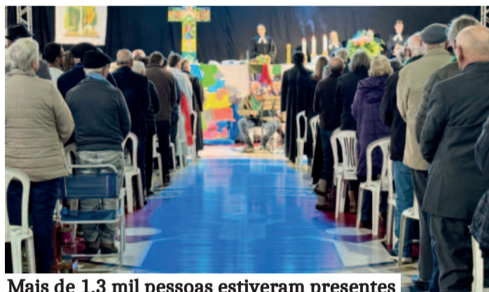
Mais de 1,3 mil pessoas estiveram presentes