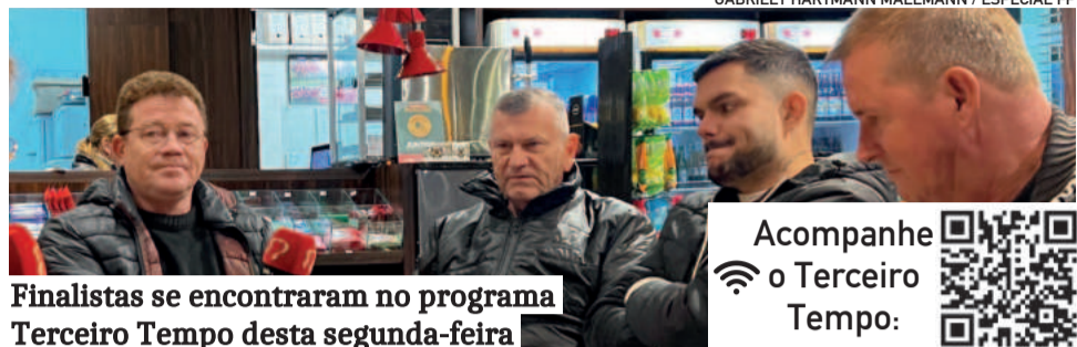
Finalistas se encontraram no programa Terceiro Tempo desta segunda-feira

Agora, o time enfrentará o Delfinense pela decisão da Série Prata. O clube do Distrito de Delfina já havia se classificado na semana passada com a goleada por 6 a 1 contra o Brasil, em