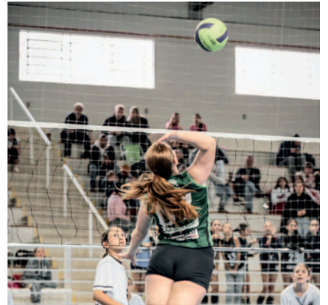
Primeira etapa foi realizada em Teutônia

A Superliga dos Vales integra o Projeto Evento Esportivo Juventus Voleibol, com financiamento do Pró-Esporte RS - Governo do Estado do Rio Grande do Sul e realização da Juventus Voleibol, de Teutônia.