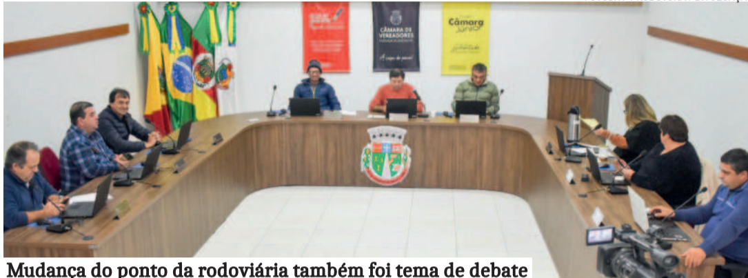
Mudança do ponto da rodoviária também foi tema de debate