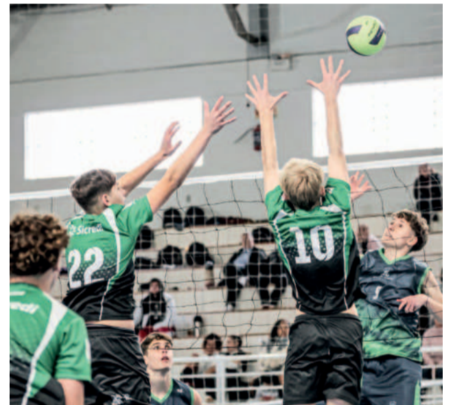
Competição foi idealizada para ampliar o acesso ao esporte e fortalecer o trabalho de base

Conexão, streaming e games em um só lugar!