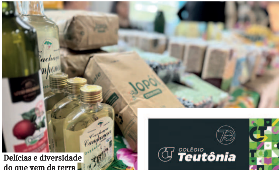
Delícias e diversidade do que vem da terra

Hoje, o Capa também trabalha com comunidades indígenas e quilombolas. "No início, a atuação era mais com a agricultura familiar. Agora, ampliamos, porque nossa missão diz que todas as pessoas têm direito à vida e à existência. E não só a existir, mas existir com vida boa", finaliza.