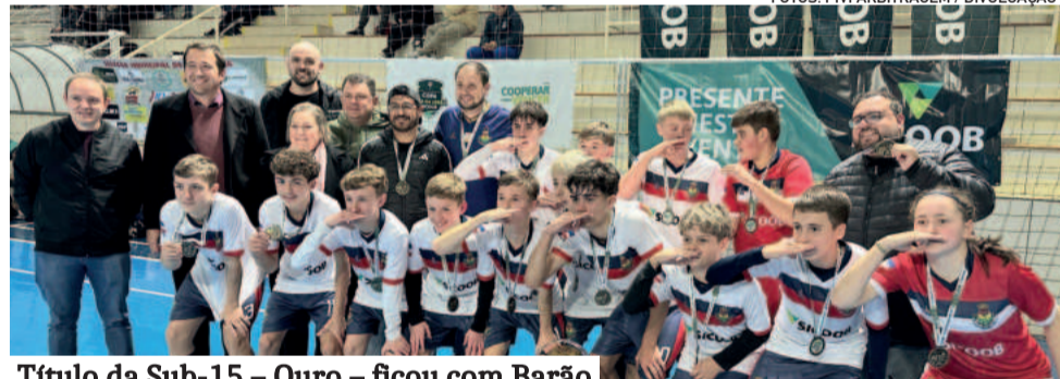
Título da Sub-15 – Ouro – ficou com Barão