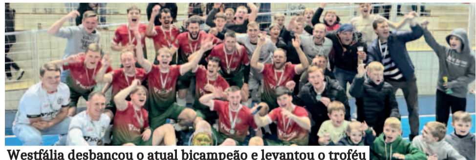
Westfália desbancou o atual bicampeão e levantou o troféu