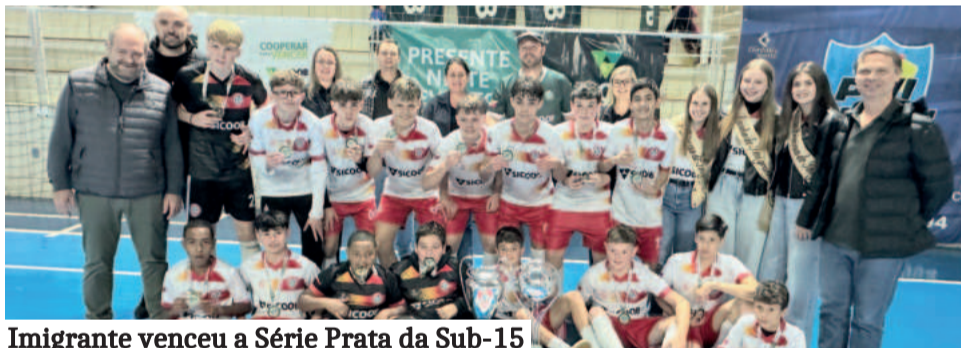
Imigrante venceu a Série Prata da Sub-15