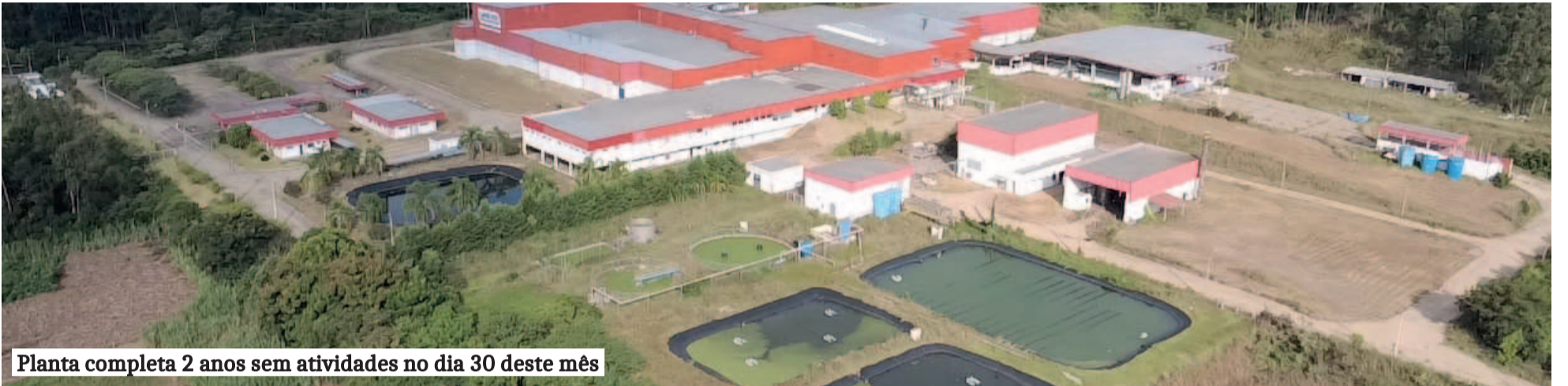
Planta completa 2 anos sem atividades no dia 30 deste mês