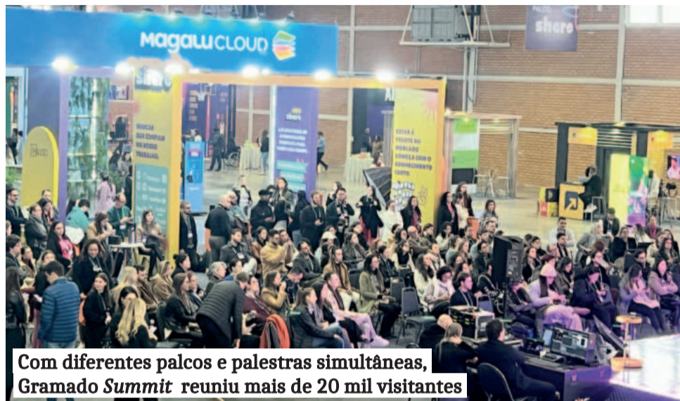
Com diferentes palcos e palestras simultâneas, Gramado Summit reuniu mais de 20 mil visitantes

Evento se consolida como espaço de aprendizado, diversidade de temas e trocas entre gerações, empresas e instituições educacionais