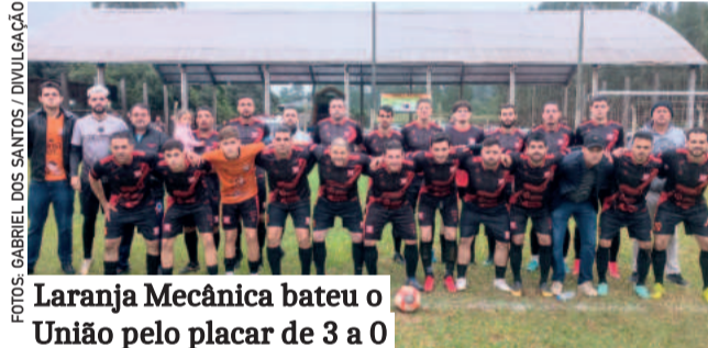
Laranja Mecânica bateu o União pelo placar de 3 a 0