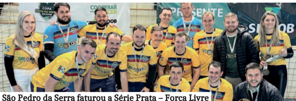
São Pedro da Serra faturou a Série Prata – Força Livre