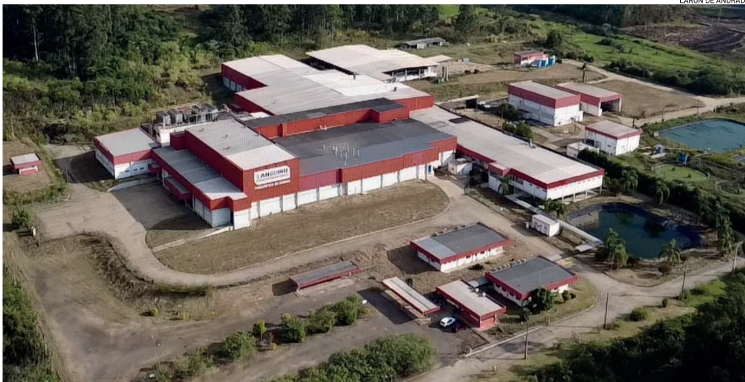
LARON DE ANDRADE

A Cooperativa Languiru leiloará seu Frigorífico de Suínos ( foto ) com lance mínimo de R$ 85 milhões, sendo que a planta já foi avaliada em R$ 160 milhões. O futuro comprador precisará investir cerca de R$ 300 milhões para a retomada das operações, desde o início do ciclo produtivo de suínos. A decisão ocorre após 2 anos de paralisação da planta e falha nas diferentes tentativas de venda direta. A medida visa acelerar o pagamento a credores e reativar a planta. A gestão já renegociou quase 50% da dívida e obteve R$ 40 milhões em resultados positivos no primeiro quadrimestre do ano. REGIÃO | 6 e 7