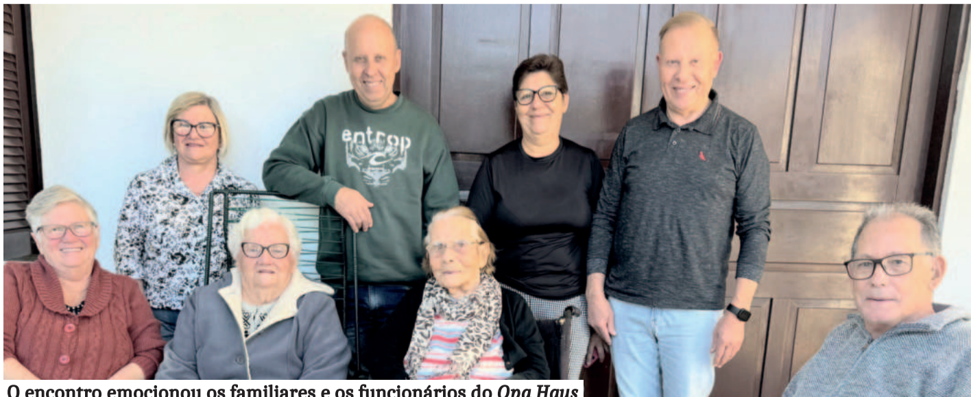
O encontro emocionou os familiares e os funcionários do Opa Haus

A incrível exuberância vegetal, nesta abençoada terra, torna praticamente impossível algum vivente morrer de fome nestas paragens nacionais.