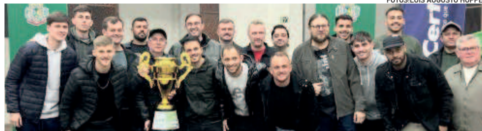
Canabarrense conquistou o tricampeonato dos Titulares