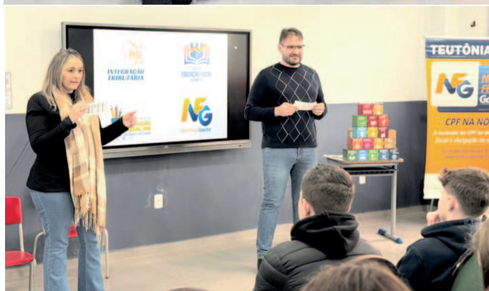
O Grupo de Educação Fiscal de Teutônia tem o objetivo de conscientizar a população sobre a importância dos impostos

postos ao município. "Achei muito legal aprender sobre os impostos. Quando nós pagamos os impostos, nós recebemos em troca. Quando pedimos a nota fiscal, podemos ver o