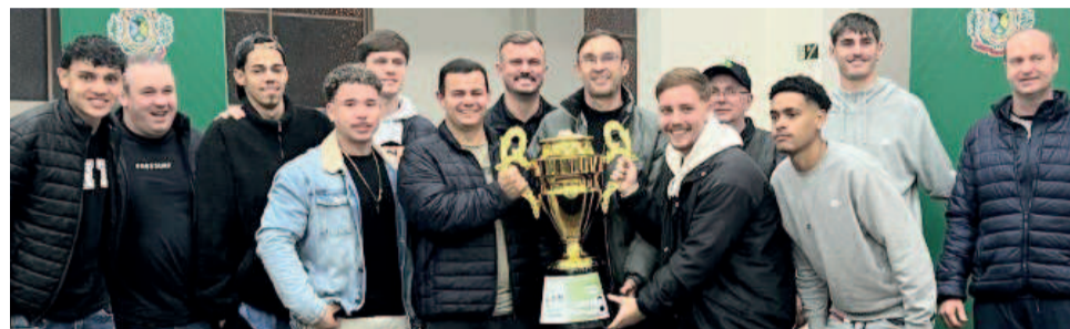
Aspirantes do Canabarrense foram campeões