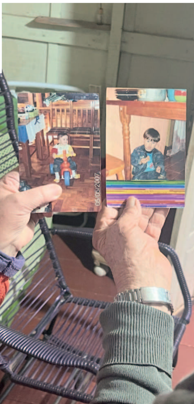
O casal guarda as fotos de quando o menino ainda não sofria com os sintomas da doença