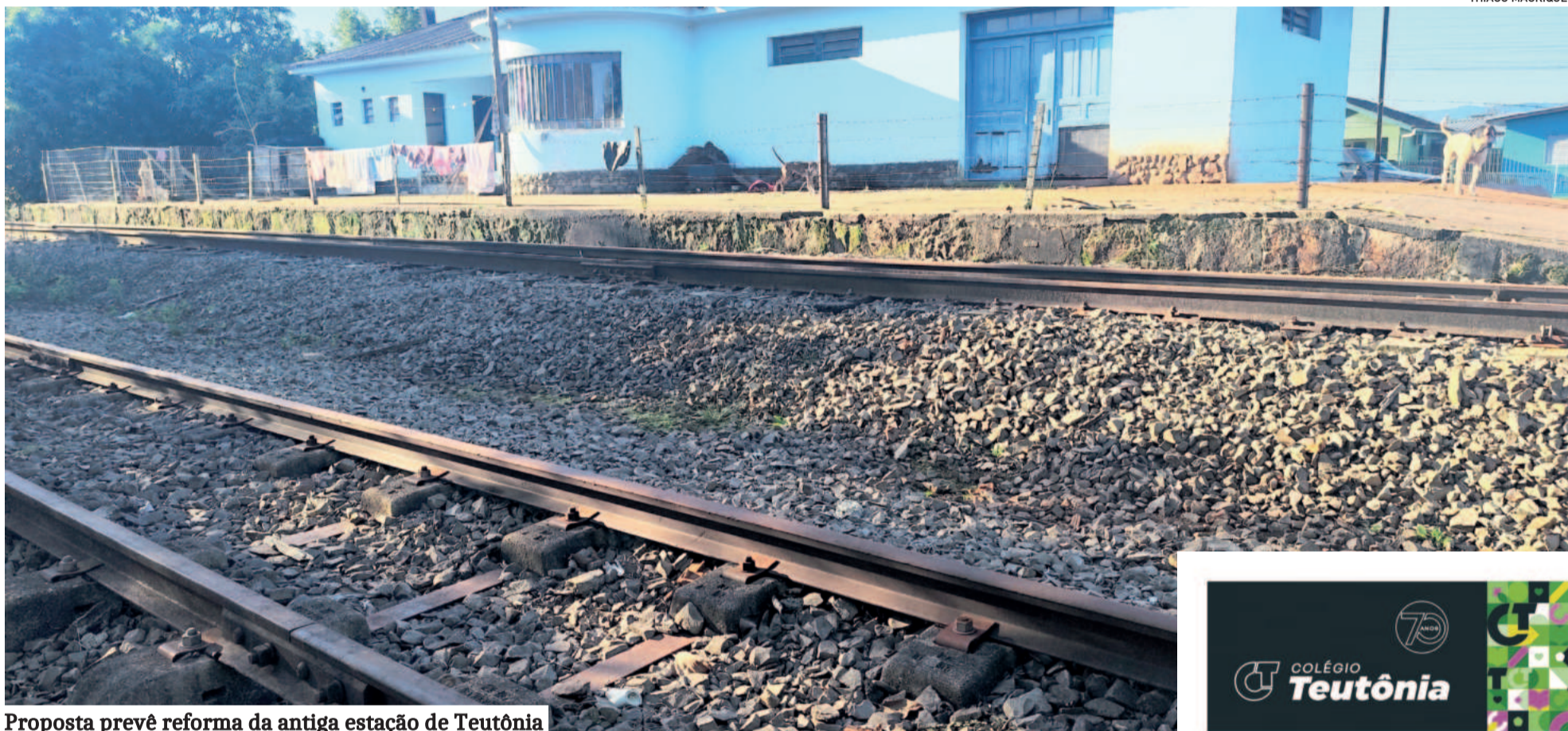
Proposta prevê reforma da antiga estação de Teutônia