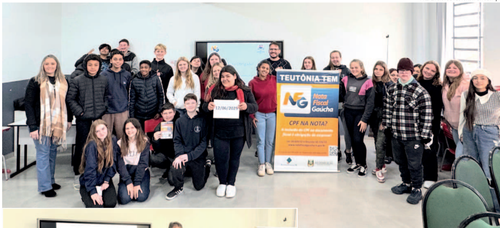
Alunos dos 8º e 9º anos participaram da palestra na quinta-feira

Já Lorenzo Frigo destacou o retorno dos im-