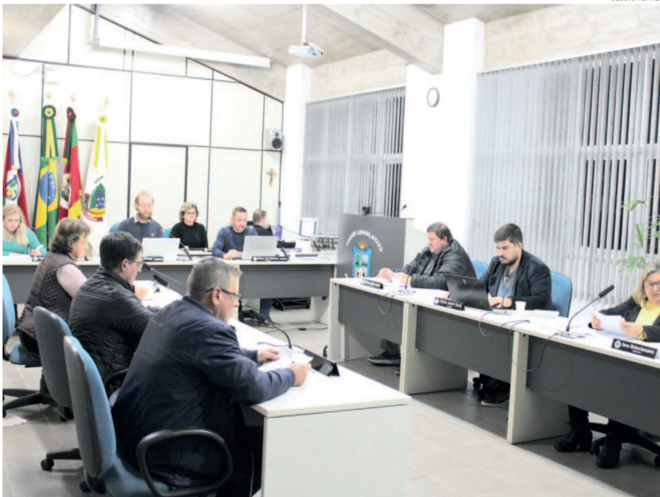
Mesmo com ressalvas, parecer do TCE foi aprovado por unanimidade