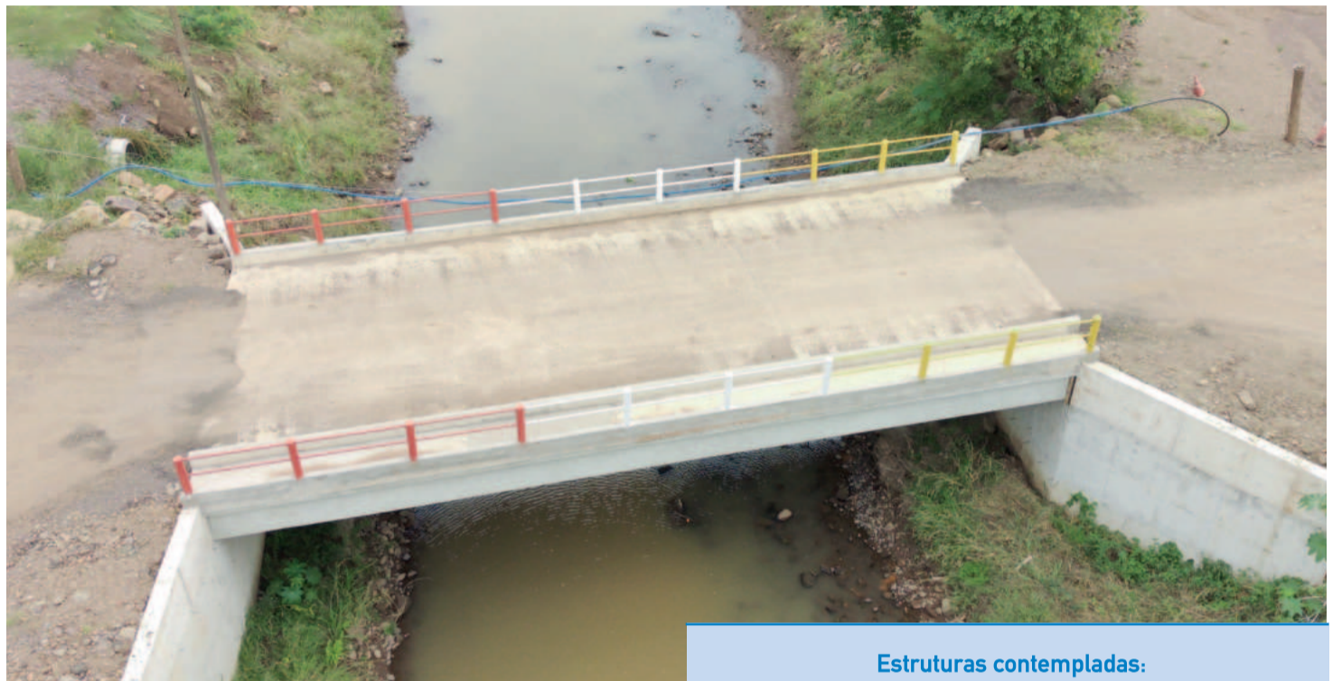
Ponte Hollmann é uma das estruturas finalizadas