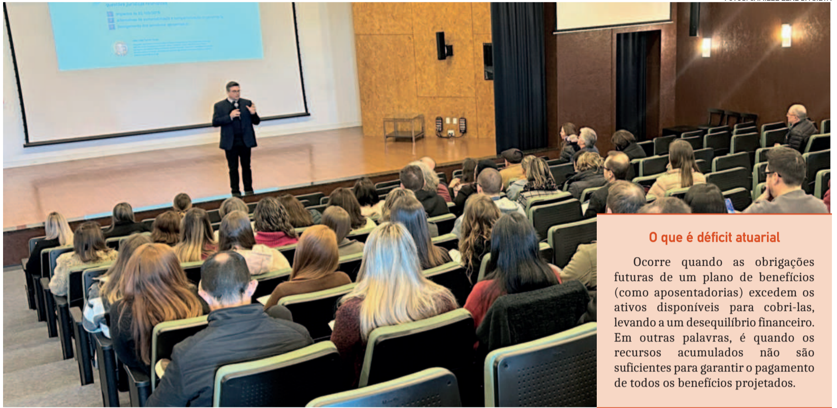
Evento foi realizado com gestores dos oito municípios que compõem a Amsol

Ele cita que o déficit atuarial é sério e precisa ser equacionado, mas a norma geralmente estabelece um prazo de 35 anos a partir de 2018 para que isso ocorra.