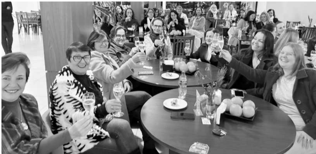
Mulheres brindaram e compartilharam experiências

Durante a live , participantes do público também foram convidadas a partilhar com as demais mulhe-