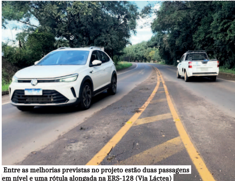
Entre as melhorias previstas no projeto estão duas passagens em nível e uma rótula alongada na ERS-128 (Via Láctea)