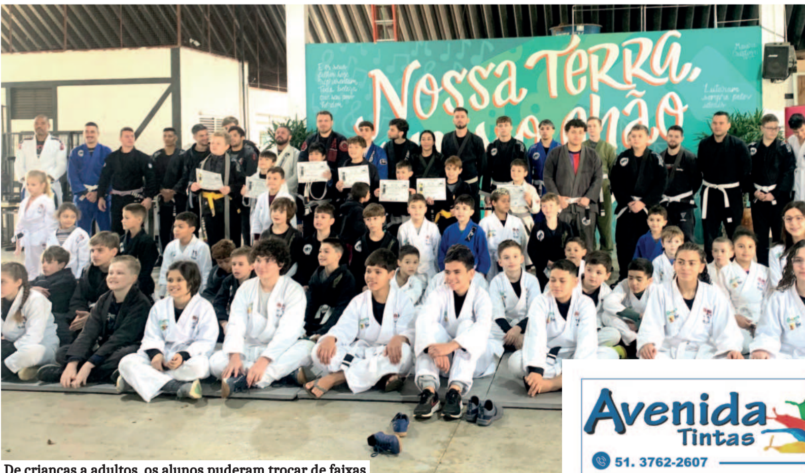
De crianças a adultos, os alunos puderam trocar de faixas