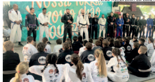
Trabalho realizado no CT recompensou atletas com a graduação