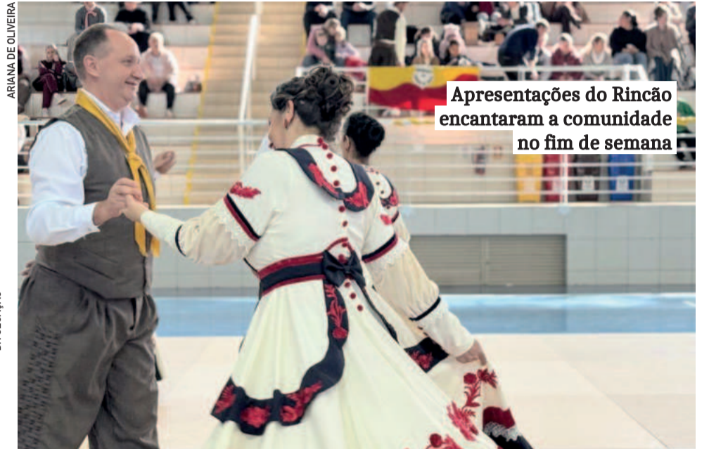
Apresentações do Rincão encantaram a comunidade no fim de semana