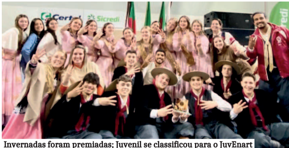
Invernadas foram premiadas; Juvenil se classificou para o JuvEnart