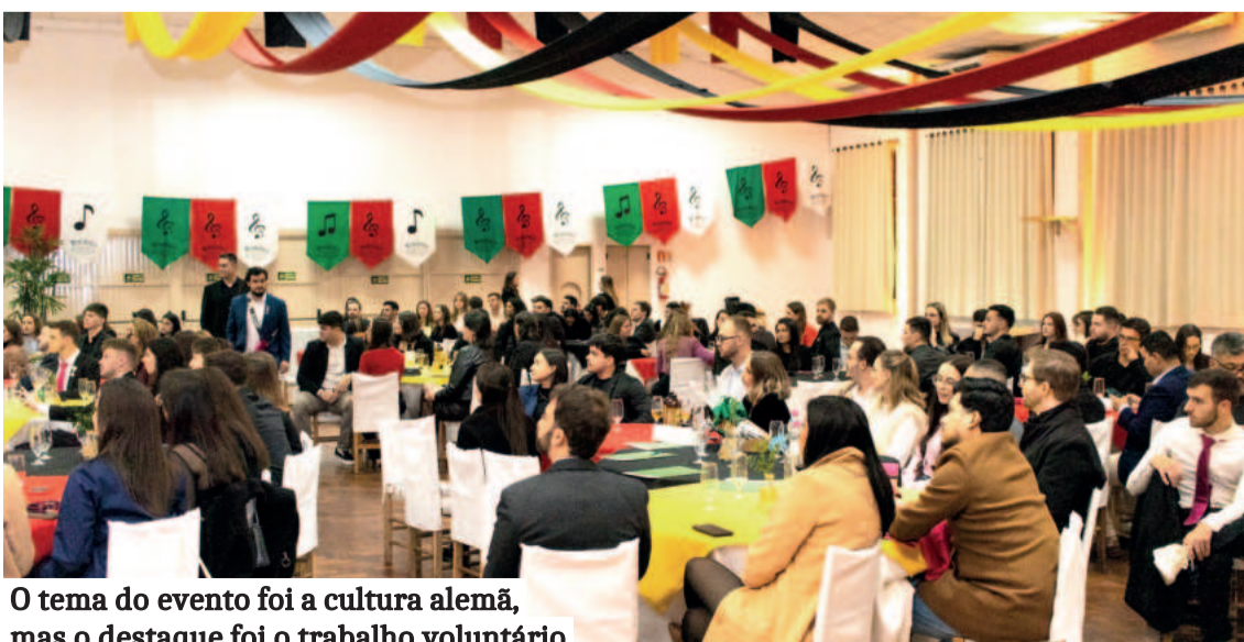
O tema do evento foi a cultura alemã, mas o destaque foi o trabalho voluntário