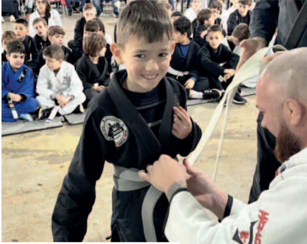
Alegria era vista nos alunos e também nos professores