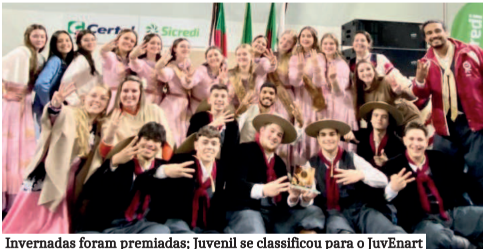
Invernadas foram premiadas; Juvenil se classificou para o JuvEnart