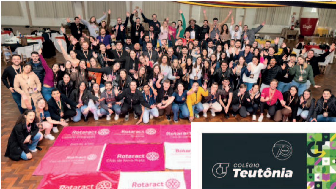
Mais de 120 rotaractianos de seis distritos vivenciaram a conferência