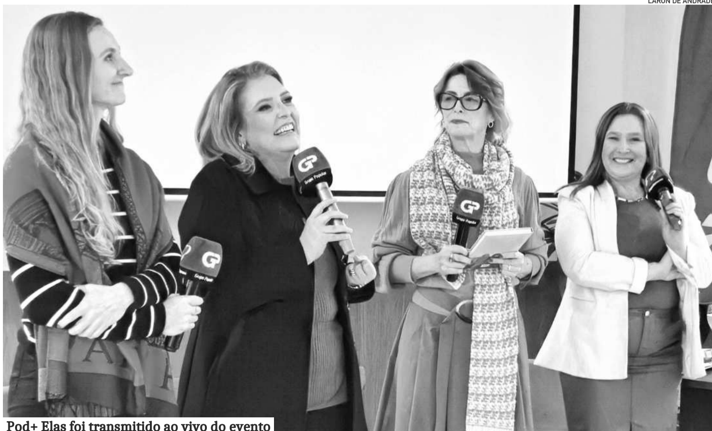
Pod+ Elas foi transmitido ao vivo do evento