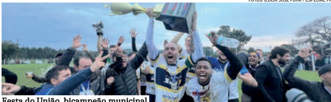
Festa do União, bicampeão municipal

O União conquistou mais um bicampeonato consecutivo (2024 e 2025) para celebrar seu sétimo título no Amador de Estrela. O clube também foi bicampeão em 1993 e 1994 e ainda conquistou um tricampeonato em 2004, 2005 e 2006.