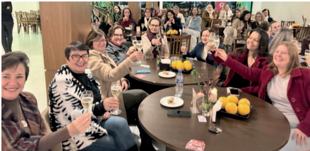
Mulheres brindaram e compartilharam experiências

Durante a live , participantes do público também foram convidadas a partilhar com as demais mulhe-