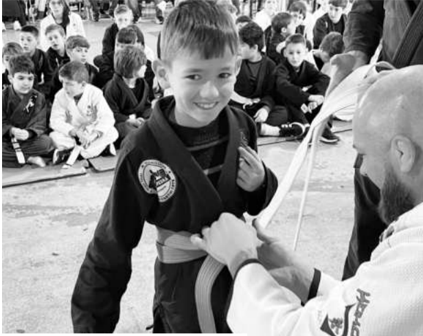
Alegria era vista nos alunos e também nos professores