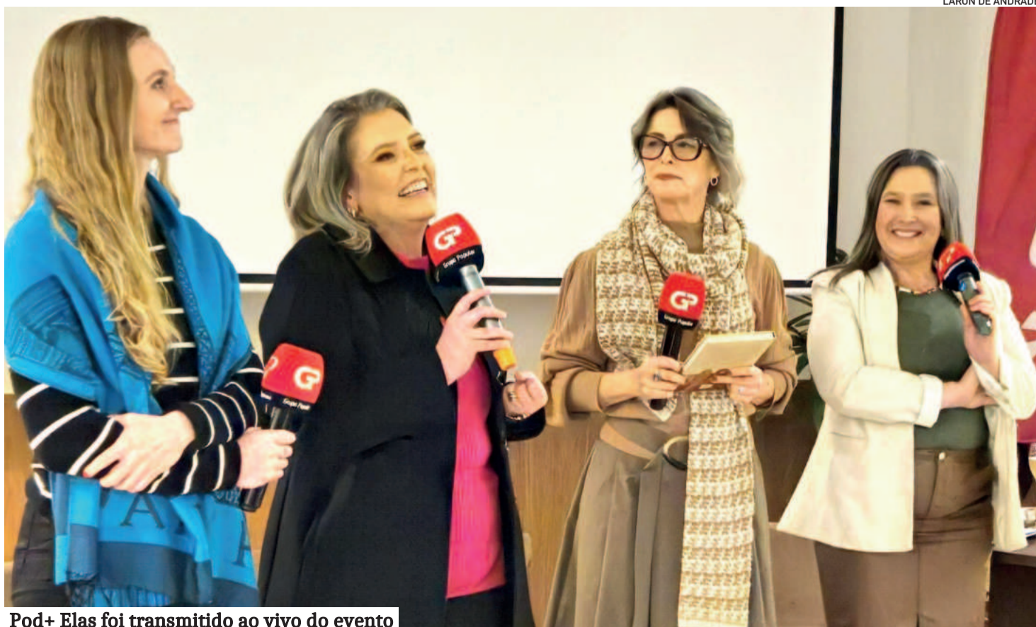
Pod+ Elas foi transmitido ao vivo do evento