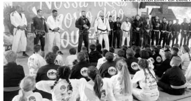
Trabalho realizado no CT recompensou atletas com a graduação