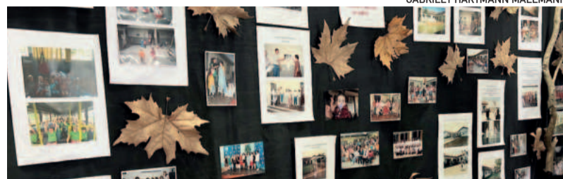
Comunidade pode conferir mural com Memórias da história

dor, com 10 salas de aula, biblioteca, refeitório, dois dormitórios, área coberta, ginásio e um pátio cheio de vida e alegria, além de uma equipe formada por 32 profissionais.