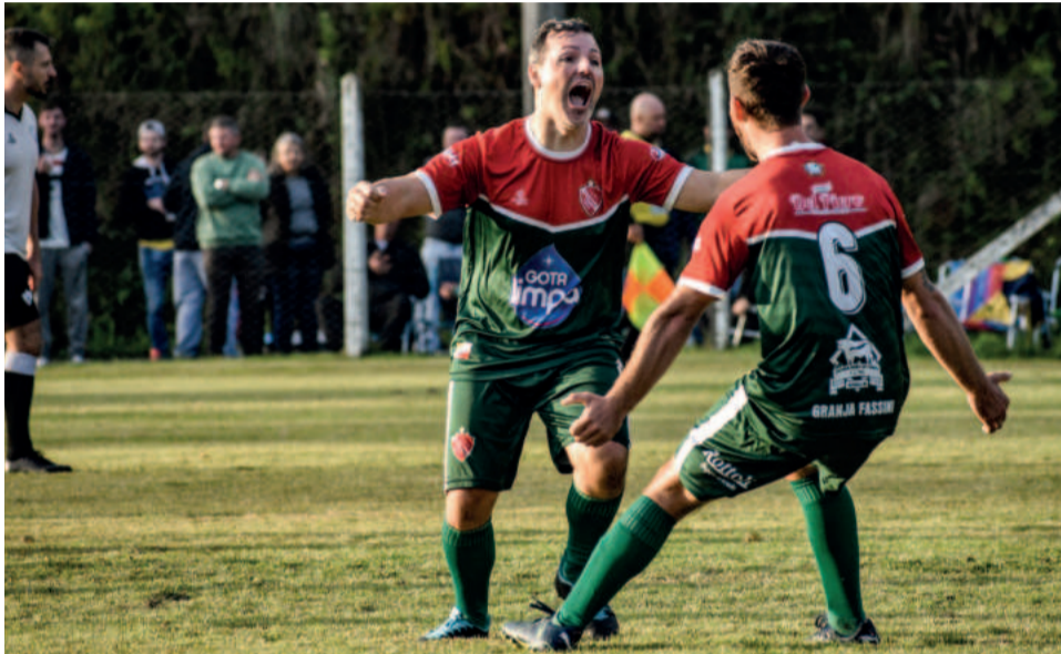
O Riograndense bateu o Ecas de virada e se classificou para as finais

Na primeira partida da tarde, o Cruzeiro se