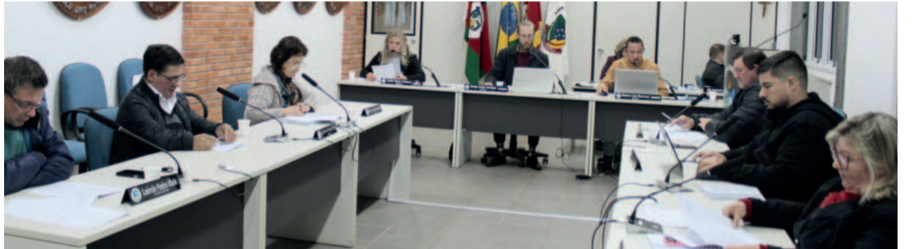
Câmara agora faz parte oficialmente da entidade, que congrega 36 casas legislativas