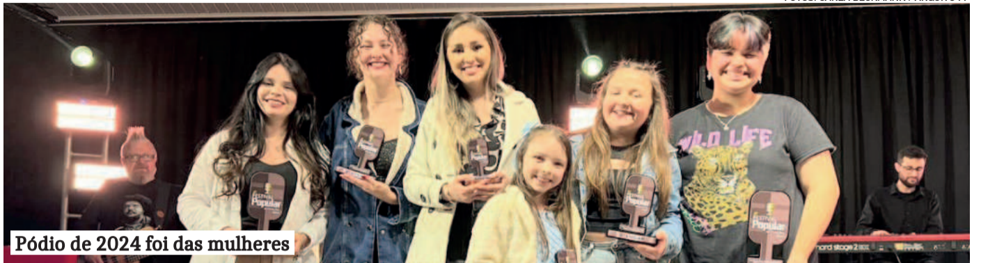
Pódio de 2024 foi das mulheres

Nos dias 1º e 2 de agosto ocorrem as apresentações que decidirão os finalistas. Estes se apresentarão no dia 23 do mesmo mês, quando serão conhecidos os primeiros três lugares de cada categoria. Todos os espetáculos serão realizados no auditório do Colégio Teutônia.