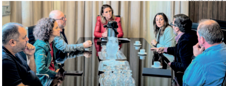
Ordem de início do Plano Diretor de Manejo de Águas Pluviais foi assinada