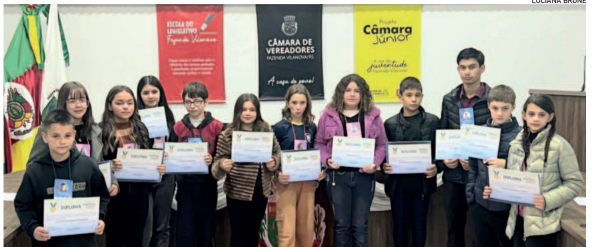
Câmara Júnior de Fazenda Vilanova