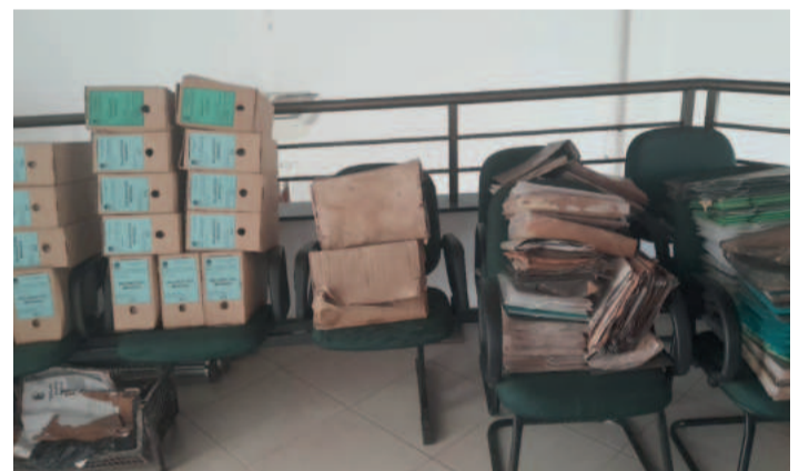
Documentos foram atingidos pela enchente de maio

As sessões seguem ocorrendo todas as segundas-feiras, no Ceiteq, até a conclusão da reforma.