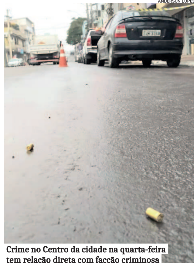
Crime no Centro da cidade na quarta-feira tem relação direta com facção criminosa

No mesmo local, mas no fim de semana, foram registrados outros disparos de arma de fogo e uma tentativa de incêndio criminoso ao estabelecimento.