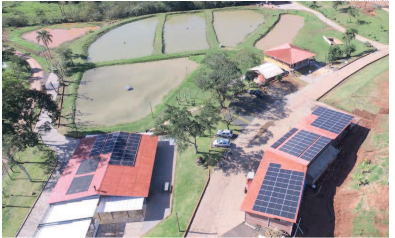
Recanto Paraíso, em Bom Retiro do Sul, sediará a AquiBom e o Dia Estadual do Peixe