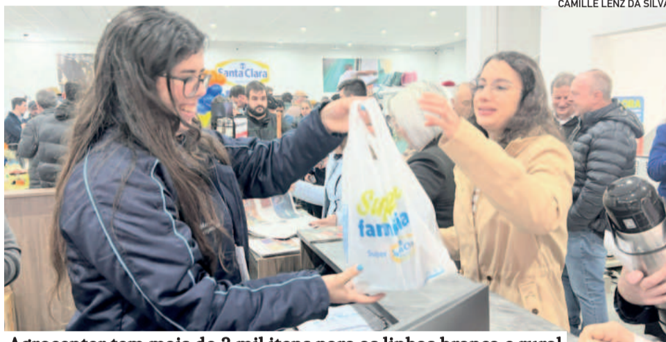
Agrocenter tem mais de 3 mil itens para as linhas branca e rural