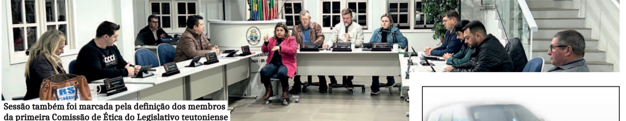
Sessão também foi marcada pela definição dos membros da primeira Comissão de Ética do Legislativo teutoniense