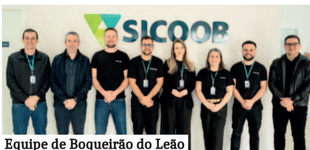
Equipe de Boqueirão do Leão