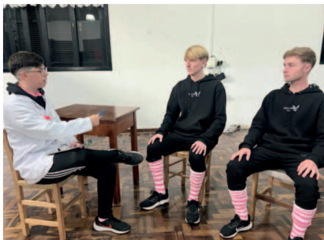
Peça teatral interpretada por alunos arrancou risos da plateia com o uso da língua e da mímica