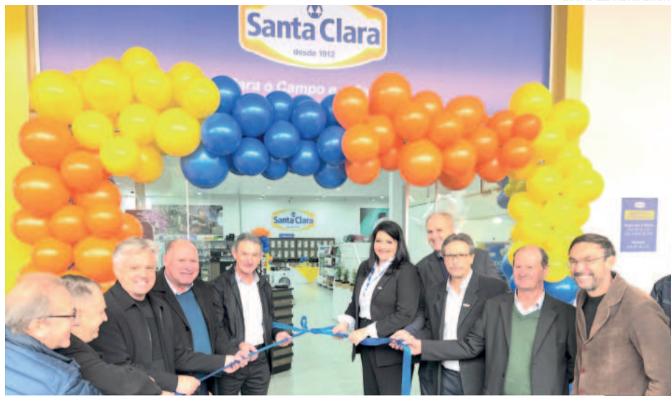
Inauguração teve a presença de autoridades e cooperativas coirmãs