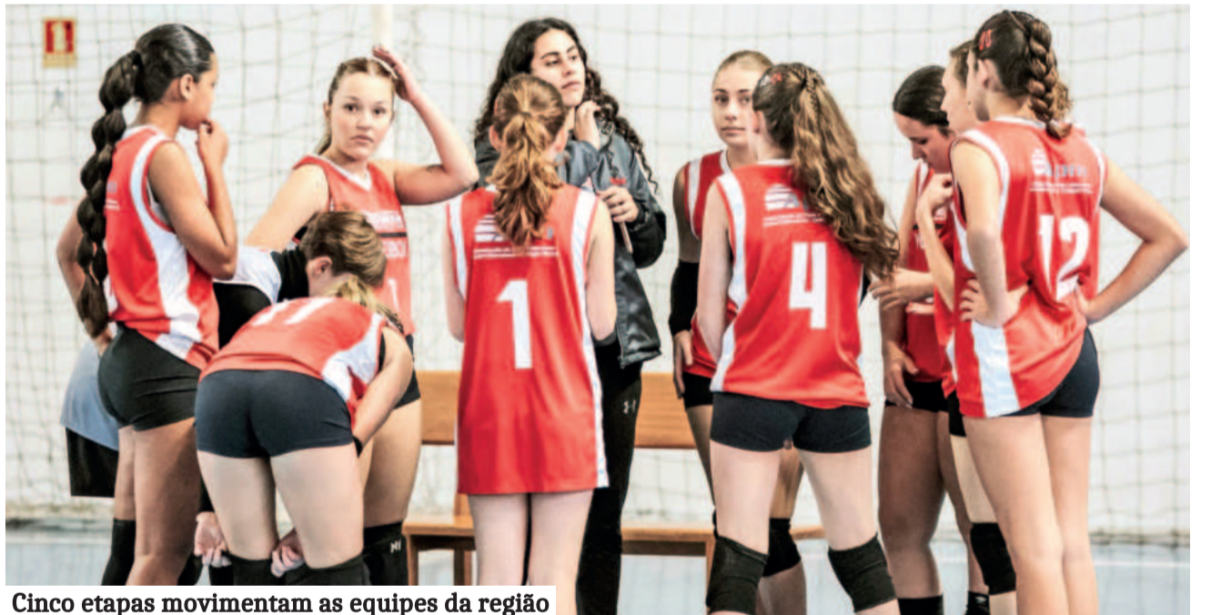
Cinco etapas movimentam as equipes da região