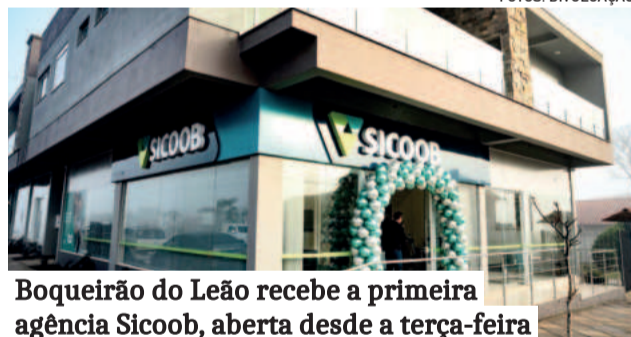
Boqueirão do Leão recebe a primeira agência Sicoob, aberta desde a terça-feira