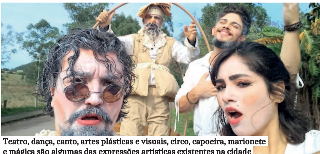
Teatro, dança, canto, artes plásticas e visuais, circo, capoeira, marionete e mágica são algumas das expressões artísticas existentes na cidade