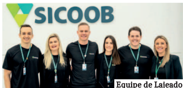
Equipe de Lajeado