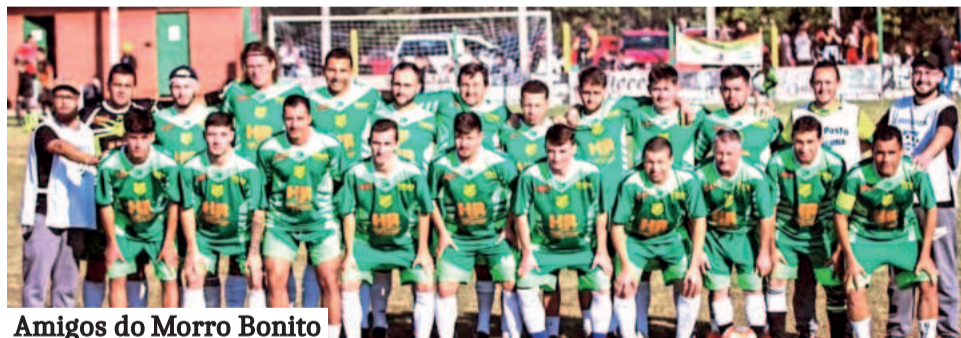
Amigos do Morro Bonito

Laranja Mecânica, fez registro na Delegacia de Polícia para denunciar ameaças ao jovem caso ele disputasse a partida final no domingo: "Iriam levantar ele" e "acabar com a carreira dele". No boletim de ocorrência, apontou uma pessoa e o número de telefone de onde partiram as ameaças. Em postagem na rede social, o pai publicou nota de repúdio e avisou que o filho não jogará a final.