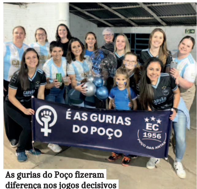
As gurias do Poço fizeram diferença nos jogos decisivos