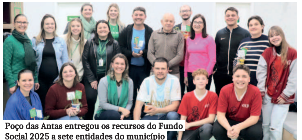
Poço das Antas entregou os recursos do Fundo Social 2025 a sete entidades do município

A próxima semana será de entregas para os municípios de Parei Novo, São José do Sul e Nova Santa Rita. No Rio Grande do Sul, a Sicredi Ouro Branco RS/MG atende ainda os municípios de Bom Retiro do Sul, Brochier, Capela de Santana, Estrela, Harmonia, Maratá, Montenegro, Salvador do Sul, Tabai, Taquari e Triunfo.