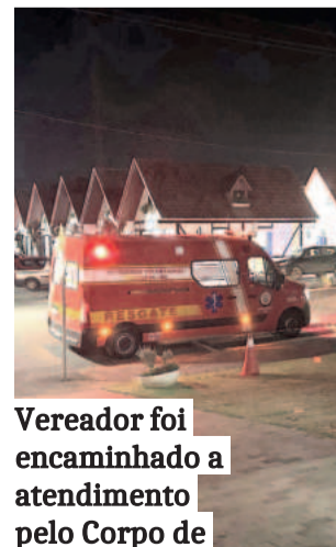
Vereador foi encaminhado a atendimento pelo Corpo de Bombeiros e passa bem