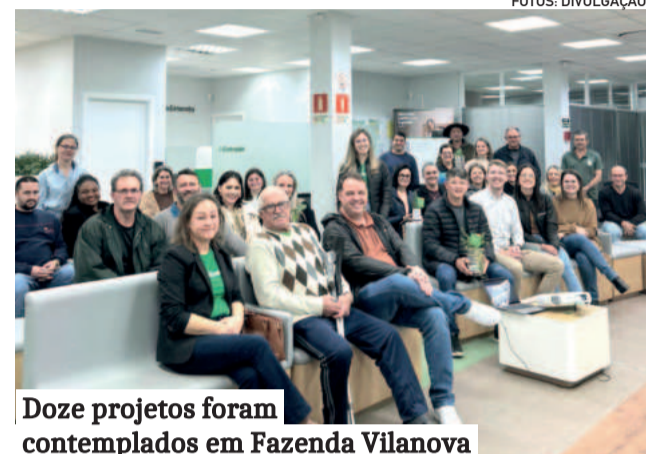
Doze projetos foram contemplados em Fazenda Vilanova

Na área Educacional, foram contemplados os Conselhos de Pais e Mestres (CPMs) da Emei Espaço da Criança e da Emei Leo Pedro