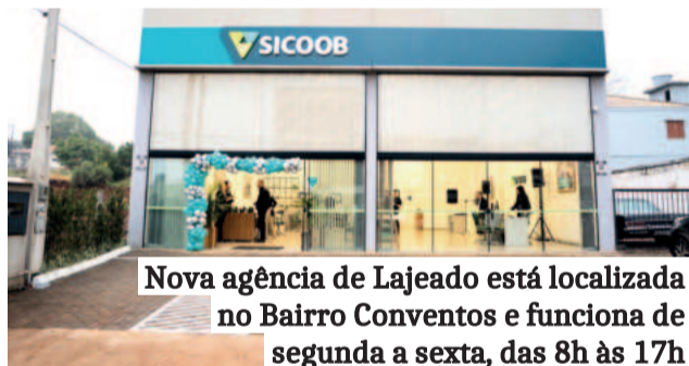
Nova agência de Lajeado está localizada no Bairro Conventos e funciona de segunda a sexta, das 8h às 17h

O Sicredi realizou, no Dia Internacional do Cooperativismo (5/7), o primeiro Summit das Cooperativas Escolares. O evento aconteceu em Nova Petrópolis e reuniu cerca de 500 pessoas, entre jovens integrantes do programa, professores orientadores e assessores pedagógicos. Conforme balanço do Sicredi, em 2024, 26 cooperativas escolares de 122 cidades gaúchas estavam ligadas ao programa, reunindo 270 professores e mais de 7,6 mil estudantes.