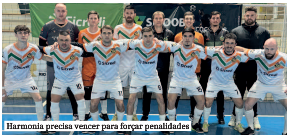
Harmonia precisa vencer para forçar penalidades