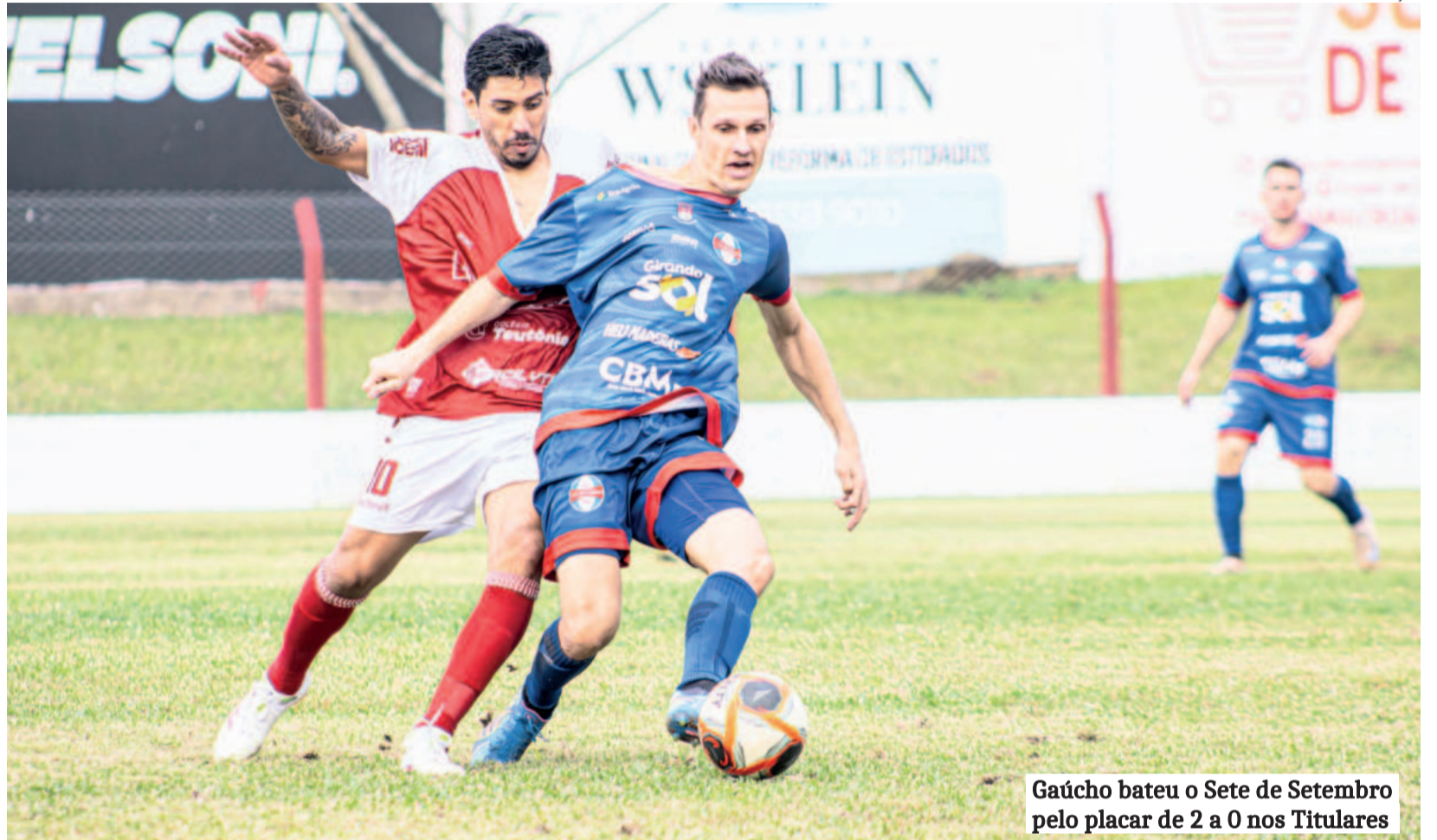
Gaúcho bateu o Sete de Setembro pelo placar de 2 a 0 nos Titulares