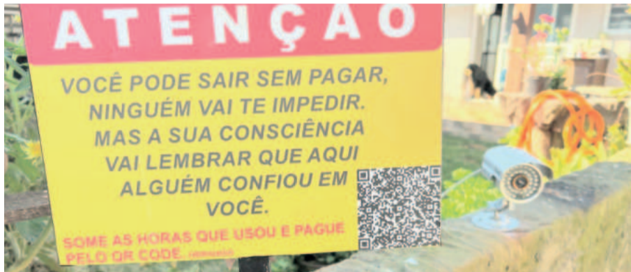
Placa inusitada no estacionamento privado de Ramon chama atenção. Pagamento é disponível no QR code