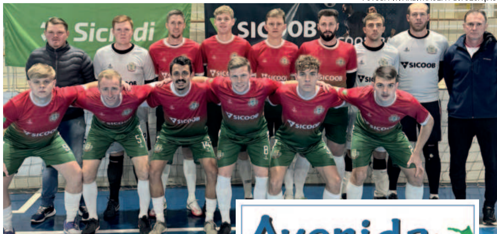
Westfália venceu a ida na Força Livre em Teutônia