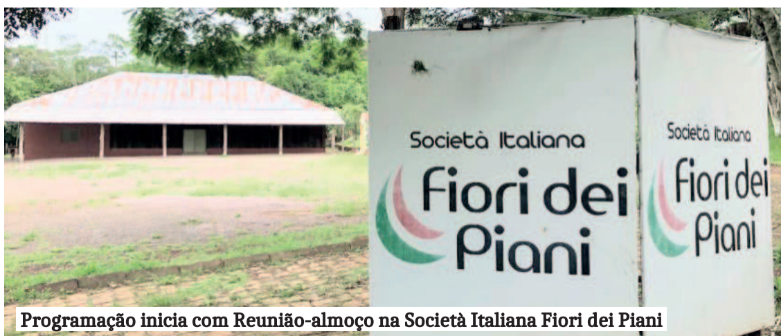
Programação inicia com Reunião-almoço na Società Italiana Fiori dei Piani