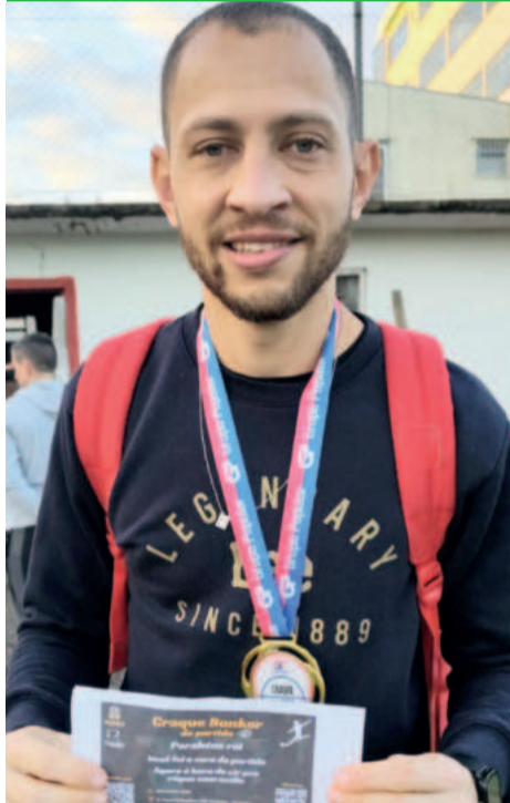
Amarelinho, do Canabarense