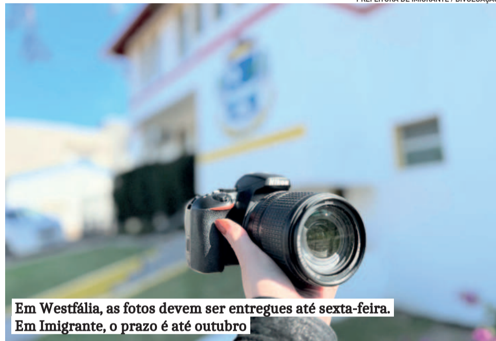
Em Westfália, as fotos devem ser entregues até sexta-feira. Em Imigrante, o prazo é até outubro