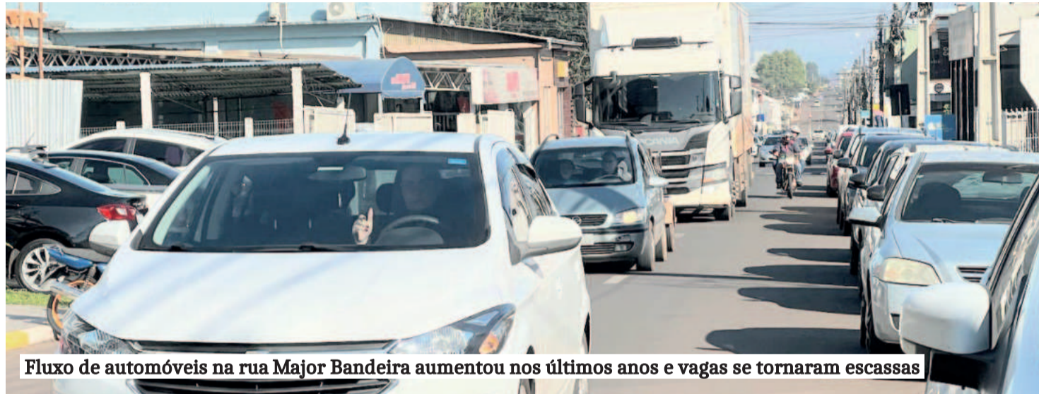
Fluxo de automóveis na rua Major Bandeira aumentou nos últimos anos e vagas se tornaram escassas

Crescimento do Bairro Languiru agrava falta de vagas na rua Major Bandeira. Soluções como tempo limitado de permanência ganham apoio local. Estacionamentos privados abrem oportunidade de negócio.