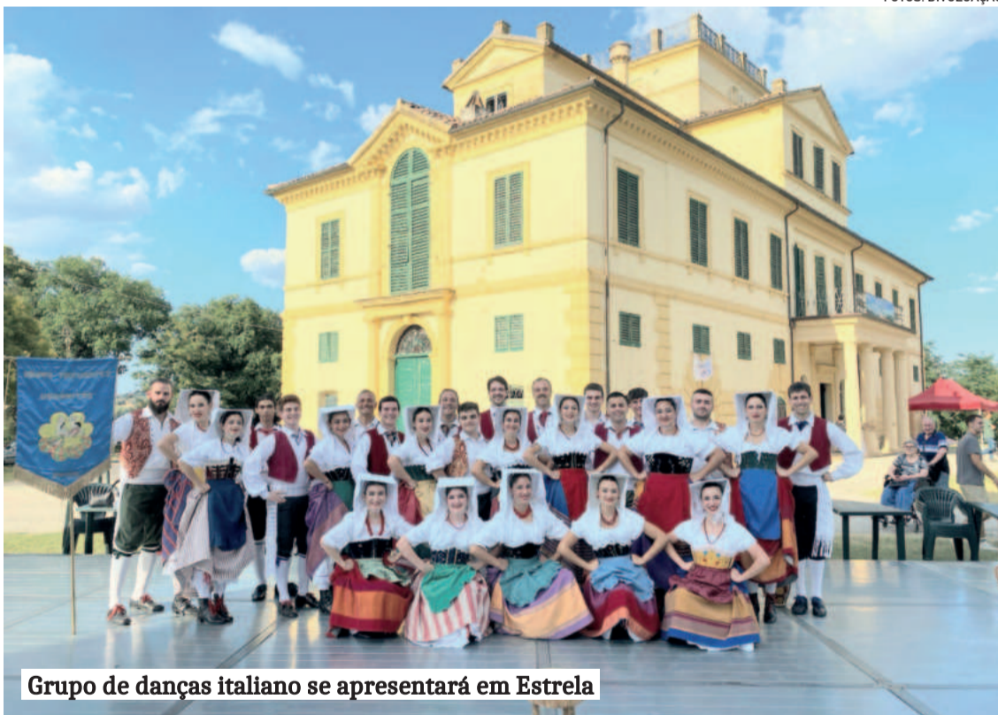
Grupo de danças italiano se apresentará em Estrela