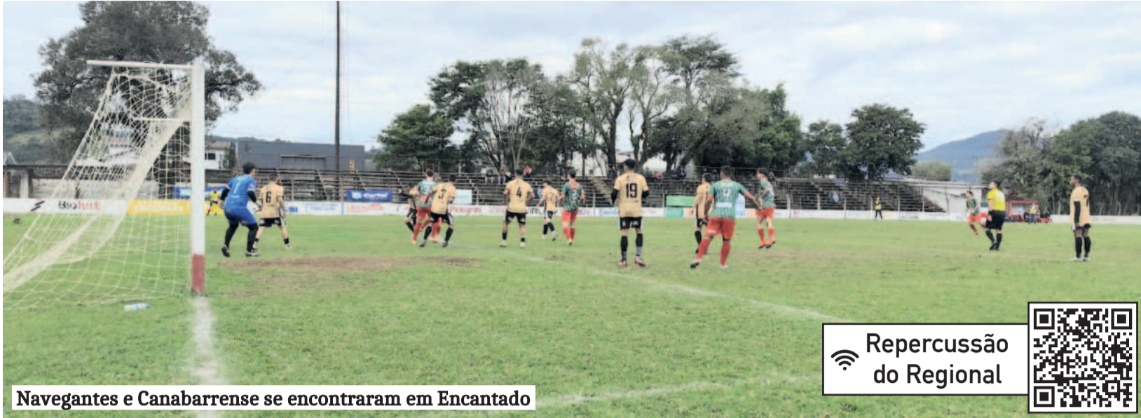
Navegantes e Canabarense se encontraram em Encantado