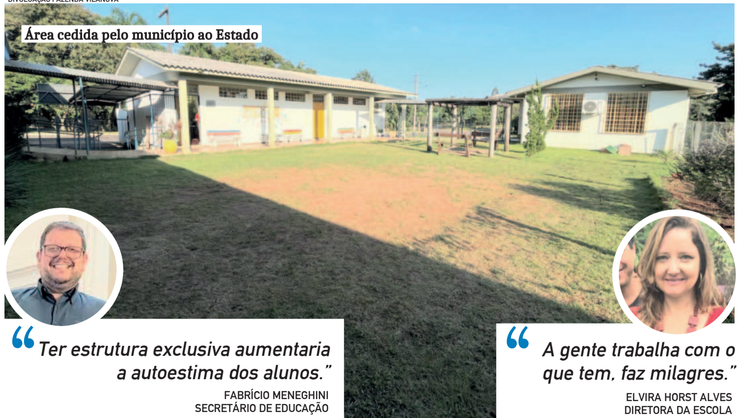
Área cedida pelo município ao Estado

nada for feito, teremos que solicitar a devolução das salas cedidas lá atrás", afirma o prefeito.