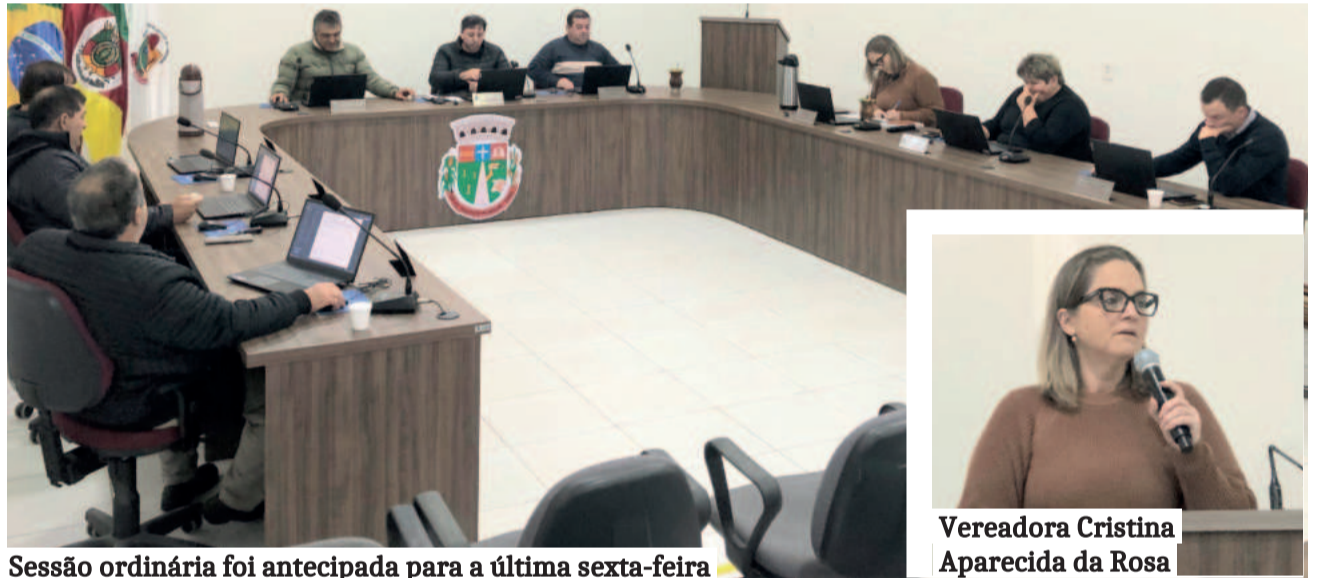
Sessão ordinária foi antecipada para a última sexta-feira