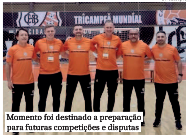
Momento foi destinado a preparação para futuras competições e disputas

ta de formação. A intenção é aplicar o conhecimento adquirido nas escolinhas e equipes locais, com foco na formação técnica dos atletas e, futuramente, na disputa de competições regionais em nível mais competitivo.