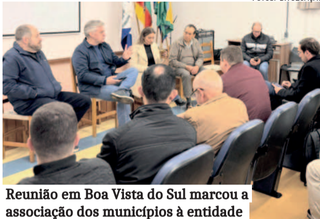
Reunião em Boa Vista do Sul marcou a associação dos municípios à entidade