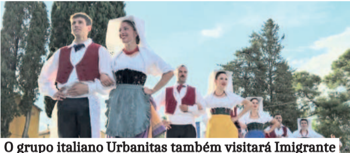
O grupo italiano Urbanitas também visitará Imigrante