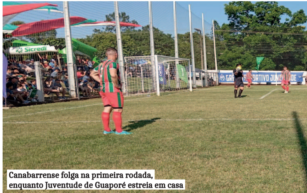
Canabarense folga na primeira rodada, enquanto Juventude de Guaporé estreia em casa

O Sete de Setembro de São Caetano está atrás do título e bateu na trave três vezes. Serrano de Encantado e Ecas de Imigrante também foram finalistas e não conseguiram levantar o troféu. Os demais clubes almejam a taça inédita. Destaque para o Poço das Antas, atual vice-campeão do Intermunicipal Sicredi Certel.