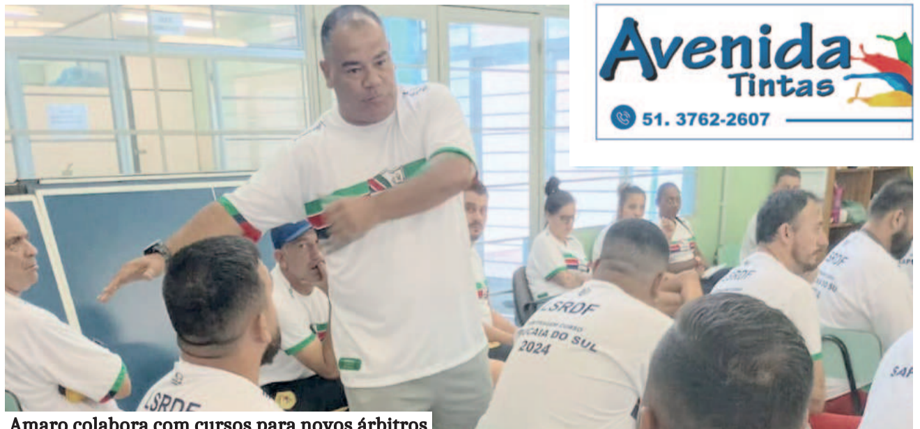
Amaro colabora com cursos para novos árbitros