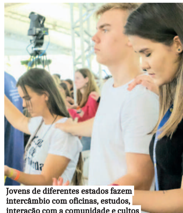
Jovens de diferentes estados fazem intercâmbio com oficinas, estudos, interação com a comunidade e cultos

Sob o tema “A partir do coração”, o congresso convida os jovens a alinhar seus sentimentos e ações com a graça de Deus, seguindo o exemplo de Cristo. O lema, baseado em 1 Pedro 4:10 - “Cada pessoa com