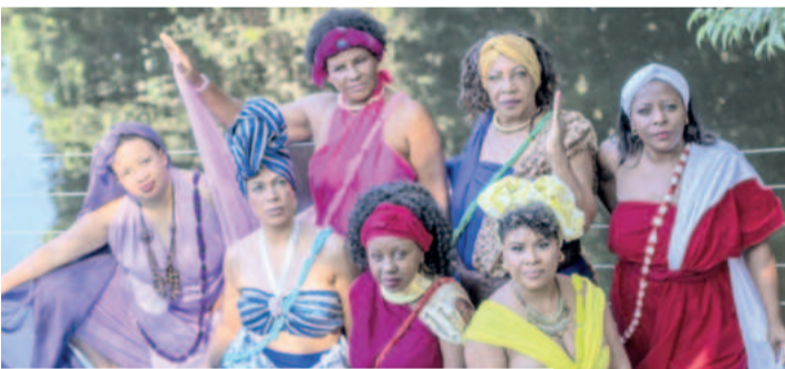
Festival reúne diversidade de culturas; grupo afro-brasileiro se apresentará no sábado