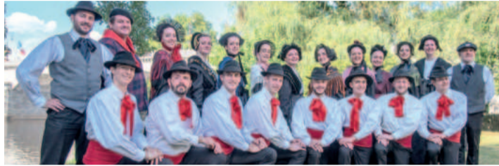
O Ballet de Savoie, da França, se apresentará no festival

troca de experiências. Vai ser muito positivo para a nossa comunidade, para os alunos e para toda a região”, diz o secretário.