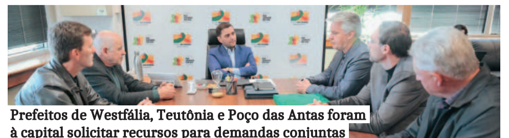
Prefeitos de Westfália, Teutônia e Poço das Antas foram à capital solicitar recursos para demandas conjuntas