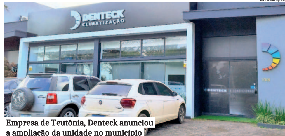
Empresa de Teutônia, Denteck anunciou a ampliação da unidade no município