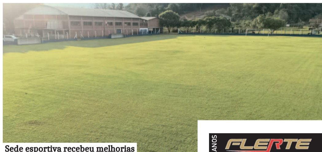
Sede esportiva recebeu melhorias