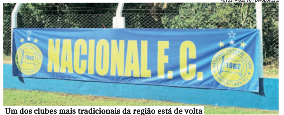
Um dos clubes mais tradicionais da região está de volta