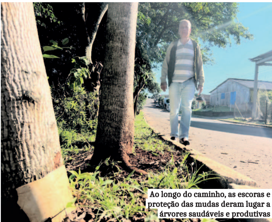
Ao longo do caminho, as escoras e proteção das mudas deram lugar a árvores saudáveis e produtivas

Assim como a história de Eli, o Bairro Canabarro abraça outras. Há uma horta comunitária naquela região, cujos participantes são mulheres em situação de