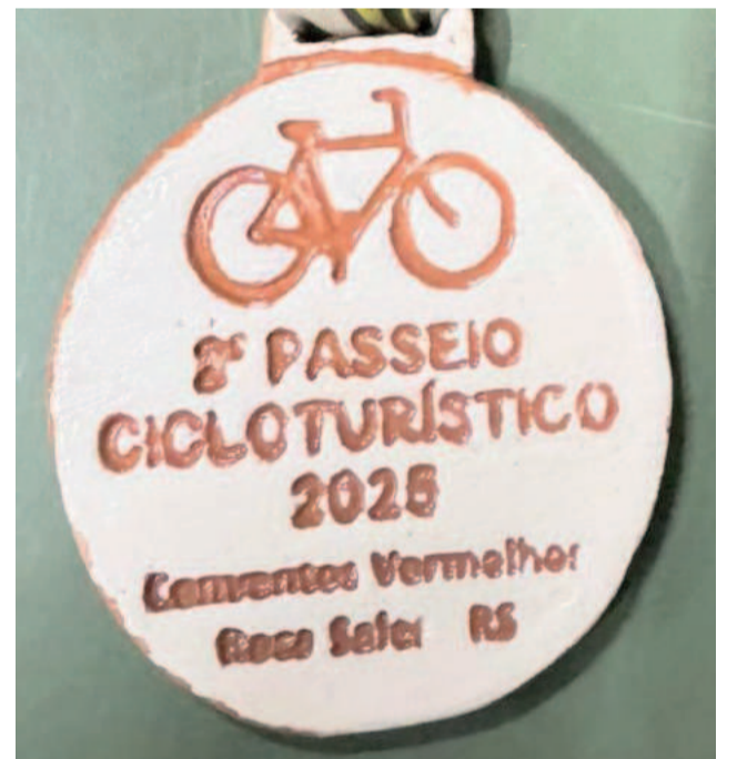
Medalhas foram produzidas com material recolhido às margens do Rio Taquari

(17/8) e venceu a Assespe, fora de casa, em Venâncio Aires, pelo placar de 2 a 0. Neste domingo (24/8) a equipe recebe o Sete de Setembro, de Arroio do Meio, em Roca Sales, em partida válida pela segunda rodada.