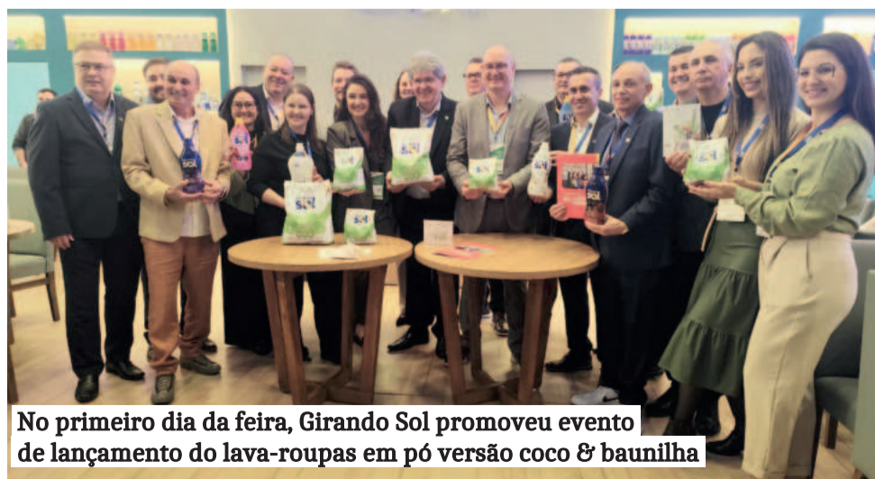
No primeiro dia da feira, Girando Sol promoveu evento de lançamento do lava-roupas em pó versão coco & baunilha