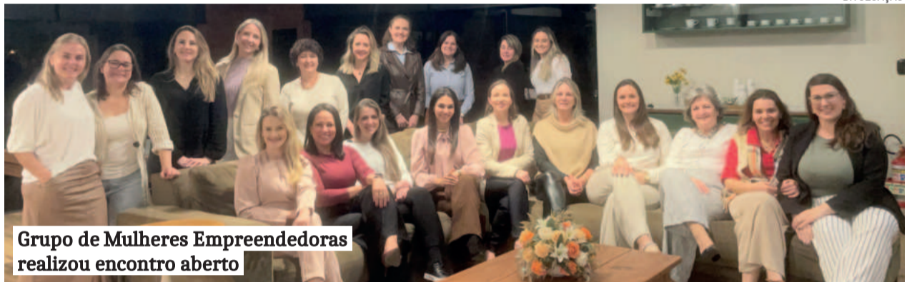
Grupo de Mulheres Empreendedoras realizou encontro aberto