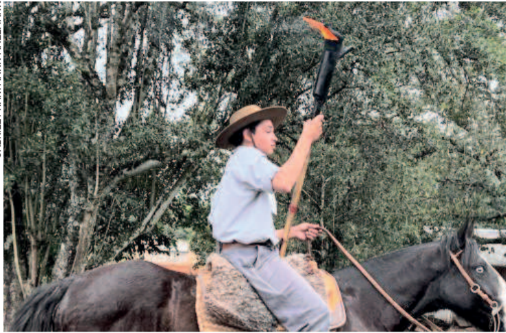
Novas gerações dão continuidade à tradição gaúcha