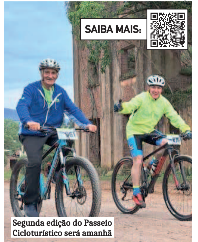
Segunda edição do Passeio Cicloturístico será amanhã