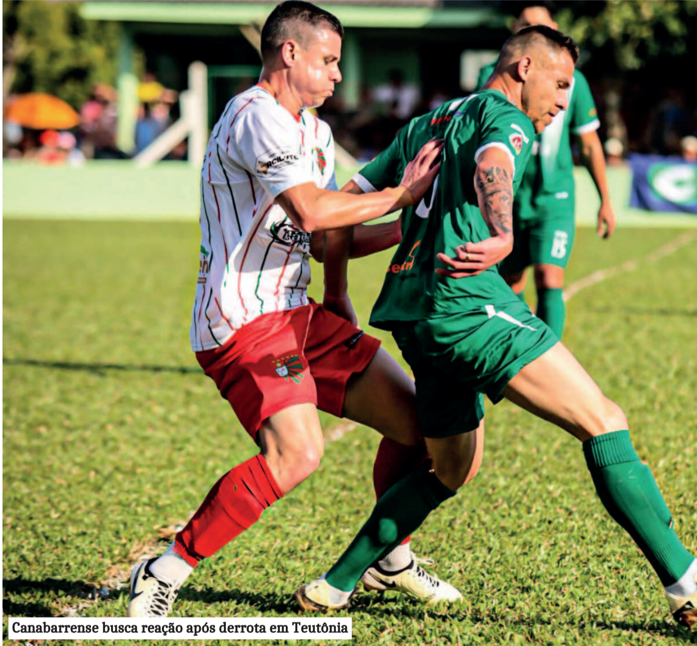
Canabarense busca reação após derrota em Teutônia

Em Imigrante, o Esporte Clube Arroio da Seca (Ecas) será visitado pelo Canabarense de Teutônia. Os times vivem momentos parecidos e iniciaram com resultados positivos: o Ecas empatou com o atual campeão, Juventude de Guaporé, por 1 a 1, e o Canabarense havia vencido o Navegantes pelo placar de 2 a 0, em Encantado. Porém, na rodada passada, ambos foram derrotados em confrontos diretos. Os donos da casa perderam para o Brasil, em Marques de Souza, por 3 a 0, enquanto o tricolor de Canabarro sofreu