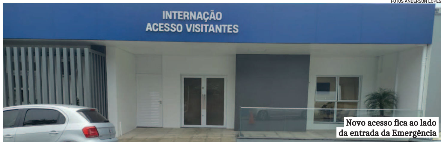
Novo acesso fica ao lado da entrada da Emergência