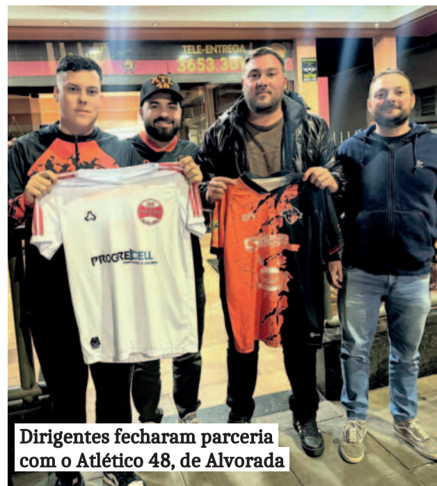
Dirigentes fecharam parceria com o Atlético 48, de Alvorada