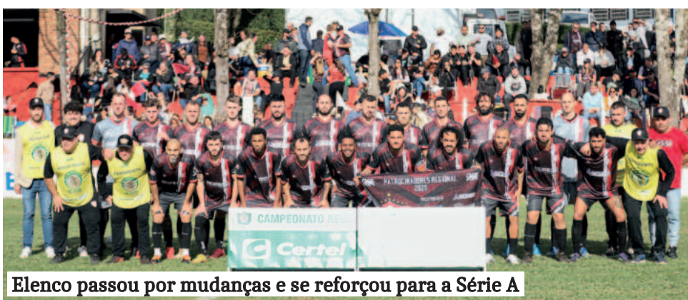
Elenco passou por mudanças e se reforçou para a Série A

“Ela sempre estava envolvida e acompanhava os jogos. Era uma torcedora fiel e querida por todos. Jogaremos também em homenagem a ela e por tudo que fez para o clube”, lembra.