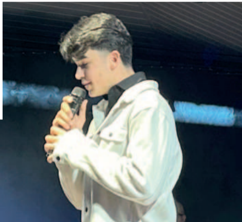
Serão sete apresentações cada nas categorias Infantil e Juvenil e 10 na Livre