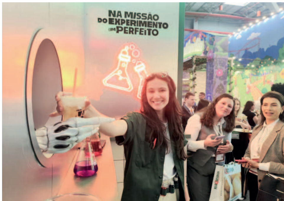
Fruki proporcionou aos visitantes a experiência de criar sabores de refrigerantes

Com cerca de duas décadas de participação na Expoagas, a Fruki Bebidas celebra grandes resultados no evento deste ano. Em um estande interativo, onde os visitantes podiam criar sabores de refrigerantes exclusivos, a marca foi