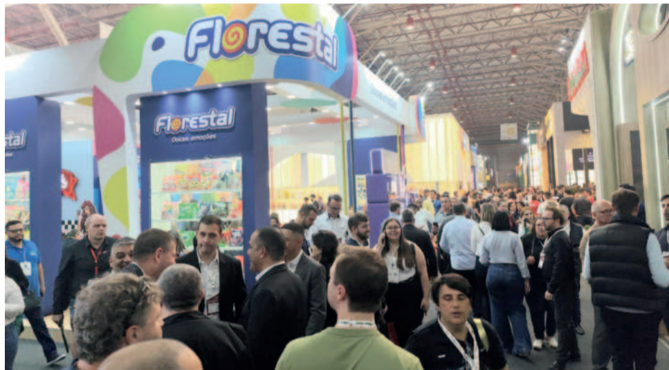
Florestal Alimentos apresentou sete lançamentos exclusivos