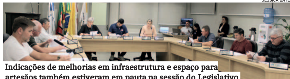
Indicações de melhorias em infraestrutura e espaço para artesãos também estiveram em pauta na sessão do Legislativo