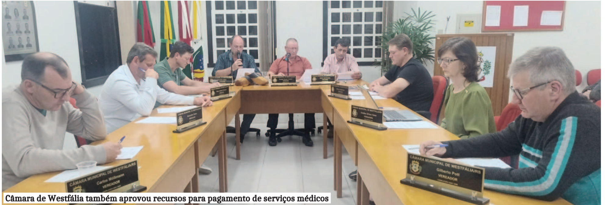
Câmara de Westfália também aprovou recursos para pagamento de serviços médicos