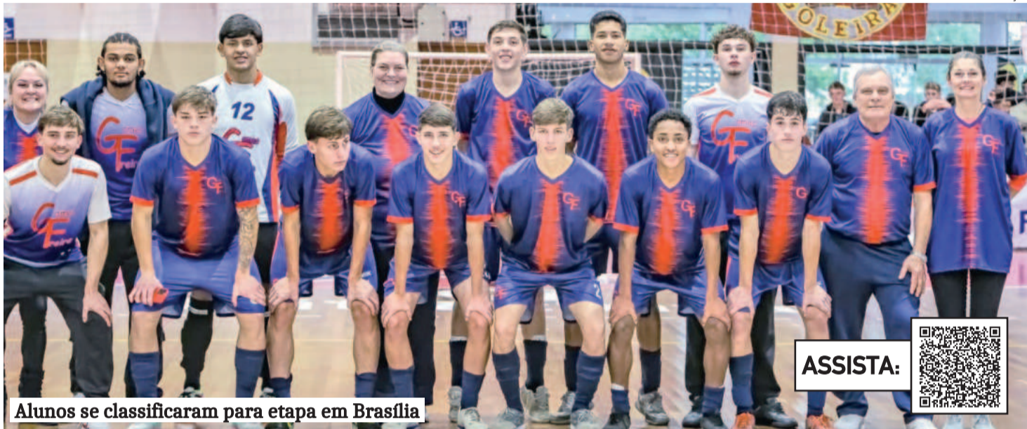
Alunos se classificaram para etapa em Brasília

Escola teutoniense disputará competição nacional em setembro