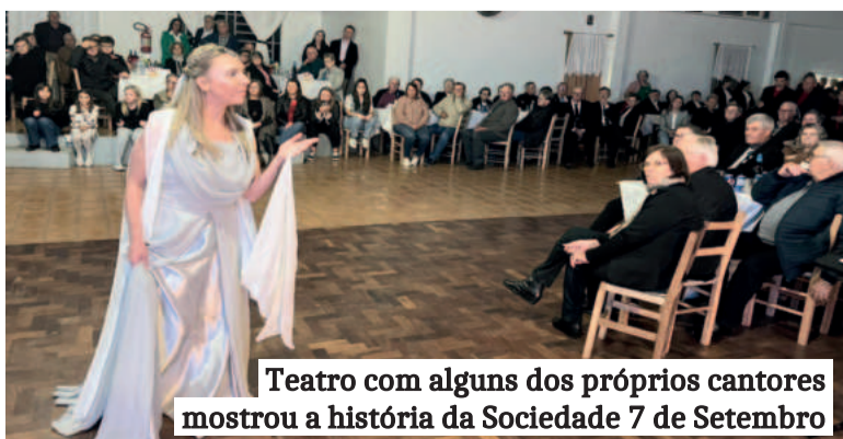
Teatro com alguns dos próprios cantores mostrou a história da Sociedade 7 de Setembro

Os corais de Não-Me-Toque, em especial, tiveram participação de destaque, reforçando os laços regionais e o espírito de união em torno da música coral. “Mesmo com a distância e o