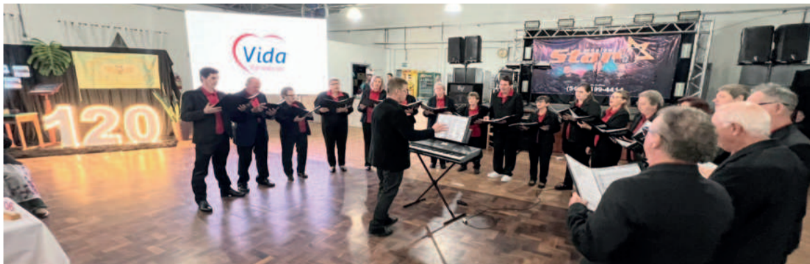
Coral anfitrião comemorou 120 anos com cantos e reflexão na Linha Ano Bom, em Colinas

Um dos pontos altos da noite foi a apresentação teatral que narrou a trajetória do coral desde o período da Segunda Guerra Mundial, quando o grupo, então chamado Männergesangverein (Associação de Canto Masculino), cantava exclusivamente em alemão. Com a eclosão da guerra e o avanço da política nacionalista do governo Getúlio Vargas, idiomas estrangeiros como o alemão, o italiano e o japonês foram proibidos no Brasil.