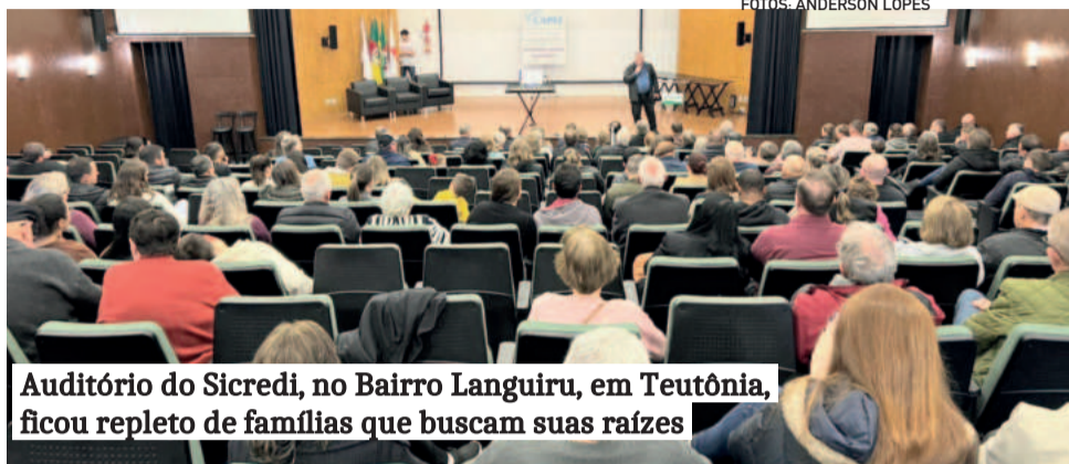
Auditório do Sicredi, no Bairro Languiru, em Teutônia, ficou repleto de famílias que buscam suas raízes

No auditório, o público assistiu à apresentação do Coral Municipal Infantojuvenil, que encantou os presentes. Em seguida,