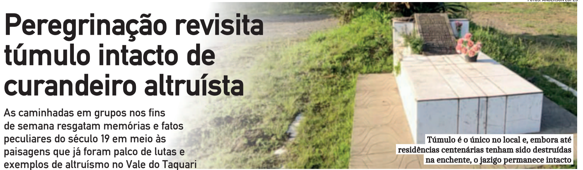
Túmulo é o único no local e, embora até residências centenárias tenham sido destruídas na enchente, o jazigo permanece intacto

Enquanto novos peregrinos se preparam para cruzar oceanos e continentes em direção a Compostela, a própria terra de Colinas revela-se um caminho de descobertas. Um caminho onde as almas - vivas ou mortas - continuam a caminhar.