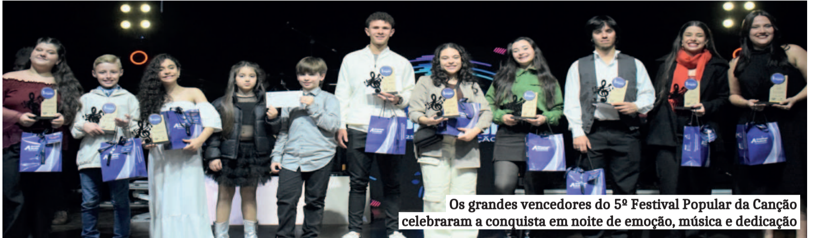
Os grandes vencedores do 5º Festival Popular da Canção celebraram a conquista em noite de emoção, música e dedicação

Os vencedores do 5º Festival Popular da Canção receberam premiações em dinheiro, distribuídas igualmente entre todas as categorias. O Voto Popular garantiu R$ 150, enquanto os jurados definiram os prêmios principais: R$