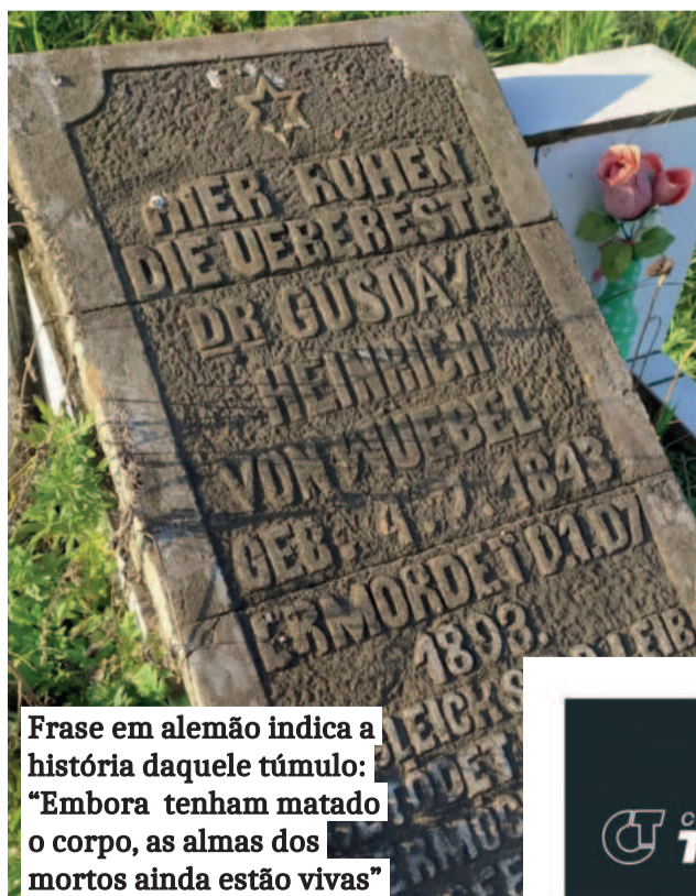
Frase em alemão indica a história daquele túmulo: “Embora tenham matado o corpo, as almas dos mortos ainda estão vivas”