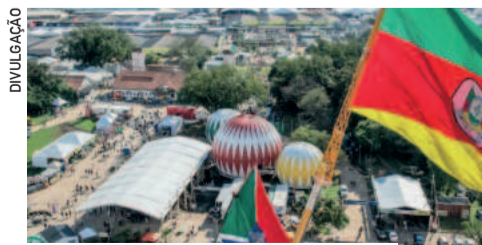
INICIATIVAS RECEBERÃO TROFÉUS DA FEDERASUL NA EXPONINTER 2025

A ação, que reuniu lideranças, comunidade, voluntários e parcerias públicas e privadas, gerou mais de R$ 3 milhões em receitas e consolidou um modelo replicável de recuperação sustentável. Além de devolver a produção agrícola às famílias, garantiu emprego, renda e esperança em regiões fortemente atingidas.