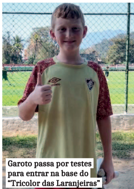
Garoto passa por testes para entrar na base do “Tricolor das Laranjeiras”

Natural da Delfina, o garoto passa por testes no Fluminense, do Rio de Janeiro