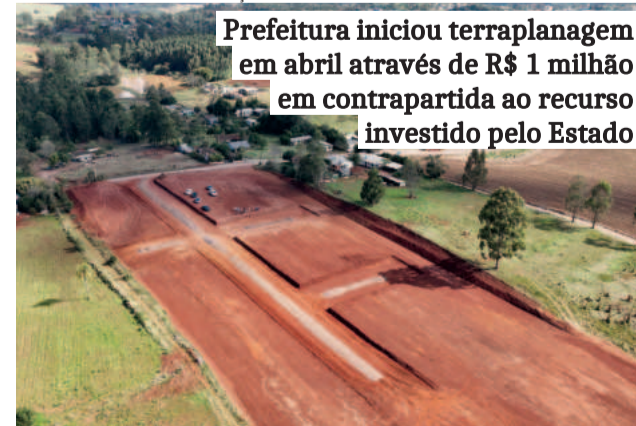
Prefeitura iniciou terraplanagem em abril através de R$ 1 milhão em contrapartida ao recurso investido pelo Estado