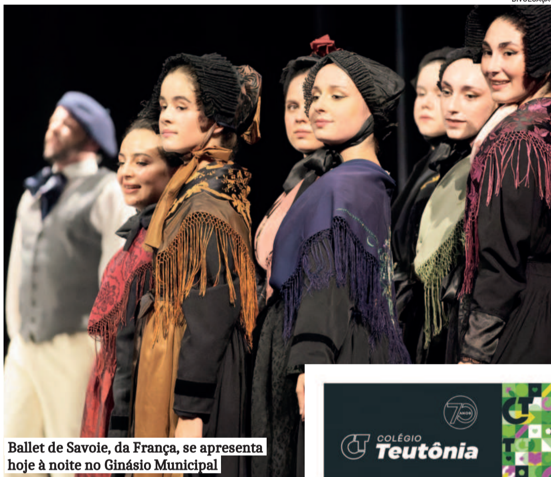
Ballet de Savoie, da França, se apresenta hoje à noite no Ginásio Municipal

O secretário destacou a importância e a riqueza do evento, ressaltando que ele proporciona a oportunidade de assistir a diversas expressões do folclore, já que o festival reúne diferentes estilos de danças e representa múltiplas etnias que contribuíram para a colonização do Brasil e da própria região.