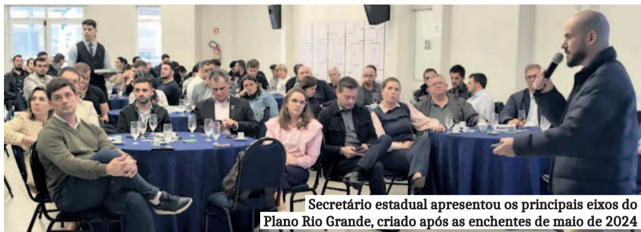
Secretário estadual apresentou os principais eixos do Plano Rio Grande, criado após as enchentes de maio de 2024