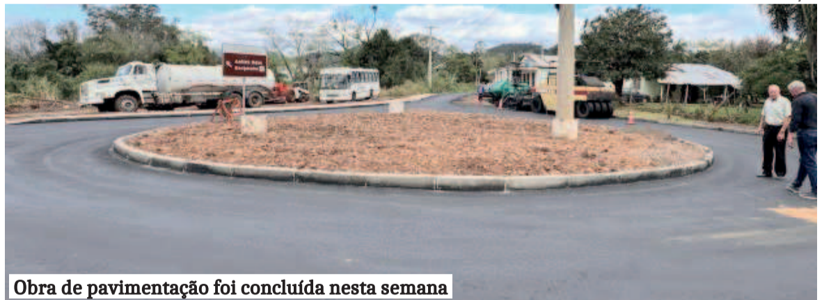
Obra de pavimentação foi concluída nesta semana