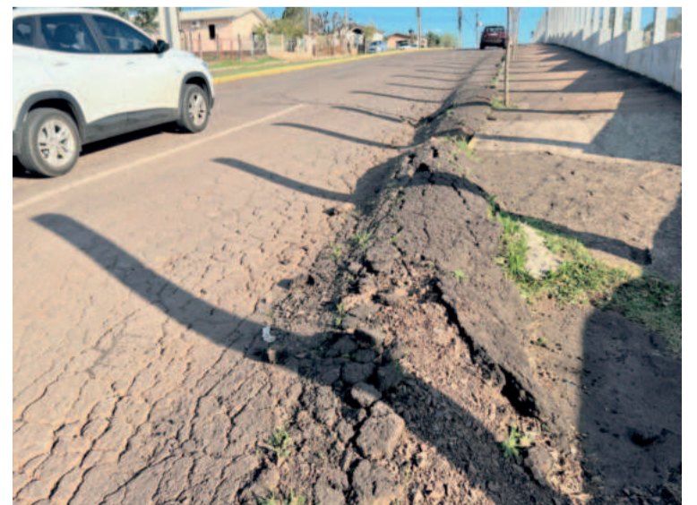
Trechos da Avenida 1 Leste e da Leopoldo Schneider serão recuperados, atendendo demanda antiga da população