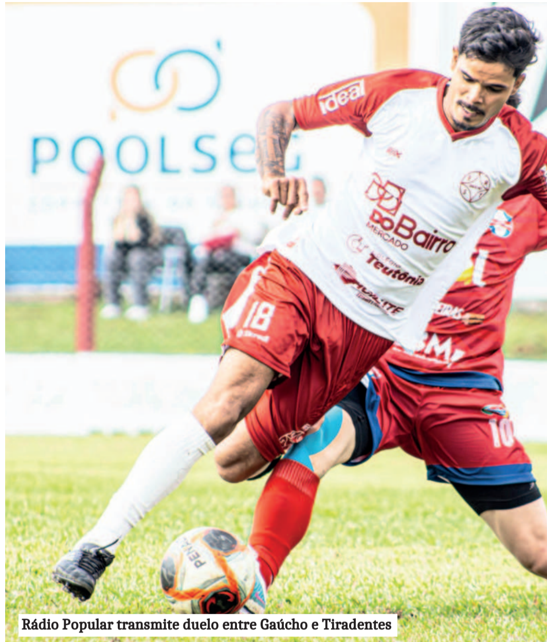
Rádio Popular transmite duelo entre Gaúcho e Tiradentes

Na transmissão da Jornada Esportiva da Rádio Popular FM 96,9 e também pelo YouTube do Grupo Popular, Gaúcho de Teutônia e Tiradentes se encontram no Estádio do Pavão Vermelho - Bairro Teutônia. O Gaúcho venceu seu único jogo no campeonato e é 6º. Já o Tiradentes bateu o Estudantes fora de casa, ficou no empate em