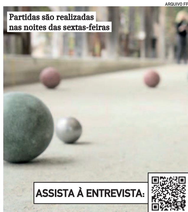
Partidas são realizadas nas noites das sextas-feiras

Acima de tudo, a bocha em Teutônia mantém o espírito das