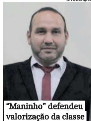
"Maninho" defendeu valorização da classe

O encontro marcou a primeira edição do Café Colonial, que já tem perspectiva de continuidade. "Com certeza foi um sucesso e já estamos prevendo uma próxima edição em 2026. A gente