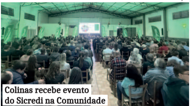
Colinas recebe evento do Sicredi na Comunidade