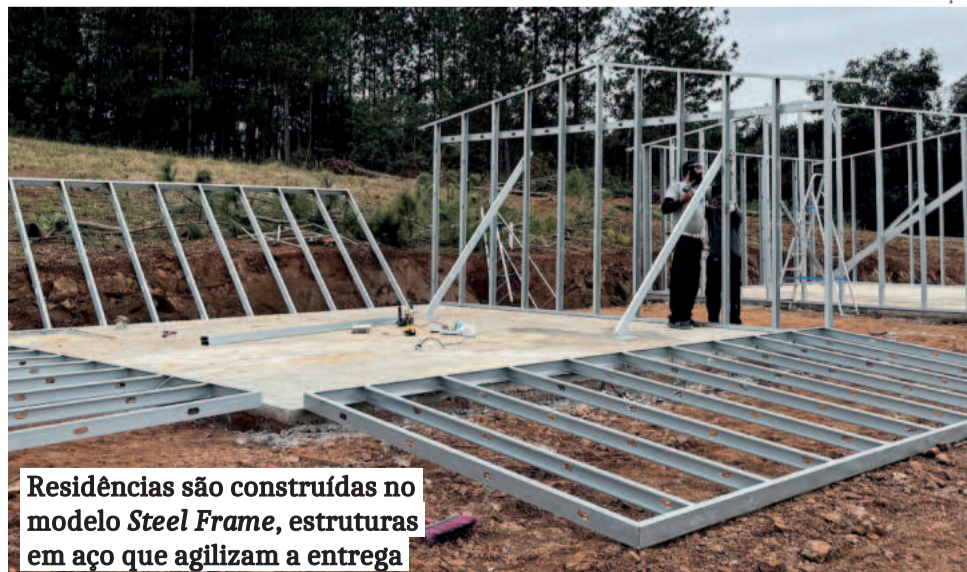
Residências são construídas no modelo Steel Frame , estruturas em aço que agilizam a entrega