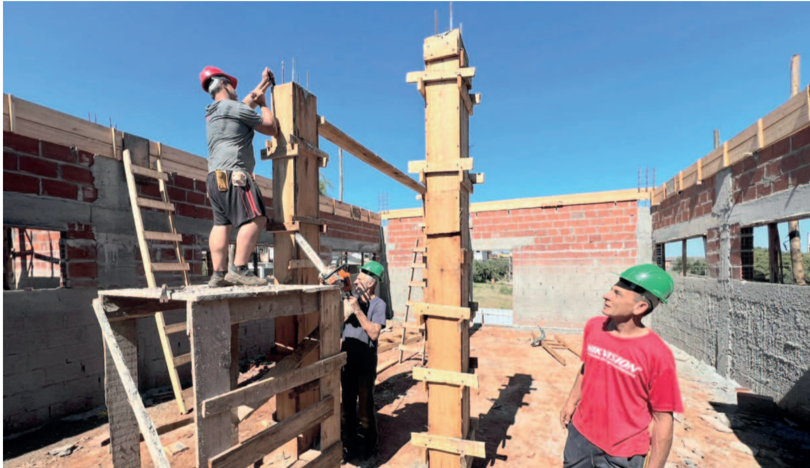
Obra está em plena execução e tem previsão de conclusão e entrega para o início de 2026