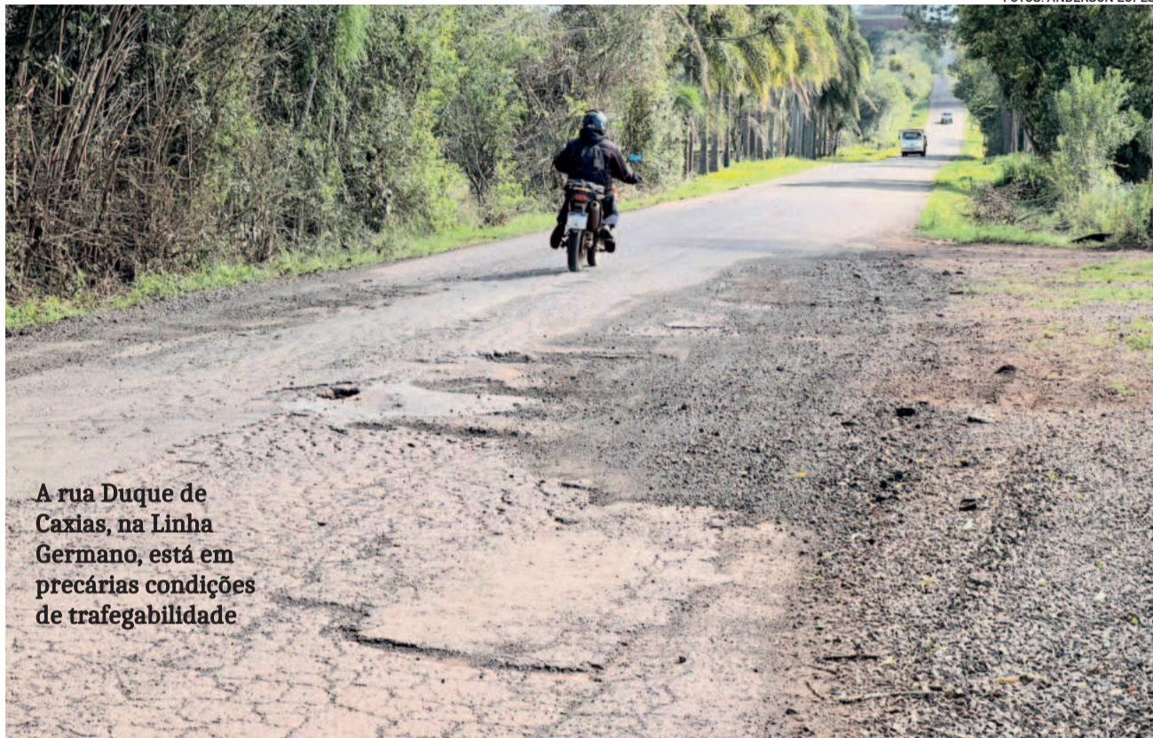
A rua Duque de Caxias, na Linha Germano, está em precárias condições de trafegabilidade