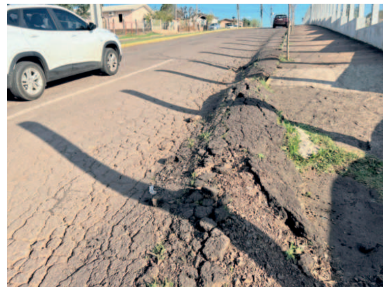
Trechos da Avenida 1 Leste e da Leopoldo Schneider serão recuperados, atendendo demanda antiga da população