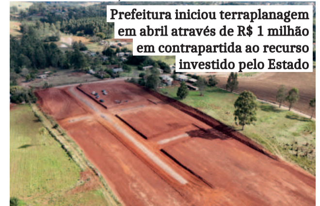
Prefeitura iniciou terraplanagem em abril através de R$ 1 milhão em contrapartida ao recurso investido pelo Estado