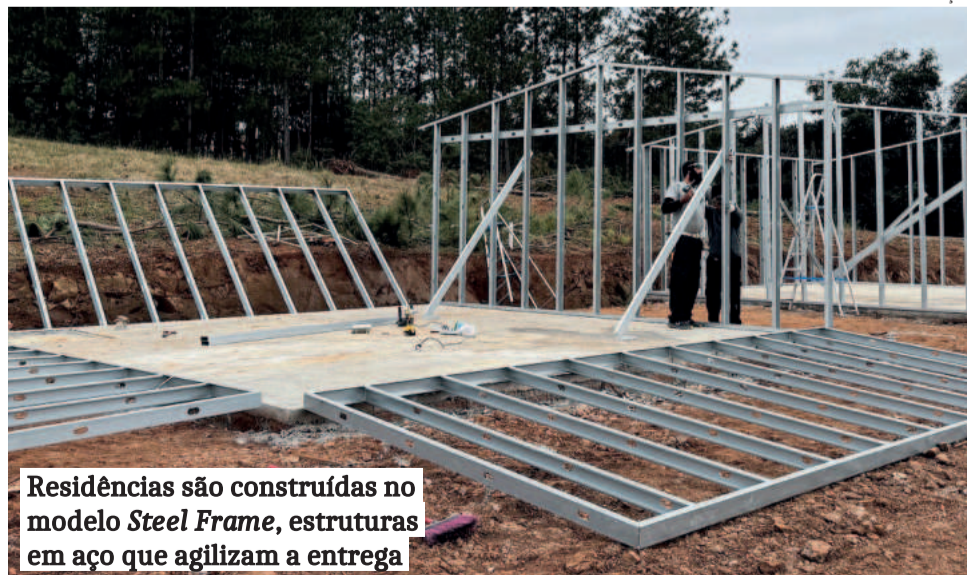
Residências são construídas no modelo Steel Frame , estruturas em aço que agilizam a entrega