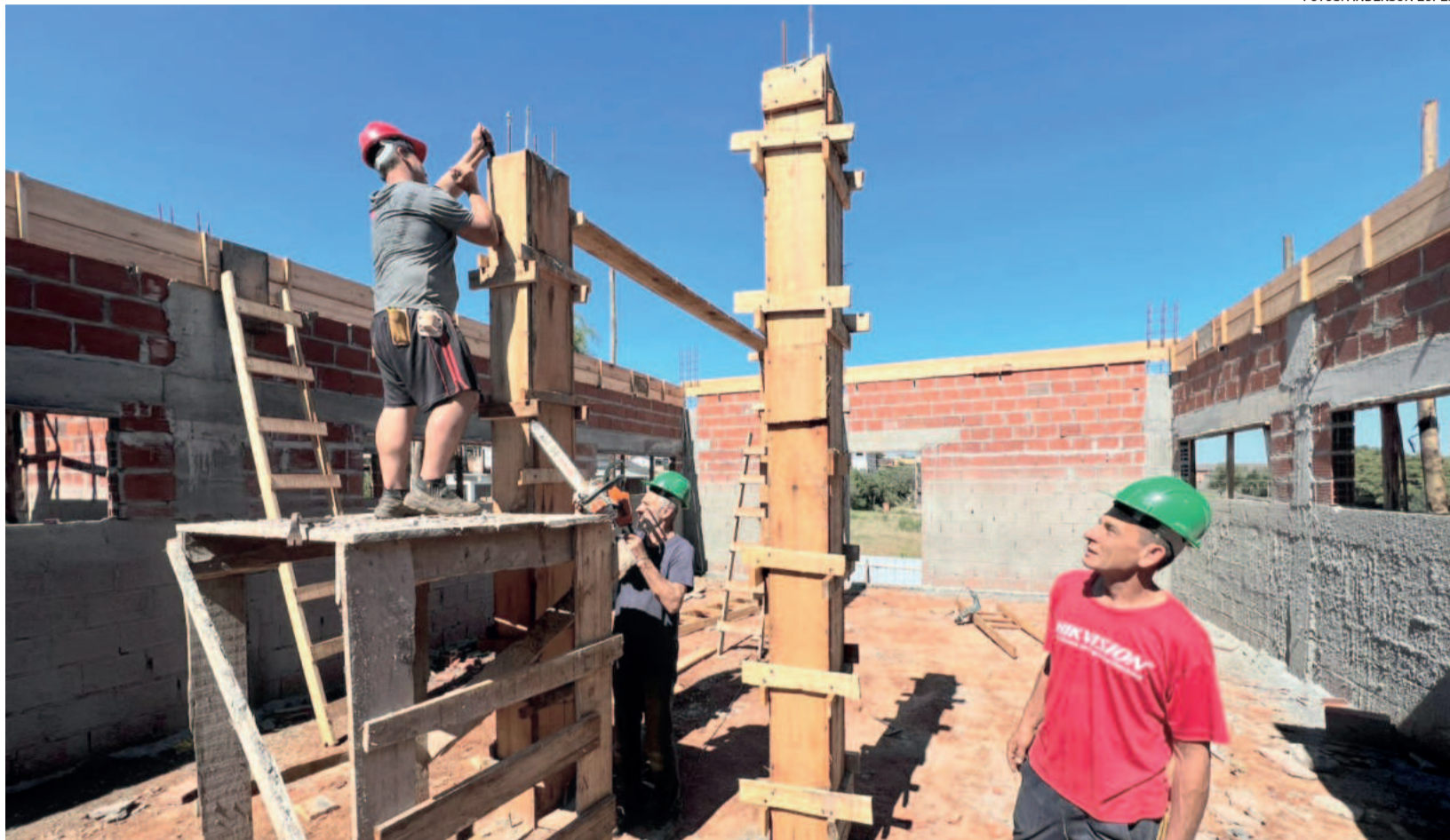
Obra está em plena execução e tem previsão de conclusão e entrega para o início de 2026