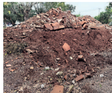
Escritório Central da Languiru não existe mais: local de grandes decisões