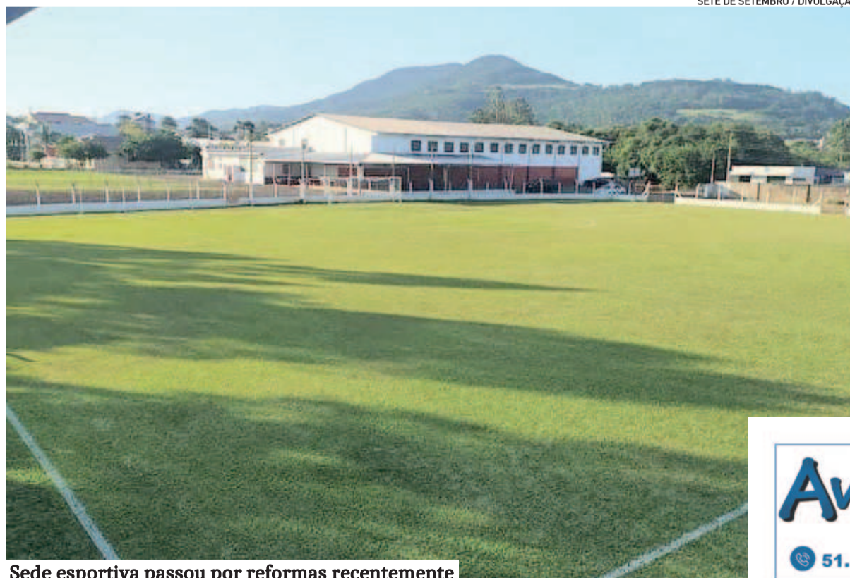
Sede esportiva passou por reformas recentemente