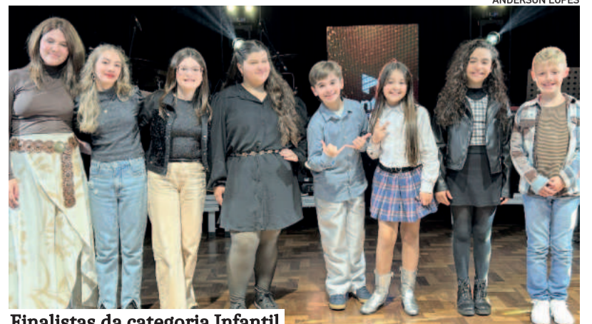
Finalistas da categoria Infantil