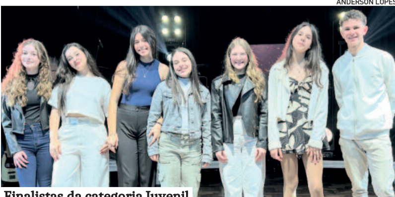
Finalistas da categoria Juvenil