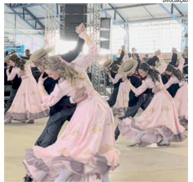
Dançarinos do CTG Rincão das Coxilhas conquistaram o 5º lugar no Bloco 9 do Juvenart

O festival reúne escolas, CTGs e famílias de todo o Estado e até de fora dele, como Paraná, Santa Catarina e Mato Grosso do Sul e conta com mais de 140 grupos inscritos, 45 chuleadores e 45 casais de danças de salão, movimentando cerca de 3,5 mil jovens.