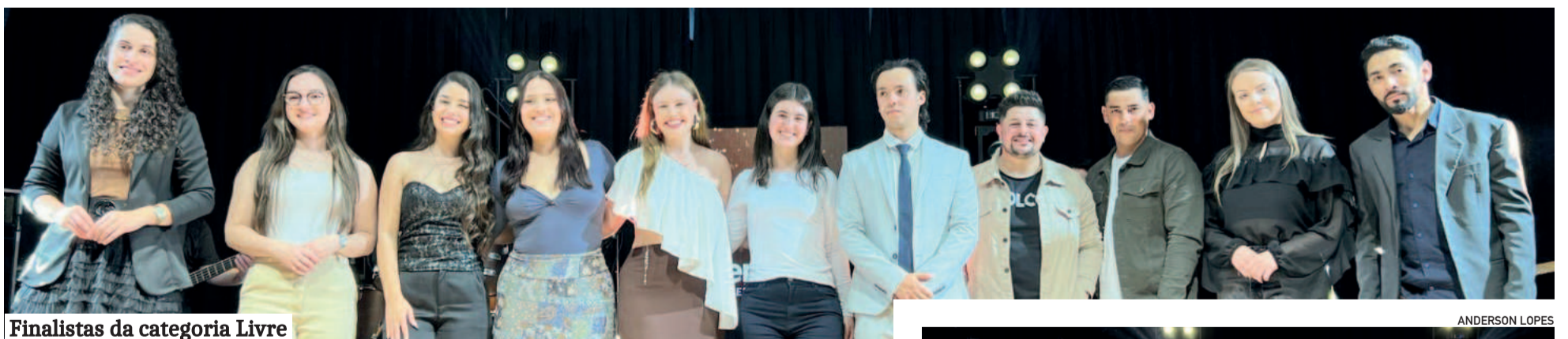
Finalistas da categoria Livre