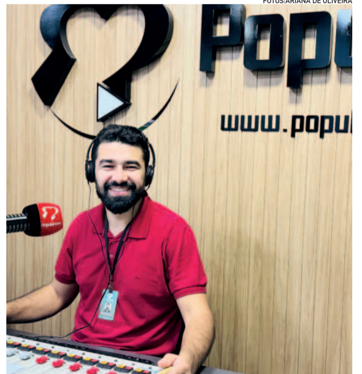
Kenller: A programação da rádio segue atualizada com muita informação e entretenimento