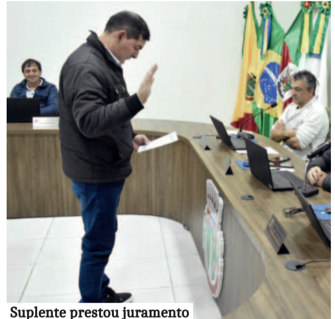
Suplente prestou juramento