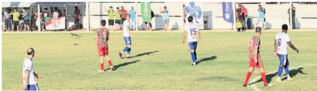
No ano passado, o Canabarrense foi semifinalista

Weiland vê o Regional como uma oportunidade promissora para o Canabarrense. “Nosso time será, acima de tudo, competitivo e vai suar muito para vencer. Tenho ótimas expectativas de fazer um grande campeonato e representar com orgulho o bairro e a cidade”, finaliza.