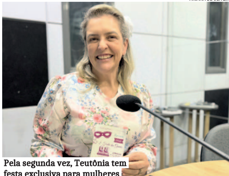
Pela segunda vez, Teutônia tem festa exclusiva para mulheres