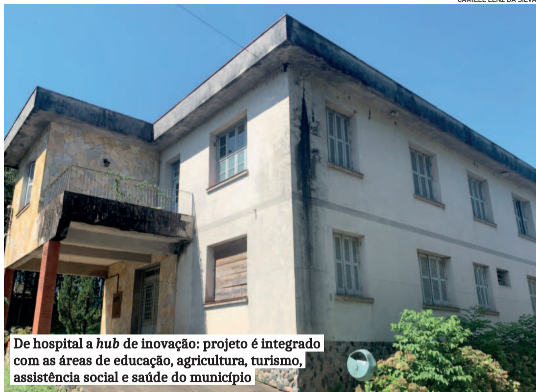
De hospital a hub de inovação: projeto é integrado com as áreas de educação, agricultura, turismo, assistência social e saúde do município

O secretário classifica a iniciativa como um “poderoso mecanismo endógeno de desenvolvimento”. “Um prédio histórico em que outrora nasciam nossos filhos e onde, agora, passarão a nascer nossas empresas”, reforça Forneck.