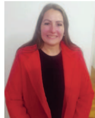
Para a vereadora, a gravidade do episódio exige punição exemplar

neficiente da Banda Rosa's será dia 25 de setembro, às 20h, no Teatro da Univates, em Lajeado. O ingresso será a doação de 1 quilo de ração para cães ou gatos, que será revertido em favor de quatro entidades que atuam na proteção animal na regi-