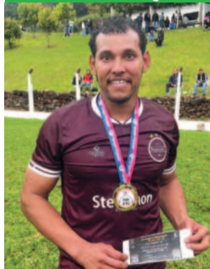
Urubu, do Boavistense