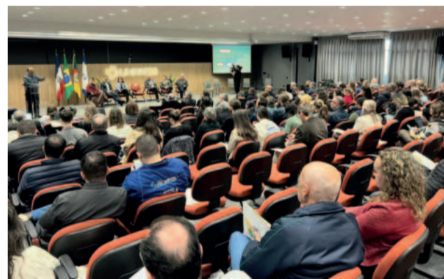
Quatro eixos foram tratados: transição ecológica, sustentabilidade na indústria, comércio, serviços, agropecuária e desigualdades regionais e sociais

Foi relatada a história de uma moradora de Cruzeiro do Sul, que ficou com a família 28 horas em cima de uma mesa dentro de casa, com medo de ser arrastada pela água ou de sofrer alguma descarga elétrica. O episódio ocorreu em uma área considerada alta, desmentindo a ideia de que apenas quem vive em locais mais baixos estaria vulnerável.