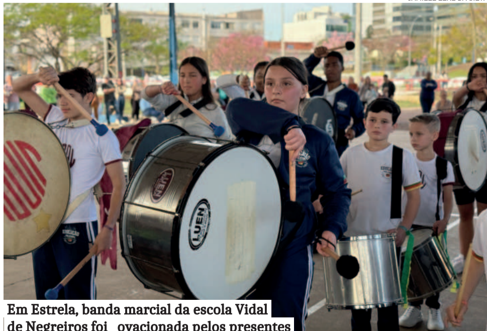
Em Estrela, banda marcial da escola Vidal de Negreiros foi ovacionada pelos presentes