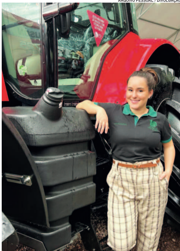
Jovem atua com os pais na propriedade, em São Jacó

Antes da atividade exclusiva com o leite, a família tinha estufas de tomate, mas o clima desfavorável dos anos anteriores inviabilizou a produção. “Estava muito frustrada pela questão do clima, situações que não conseguimos controlar. Mas nesse ano muitas portas se abriram, e me senti muito valorizada pelo esforço que estou colocando dentro da propriedade”, conta a jovem.