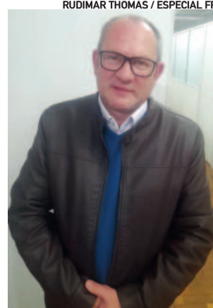
Vereador agradeceu aos parceiros que teve enquanto secretário

Explicou os motivos que o levaram a aceitar a missão no Executivo. “Entendi o momento que o município precisava, a prefeita precisava, concordei e aceitei o convite. Trabalhei até a semana passada lá na Cultura. Fiz o melhor que pude. Todos os