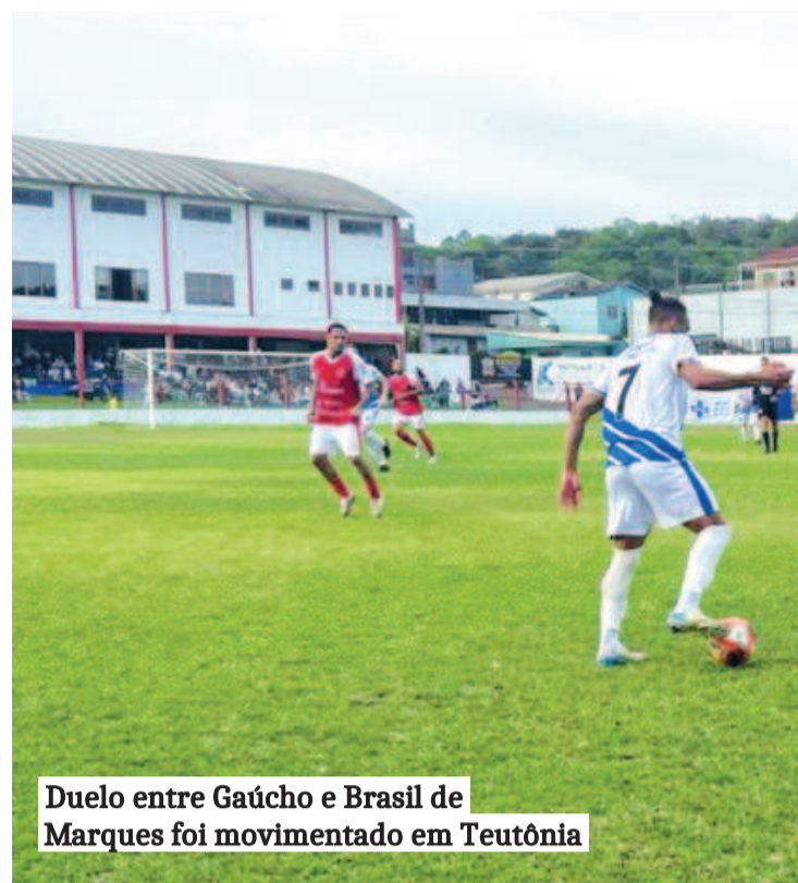
Duelo entre Gaúcho e Brasil de Marques foi movimentado em Teutônia